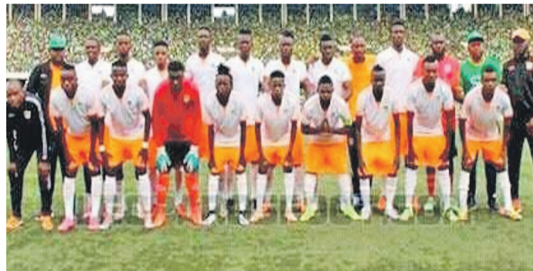
Le FC Renaissance du Congo (photo d'archives)

Le résultat d'égalité obtenu face à Muungano à Bukavu permet au FC Renaissance du Congo de totaliser quatre points au terme de deux matchs livrés au Play-Off de la Division 1.