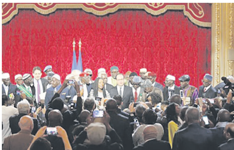
François Hollande au milieu de 28 tirailleurs sénégalais naturalisés le 15 avril 2017 à l'Élysée

François Hollande apporte un maillon supplémentaire à l'Histoire liant la France à l'Afrique