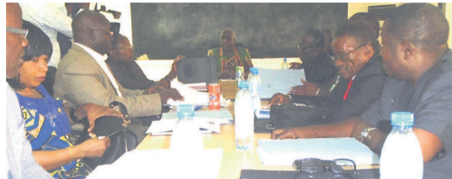
Les membres de la Fécofoot en pleine réunion

Le projet du budget de la Fédération congolaise de football (Fécofoot) exercice 2017, s'élevant à la somme d'1.280.500.000 francs Cfa, a été adopté le 15 avril au cours de la traditionnelle réunion du comité exécutif.