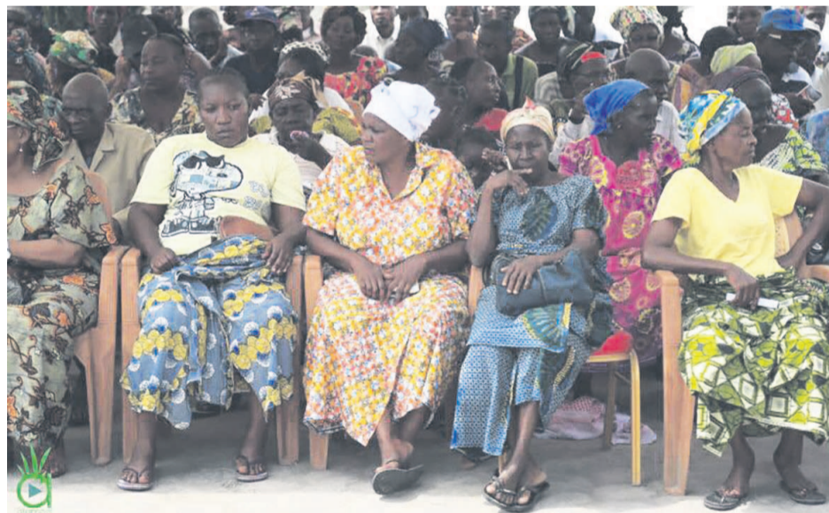
Les personnes du troisième âge du cinquième arrondissement Ouenzé attendant le dépistage