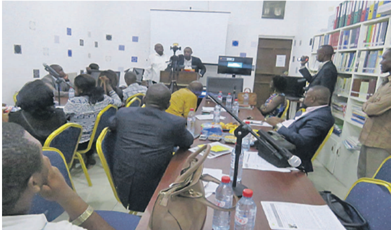
Vue des participants à la conférence «Adiac»