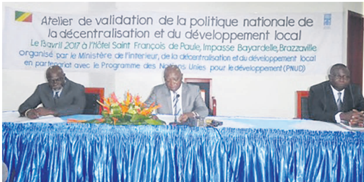
Le ministre Raymond Zéphirin Mboulou (au centre) ouvrant les travaux

Le gouvernement congolais, en collaboration avec le Programme des Nations unies pour le développement (Pnud) a organisé, le 13 avril à Brazzaville, un atelier spécial pour examiner et valider le document sur la politique nationale de décentralisation et de développement local, avant qu'il ne soit soumis au Conseil de ministres.