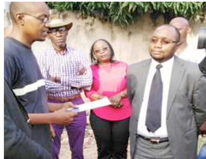
L'un des enfants Zikondolo détenant le certificat d'enregistrement remis par le ministre des Affaires foncières

des mains du ministre des Affaires Foncières le certificat d'enregistrement de leur parcelle. « Il a fallu une oreille attentive pour nous écouter. Et c'est vous grâce aux journées portes ouvertes. C'est pourquoi, nous remercions le chef de l'Etat qui vous a placé à la tête du ministère des Affaires