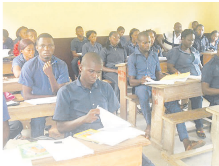
Les élèves en plein cours de phytopharmacie (adiac)

Ces cours concernent les élèves des séries R1 : production végétale et R3 : production et santé animales, candidats au baccalauréat au titre de l'année scolaire 2016-2017. Le déplacement de