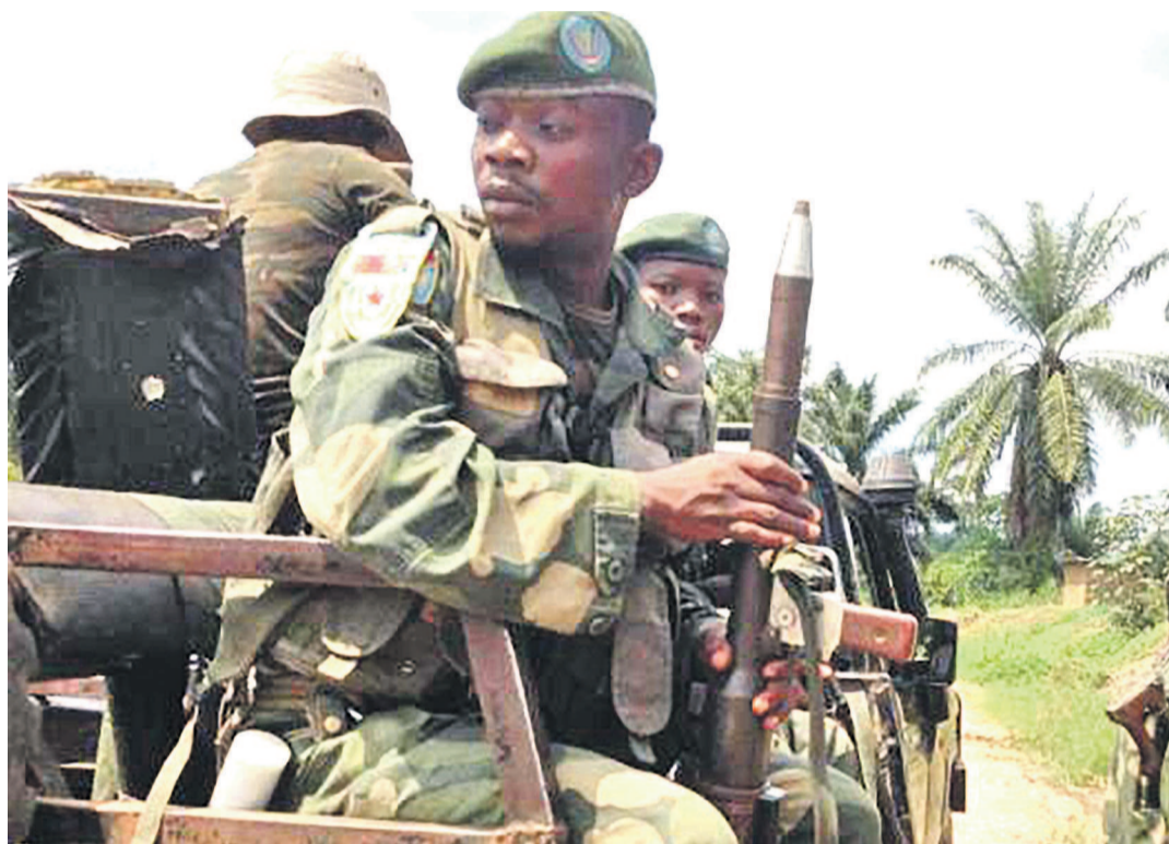
Des éléments des Fardc au front