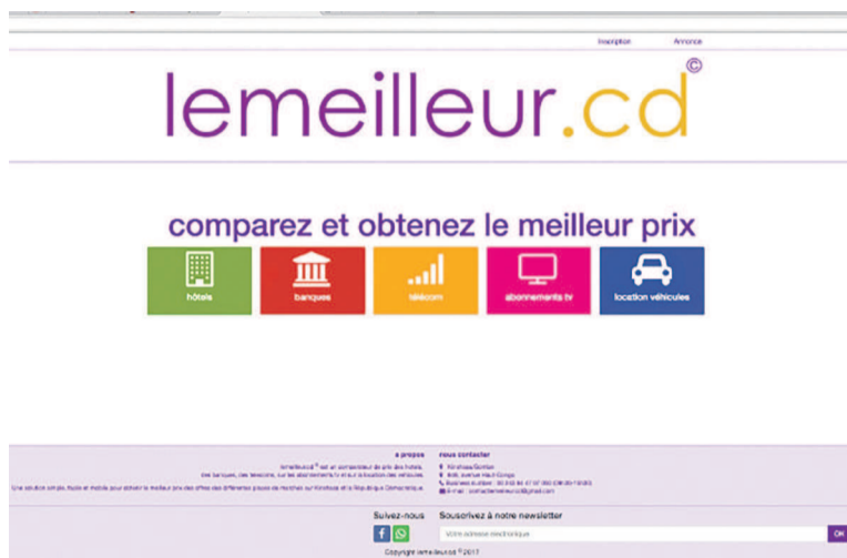
Capture d'écran du comparateur de prix lemeilleur.cd

TM : l'utilisation de lemeilleur.cd est gratuite et passe par la formulation d'une requête. Le consommateur/utilisateur de lemeilleur.cd formule sa demande en fonction de son budget. Concernant les hôtels, l'utilisateur doit déterminer le type de chambre ou celui de la suite et indiquer la catégorie (1 étoile, 2, 3,4 ou 5 étoiles) dans laquelle il souhaite avoir son hébergement. Ensuite, il adresse cette requête et obtient un résultat basé sur les prix des différents établissements hôteliers de la ville jusque-là. Pour l'abonnement tv, l'utilisateur a le choix entre les différents types d'offres (standard/basique, premium, gold et platinum) sur le marché pour obtenir le tarif qui convient à son budget. Il s'agit d'un service où la concurrence se veut rude et souvent au détriment des consommateurs, d'où l'importance d'un comparateur de prix pour permettre au consommateur d'opérer un choix judicieux. En ce qui concerne les télécommunications, l'utilisateur doit choisir l'opération qu'il veut réaliser : appel (intra réseau, interconnexion, international et roaming), sms,