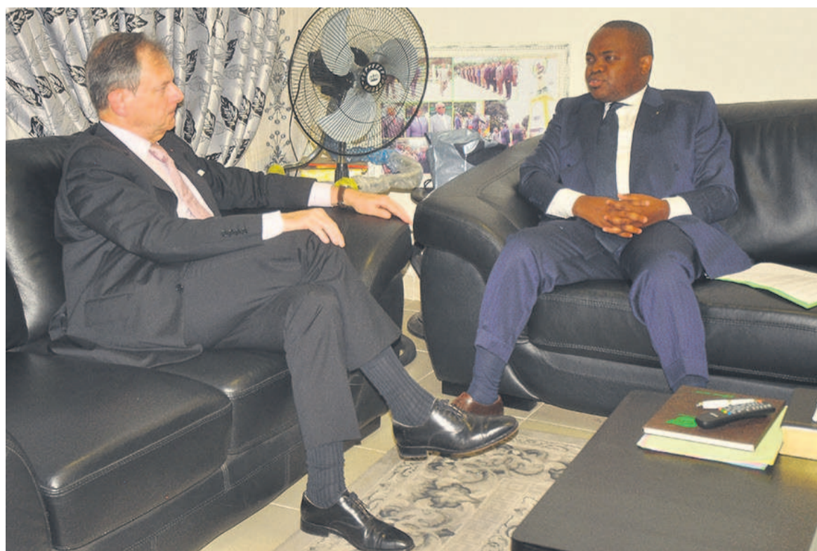
Le ministre de la Culture et des arts s'entretenant avec l'ambassadeur de France au Congo

« Il y a un patrimoine architectural de très bonne qualité ici à Brazzaville, dont la Case De Gaulle est un des plus beaux exemples, le