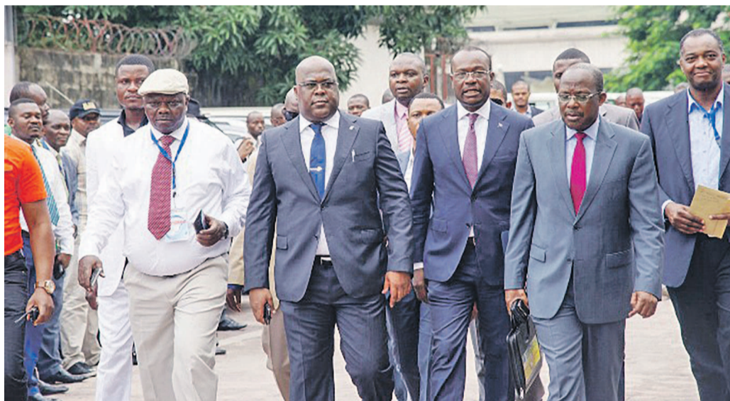
Quelques cadres du Rassemblement avec Félix Tshisekedi à l'avant-plan