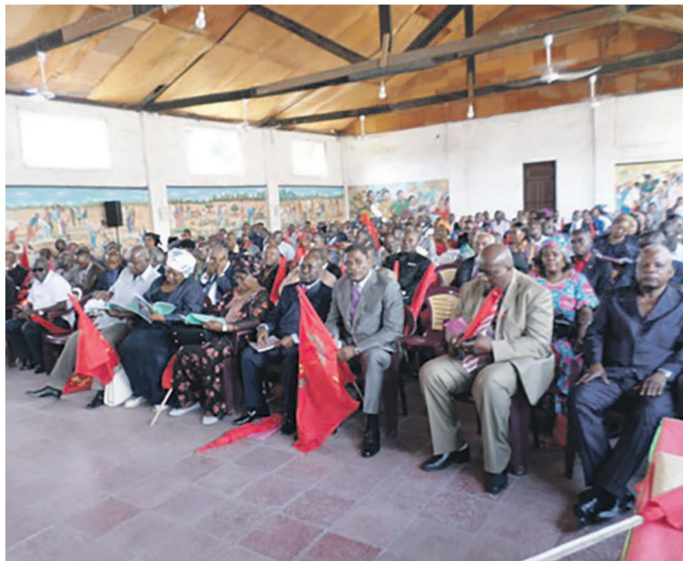
Les membres du conseil fédéral

Abordant le point sur les candidatures, le conseil fédéral est revenu sur les directives de