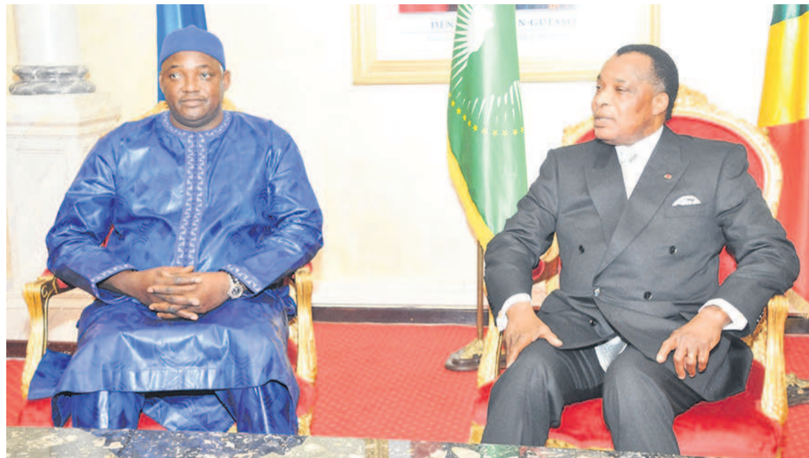
Adama Barrow et Denis Sassou N'Guesso

Adama Barrow a, quant à lui, édifié son homologue congolais sur