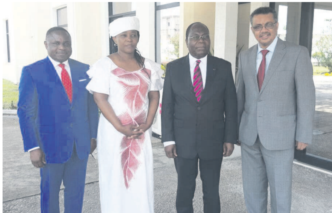
Tedros Adhanom Ghebreyesus reçu par le Premier ministre lors de son dernier passage à Brazzaville

Entre le Dr Tedros Adhanom Ghebreyesus, ex-ministre éthiopien de la Santé et chercheur renommé sur le paludisme, le Dr David Nabarro,