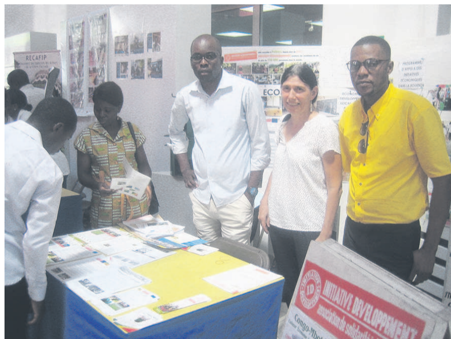
Les volontaires d'Ecodel exposant quelques résultats