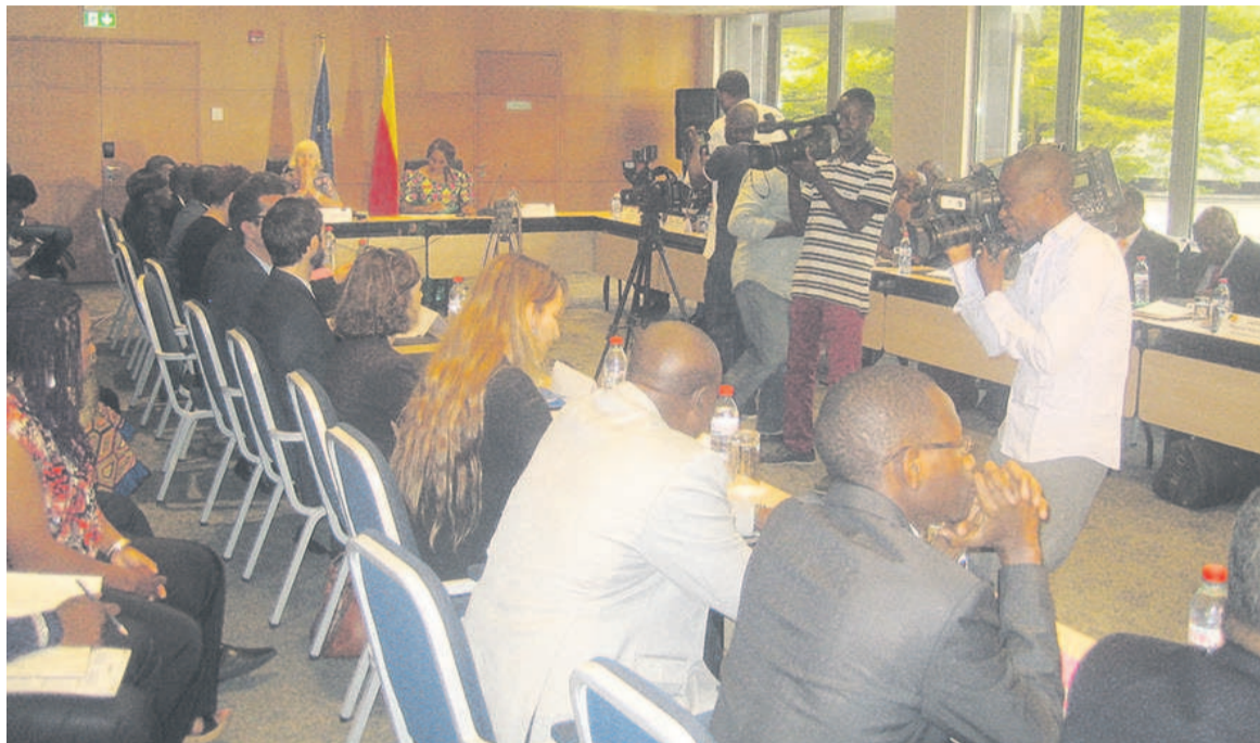
Les participants lors des travaux

En effet, le logiciel de vérification de la légalité du bois sera installé avant fin mai 2017, et hébergé au ministère des Finances. Le déploiement du logiciel SIVL va s'opérer de manière progressive, notamment par l'amélioration évolutive du système jusqu'à août 2017, la