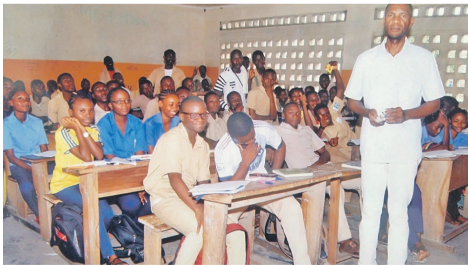
Les élèves en plein moralisation par le responsable de l'A.A.N.C

L'Association avenir de notre communauté (AANC) a lancé cet appel la semaine dernière lors d'une série de descentes effectuées dans plusieurs établissements scolaires de la ville océane.