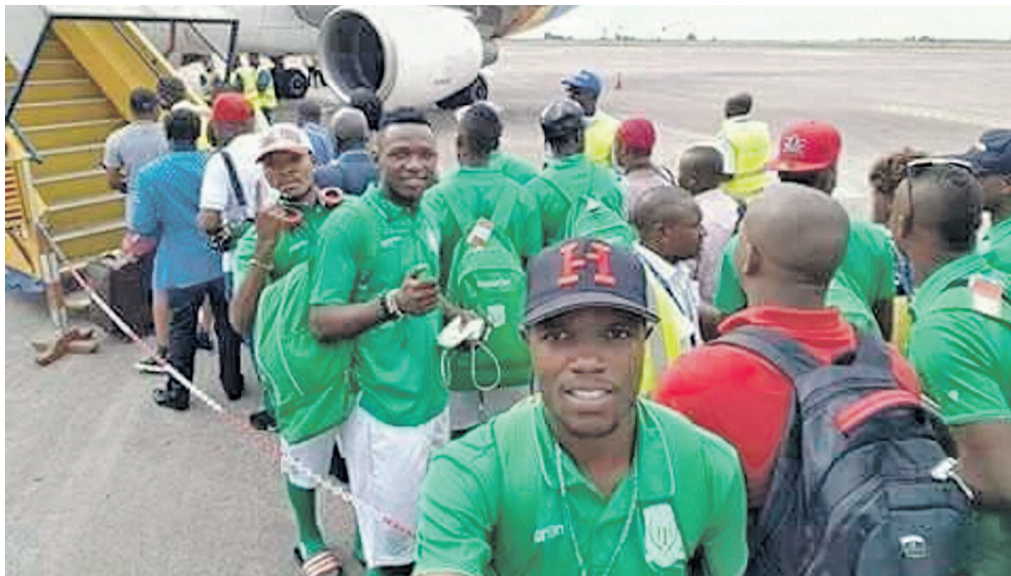
La délégation de DCMP prend son avion pour Lubumbashi

Les Immaculés caressent de plus en plus le rêve de remporter le titre après cette première partie du Play-Off plus que satisfaisante. Mais il y a encore la manche retour avec des matchs importants à livrer en déplacement contre Sanga Balende à Mbuji-Mayi, Muungano à Bukavu. Il y a aussi la rencontre retour contre V.Club et face à Renaissance du Congo à Kinshasa, sans omettre un autre choc toujours au stade des Martyrs à Kinshasa contre le TP Mazembe de Lubumbashi. Le chemin est