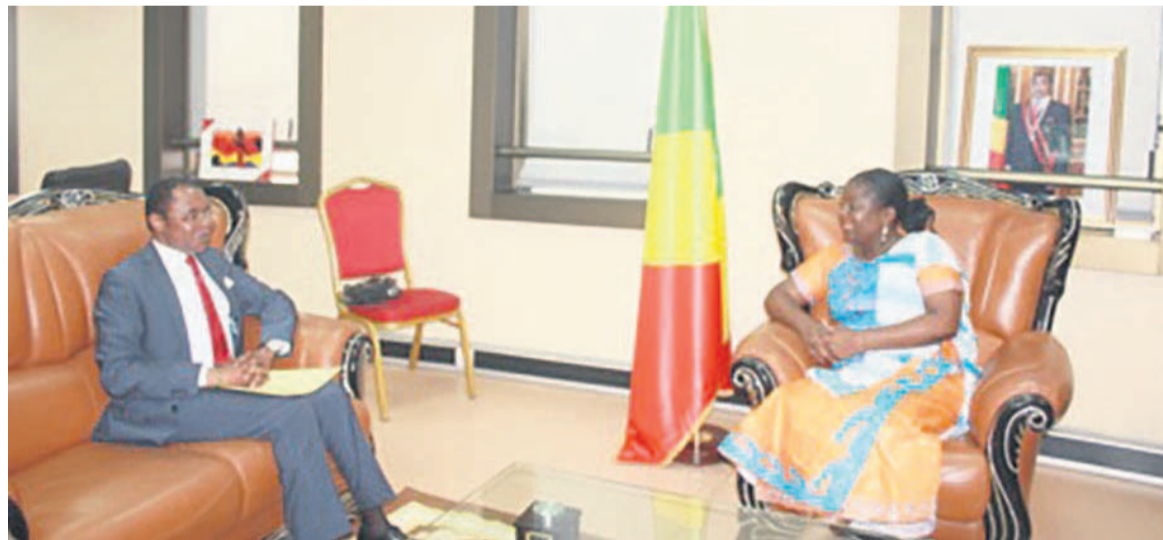
La ministre s'entretenant avec le DG de l'administration pénitentiaire

tableau qui pourra permettre à ses techniciens d'apporter tant soit peu les solutions à ces problèmes. Lesquels : nous avons une population prisonnière à moitié jeune, ou en majorité juvénile parce que les différents cas de violation des lois qui se présentent dans nos maisons d'arrêt sont souvent perpétrés par nos jeunes.