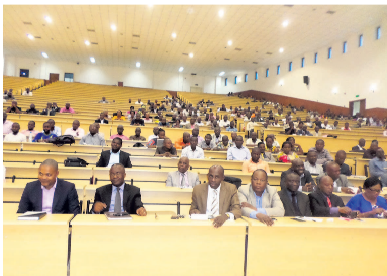
Les membres du jury (Adiac)