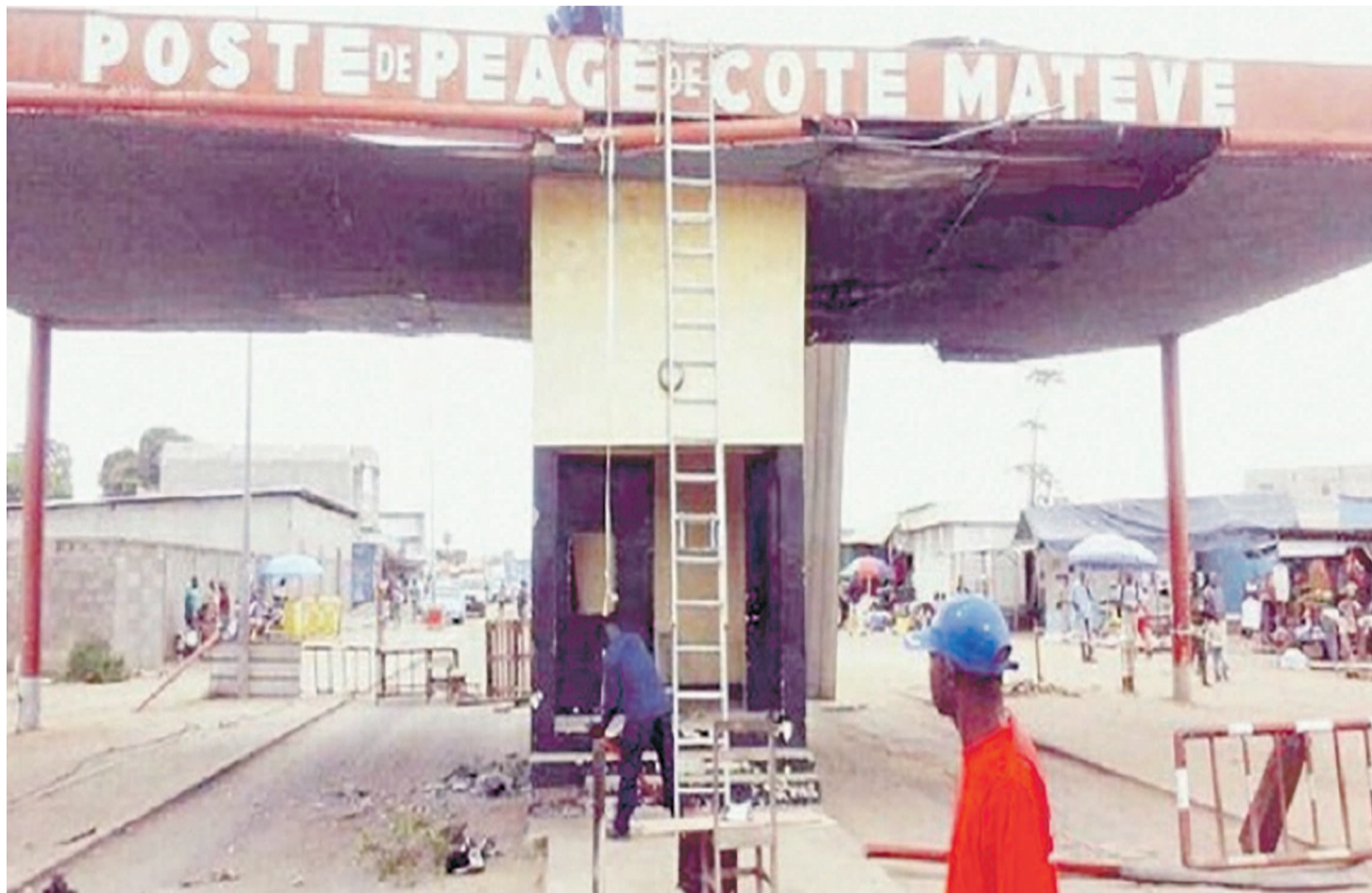
Démantèlement du poste de péage de Côte Matève

Situé sur la route nationale n°4, dans le sixième arrondissement Ngoyo, le poste de péage de Côte Matève a été supprimé et démantelé il y a quelques jours par les autorités de la ville de Pointe-Noire à la satisfaction générale des populations. Celui-ci sera désormais érigé plus loin, après le site du Nganda Maboké, dans le district de Tchiamba-Nzassi.