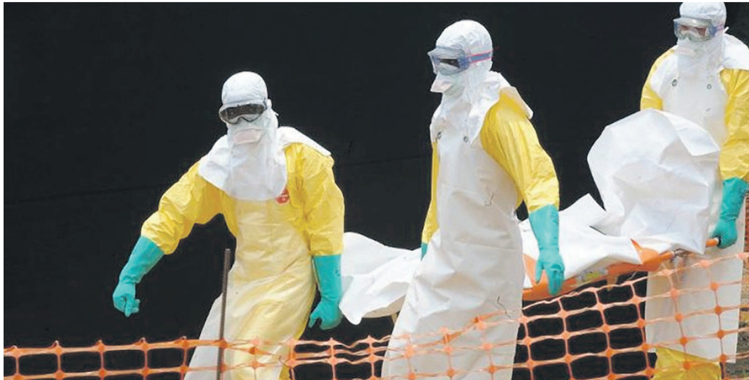
La prise en charge d'un malade d'Ebola

« Nous plaçons cette première visite de terrain sous le signe de la solidarité et de la compassion avec les populations affectées de Likati par ce huitième épisode de la maladie à virus Ebola en RDC. Nous appelons à plus de solidarité la commu-