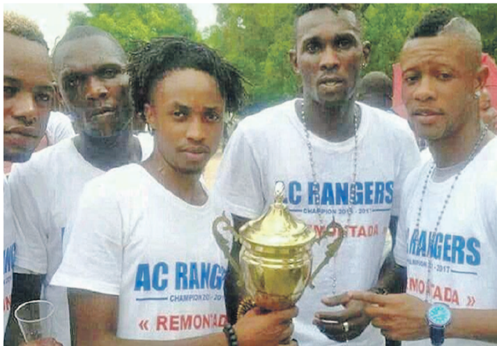
AC Rangers champion de l'Eptkin et qualifié pour la phase finale de la Coupe du Congo

Le groupe B est très serré avec trois clubs de