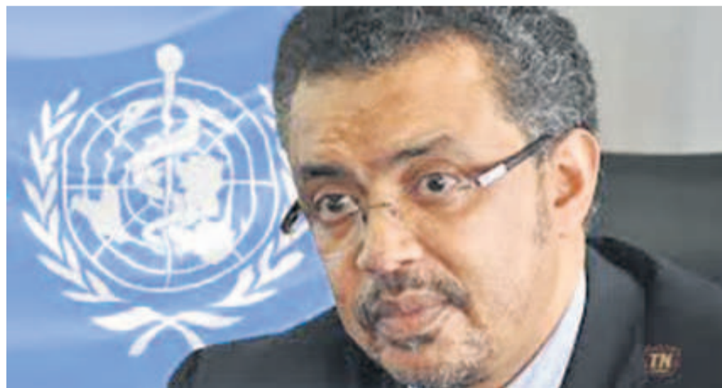
Tedros Adhanom Ghebreyesus