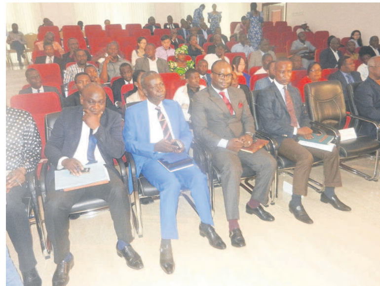
Une vue des opérateurs économiques (Adiac)

Selon lui, certains opérateurs économiques jugeaient difficile l'accès à la commande publique, alors que le code des marchés publics oblige aux maîtres d'ouvrages de fournir les informations nécessaires aux