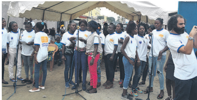
Les participants

A l'occasion de la célébration de ses 10 ans d'actions au Congo, l'ONG internationale ASI a octroyé le 15 juin des diplômes d'honneur aux agents qui assurent la sécurité et l'action sociale au sein de cette organisation.