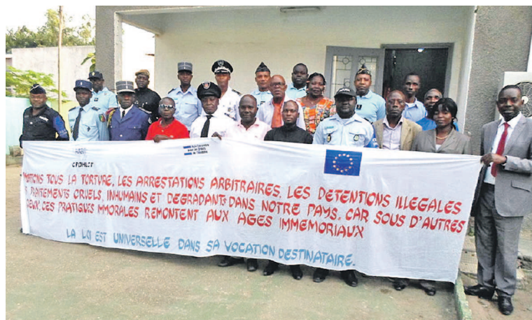
La photo de famille à la fin de l'atelier sur la torture la détention

Après débats et échanges suivis des travaux en groupes, les participants ont formulé des réflexions en vue de la mise en