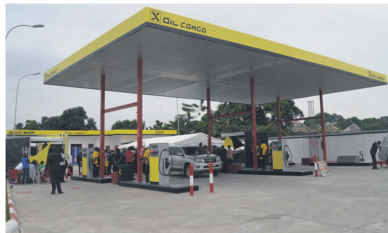
La nouvelle station X-Oil