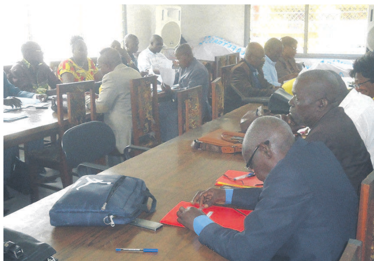
Les participants aux travaux

La Mutuelle générale de la Fetrasseic (Mugef) a adopté le 13 juin, son budget exercice 2017 en recettes et en dépenses qui s'élève à 1,3 milliard francs CFA, à l'issue des travaux de la 29e session inaugurale du conseil d'administration de la huitième assemblée générale nationale présidé par Abraham Angossina, président de cette mutuelle.