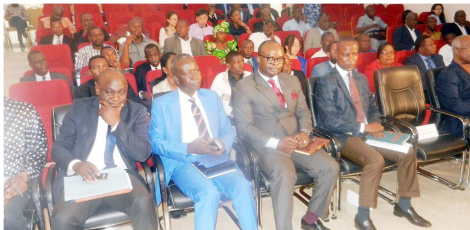
Une vue des opérateurs économiques

L'Autorité de régulation des marchés publics (ARMP) et la chambre de commerce et d'industrie de Brazzaville ont lancé hier, à l'endroit des opérateurs économiques nationaux, une formation pour les aider à mieux structurer leurs projets.