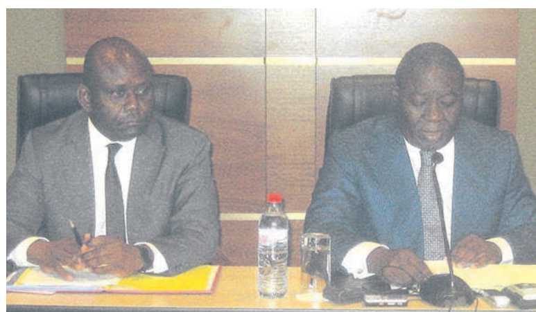
Le ministre d'Etat Gilbert Ondongo (à droite)

gramme Sangha- Likouala. L'objectif de la rencontre est essentiellement de présenter aux délégués des ministères concernés (l'économie forestière, mines et hydrauliques, agriculture et pêche, etc.) le niveau de réalisation du programme de réduction des émissions et les contraintes liées au processus d'appropriation du programme. « Notre pays tirera les avantages des produits du carbone et des autres paiements des services environnements