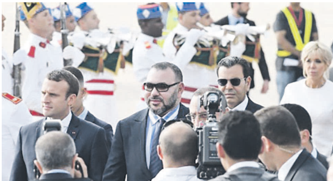
Emmanuel Macron et Mohamed VI à la descente de l'avion du président français

Pour éviter des susceptibilités diplomatiques, la prochaine visite d'Emmanuel Macron au Maghreb sera en Algérie. Là où vient de séjourner (12 juin 2017) son ministre des Affaires étrangères Jean-Yves Le Drian. Ce qui tend à maintenir l'équilibre géopolitique dans les relations de la France avec ces deux pays.