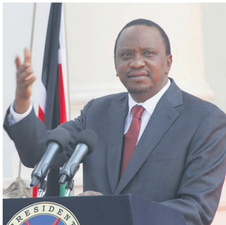
Uhuru Kenyatta, président du Kenya

Dans une adresse à la Nation juste après l'annonce de sa victoire par la commission électorale, Uhuru Kenyatta a tendu la main à son principal rival et appelé à la paix. «