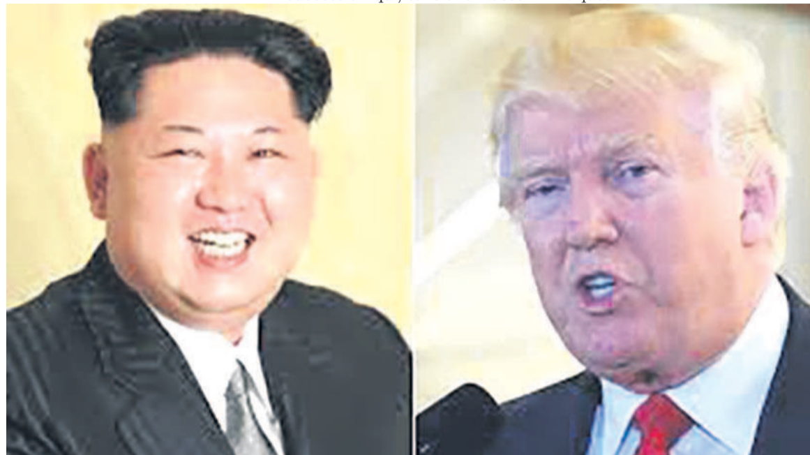
Kim Jong-un

Depuis huit mois qu'il habite la Maison Blanche, Trump est toujours sur le feu des projecteurs de l'actualité, à peu près comme lors de la campagne électorale, quand ses faits et gestes étaient scrutés avec attention par les médias et ses adversaires. L'homme faisait le buzz pourrait-on dire, tant ses déclarations et ses prises de positions suscitaient à la fois l'admiration de ses partisans, que le doute de ses objecteurs. Et les observateurs de la scène américaine, les spécialistes des rela-