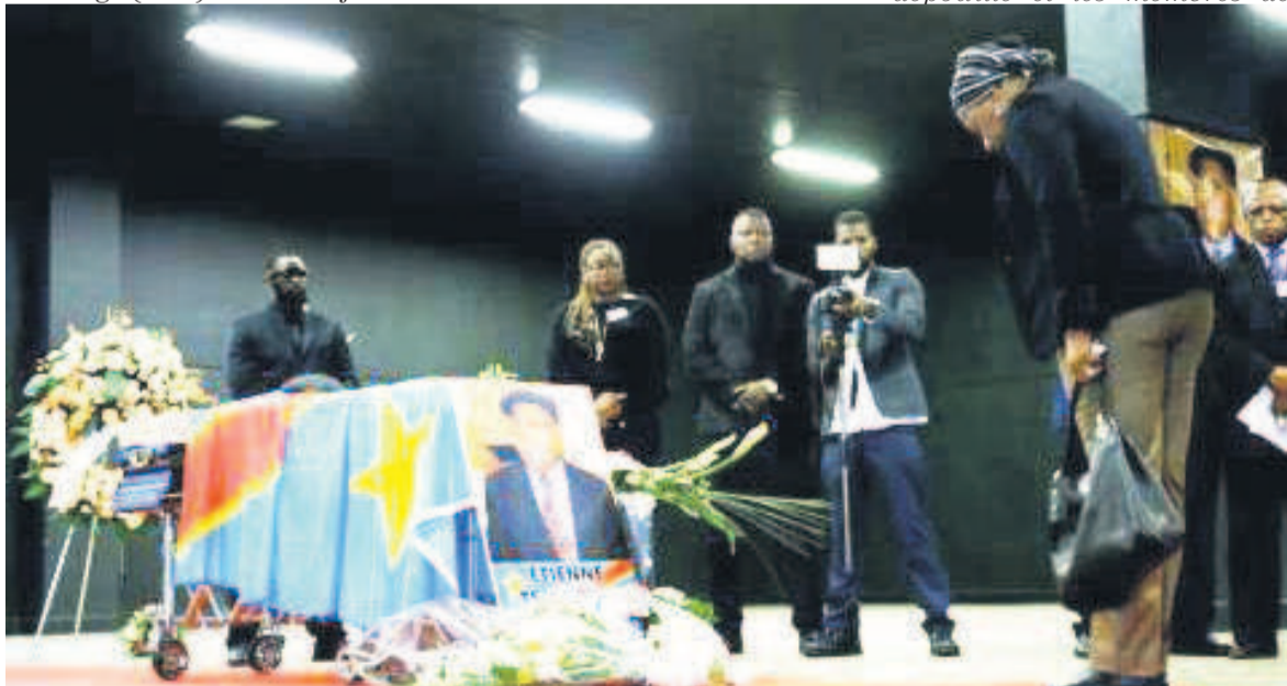
Des sympathisants du parti d'Étienne Tshisekedi réunis à Bruxelles pour un dernier hommage

précise le document. Il sera inhumé à N'sele (80 km de Kinshasa). La famille souhaitait initialement enterrer M. Tshisekedi au siège de l'UDPS, et le pouvoir dans un cimetière du centre de la capitale. « L'État congolais prendra en charge tous les frais relatifs à l'organisation des obsèques », note le communiqué conjoint. « Un avion spécial sera dépêché à Bruxelles pour ramener à Kinshasa la dépouille et les membres de