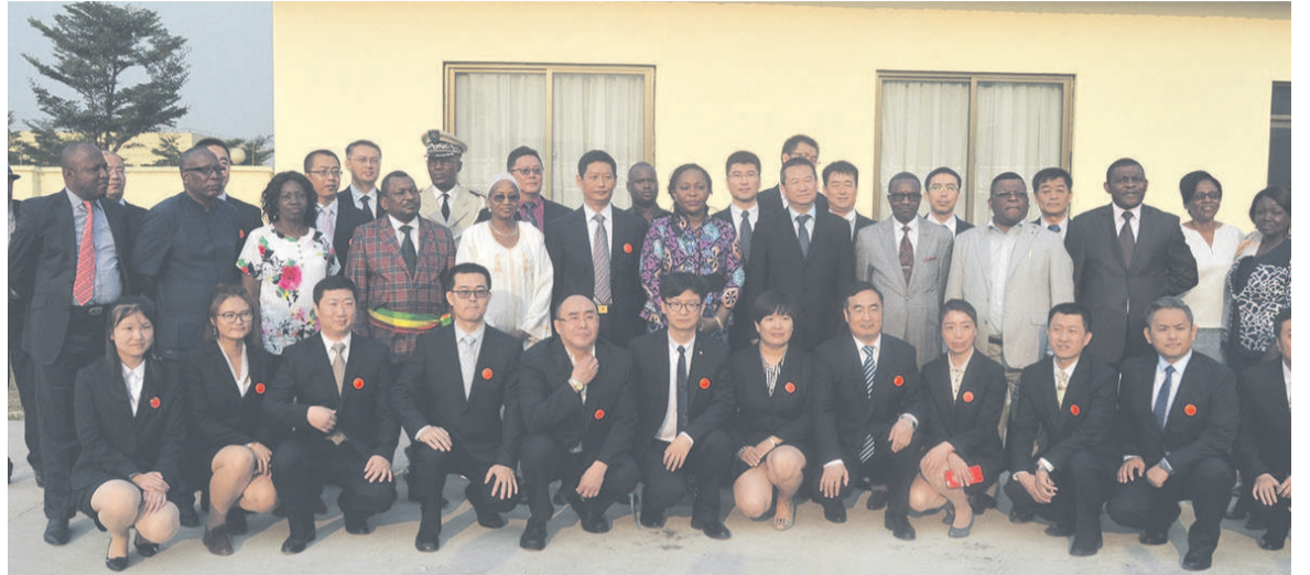
La ministre de la Santé et les médecins chinois

Composée de 23 médecins dont les chirurgiens, dentistes, urgentistes, radiologues et pédiatres, la 24 e mission médicale chinoise travaillera aux côtés des spécialistes congolais dans le but d'offrir des soins de santé de qualité aux populations tout en effectuant le transfert de compétence.