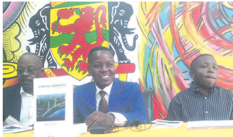
Le présidium (Adiac)

A quelques jours de la célébration du 57 e anniversaire de l'indépendance nationale, le marché du livre s'est enrichi d'un recueil de poèmes: Le pont de l'indépendance, dont la séance de dédicace a eu lieu le vendredi dernier dans la salle de conférences du ministère de la Culture et des arts, en présence de plusieurs écrivains.