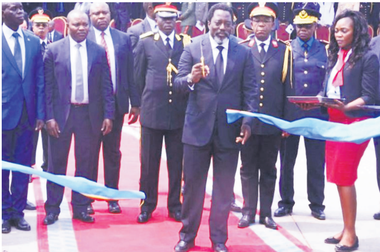
Le chef de l'État procédant à la coupe du ruban symbolique au moment de l'inauguration