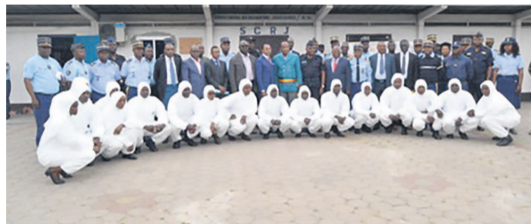
Les officiels posant avec les participants à l'exercice

La structure qui a organisé le 9 août dernier un exercice de police judiciaire sur la gestion de la scène de crime et autres actes de l'enquête judiciaire est installée dans l'enceinte du commandement de la gendarmerie nationale à Brazzaville.