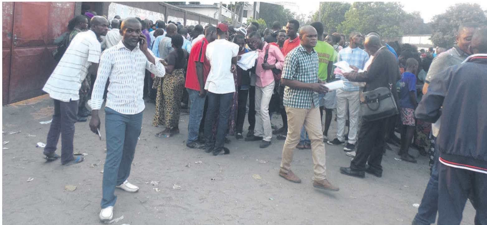
Élèves et parents lors de la publication des listes à la DEC.

Sur 110 369 candidats présentés au Brevet d'études du premier cycle (BEPC) cette année, 61 305 ont été déclarés admis à l'issue de la délibéra-