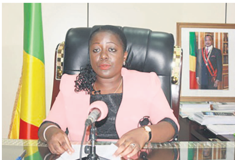
La ministre de la jeunesse et de l'éducation civique, lors de son allocution

Selon la ministre, sur le plan de l'éducation et du développement des compétences, outre le programme des cantines scolaires, plusieurs réformes ont été apportées dans l'enseignement supérieur notamment : l'amélioration des conditions d'apprentissage à l'Université Marien-Ngouabi, la construction d'une nouvelle université dénommée Denis Sassou