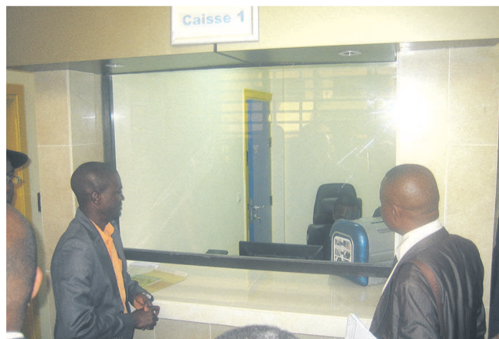
Un opérateur économique se rendant à la caisse (Adiac)

Un nouveau guichet unique de dédouanement (GUD) a été ouvert le 14 août à Dolisie, dans le département du Niari. Il devrait permettre de simplifier les formalités de dédouanement et sécuriser les recettes de l'Etat dans les départements de la Bouenza, la Lékoumou, du Pool et du Niari. Le lancement de ce GUD qui s'ajoute à ceux de Ouesso, Brazzaville et Pointe-Noire accompagne