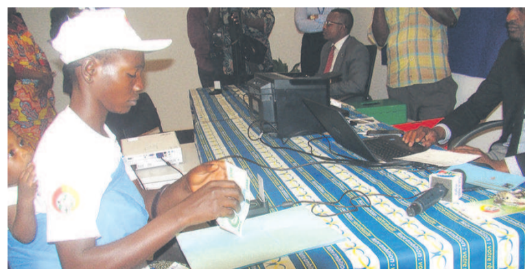
Une bénéficiaire touchant son allocation à la banque postale de Brazzaville

« Les allocations versées concernent trois trimestres de l'année 2015. Le projet Lisungi est donc, de ce fait, à la croisée des chemins », déclarait le ministre des Affaires sociales, de l'action humanitaire et de la solidarité, Antoinette Dinga Dzondo, justifiant des contre-performances par le contexte économique et financière