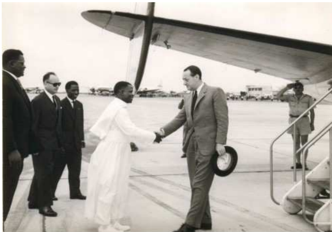
Arrivée à l'aéroport de la délégation française

Et le président Fulbert Youlou, sous un tonnerre d'applaudissements, de lancer à la foule