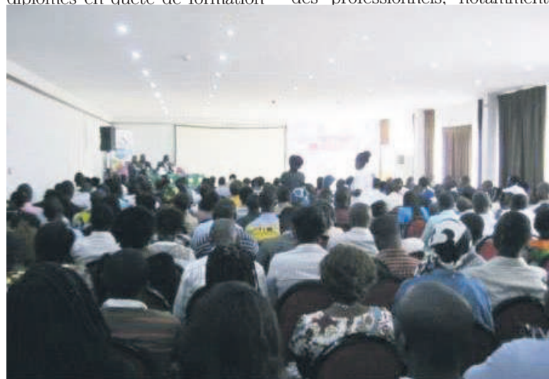
Les participants au forum « Optimise ta carrière »

et d'orientation se retrouvent face à des choix qui doivent déterminer la bonne ou la mauvaise gestion de leur carrière. Un choix pas facile à faire qui les amène à se poser des tas de questions, notamment Quelle formation suivre par rapport aux compétences ac-