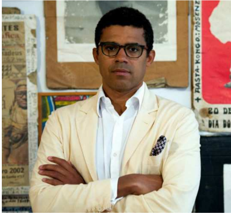
L'homme d'affaires et mécène congolais Sindika Dokolo cains riches, devons nous excuser ou nous justifier». Et d'ajouter: «Je préfère que la richesse du continent revienne à un Noir corrompu plutôt qu'à un Blanc néo-colonialiste».

d'échec, à l'époque des noces d'or de son père avec le camp soviétique, Isabel dos Santos est la femme la plus riche d'Afrique avec plus de trois milliards de dollars, d'après le magazine Forbes.