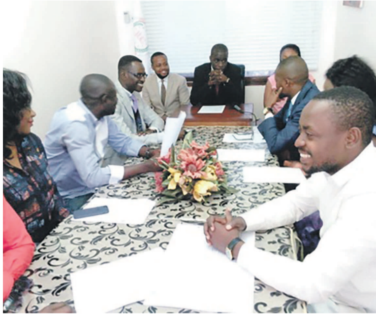
Les participants

De plus, l'organisation juvénile rappelle aux jeunes que le Congo n'est pas le seul pays qui traverse