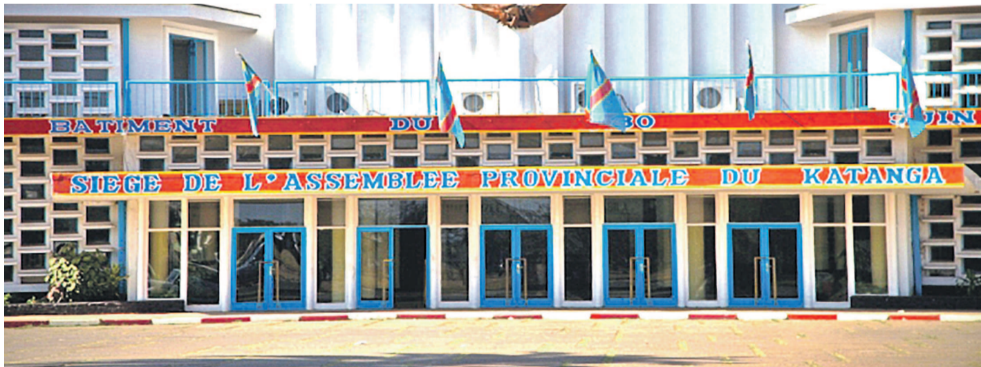
La façade de l'Assemblée provinciale du Haut-Katanga