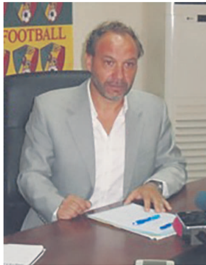
Sébastien Migné

Sébastien Migné a mis les ciseaux sur la liste des Diables rouges convoqués pour la double confrontation contre le Ghana du 1 er et 5 septembre dans le cadre de la 3 e et 4 e journée des éliminatoires de la Coupe du monde Russie 2018.