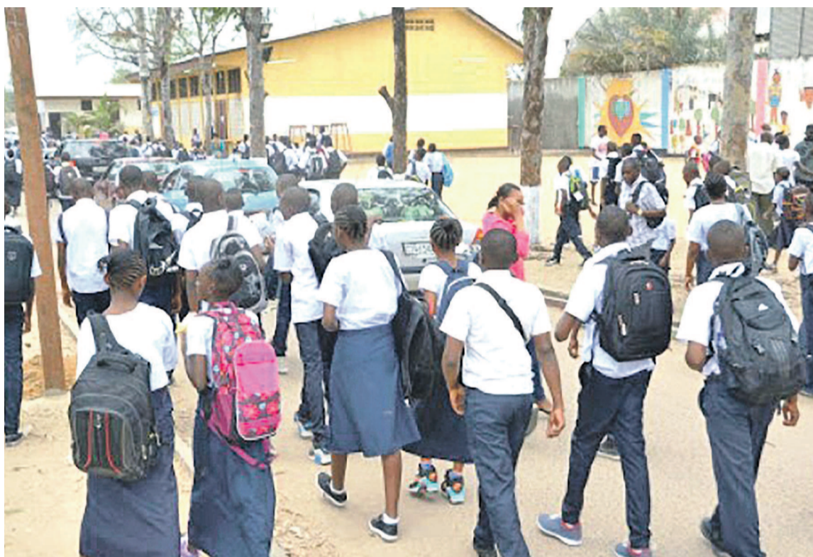
Des élèves dans une rue à Kinshasa