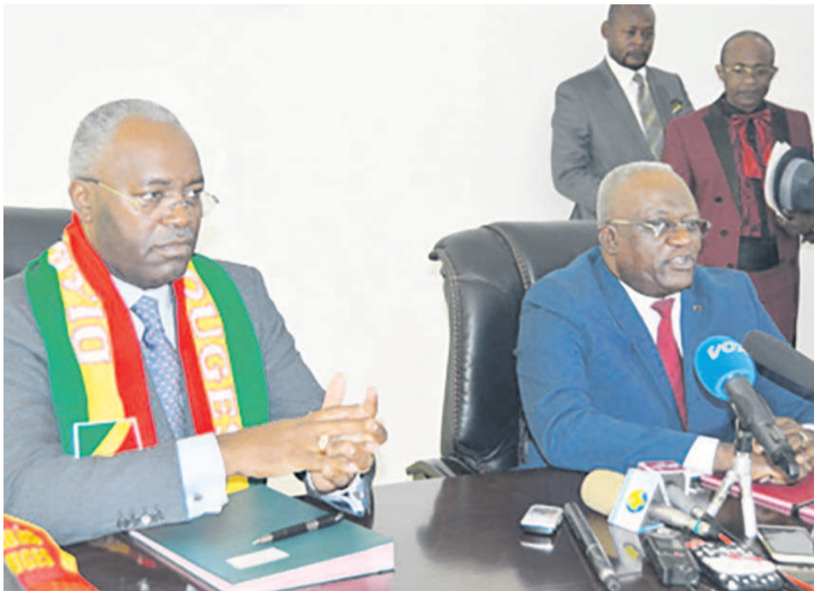
Les ministres entrant et sortant lors de la passation de consignes