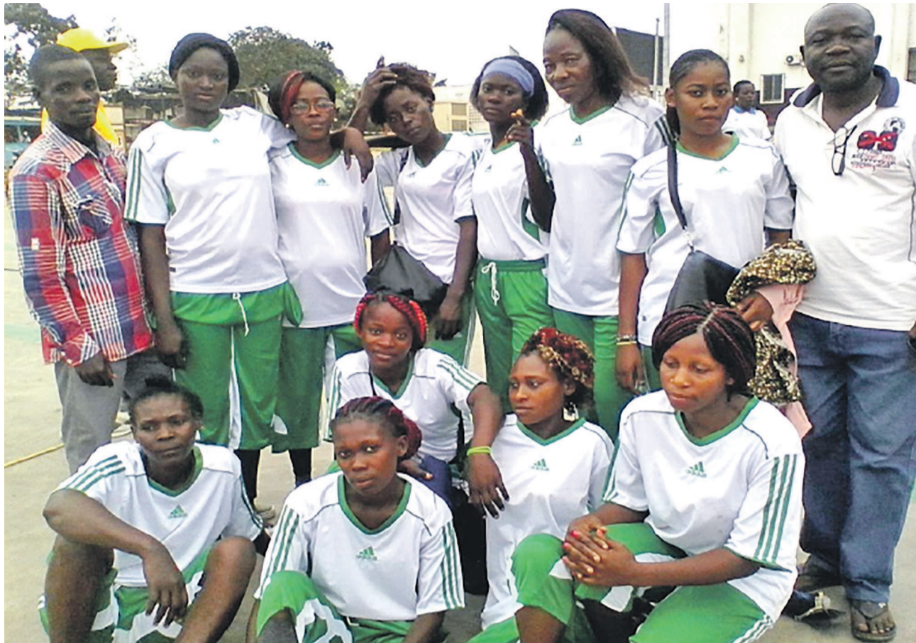
Aloes de Fouta