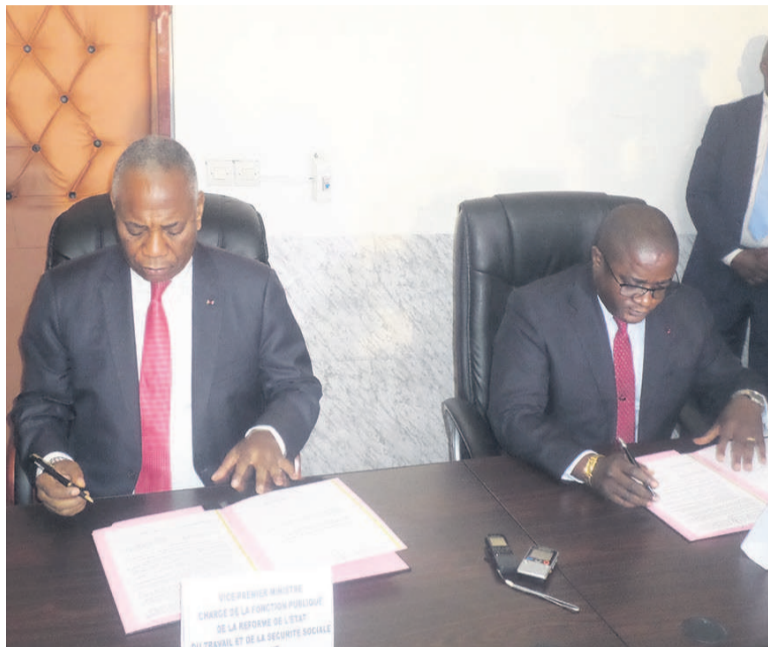
Firmin Ayessa et Ange Aimé Bininga

La cérémonie de passation de consignes entre le vice-Premier ministre en charge de la Fonction publique et de la réforme de l'Etat, Firmin Ayessa, et son prédécesseur, Ange Aimé Bininga, s'est déroulée le 29 août en présence du secrétaire général du gouvernement, Benjamin Boumakani.