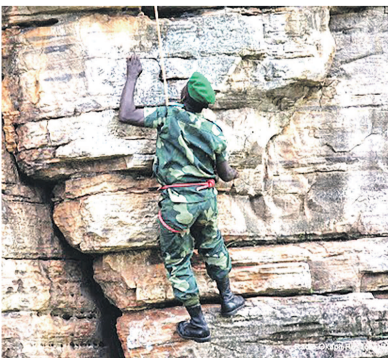
Démonstration militaire sur des rochers à Kotakoli par un élément des Fardc

Les jeunes militaires déjà déployés au centre et à l'Est seront dorénavant réorganisés en vue de renforcer les militaires qui ont fait plusieurs années dans ces parties du pays et ce pour « plus d'efficacité face à toute éventualité ». C'est ce qui ressort de la réunion du Haut commandement militaire que le chef de l'État, Joseph Kabila, a présidé le lundi 28 août. Sur la même lancée, il a été décidé la réhabilitation des bases militaires de Kitona et de Kamina. À cet effet, le génie militaire sera déployé dans un premier temps pour faire l'évaluation de la situation avant de commencer les travaux de leur réhabilitation. Sur le plan social, il a été convenu d'améliorer la répartition des fonds de ménage des militaires.