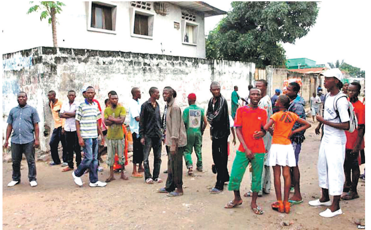
Des Congolais toujours inquiets par rapport à leur avenir immédiat