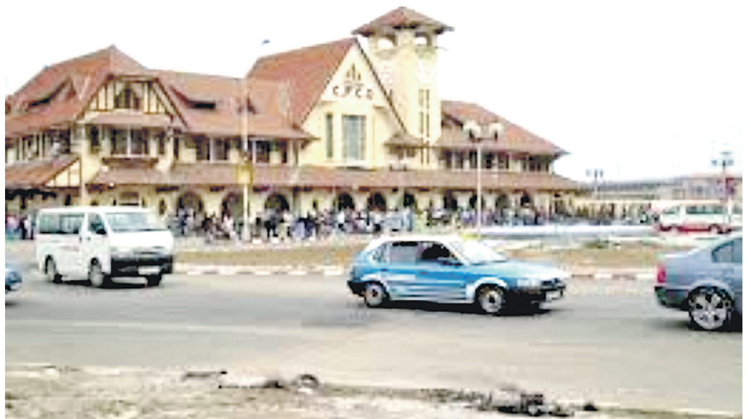
Une vue du réseau routier de la ville de Pointe-Noire

Dans le même ordre d'idées, l'orateur a promis améliorer et renforcer les feux de signalisation dans la plupart des carrefours. Le nouveau maire va également s'appuyer pendant les cinq prochaines années sur un programme d'investissement routier cohérent qui met l'accent