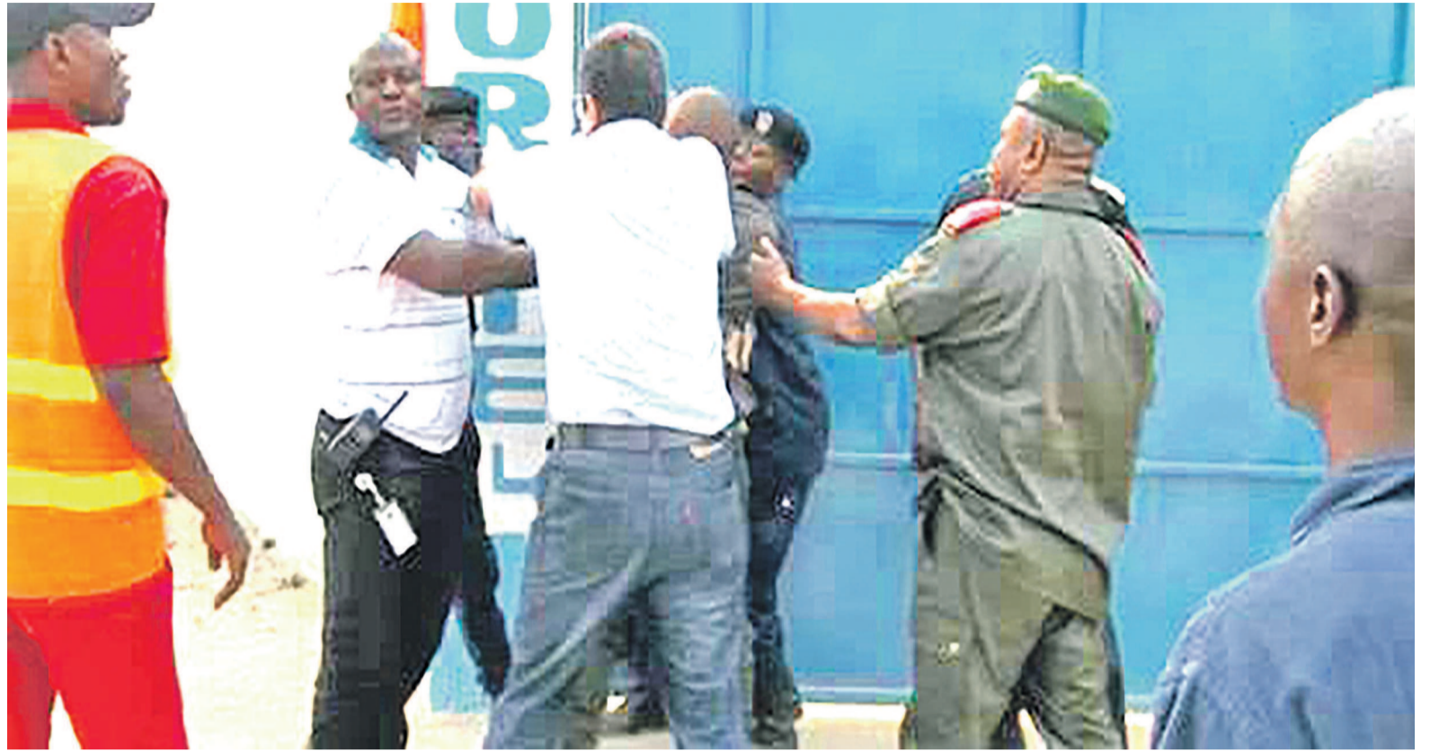
Altercation entre la garde du général et le personnel onusien