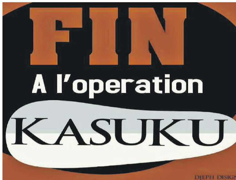
Le log de la Cojeunak

Le Monitoring réalisé par la société civile de Butembo cité par ce regroupement des jeunes de cette partie du Kivu vivant à