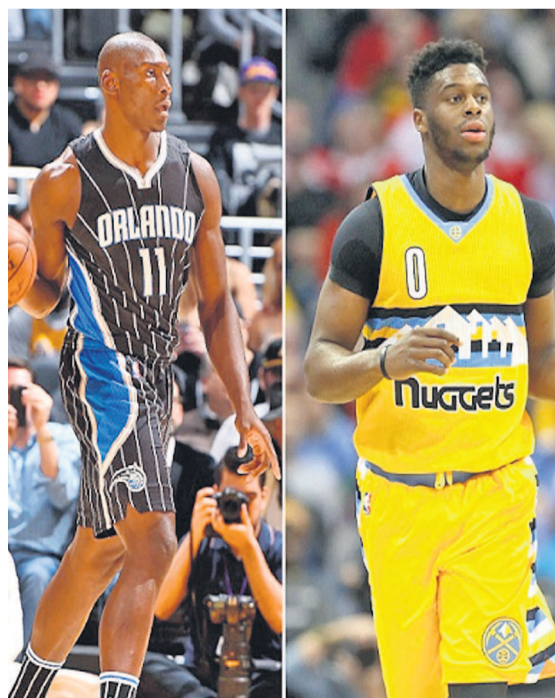
Bismack Biyombo et Emmanuel Mudiay

Qualifiés pour l'Afrobasket 2017 prévu pour septembre au Sénégal et en Tunisie, les Léopards basket-ball messieurs de la RDC vont disputer cette compétition avec les deux stars de la NBA, notamment le pivot défensif Bismack Biyombo d'Orlando Magic et l'ailier Emmanuel Mudiay de Denver. Les deux basketteurs, qui ont récemment animé un camp d'entraînement à Kinshasa, ont pourtant manifesté un réel désir d'évoluer avec la sélection nationale à ce rendez-vous continental de la balle au panier, en participant à la préparation des Léopards à Kinshasa. Mais les pourparlers