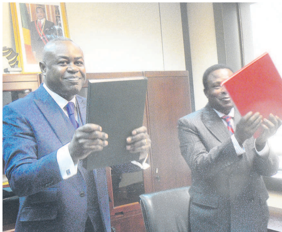
Léon Juste Ibombo et Benoit Bati (adiac)

Le ministre des Postes, des télécommunications qui hérite de l'économie numérique, Léon Juste Ibombo s'est engagé le 31 août à Brazzaville, lors de la passation de service avec le ministre sortant de l'économie numérique et de la prospective, Benoit Bati, à mettre en place l'e-gouvernement et l'e-administration pour moderniser l'administration publique et simplifier les procédures.