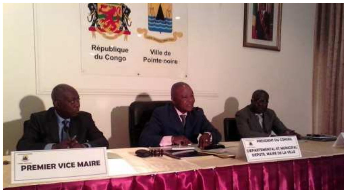
Le présidium «Adiac»

« La recherche des moyens financiers commencera d'abord et avant tout par la mise en ordre et la maîtrise des circuits de recouvrement des recettes municipales propres. La lutte contre l'évasion effrénée des recettes sera renforcée par l'utilisation optimale de l'outil informatique et le renforcement des capacités de l'observatoire fiscal mis en place par l'équipe sortante qui a déjà abattu un travail remarquable », a indiqué le président du conseil dans son allocution de clôture des premières assises consacrées non seulement à l'élection des membres du bureau exécutif mais aussi à l'examen et l'adoption du règlement intérieur du conseil. Selon lui, la détection puis l'éradication de certaines niches de recettes devraient compléter ce dispositif dans l'objectif de faire passer la part de ces recettes de 25% à 50% au cours de la première année et de 50 % à 85 % au