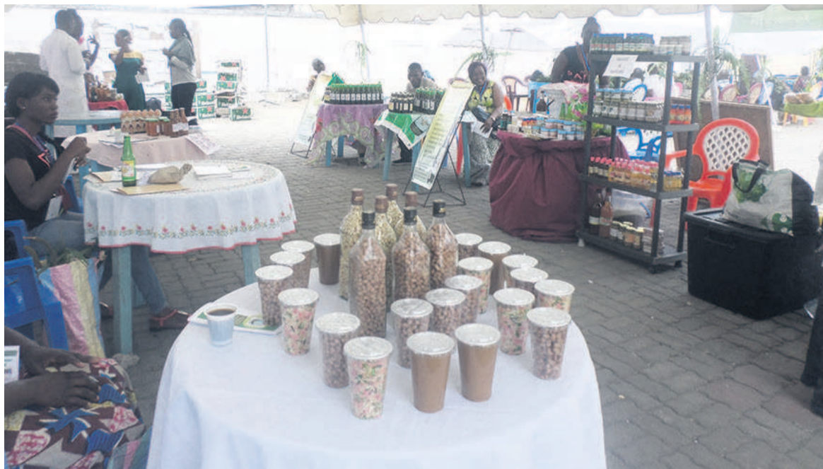
Une vue de l'exposition

Encourager et sensibiliser les Congolais à consommer local. En marge de cette exposition, il s'est tenu le 31 août, une conférence-débat sur le thème : « Le consommer local, locomotive de l'alimentation de demain ». Une façon pour les organisateurs de la foire d'encourager et sensibiliser les Congolais à consommer local. Ainsi, des échanges ont porté sur