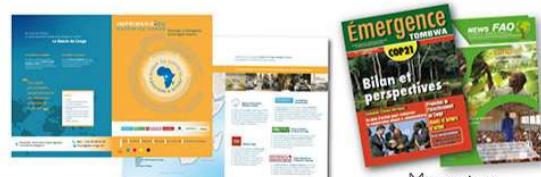
Chemises à rabat