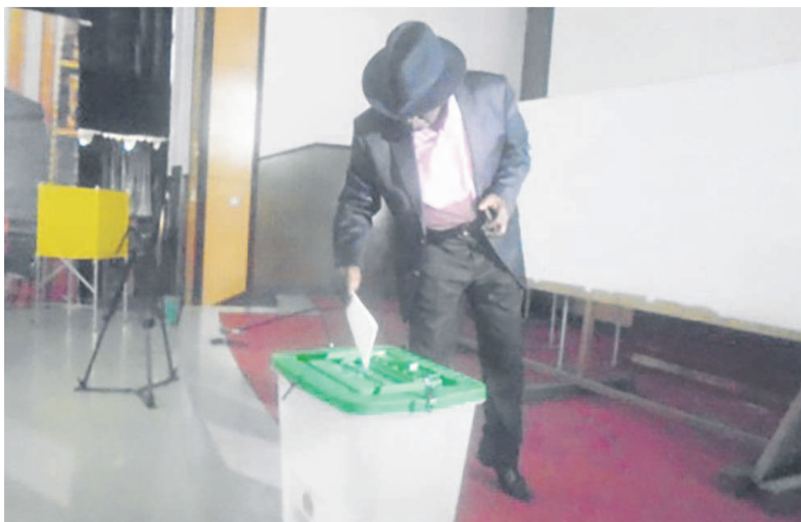
Un conseiller plaçant le bulletin dans l'urne

Les élections sénatoriales se sont tenues le 31 août sur l'ensemble du territoire national. Dans la capitale congolaise, le Parti congolais du travail (PCT) et ses alliés ont remporté la totalité des six sièges.