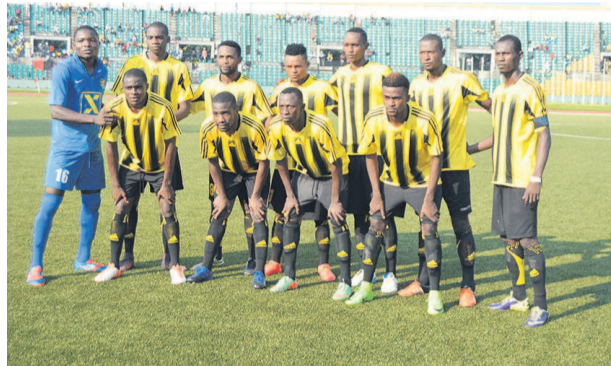
Les Diabes noirs

Vainqueurs à Pointe-Noire (2-0) face au FC Nathalys dans le cadre de la fin de la 30 e journée, les Diablotins ont fait le pas le plus important pour le maintien. Encore faut-il confirmer lors des quatre dernières journées.