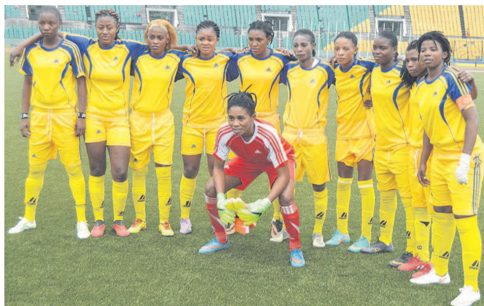
L'équipe du FCF La Source, championne du Congo 2017

La compétition s'est achevée, le 22 octobre, au stade Alphonse-Massamba-Débat à Brazzaville par la victoire de l'AC Léopards (2-1) sur l'AC Colombe. Ironie du sort, aucune des deux formations n'a soulevé le trophée.