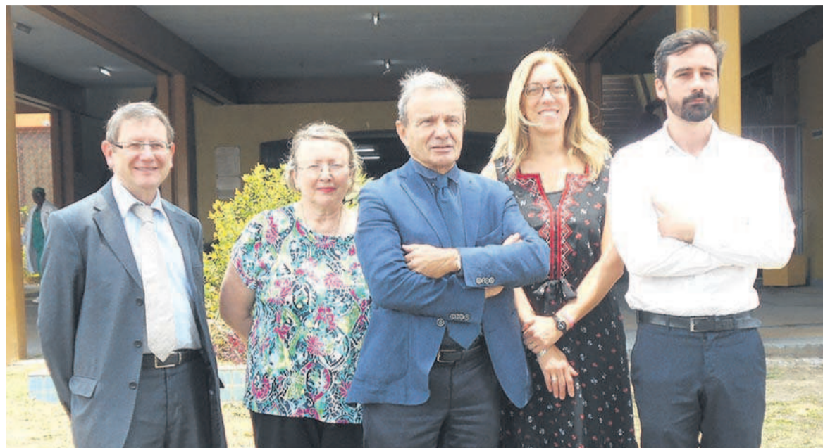
Les experts français

En ce qui concerne le volet médical, poursuit-il, l'analyse a été