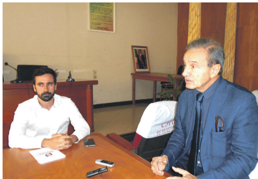
Les experts lors de la présentation du projet