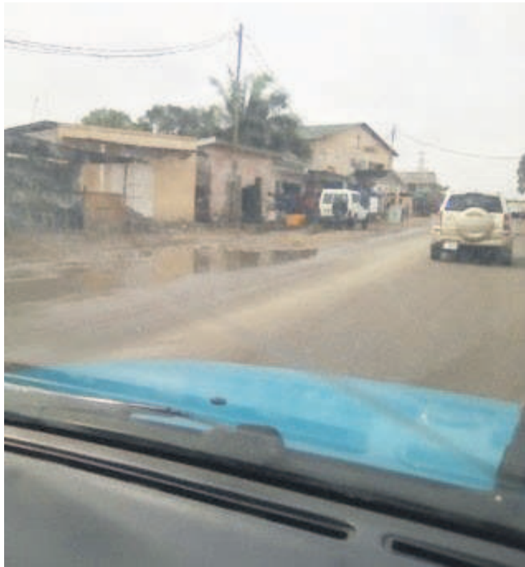
Une marre d'eau sur l'avenue Jacques Opangault vers le rond-point X-oil à Faubourg

L'éclaboussement, fait apparemment banal, porte pourtant préjudice à ceux qui en sont victimes. Beaucoup de personnes se sont retrouvées salies de la tête aux pieds pour avoir été éclaboussées en cours de route par un véhicule. Très souvent, après avoir commis l'acte, les chauffeurs prennent la clé des champs, oubliant qu'ils peuvent être poursuivis si la victime porte plainte. « Je me suis déjà fait éclabousser à deux