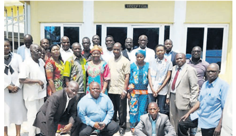
Les participants à l'atelier

Cette rencontre a également permis aux participants d'examiner les problématiques na-