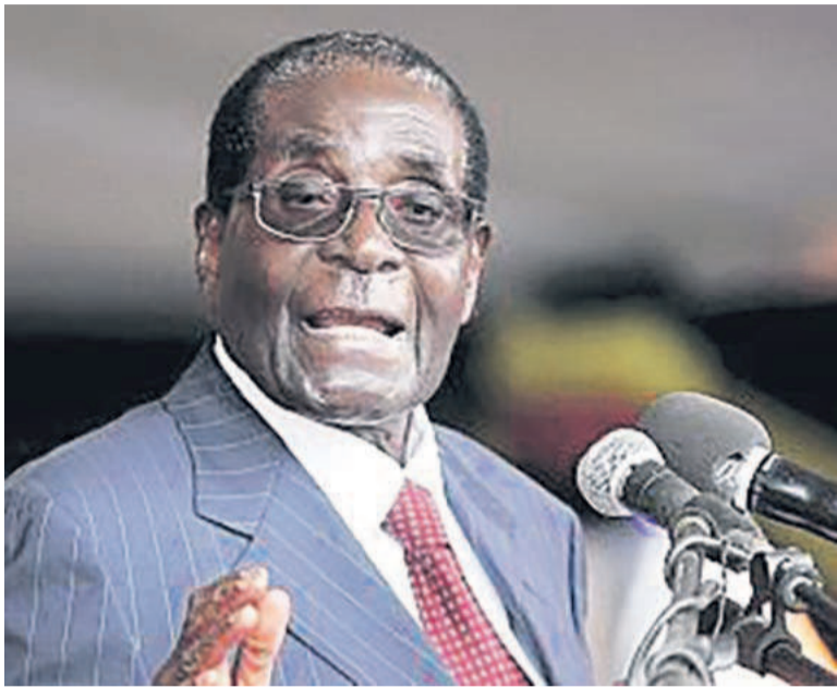
Le président Robert Mugabe

Le président zimbabwéen avait été désigné, la semaine dernière, comme ambassadeur de bonne volonté de l'agence des Nations unies, suscitant une vive polémique.