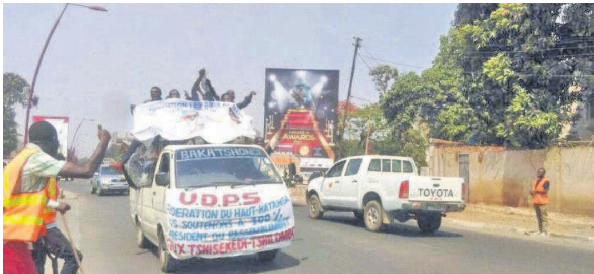
Des militants de l'UDPS sur la route de l'aéroport

Alors que Fatshi était attendu en début d'après-midi (soit vers 13 heures 30), les choses avaient déjà commencé à se gâter la veille. Des arrestations avaient été opérées la veille, au siège local de l'Union pour la démocratie et le progrès social (UDPS) où se tenait une réunion des membres en guise de préparation de l'arrivée du président du Rassemblement des forces politiques et sociales acquises au changement. Selon des témoignages, des policiers armés jusqu'aux dents auraient fait irruption sur le lieu et procédé à l'arrestation des militants trouvés sur place après les avoir molestés sérieusement. Les membres