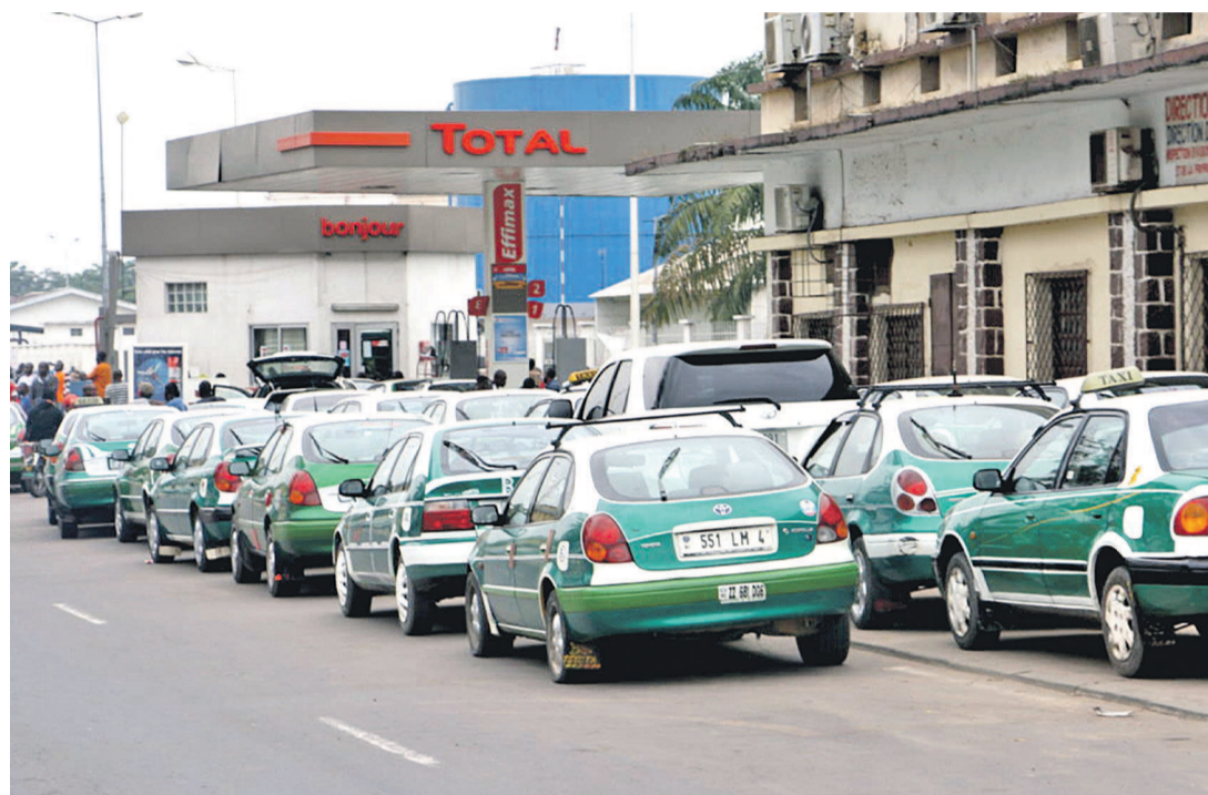
Des longues files d'attente observées dans les stations-service à Brazzaville