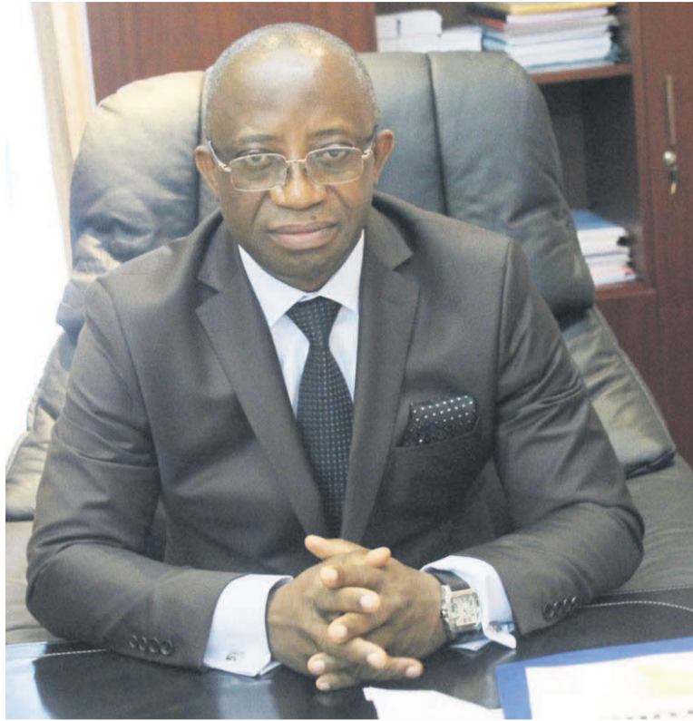
Le ministre du Budget, Pierre Kangudia

Pour cette formation politique, en effet, étant donné qu'à ce jour la Céni n'a pas encore publié le ca-