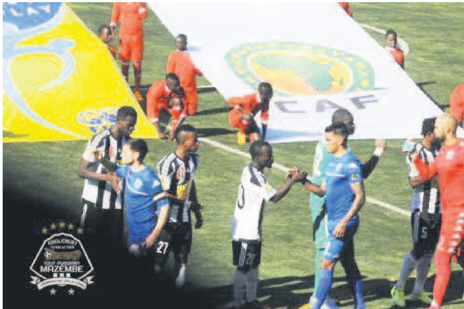
Mazembe et Supersport se retrouvent en finale après les oppositions en poule