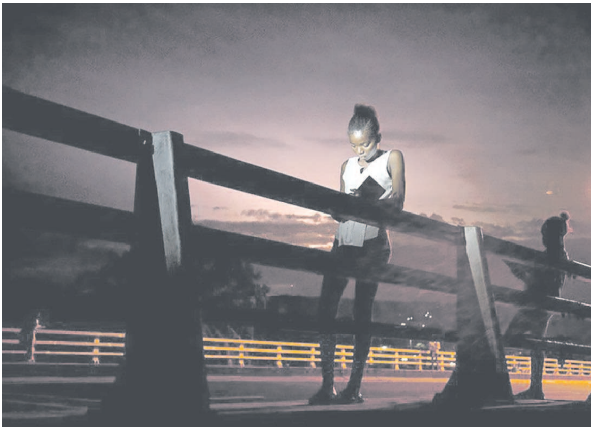
Une des photos primées au concours 2017 de la Photographie Alliance Française en Espagne et EFTI

Baudoin Mouanda est membre du «Collectif Elili» et de l'association «Afrique in visu». Ayant commencé, dès l'âge de 13 ans, le photoreportage, il continue à réaliser ses clichés par l'attrait