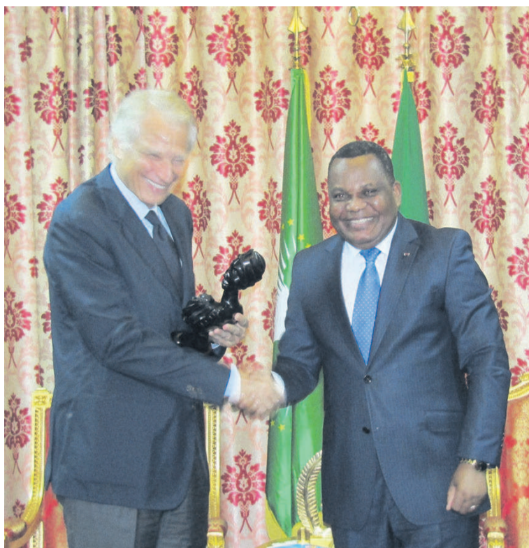
Dominique de Villepin recevant un cadeau de la part du ministre Jean-Claude Gakosso « C'est l'occasion de faire le point entre amis sur la façon dont nous

Pour le chef de la délégation française, la relation franco-congolaise doit être renforcée et entretenue puisque la France a un nouveau président de la République qui « arrive avec des vi-