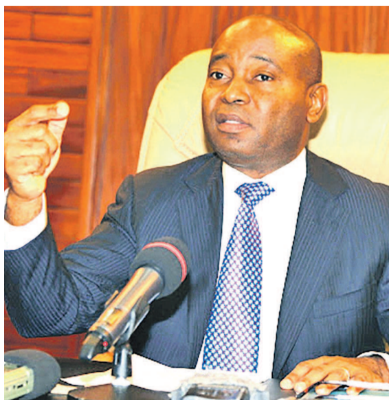
Déogratias Mutombo, gouverneur de la Banque centrale du Congo