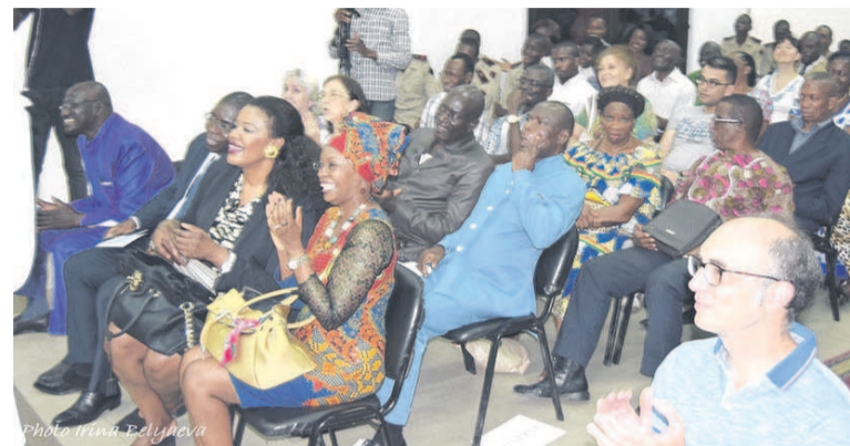
...Les spectateurs (Adiac)

cé son retrait sous peu pour céder la place à son adjoint. Cette fanfare fait l'honneur de l'église salutiste et de la République du