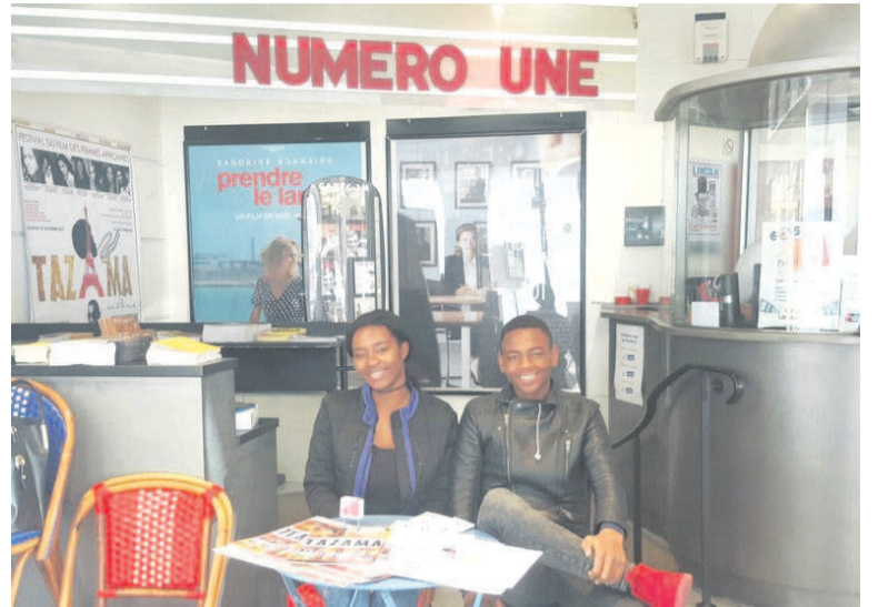
Tazama 2017 à Paris

Selon la créatrice, c'est une vitrine différente où, chaque année, au mois de janvier, durant une semaine, le festival met en lumière le travail des réalisatrices du Congo et d'Afrique. Les cinéastes qui viennent à ce rendez-vous du 7e art participent également à la lutte contre le cancer.