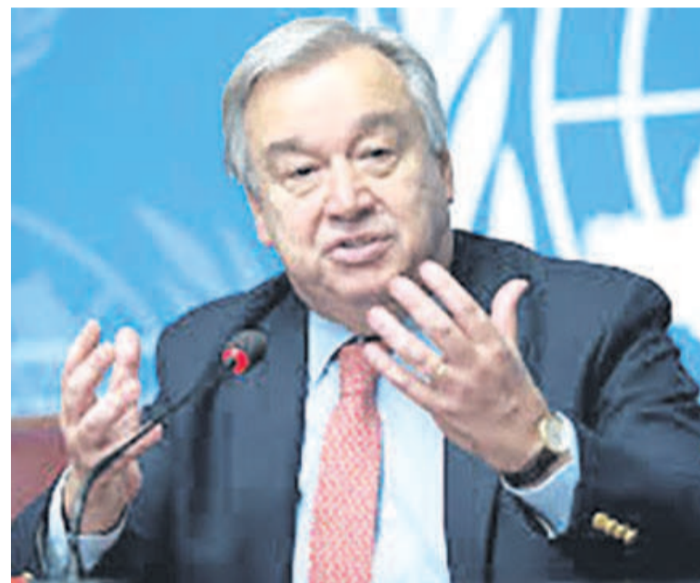
Antonio Guterres

En outre, Antonio Guterres s'entretiendra avec des éléments des contingents gabonais et marocains présents sur place et se rendra dans le camp des déplacés de la ville, sous la protection des Casques bleus. A son retour à Bangui, il rencontrera des victimes d'abus sexuels et leurs