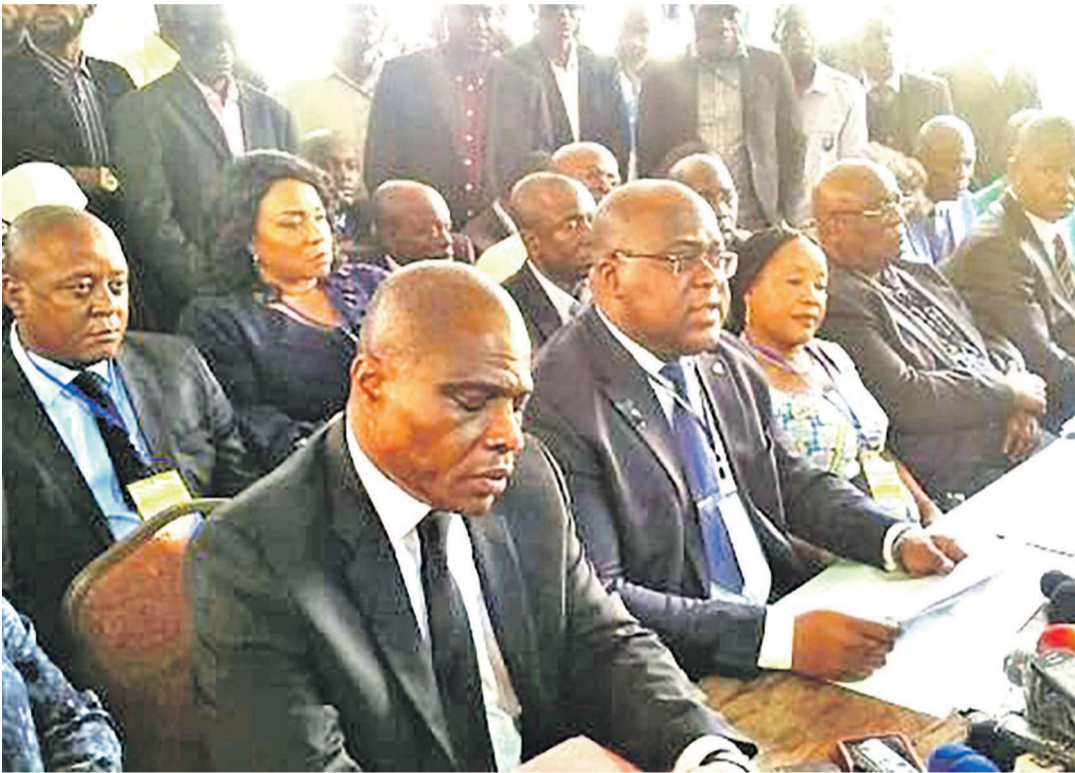
Les membres du Rassemblement-Limete lors d'une activité politique