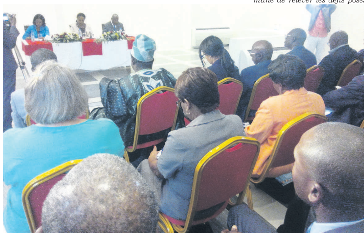
La ministre Jacqueline Lydia Mikolo lançant les travaux de l'atelier sous-régional (Adiac)

Le contact entre l'homme et l'animal constitue une menace importante pour la santé humaine car, ces animaux sont considérés comme des réservoirs des agents pathogènes et un maillon essentiel dans la propagation des épidémies.