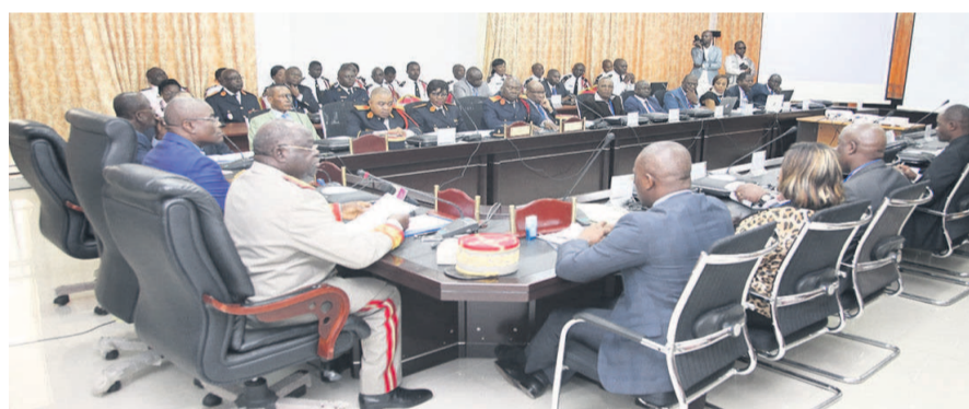
Les participants à la réunion (Adiac)

L'évaluation de la mise en oeuvre du plan stratégique régional 2013-2017 révèle des insuffisances.