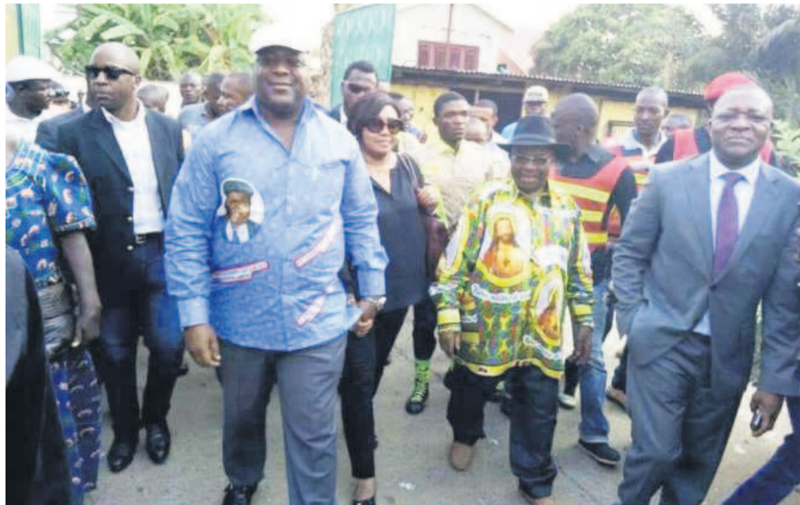
Félix Tshisekedi à Lubumbashi

Le chef de l'opposition congolaise a accusé, le 24 octobre, la police d'avoir entravé sa réunion politique en tirant des gaz lacrymogènes et des coup de feu en l'air.