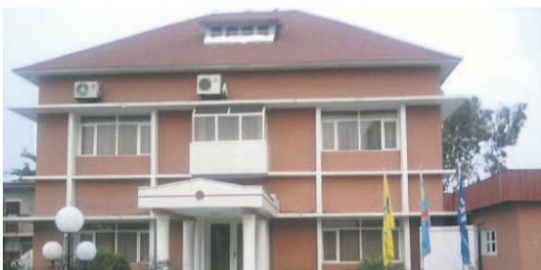
Le siège de la Fécofa

L'option prise par le TP Mazembe de rester au Maroc pour préparer la finale aller de la Coupe de la Confédération contre Supersport United met la Fédération congolaise de football association (Fécofa) dans l'obligation de changer la date de l'organisation de la compétition qui oppose le vainqueur du championnat national au gagnant de la Coupe du Congo.