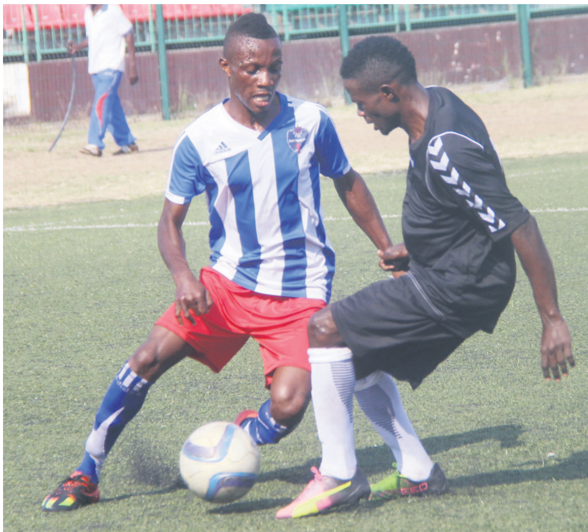
Le duel FC Nathaly's vs V Club Mokanda