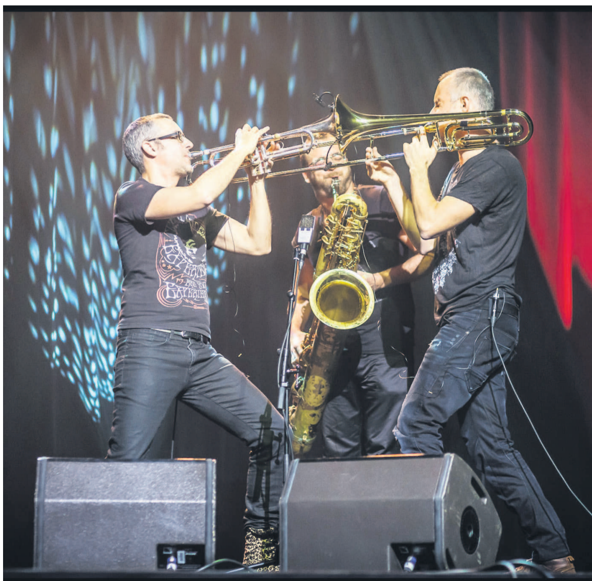
Le trio Journal intime»