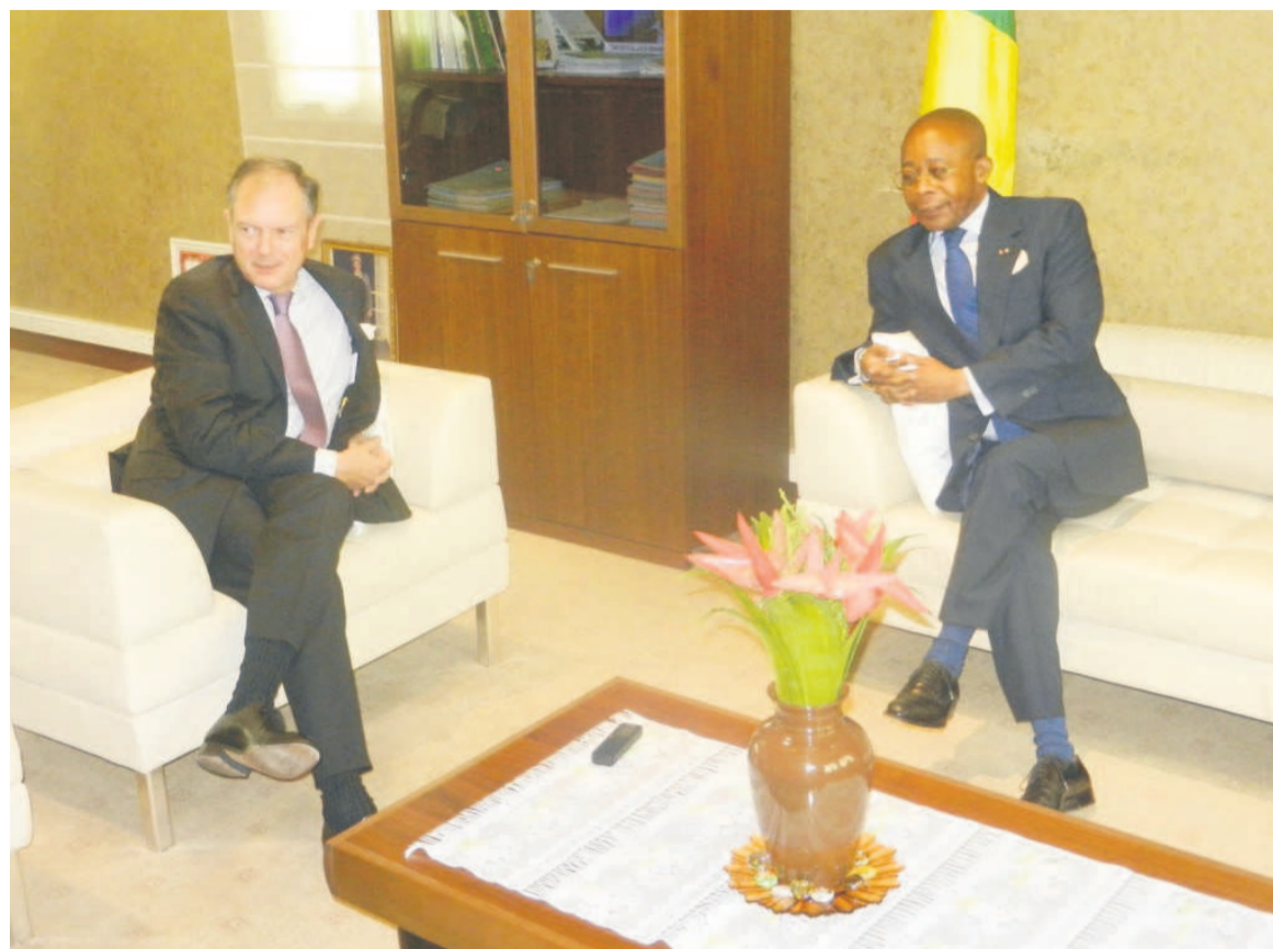
Les deux personnalités lors de l'audience

« Il y a un passé riche et long de coopération entre la France et le Congo, en particulier avec le Centre de coopération internationale en recherche agronomique pour le développement (Cirad) dans la région de Pointe-Noire. Ces accords ne sont pas aujourd'hui aussi vivants