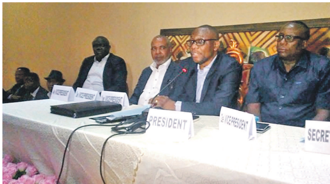
Les membres de la Commission de gestion de la Linafoot

La problématique de l'éradication des troubles dans les stades a constitué le point principal de la réunion tenue récemment entre la commission de gestion et les responsables des commissions des supporters de quatre équipes populaires de Kinshasa.