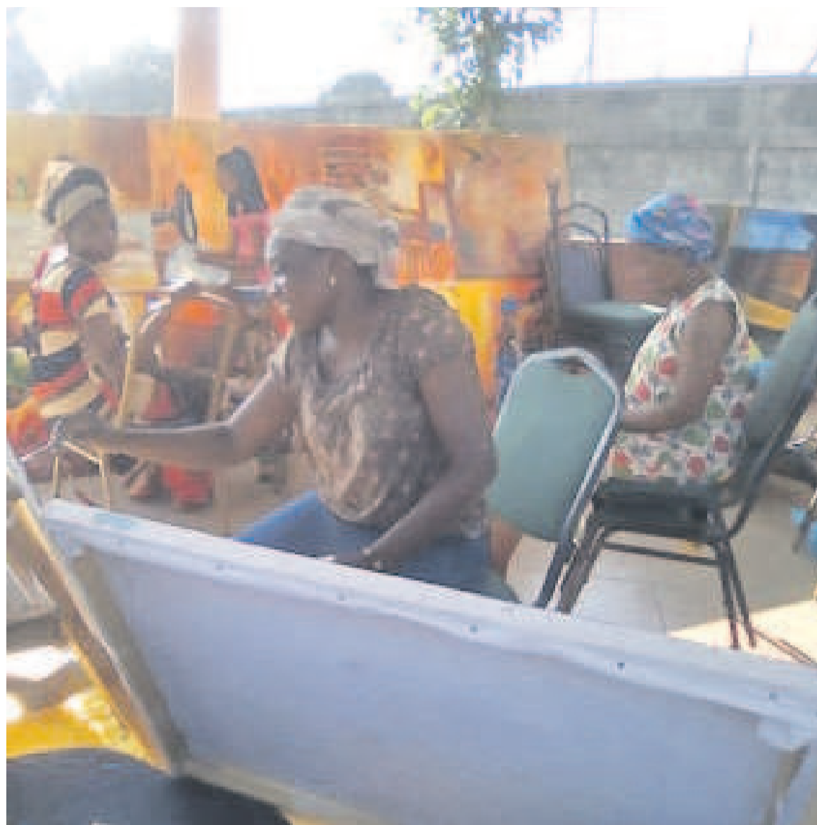
Les femmes peintres pendant l'atelier

Le projet «Liberté sur la toile» est né du désir de ces femmes peintres de mettre en valeur la femme africaine actuelle,