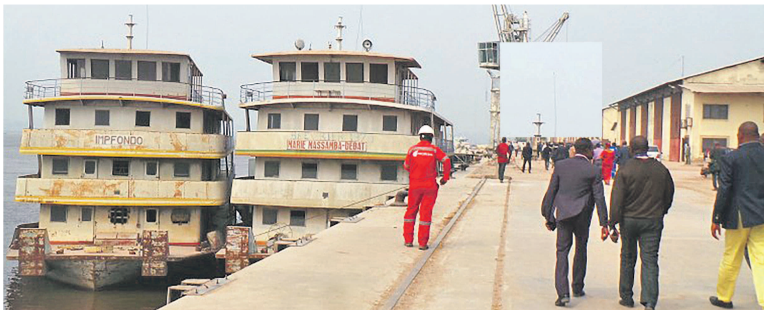
Une vue du port lors de la visite du ministre Fidèle Dimou

Face aux difficultés financières que connaît le Port autonome de Brazzaville et ports secondaires, les agents de cette structure ont brandi la menace d'un arrêt de service en cas de non prise en compte de leurs doléances par le gouvernement.