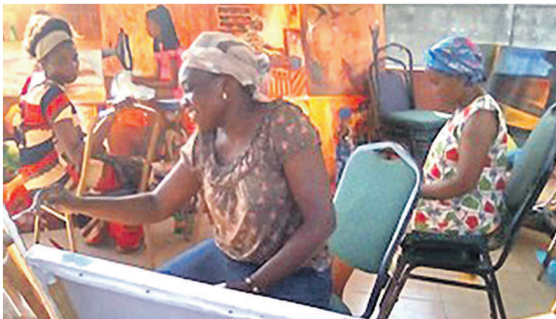
Les femmes-peintres pendant l'atelier

L'ambition de ces dernières est de réaliser une fresque qui devra mettre en valeur la femme africaine actuelle, à savoir « une femme moderne et active ». Leurs œuvres seront présentées lors d'une exposition dont le vernissage aura lieu le 17 novembre, au Centre culturel Jean-Baptiste-Tati-Loutard de Pointe-Noire. Page 14