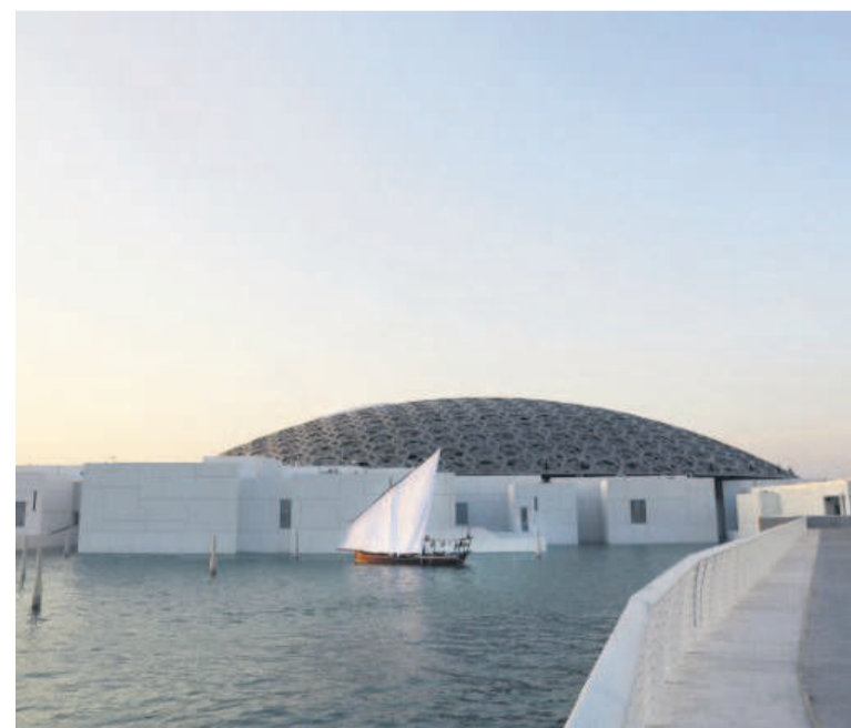
Le musée du Louvre d'Abou Dhabi

Les musées français prêteront pendant dix ans, à partir de la date d'ouverture, sur la base du volontariat, des œuvres dont la durée de prêt n'excédera pas deux ans. Treize musées français ont prêté, pour la première année d'ouverture, 300 œuvres d'art,