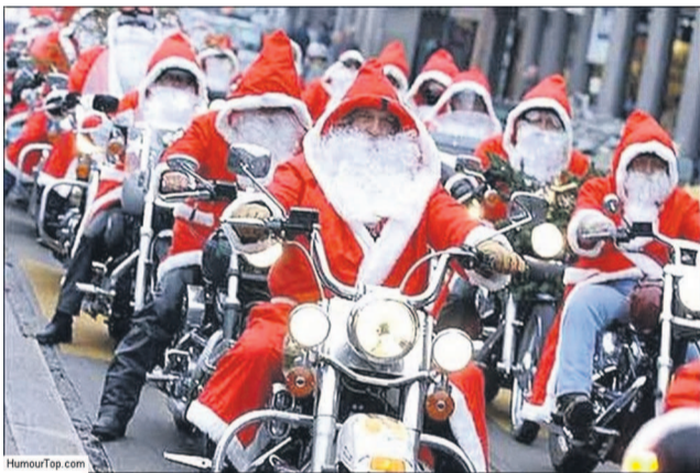
Père Noel Harley Davidson