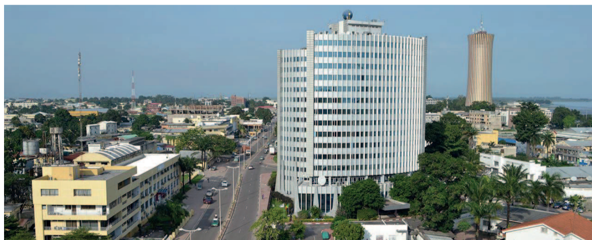
Une vue du centre ville de Brazzaville