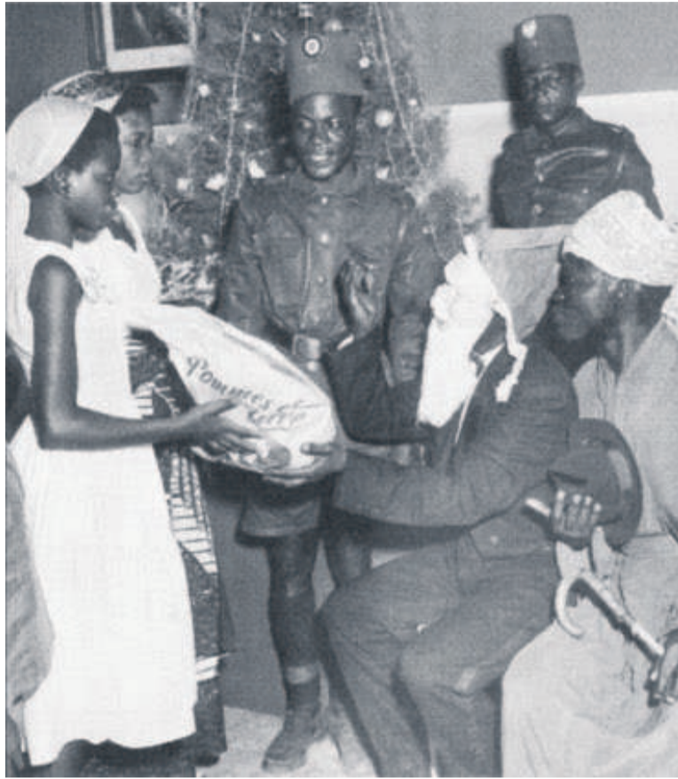
Le Père Noël distribuant un sac de pomme de terre

Il faut croire qu'il ne pouvait se trouver aucun blanc pour faire office de Père Noël pour des noirs. Il n'est donc pas étonnant de constater que celui de la photo soit noir. L'on aurait peut-être pu compléter le tableau en l'habillant du costume traditionnel du Père Noël, question de faire plus vraisemblable. Car qui a dit qu'il ne pouvait pas exister un Père Noël noir, à la peau jaune ou même rouge