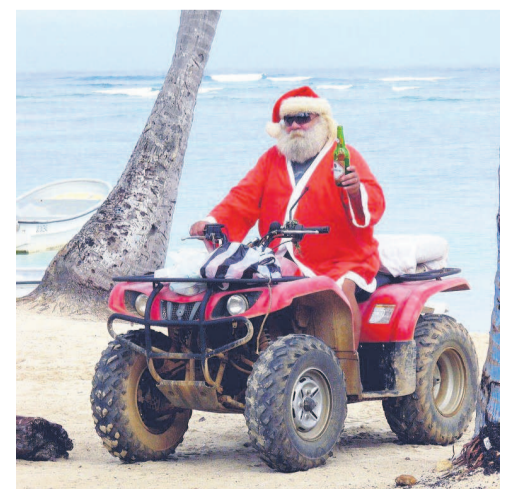
Père Noël en Quad