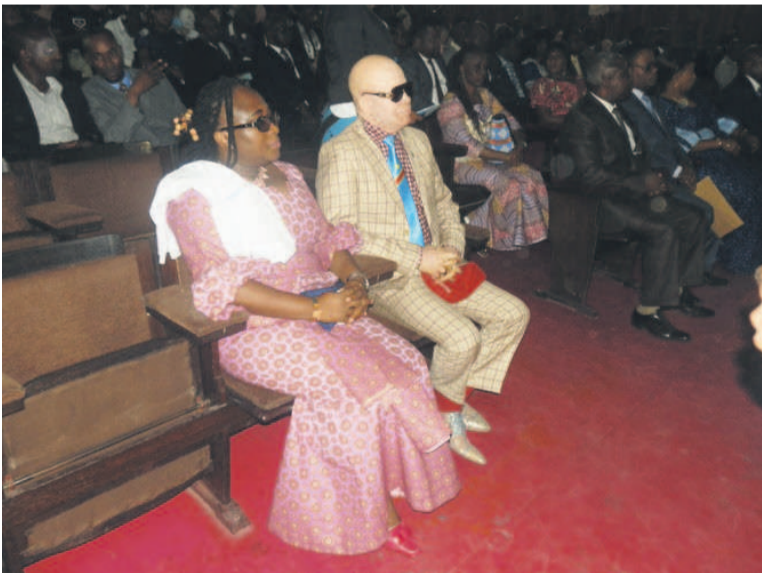
Le président de la FMT et la directrice générale du FNPSS/Adiac

L'ONG des albinos, la Fondation Mwimba-Texas (FMT) organise, le 22 décembre à l'YMCA/Matonge, une grande manifestation de sensibilisation pour clôturer l'année 2017. Au cours de ce rendez-vous, cette ASBL va également distribuer des vivres aux familles des albinos et autres démunis, en vue de leur permettre de passer les fêtes de Noël et de la Saint-Sylvestre en beauté.