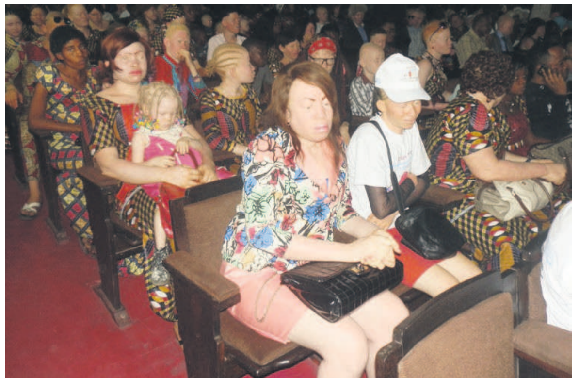
Des membres de la FMT, lors d'une manifestation à Kinshasa

beauté ». Etant donné la situation économique-financière difficile que traverse le pays, la FMT recourt à ses partenaires et autres bonnes volontés