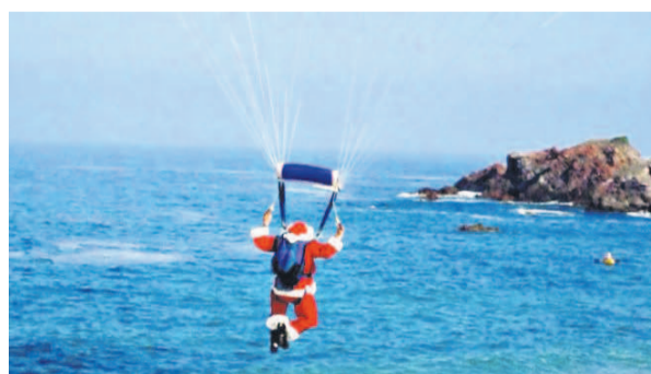
Père Noël en parachute