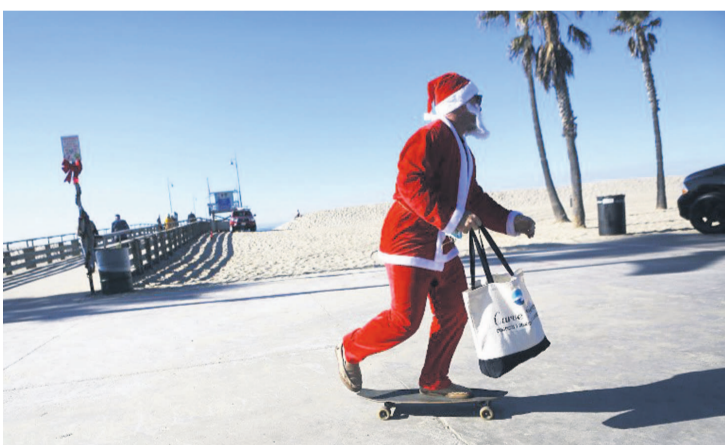
Père Noël En Californie