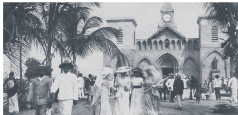
Sortie de Messe à Brazzaville 1849

de Brazzaville à travers des danses, chansons, du slam ou encore des contes. Ville située au cœur de l'Afrique centrale, Brazzaville doit son existence à l'explorateur Franco-Italien Pierre Savorgnan de Brazza. De la petite station qu'elle représentait en 1880, elle a su, au fil des années, marquer une courbe exponentielle en faveur de son développement.