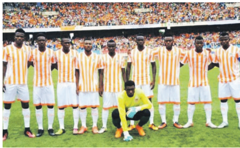
FC Renaissance du Congo en quête de victoire face à V Club et DCMP