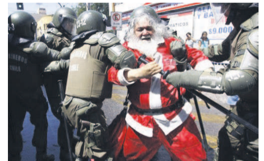
Père Noël au Chili