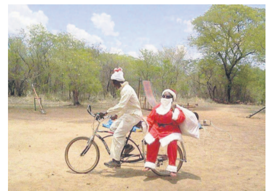
Père Noël en Afrique du Sud