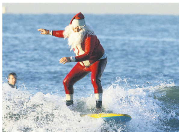
Père Noël Surfeur