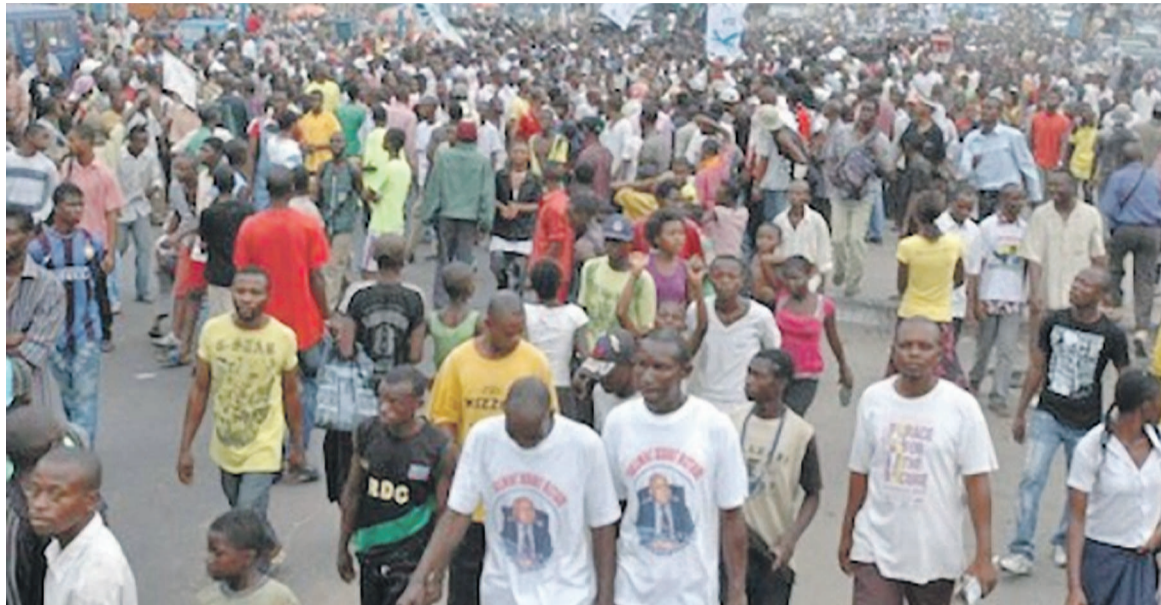
Une manifestation de l'opposition en RDC (tiers)

Dans son communiqué annonçant cette action, le CLC de l'Eglise catholique semble désormais plus que déterminé à sauver la nation. Il a, en effet, appelé à une marche pour « libérer l'avenir du Congo » ou à « sauver la