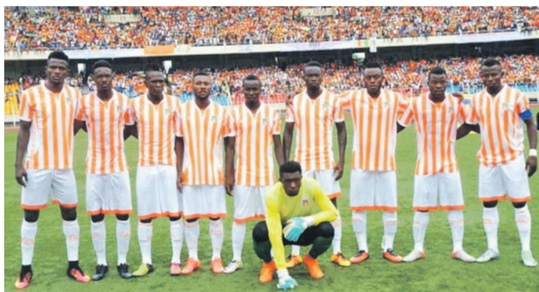
Renaissance du Congo perd trois matchs par forfait