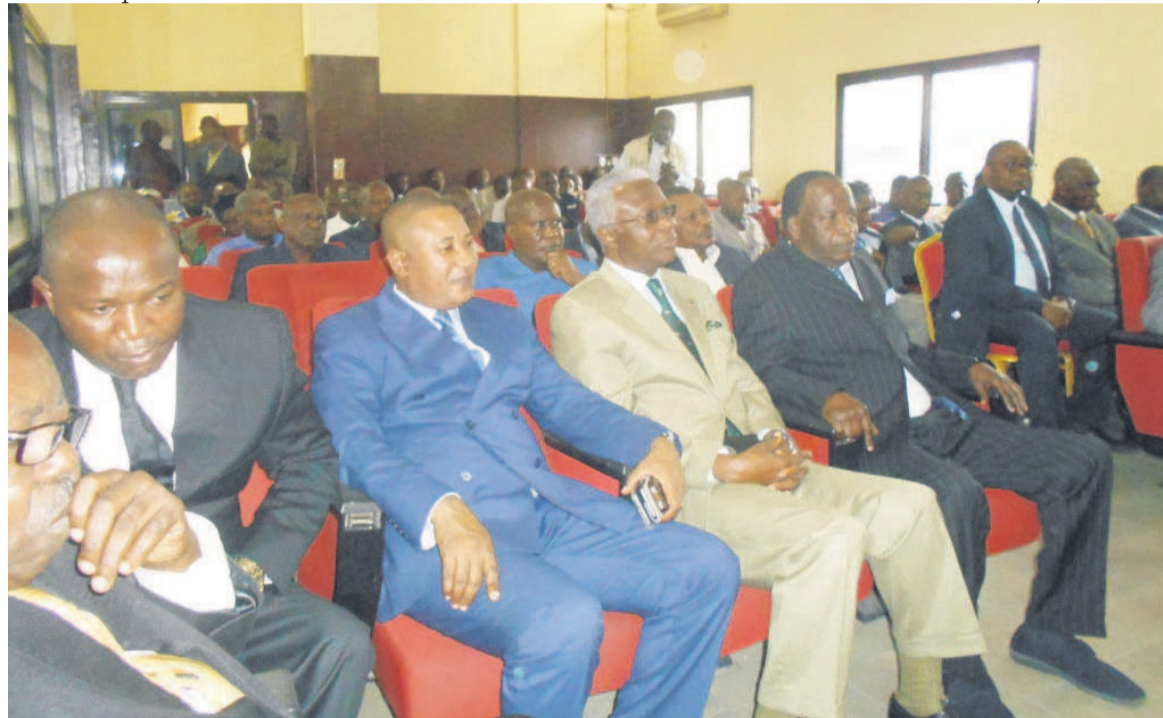
La rencontre du maire central avec la population de Bacongo/Adiac

rondissements de Brazzaville. « L'initiative a pour but de changer la figure de la ville capitale. Ma présence parmi vous est d'écouter toutes vos préoccupations qui auront leur solution avec la participation de la population », a-t-il indiqué. Concernant l'ad-