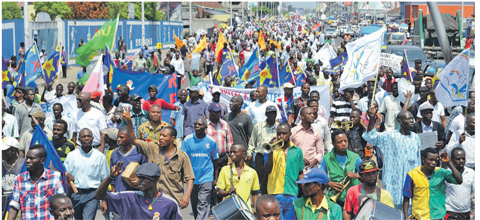
Une manifestation de l'opposition à Kinshasa