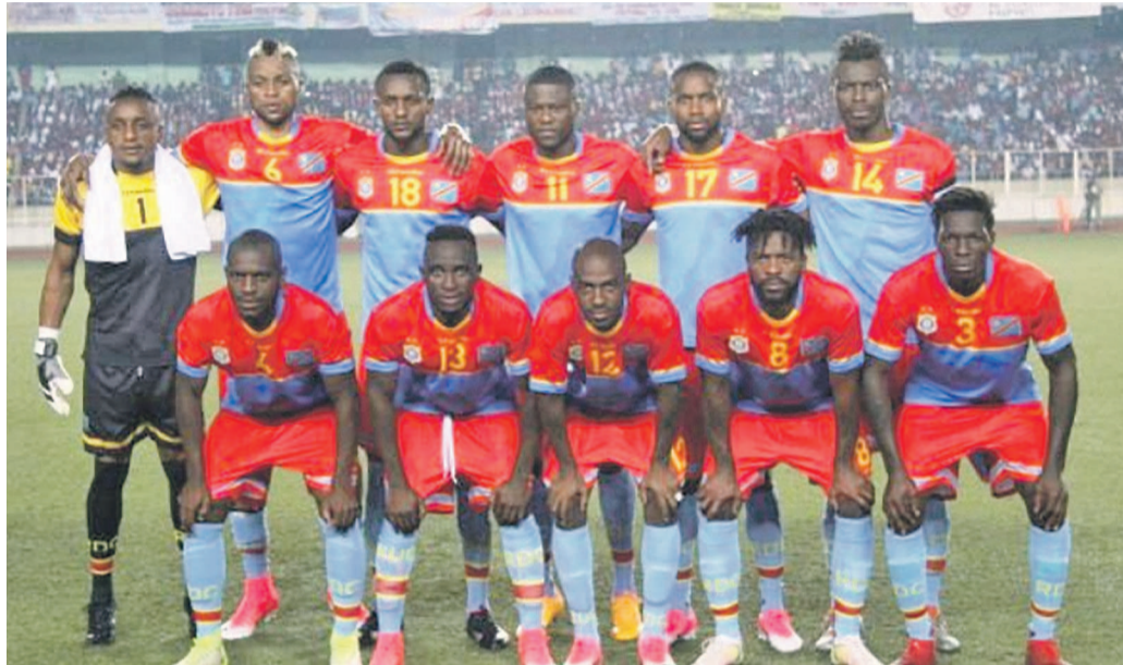
Les Léopards de la RDC

Comme en novembre, le pays conserve sa place au niveau mondial et se classe quatrième en Afrique, au dernier classement Fifa de décembre. A la même époque en 2016, il était classé 48 e .