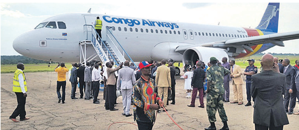
Congo Airways à l'aéroport de Bipemba lors du vol inaugural

En novembre 2015, la compagnie nationale d'aviation déposait sa demande d'intégration à l'Association des compagnies aériennes africaines (Afraa). Deux ans après, elle est devenue membre de cette organisation et vient d'intégrer le Comité exécutif pour une durée de trois ans. Son élection renforce son rôle stratégique sur l'échiquier africain.