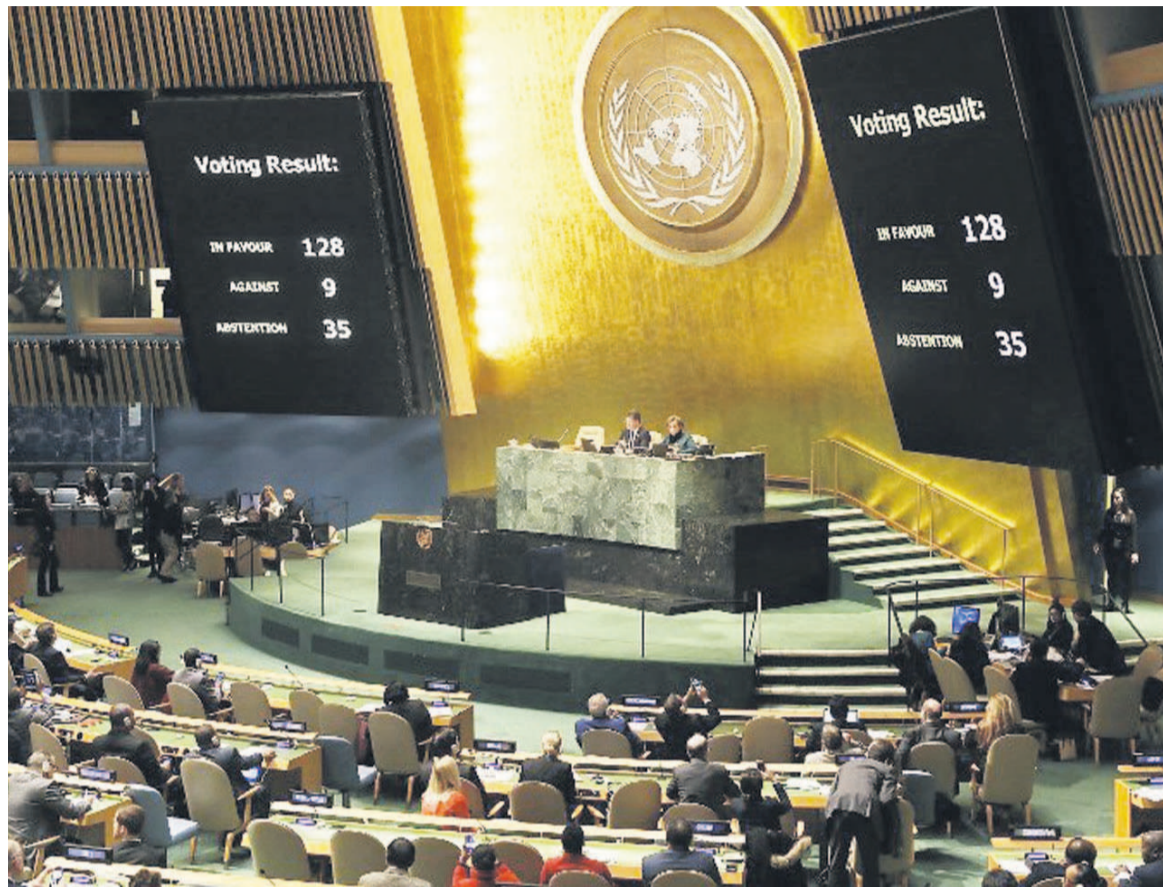
Une vue de l'Assemblée générale de l'ONU

«Les Etats-Unis se souviendront de cette journée qui les a vus cloués au pilori devant l'Assemblée générale pour le seul fait d'exercer notre droit de pays souverain», a déclaré l'ambassadrice américaine à l'ONU, Nikki Haley, avant le vote. «Nous nous en souviendrons quand on nous demandera encore une fois de verser la plus importante contribution financière à l'ONU, a-t-elle lancé, menaçant à nouveau de «mieux dépenser» l'argent des Américains à l'avenir.