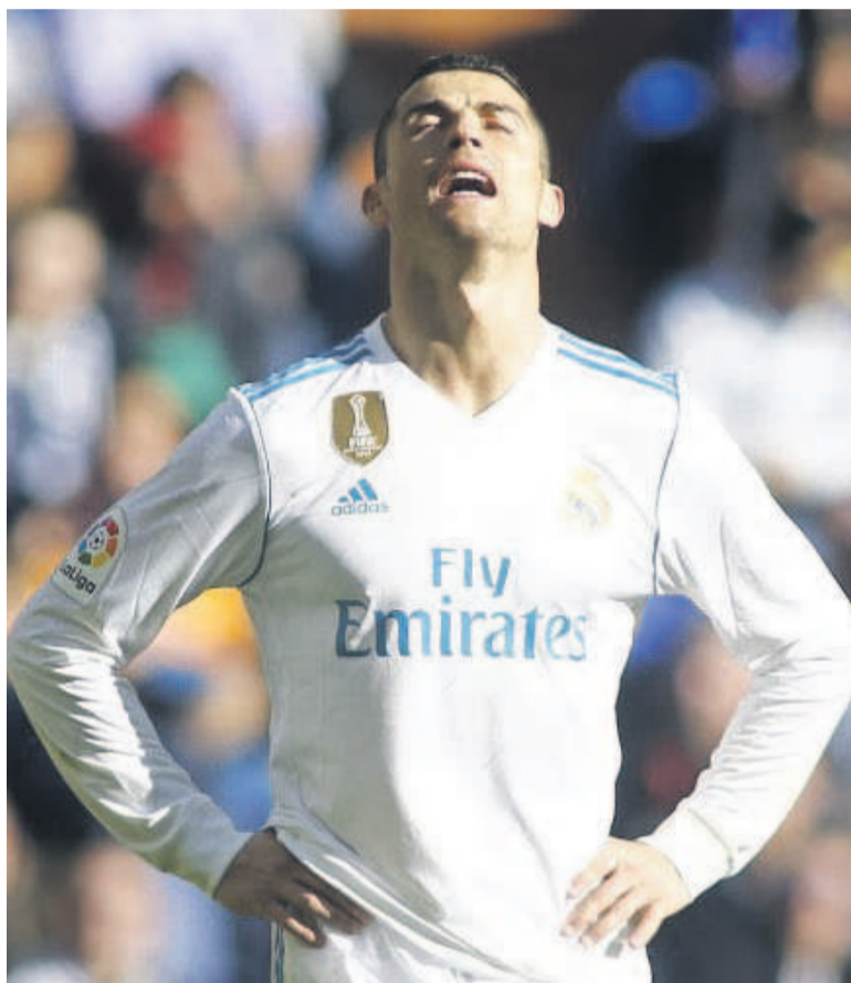
Ronaldo et le Real Madrid sont KO debout après leur revers face au Barça, le 23 décembre

au Barça, plus solide et plus efficace à défaut d'être séduisant. Voilà les Catalans (1 er , 45 pts) nantis de quatorze longueurs d'avance sur le Real (4 e , 31 pts, un match en moins) après dix-sept journées. Un gouffre quasi définitif en Liga. « C'est un moment compliqué, critique, pour nous aujourd'hui, c'est sûr. On est très déçu et affecté », a reconnu Zidane en conférence de presse, tout en refusant de croire que la Liga soit « pliée ».