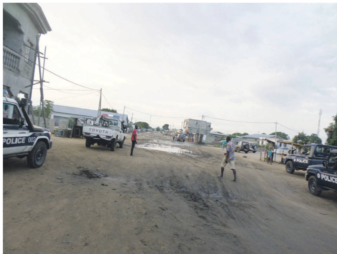
Une vue de la route Soprog-Domaine/Adiac