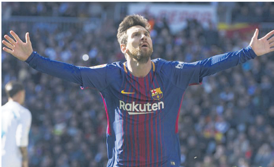
Avec un but et une passe décisive, Leo Messi a laissé son empreinte sur ce Clasico, largement remporté par le Barça à Madrid

Pas de triomphalisme pour autant du côté de l'entraîneur barcelonais, Ernesto Valverde: « Bien sûr que non, la Liga n'est pas terminée! », a-t-il lancé, ajou-