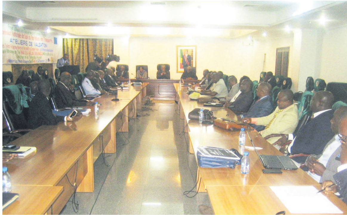
Les participants lors de la clôture de l'atelier réaliser les travaux ou de passer les marchés ».

L'étude de faisabilité du nouveau mode de gestion des ressources provenant des postes de péage et le mécanisme qui permettrait donc au fonds routier de collecter ses ressources est confiée à un consultant. D'après le directeur général du fonds rou-