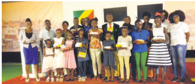
Les lauréats posant avec les organisateurs et les membres du jury