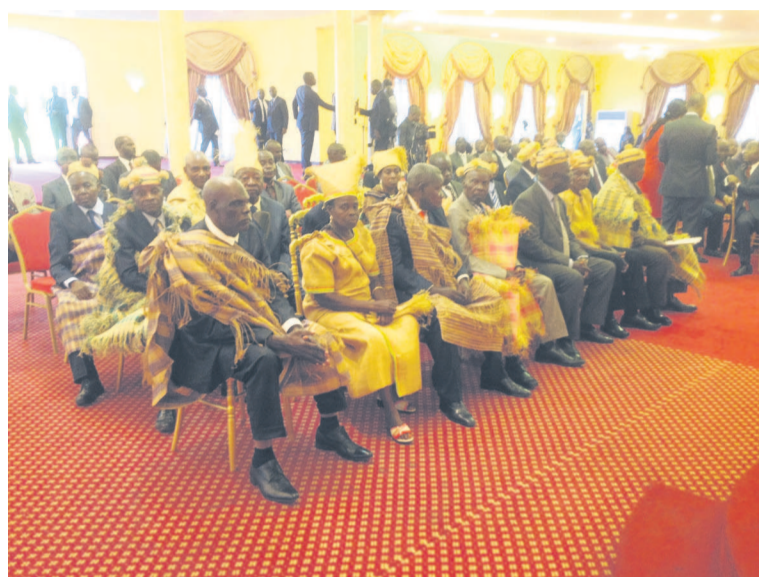
Les sages et notabilités de la Lékoumou

Les sages et notabilités de la Lékoumou ont été reçus, le 27 décembre, au Palais du peuple, par le président de la République, Denis Sassou N'Guesso, en présence des cadres politiques et administratifs originaires de ce département. Au menu de l'audience, la demande de création d'un institut d'agronomie dans le chef-lieu Sibiti, et l'organisation d'une rencontre regroupant tous les sages et notabilités du Congo afin de débattre du retour de la paix dans le Pool.