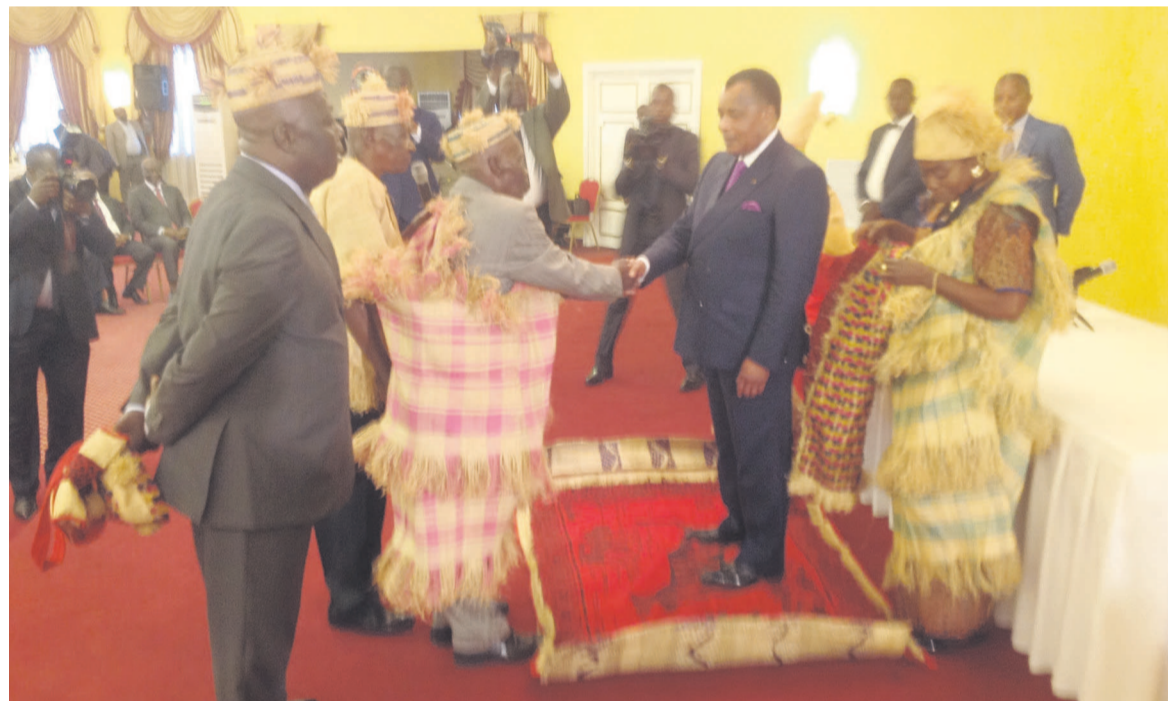
Les sages et notabilités de la Lékoumou lors de l'audience

Outre l'examen du budget, le Conseil a procédé à la désignation du chef de fil de l'opposition attribué à l'Union panafricaine pour la démocratie sociale, conformément à la Constitution du 25 octobre 2015. Page 3