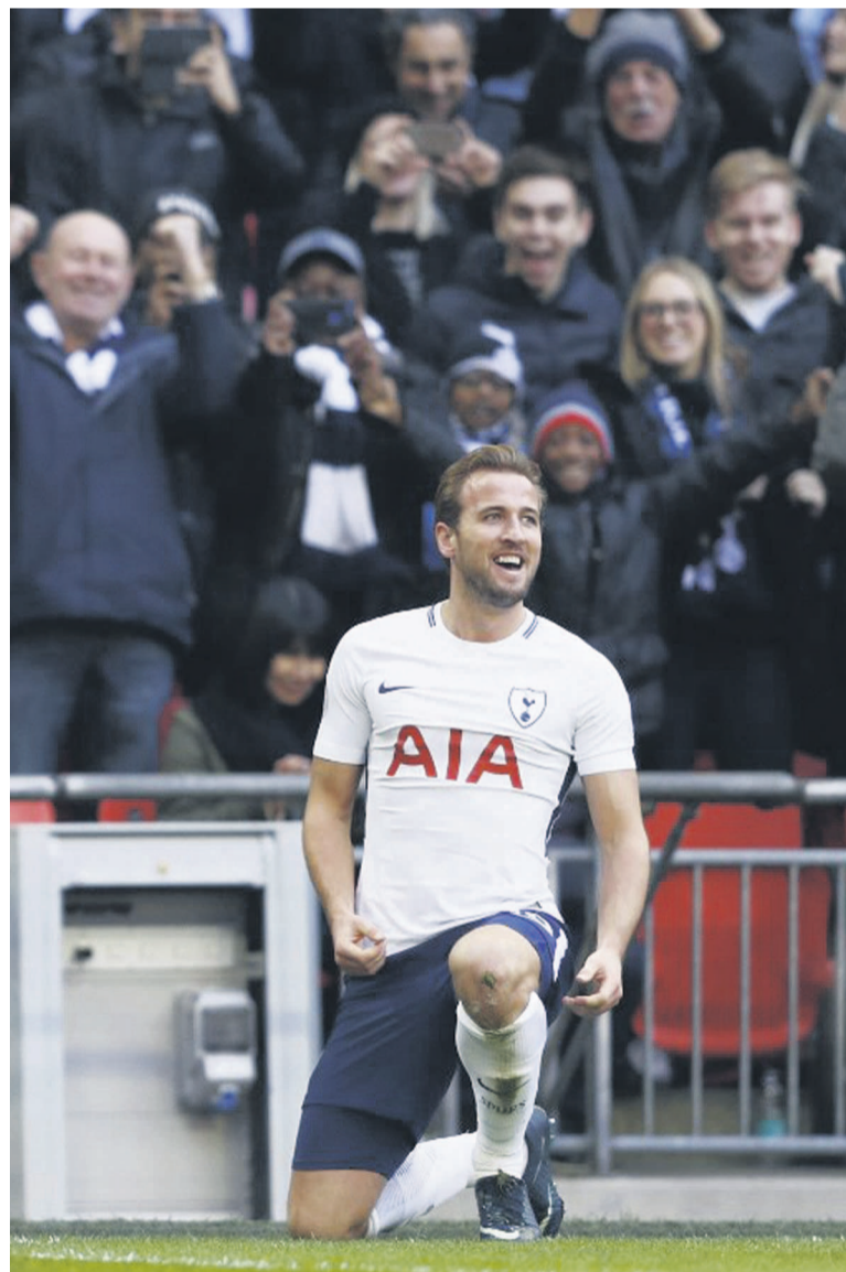
Avec 56 buts, l'Anglais Harry Kane est le meilleur buteur de l'année civile 2017 devant Messi, Cavani and co

L'Anglais présente, en outre, le meilleur ratio but/match de 2017 : cinquante-six en cinquante-deux matches (club et sélection), contre cinquante-quatre en soixante-quatre matches pour «Leo» Messi, cinquante-trois en cinquante-six matches pour Lewandowski, cinquante-trois en soixante matches pour Ronaldo et cinquante-trois en