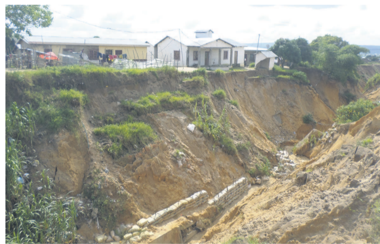
Une vue du caniveau ayant cédé

maître d'ouvrage délégué le Purac (Projet d'urgence de relance et d'appui aux communautés).