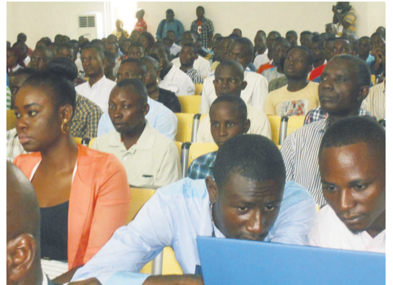
Une vue des jeunes à l'ouverture de la formation

présenté sa structure, avant de souligner l'engouement des jeunes à apprendre. Plus de deux mille jeunes sont inscrits à cette formation et trois cents demeurent encore en attente, a indiqué le président de l'AJP. L'Ajp, poursuit-il, ne laisse pas l'Etat seul former les jeunes, mais elle doit l'accompagner dans cette immense tâche. « Tech Noël permet de mettre en place un marché d'ap-