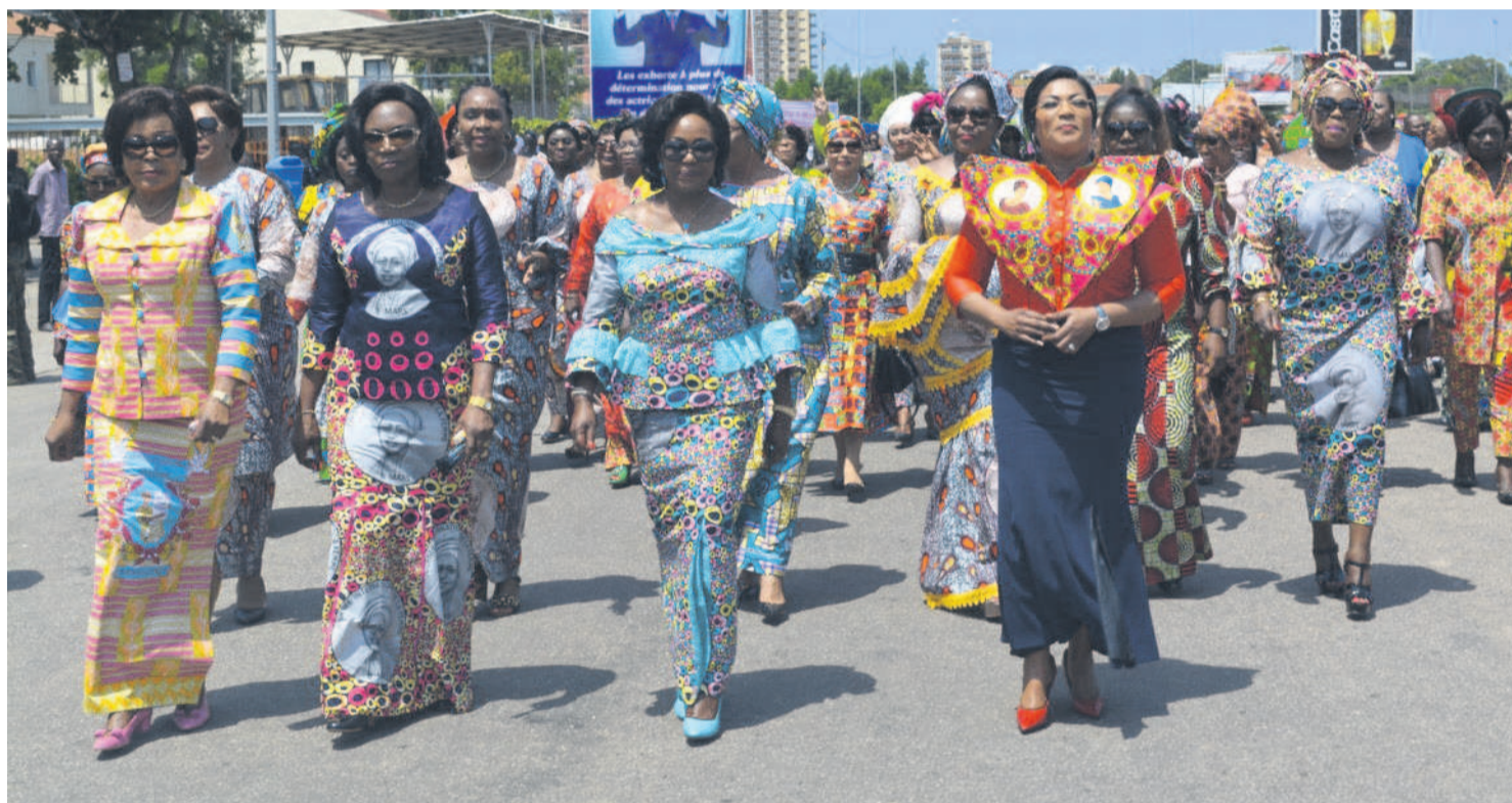
Le 8 mars 2018 célébré sur le thème « L'heure est venue. Les activités rurales et urbaines transforment la vie des femmes »

Dans la capitale économique, la journée internationale de la femme a été marquée par une grande parade féminine sur le boulevard de Loango, conduite par l'épouse du chef de l'Etat, Antoinette Sassou N'Gusso en présence du Premier ministre, chef du gouvernement, Clément Mouamba et de la ministre de la Promotion de la femme, Inès Nefer Bertille Ingani. En rapport avec la thématique retenue cette année par les Nations unies, à savoir : « L'heure est venue. Les activités rurales et urbaines transforment la vie des femmes », l'épouse du chef de l'Etat a, dans son allocution, exprimé sa reconnaissance à tous ceux qui ont contribué à l'atteinte de certains objectifs du combat « noble », mené par la femme. Par ailleurs, dans les autres localités du Congo, les voix des femmes rurales, des administrations publiques et privées se sont élevées à l'occasion de cette commémoration. C'est le cas des femmes de la Société nationale des pétroles du Congo qui ont réclamé la forte représentation féminine au niveau du directoire de l'entreprise. Pages 8-9