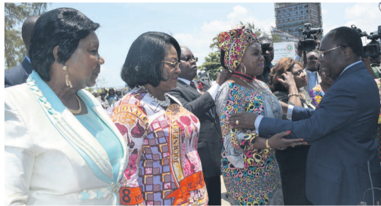
Le Premier ministre décorant les femmes

Dans la capitale économique, la journée internationale de la femme a été marquée par une grande parade féminine sur le boulevard Loango, menée par l'épouse du chef de l'État, Antoinette Sassou N'Gouesso, marraine de l'édition 2018.