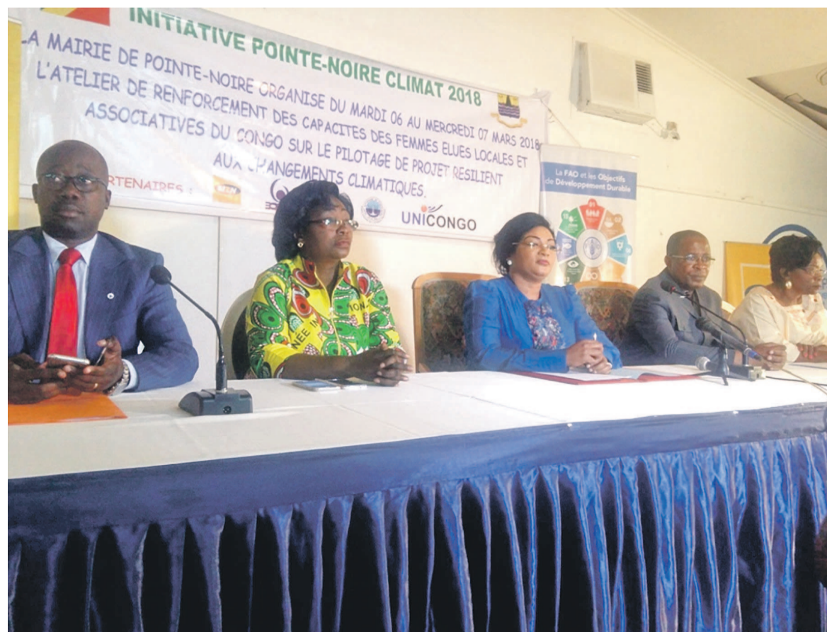
La tribune officielle des travaux