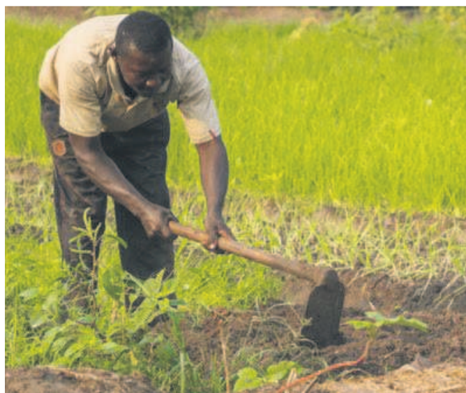
Un maraîcher