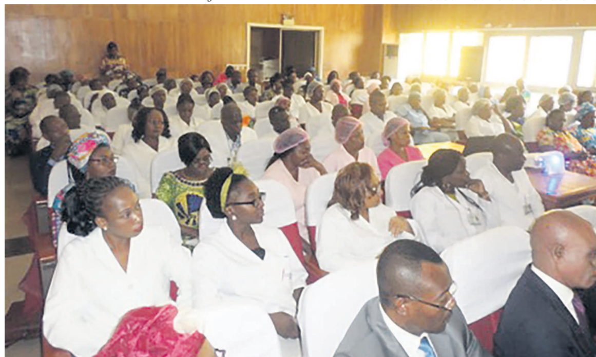
Les participants Adiac

En effet, selon des informations disponibles, les femmes représentent près de 70% de l'ensemble des agents du CHU-B.