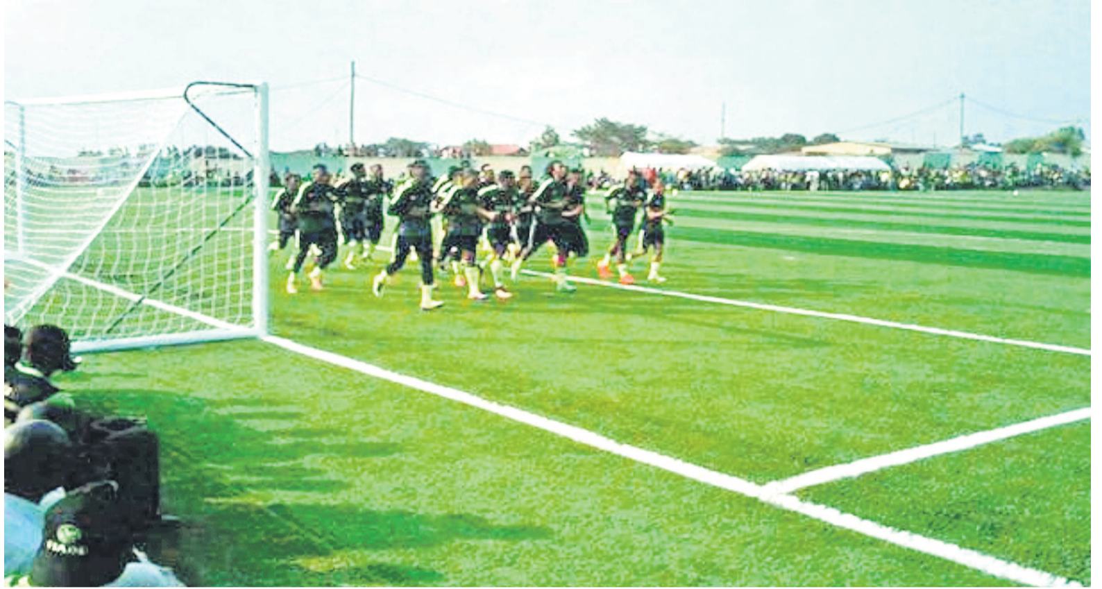
V.Club devra se préparer en conséquence pour surmonter le but encaissé face à Difaa El Jadida au match retour à Kinshasa