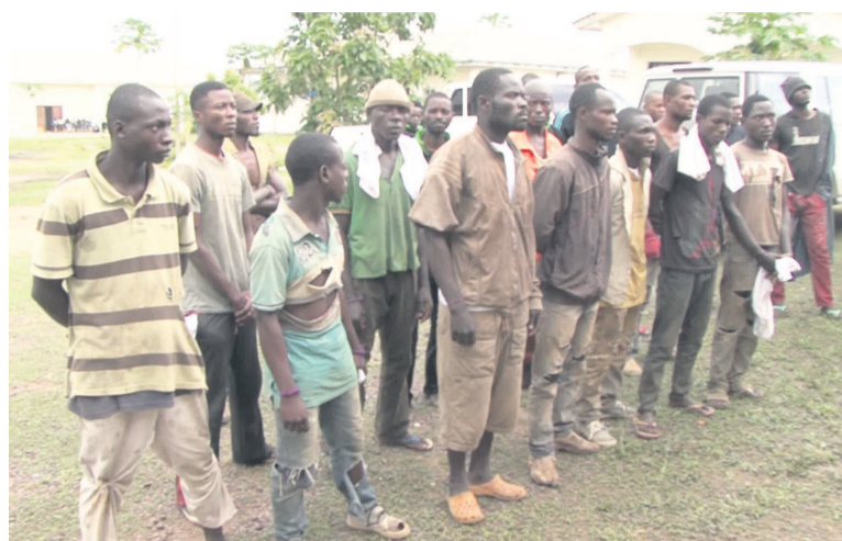
Un regroupement des ninjas à Kinkala