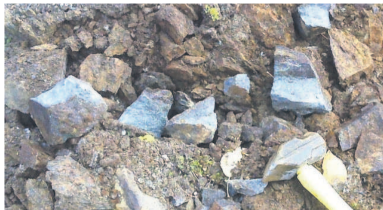
Du cobalt brut

La filiale du plus grand fabricant de smartphones au monde négocie un accord pluriannuel pour acheter le minéral auprès de la Société minière du Katanga (Somika), principalement celui produit dans sa mine de Kisanfu, indique l'agence Bloomberg.