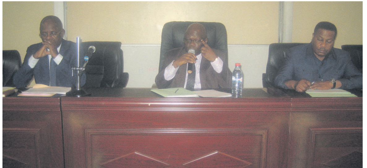
Le présidium (Adiac)