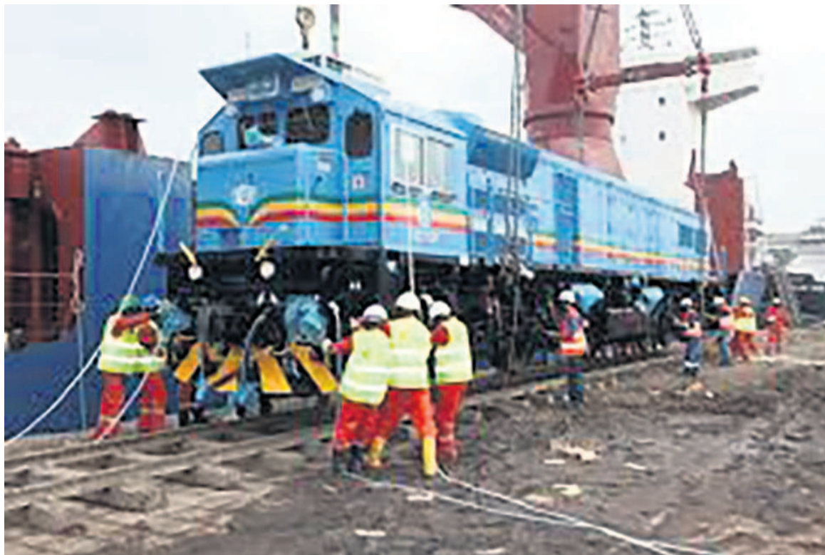
Des ouvriers à l'oeuvre

« Le début de ces opérations était prévu pour ce 24 mars, mais ce