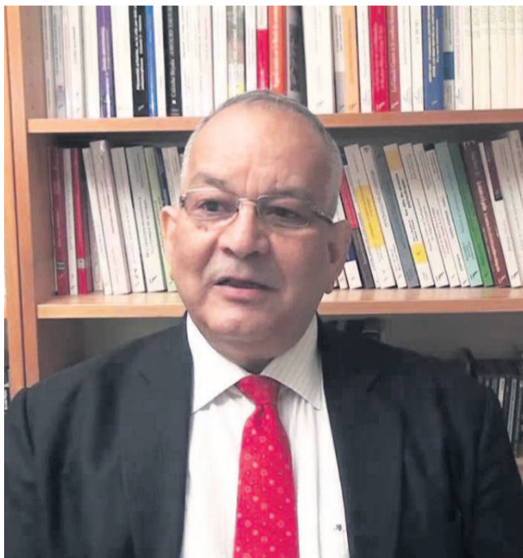
Ahmad Allam-mi

Cet engagement a aussitôt été relevé par le secrétaire général de la CEEAC qui, lui aussi, prône la diversification des économies des Etats membres, afin, a-t-il dit, de rendre la CEEAC plus efficace. Ahmad Allam-mi a ensuite déclaré que « le secrétariat général de la CEEAC