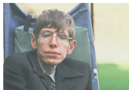
Figure légendaire du monde scientifique, Hawking avait signé plusieurs best-sellers, dont « Une brève histoire du temps », bien que cloué dans une chaise roulante depuis des années en raison de la maladie de Charcot contractée en 1963.

Le célèbre astrophysicien britannique, Stephen Hawking (notre photo), est décédé à l'âge de 76 ans, a annoncé mercredi un porte-parole de la famille, qui a précisé que le professeur était mort paisiblement dans son sommeil à son domicile de Cambridge.