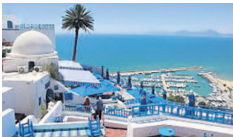
Un site touristique tunisien

Le nombre de touristes prévus en Tunisie pour l'année 2018 pourrait franchir la barre de 8 millions, a annoncé mercredi à Tunis la ministre tunisienne du Tourisme, Salma Elloumi.