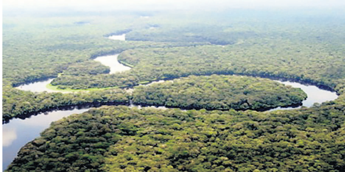
Les tourbières du Bassin du Congo (DR) de la population qui peut être démunie de ses ressources premières avec les retombées des projets. », disent-ils.

A la question de savoir pourquoi ces zones qui emmagasinent