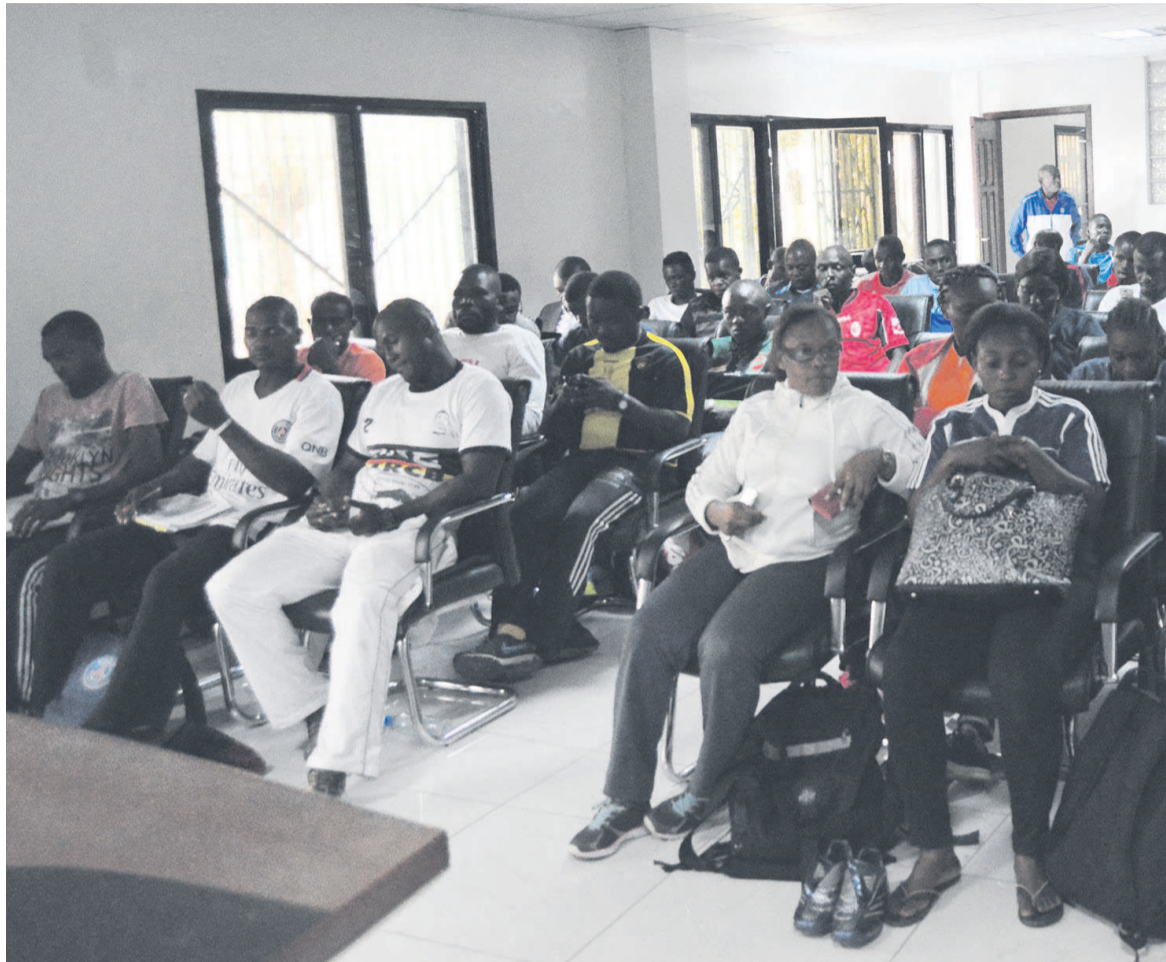
Les stagiaires en formation (Adiac)