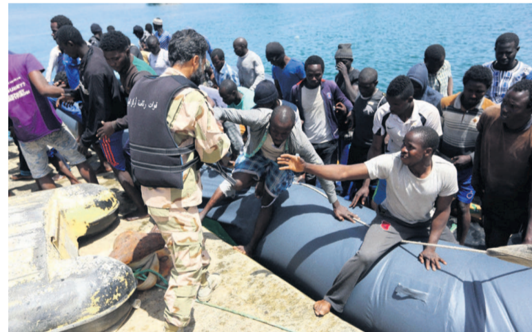
La Libye est devenue le point de départ des migrants vers l'Europe

La deuxième opération, qui a eu lieu au large de Sabratha (à 75 km à l'ouest de Tripoli), a permis de sauver vingt-et-un clandestins, dont des Bangladais et des Egyptiens. Tous ont été transférés dans un centre d'accueil à Tajoura, près de Tripoli.