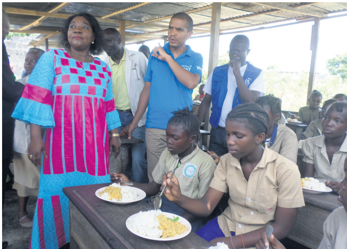
Les représentants de l'Unicef et du PAM assistant à la cantine scolaire à l'école primaire de Djiri-pont/Adiac

bénéficiaire des cantines scolaires du Japon à travers le PAM depuis 2016-2017, la communauté des parents et l'inspecteur, chef de la circonscription scolaire d'Igné, en sont conscients. « Nous sommes très ravis de ce que vous faites pour le Congo, parce que ces vivres font du bien aux enfants et aux parents. 2013-2014, nous étions à deux cents élèves, maintenant ils ne font que s'accroître, grâce aux produits PAM. Les vivres qu'on nous livre ici sont souvent de bonne qualité, appréc-