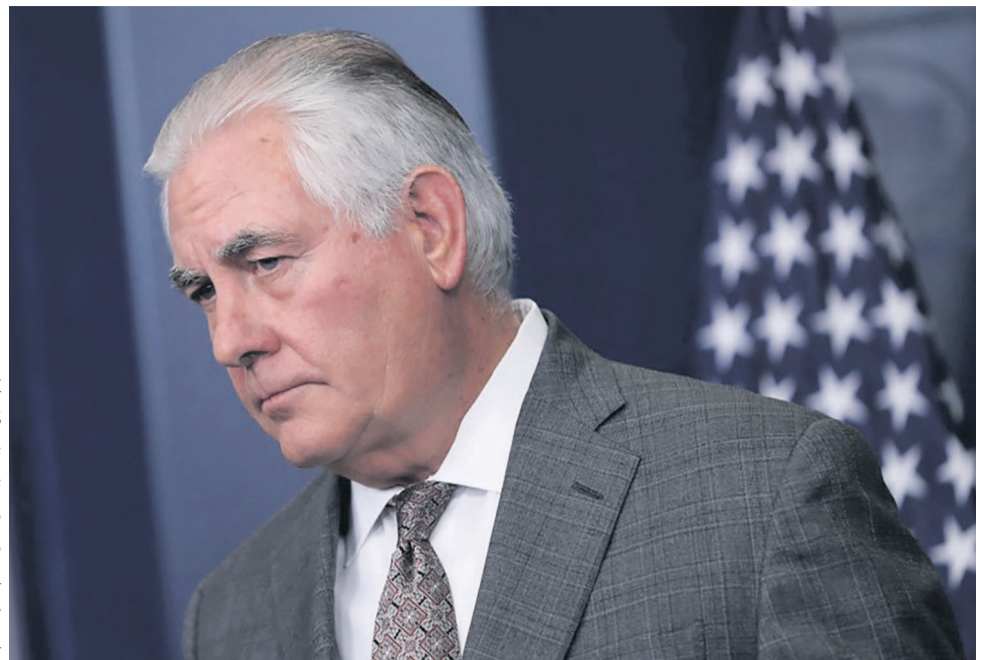
Rex Tillerson

Depuis sa prise de fonction, près de vingt conseillers, secrétaires d'Etat ou très proches de Donald Trump ont démissionné, sont partis sous la contrainte ou en désaccord avec les orientations du 45e président des Etats-Unis. Avant Tillerson, d'autres figures emblématiques avaient déjà fait leurs valises : le directeur du FBI, le conseiller économique, le fameux Steve Bannon, ou le conseiller à la sécurité nationale, Michael Flynn, mi-février ; Reince Priebus, secrétaire général, ancien président du parti républicain ; Sean Spicer, porte-parole. Sans oublier que cinq directeurs de la communication se sont déjà succédé à la Maison-Blanche.