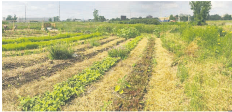
Un jardin affaibli par une insuffisance hydrique

La chaleur qui sévit à Pointe-Noire depuis un certain temps met en péril les cultures maraîchères qui poussent moins qu'en temps normal.