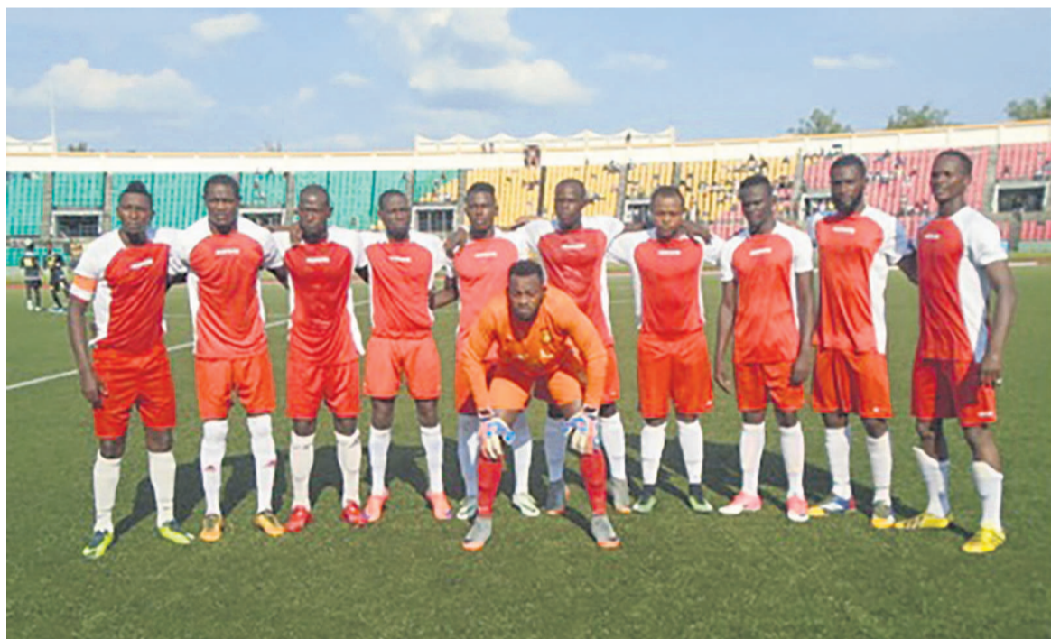
Le FC Kondzo traverse une crise de résultats

Le club a concédé, lors de la 9 e journée, sa septième défaite de la saison en s'inclinant (0-1) face à la Jeunesse sportive de Talangai (JST). Une défaite de trop pour cette équipe.