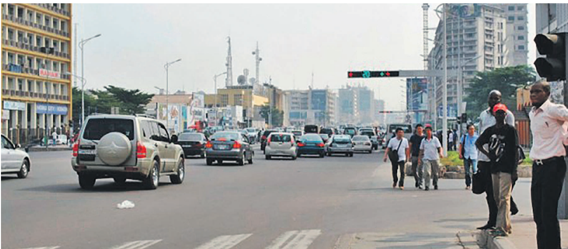
Le centre-ville de Kinshasa

La représentation diplomatique du Nigeria tire la sonnette d'alarme après que des personnes se déclarant du Parquet ont laissé un avis aux habitants d'une de ses propriétés acquises à Kinshasa, les invitant à s'approprier pour déguerpir. Après les épisodes du déguerpissement illégal et la récupération d'une des parcelles de son ambassade située dans la commune de la Gombe à Kinshasa, la représentation