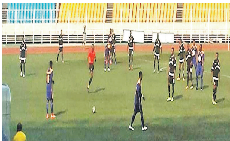
Une vue du match remporté par Lupopo face Rangers à Kinshasa