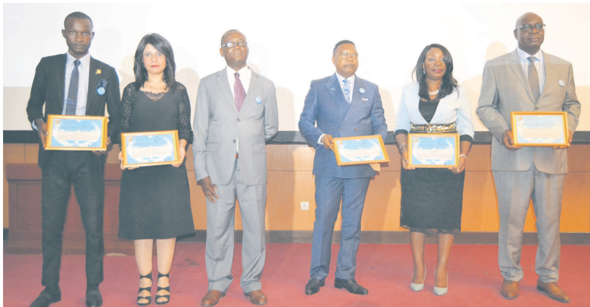
Les six récipiendaires et leurs représentants