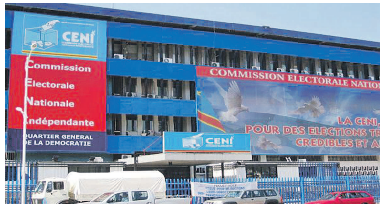
Le siège la Ceni sur le boulevard du 30 juin

La Synergie des missions d'observation citoyenne des élections (Symocél) relève des controverses et un manque de consensus des parties prenantes à propos de la machine à voter et du fichier électoral. Cette ONG redoute l'évolution du processus électoral au regard de sa gestion en cours qui, d'après elle, tend à s'écarter de la consolidation de la