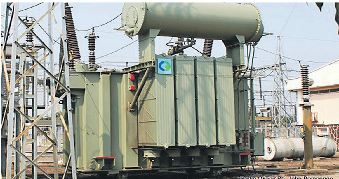
Une cabine électrique de la Snel

« Elle ne suit pas l'évolution de la population et du taux d'accessibilité à l'électricité qui reste très faible », affirme la Banque mondiale.