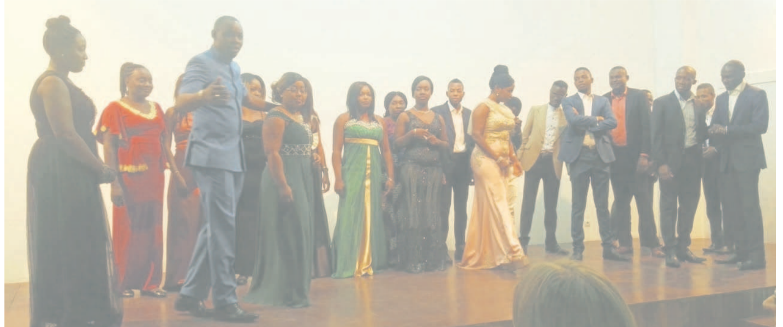
Le Chœur crédo sur scène

L'un des moments forts a été également l'interprétation, très applaudie, de la chanson