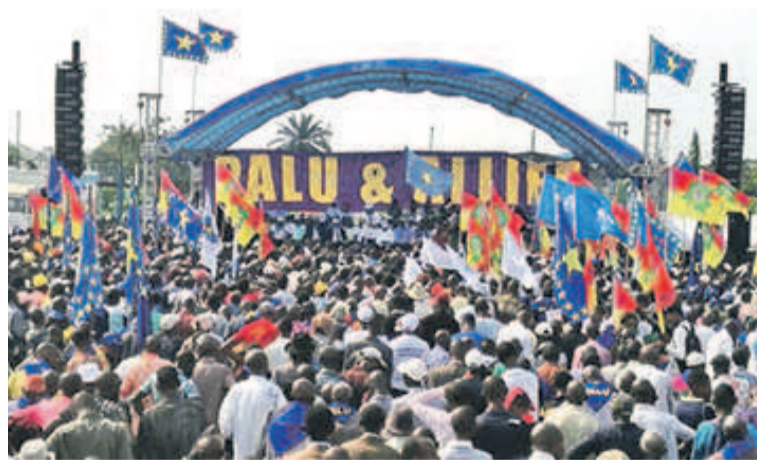
L'ambiance festive à l'occasion du lancement de la plate-forme Palu et alliés

Palu et alliés. Telle est la dénomination de la nouvelle plate-forme venue s'ajouter à celles qui existent déjà dans le microcosme politique congolais. En tant que parti de masse porteur d'une vision progressiste de la RDC qu'il entend accompagner sur la voie de l'émergence, le Parti lumumbiste unifié (Palu) a tenu à fédérer toutes les forces politiques nationales de gauche socialiste et progressiste autour d'un idéal commun, à savoir le développement du pays. C'est tout le sens de la création de la plate-forme Palu et alliés qui s'inscrit en droite ligne dans la vision de réunification de la gauche congolaise prônée par Antoine Gizenga, secrétaire général du Palu. Certes, le patriarche Antoine Gizenga n'a pas pris part à la cérémonie de lancement de ce regroupement politique, le 3 juin, mais est resté de cœur avec tous ceux qui avaient effectué le déplacement de la Foire internationale de Kinshasa où s'est dérou-