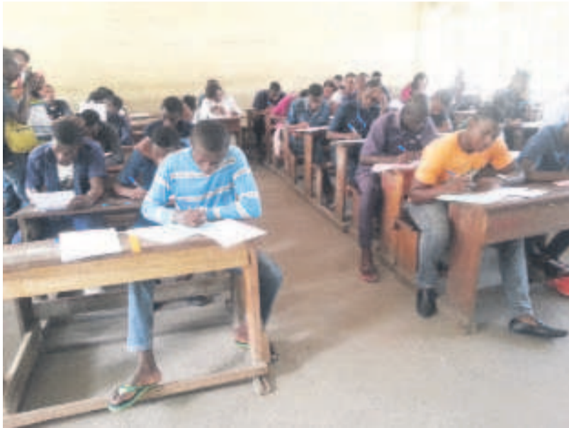
L'ambiance des élèves dans une salle d'examen