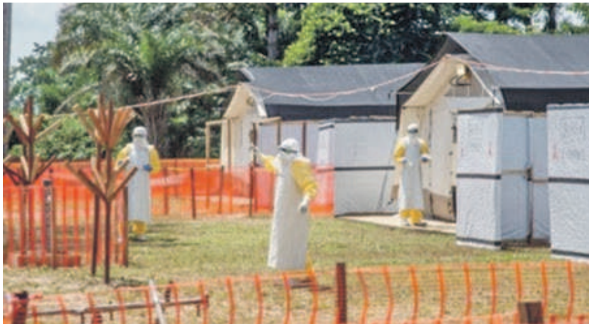
Centre de traitement d'Ébola à Mbandaka

Selon le ministère de la Santé publique, la gratuité des soins est effective dans toutes les quarante formations sanitaires publiques de Mbandaka, chef-lieu de la province de l'Équateur. En effet, avec l'implication de ses partenaires, le gouvernement s'est résolument engagé à arrêter la propagation de la maladie à virus d'Ébola, qui a occasionné à ce jour douze décès et cinquante-six cas de fièvre hémorragique notifiés, depuis sa déclaration le 8 mai dernier. C'est ainsi que dans le cadre de cette lutte, le ministre de la Santé, le Dr Oly Ilunga Kalenga, présidera une cérémonie officielle de remise de soixante-cinq tonnes de médicaments aux formations sanitaires des zones touchées par l'épidémie, lors de son voyage à Mbandaka de cette semaine.