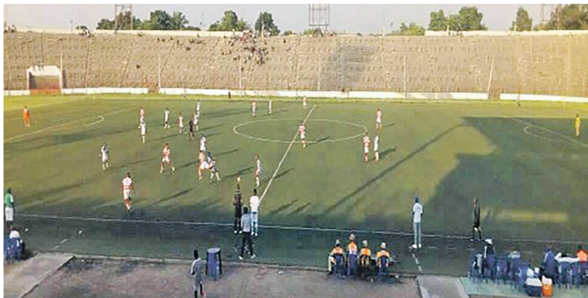
Instantané du match DCMP contre Mont Bleu à Kinshasa

DCMP s'est idéalement remis de sa défaite le jeudi dernier face à V.Club en Play-Off du 23e championnat de la Linafoot en dominant quatre jours plus tard la formation de Mont Bleu par trois buts à zéro.