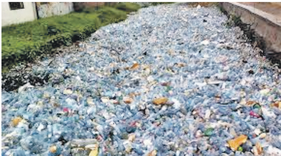
Des bouteilles plastiques obstruant le lit d'une rivière à Kinshasa

Selon cette ONG, l'éco-citoyenneté doit amener à interpeller les pouvoirs publics afin d'agir de manière concertée pour mettre en œuvre des solutions efficaces d'évacuation et de traitement des déchets. A ce titre, elle félicite la récente décision du gouvernement de la RDC de bannir les sachets plastiques non-biodégradables au 30 juin de cette année. Le monde, rappelons-le, célèbre le 5 juin de chaque année, sous l'égide des Nations unies, la Journée mondiale de l'environnement. Pour 2018, elle a été placée sur le thème « La lutte contre la pollution au plastique ». En partenariat avec l'Usaid, WWF a estimé que l'occasion est indiquée de