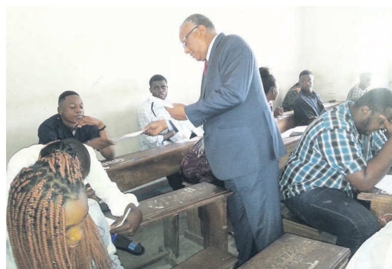
Antoine Thomas Nicéphore Fylla Saint- Eudes supervisant les épreuves

Les épreuves écrites du baccalauréat technique et professionnel ont débuté le 5 juin sur toute l'étendue du territoire national. Le ministre de tutelle, Antoine Thomas Nicéphore Fylla Saint- Eudes, a choisi le lycée technique 5-février, dans le cinquième arrondissement de Brazzaville, pour en donner le coup d'envoi.