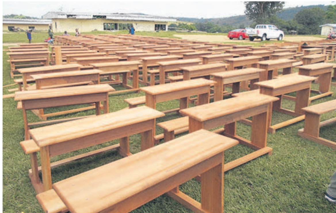
Un échantillon du don des tables-bancs (Adiac)

« Le programme scolaire a été exécuté au-dessus de la moyenne, avec un taux d'exploitation de 80% en général et 100% dans certains établissements scolaires »,