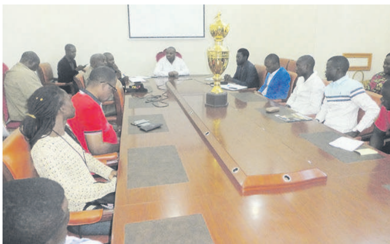
Les participants à la réunion (Adiac)