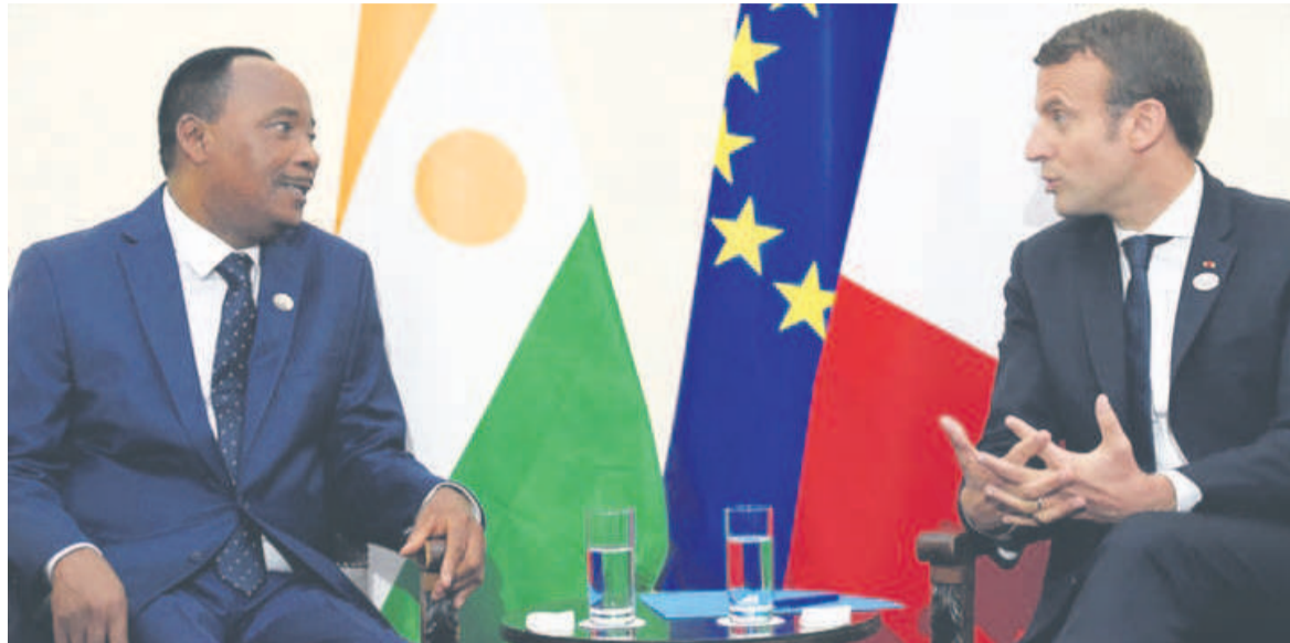
Les présidents Issoufou Mahamadou et Emmanuel Macron

En visite officielle à Paris, le président Issoufou Mahamadou a été reçu par son homologue, Emmanuel Macron, avec lequel il a abordé des sujets de préoccupations communes, notamment des questions de sécurité, de développement et de la migration.