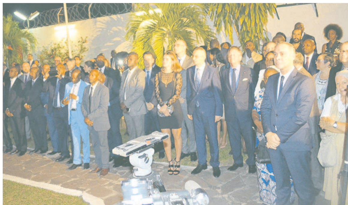
Les participants

« Cette collaboration entre le Congo et ENI qui date depuis l'indépendance a inspiré plusieurs partenaires dans d'autres domaines, notamment celui des infrastructures où plusieurs centaines de millions d'euros de contrat ont été signés pour