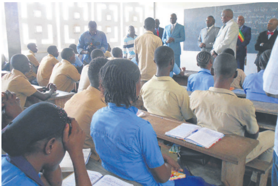
Le ministre lors de l'échange avec les candidats

de Boko, les résultats ont été moins satisfaisants. Au total, seize admis sur cent quatre-vingt-dix-neuf candidats au collège de Kinkala, et trois admis sur quarante et un candidats au collège de Boko.