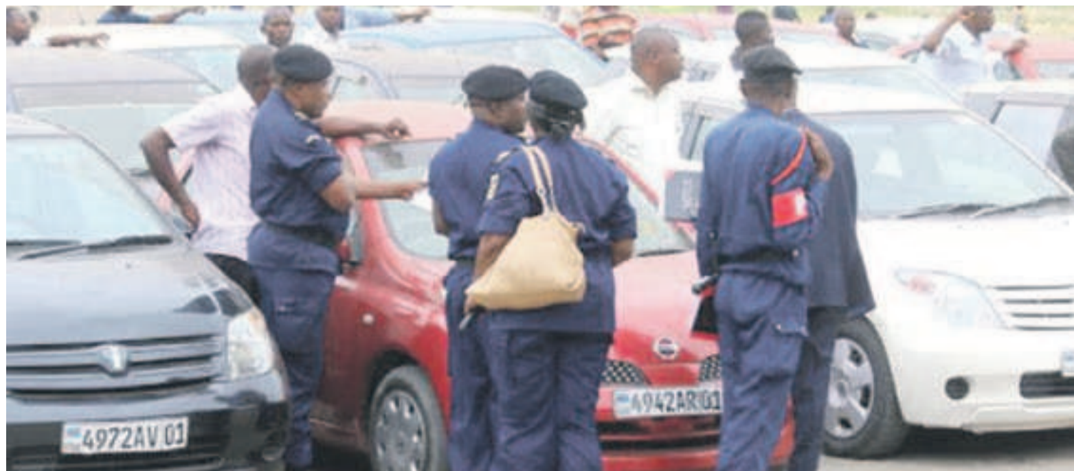
Contrôle de la police dans une artère de Kinshasa

Pour le numéro 1 de la police nationale-ville de Kinshasa, en effet, à partir de cette date, tous les taxis identifiés comme tel qui n'auront pas de numéro d'enregistrement,