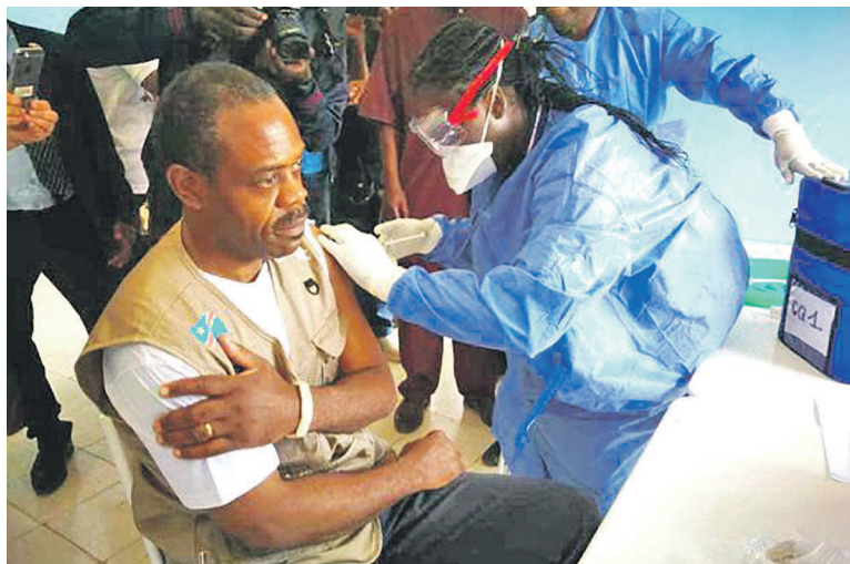
Le ministre de la Santé, le Dr Oly Ilunga, se faisant vacciner contre le virus Ebola

La République démocratique du Congo (RDC) fait face, depuis le 8 mai dernier, à la neuvième épidémie de la maladie à virus Ebola. Cette situation on ne peut plus préoccupante n'a pas laissé indifférent le gouvernement congolais qui a mis en place un comité de coordination pour la riposte contre cette maladie dont le premier cas a été notifié dans la zone de santé de Bikoro, en Équateur. Un mois après, le constat qui se dégage est que la courbe est à la baisse et les chaînes de transmis-