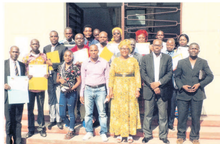
Photo de famille après la remise des certificats

Initié par l'Association universelle pour le développement communautaire intégral (ADCI), en partenariat avec Consulting futur de Paris, en France, le stage visait à renforcer les capacités des agents et cadres des administrations publiques et privées, des ONG et des étudiants.