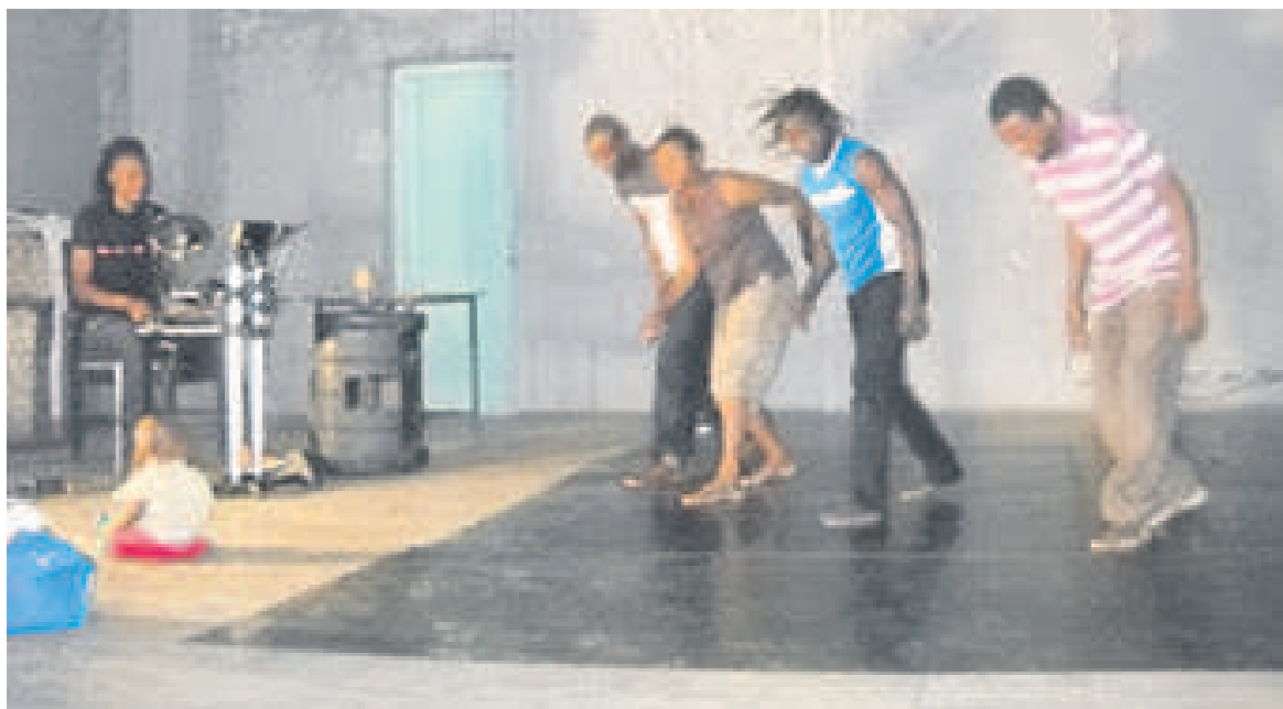
Les artistes en pleine répétition