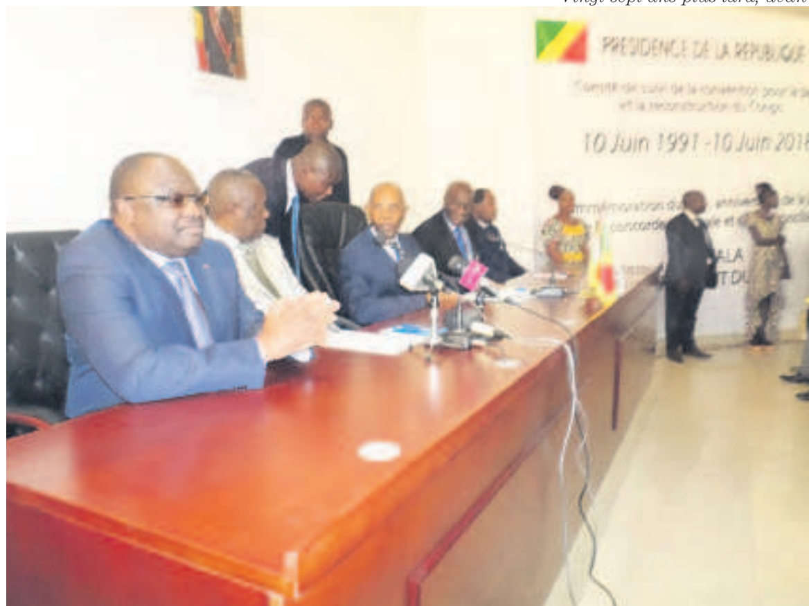
La tribune officielle (Adiac)