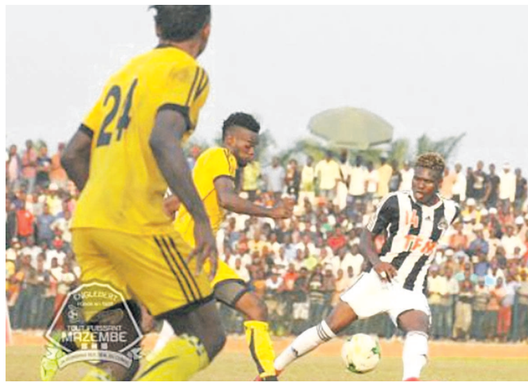
Vue du match Maniema Union contre Mazembe à Kindu

Le week-end a été positif pour les clubs du big five du Play-Off de la 23e édition du championnat national de football. Mazembe, Daring Club Motema Pembe, V. Club et Lupopo ont tous été victorieux face respectivement à Maniema Union, CS Don Bosco, JS Groupe Bazano et Dauphin Noir. Le Play-Off reste encore ouvert et les trois places qualificatives pour les compétitions africaines interclubs vacantes.