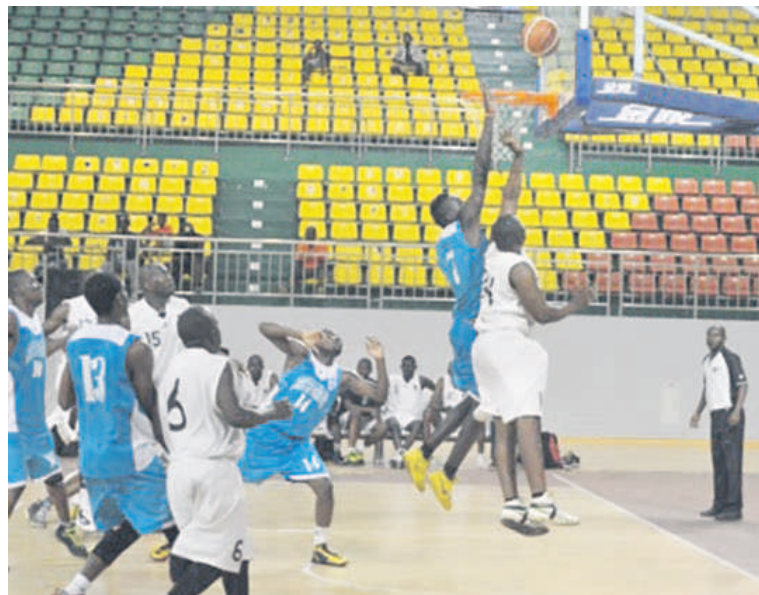
Une rencontre de l'équipe militaire du Congo

sa première édition, est dénommée « Trophée Denis-Sassou-N'Guesso » et prendra fin le 19 juin. « Pour cette première édition, nous n'avons pas organisé de tournoi qualificatif pour permettre à