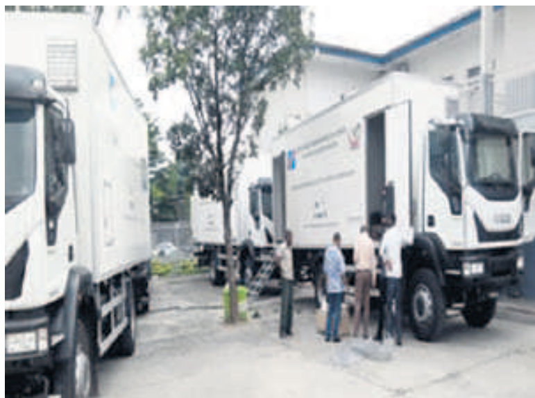
Les unités mobiles contribueront à la lutte contre la tuberculose en RDC