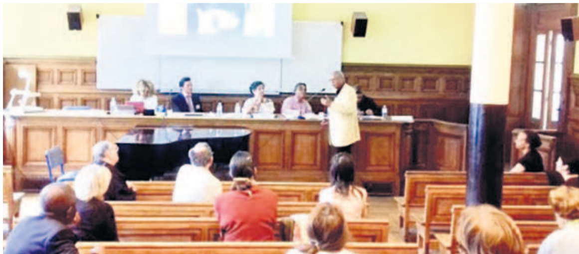
L'écrivain Henri Lopes portant des précisions à l'auditoire de la Journée d'études « Réinventer la vie, prophétiser le réel.