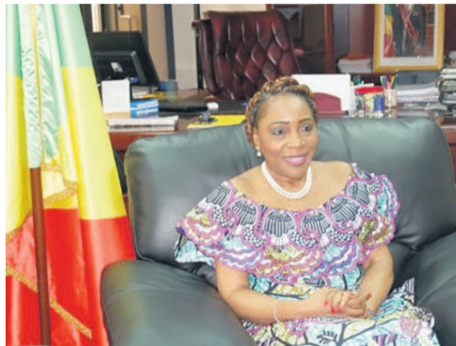
La ministre du Plan, Ingrid Ebouka-Babackas

Un atelier national va regrouper les cadres des ministères sectoriels, les organisations de la société civile ainsi que les partenaires techniques et financiers. L'élaboration du Plan national de développement (PND) 2018-2022 traduit les efforts de sortie de crise que fournit le gouvernement de la République, a estimé Ingrid Ebouka-Babackas, la ministre du Plan, de la statistique et de l'intégration régionale. « Ce PND est un dispositif