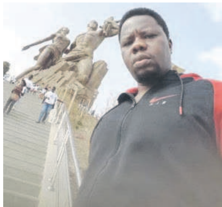
Lexus Legal à Dakar, la veille du Focus

L'événement international accueille des participants venus du monde entier. C'est au total vingt et un pays qui se sont donné rendez-vous à la seconde édition