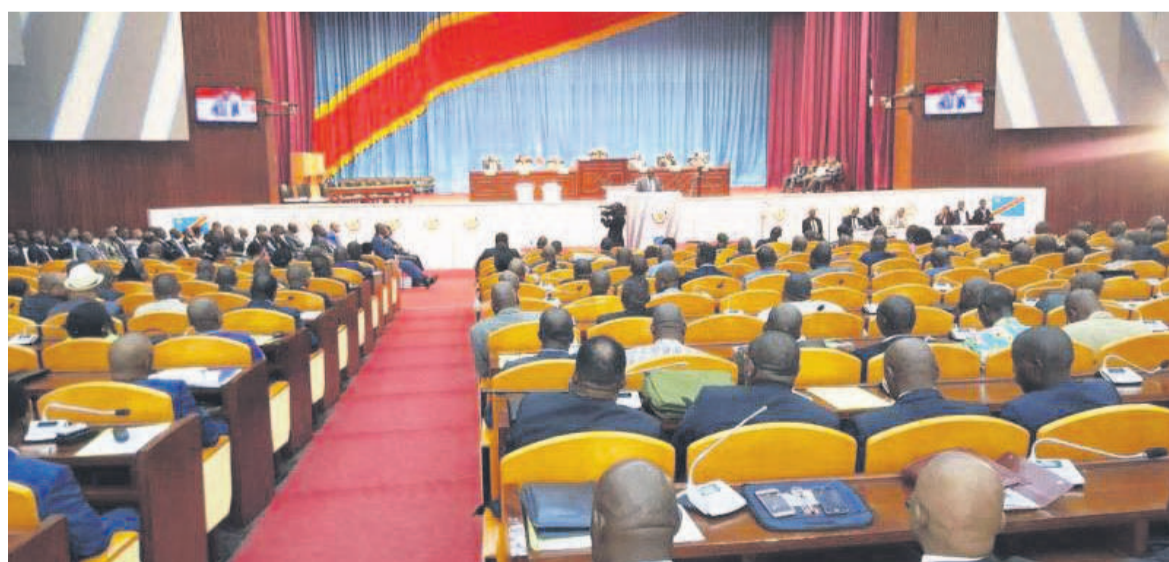
La salle de congrès du Palais du peuple

Le président de la République va s'adresser incessamment à la nation devant le parlement réuni en congrès, au cours d'une session extraordinaire en instance d'être convoquée. Dans l'opinion, les spéculations vont bon train, surtout que le contexte politique s'y prête bien pour que le chef de