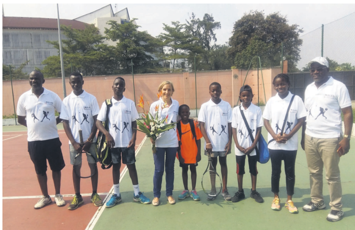
La photo de famille après les entraînements