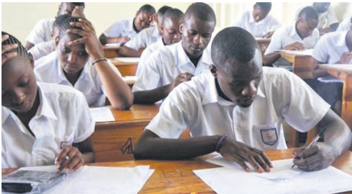
Des finalistes en pleine session d'examen

La session ordinaire de l'Examen d'Etat a débuté hier sur toute l'étendue du territoire national de la RDC. D'après le ministre de l'Enseignement primaire, secondaire et professionnel, 672 209 candidats repartis dans 1 964 centres, se sont présentés pour participer à ces épreuves sanctionnant la fin des études secondaires, lesquelles ont été officiellement lancées à Kalemie, dans la province du Tanganyika, par le ministre Gaston Musemena.