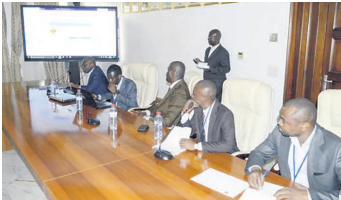
Les participants à la présentation du nouveau dispositif

L'acquisition du logiciel informatique, a ajouté l'administrateur indépendant de l'ITIE, va aider sa structure à accéder facilement aux informations préalablement validées par les services habilités de l'Etat. « Ce qui fera gagner du temps dans la gestion des informations liées au secteur extractif en République du