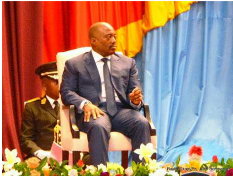
Joseph Kabila Kabange

A peine les rideaux sont tombés sur la session ordinaire de mars, officiellement clôturée le 15 juin, qu'une nouvelle s'apprête à être convoquée. Sénateurs et députés n'auront donc pas de moment de répit car, incessamment, ils vont renouer avec l'hémicycle, cette fois-ci en session extraordinaire pour parachever le processus d'adoption de certains projets de loi laissés en suspens. Toutefois, l'intervention du chef de l'Etat, Joseph Kabila, devant le parlement réunis en congrès, pourra voler la