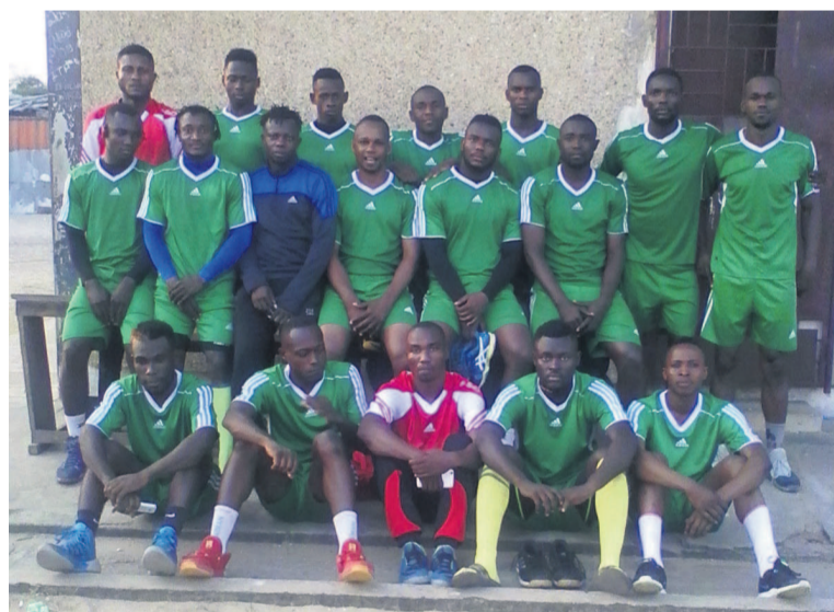
L'équipe Caïman après l'entraînement au lycée Poaty-Bernard

L'équipe a choisi la ville de Pointe-Noire pour peaufiner le travail qu'il a commencé à Brazzaville, dans le cadre des préparatifs du championnat national prévu du 29 juillet au 10 août.