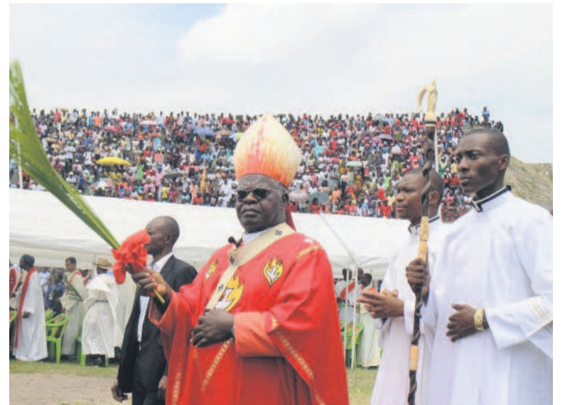
Le cardinal Laurent Monsengwo officiant un culte au Stade des martyrs

Pasinya. Une pétition est en marche et les premières signatures sont en train d'être récoltées dans l'objectif d'arracher du cardinal son accord à postuler à la présidentielle de décembre prochain. Reste à savoir si l'intéressé répondra favorablement ou s'il va réserver une fin de non recevoir à cette requête.