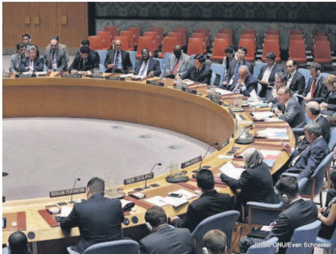
Une vue de la salle de réunion du Conseil de sécurité des Nations Unies

Quelques heures seulement après le discours du président Joseph Kabila sur l'état de la nation, prononcé le 19 juillet devant le parlement réuni en congrès, le Conseil de sécurité de l'Organisation des Nations unies (ONU) et le Conseil de paix et de sécurité de l'Union africaine (UA) ont tenu une réunion au terme de laquelle un communiqué conjoint a été publié. Les deux institutions ont donné, à travers ce communiqué, leur position sur le déroulement du processus politique en RDC à la lumière du discours-bilan du chef de l'Etat. Les deux Conseils ont invité les parties prenantes