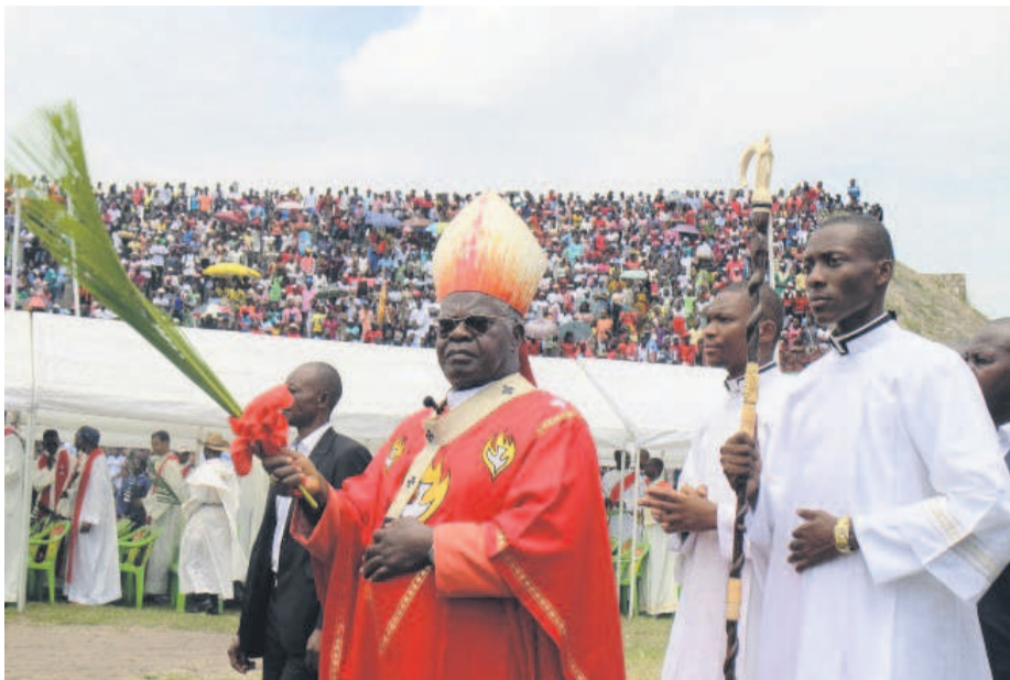
Le cardinal Laurent Monsengwo officiant un culte au Stade des martyrs

La cérémonie de lancement de cette pétition a eu lieu le 20 juillet, à Kinshasa, en présence d'un parterre de journalistes et de nombreux invités. Les initiateurs ont fait fi des charges ecclésiastiques