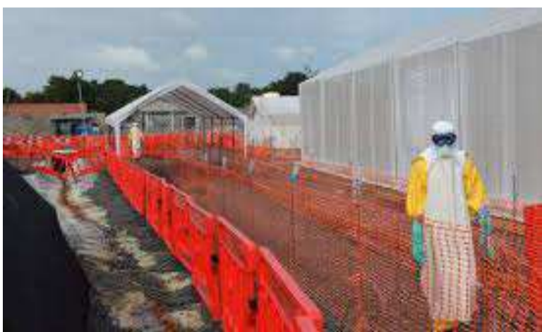
La destruction de structures des soins des malades d'Ebola ralentit les efforts de lutte contre cette maladie

Dans un communiqué qu'il a rendu public, le ministère de la Santé publique condamne sans ambages les actes de destruction de certaines structures de soins ainsi que des agressions dont sont victimes ses agents dans la province.