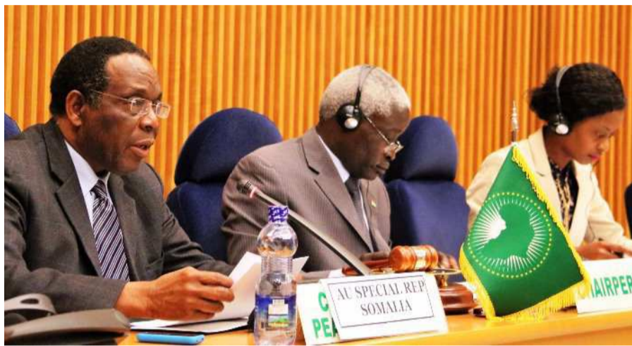
Des membres du Conseil de paix et de sécurité (CPS) de l'Union africaine (UA)