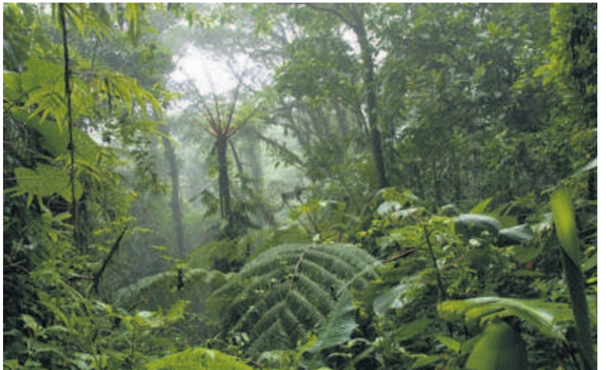
La forêt doit être bien protégée

La société civile environnementale, fait savoir l'«Agence congolaise de presse» qui donne cette information, estime que des actions isolées tentant de résoudre les problèmes qui se posent dans la gouvernance forestière sont inefficaces face au maintien d'un moratoire vieux de quinze ans sur l'attribution de nouvelles concessions forestières et aux évolutions de processus relatifs à réduction des émissions de gaz à effet de serre dues à la déforestation et à la dégradation des forêts, à la foresterie communautaire et aux réformes sectorielles en cours en matière forestière, foncière et d'aménagement du territoire. Pour amener le gouvernement à doter le pays d'un cadre apaisé dans lequel toutes les parties ont droit au chapitre, la société civile a opté pour une approche globalisante du cadre général