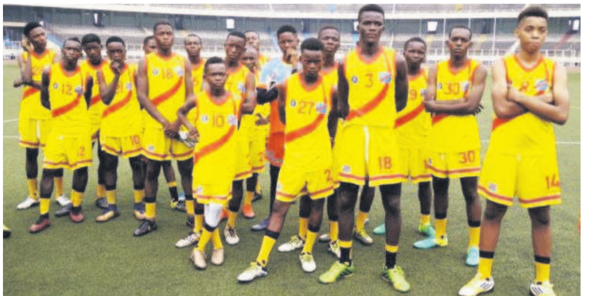
Les Léopards U15 de la RDC se retirent des JA de la jeunesse Alger 2018

Partis pour Alger afin de prendre part à l'édition des Jeux 2018, les Léopards football de moins de 15 ans retournent au pays sans avoir livré le moindre match.