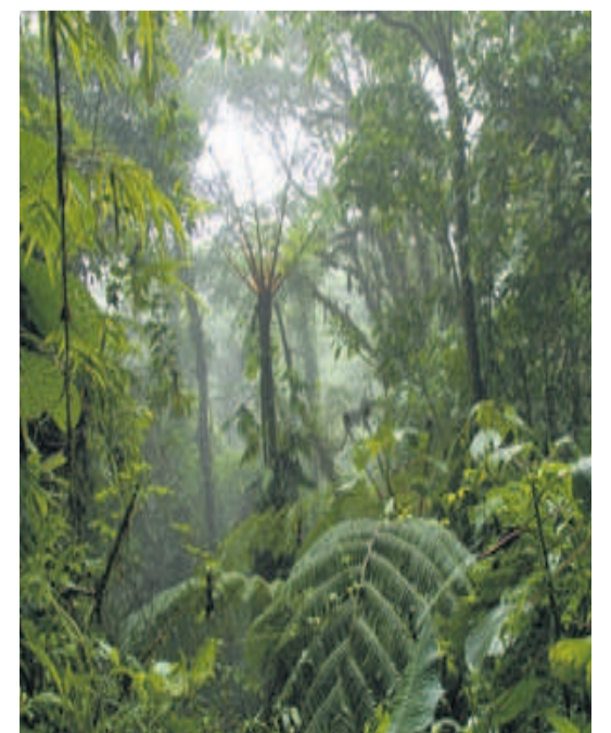
La forêt doit être bien protégée