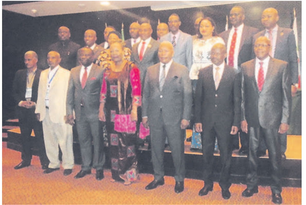
Une vue des responsables des parlements de la CIRGL

gislatureurs qui veulent participer à l'édification d'une Afrique de l'espérance, loin des images qui la réduisent aux pandémies, aux guerres et à toutes les calamités du monde. A l'issue de ces assises, nous ferons des propositions concrètes permettant de garantir la meilleure gestion de nos Etats mais aussi de combattre le détournement des