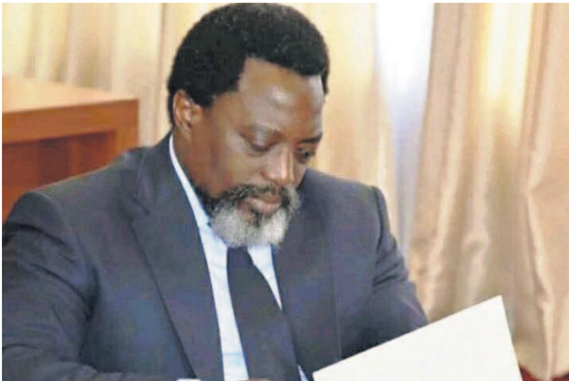
Joseph Kabila Kabange