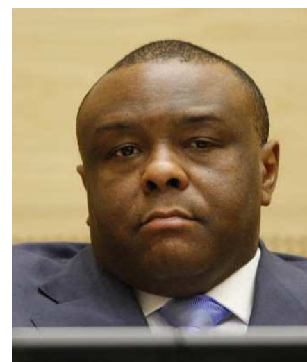
Jean Pierre Bemba