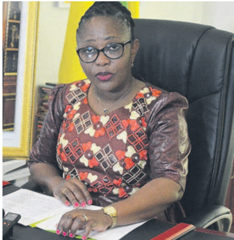
La ministre Jacqueline Lydia Mikolo

39% à 25%. La tendance régressive touche également les taux d'allaitement maternel continu à un et deux ans. « On observe aussi, au cours de la même période, la diminution de la durée moyenne d'allaitement qui est passée de 17 à 15,6 mois contre la durée de vingt-quatre mois ou plus recommandée par l'OMS et l'Unicef », a souligné Jacqueline Lydia Mikolo. Ces faibles taux sont le reflet de la persistance de mauvaises pratiques en matière d'allaitement maternel et risquent d'être une contrainte à l'atteinte de l'objec-