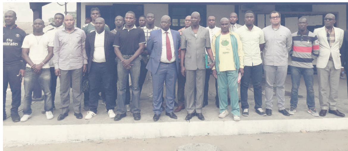
Les membres du comité national de full contact et kick boxing (Adiac)

Les instances dirigeantes de la structure ont été montées après l'assemblée constituante tenue récemment à Brazzaville.