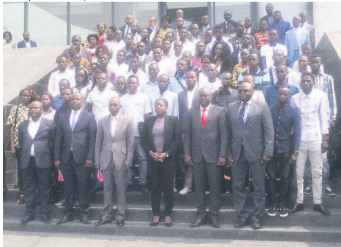
La ministre Destinée Hermella Doukaga entourée des officiels et des jeunes sélectionnés pour la formation Adiac

« J'exhorte tous les participants à plus d'ardeur et d'abnégation en participant efficacement à cette formation sur les TIC et par laquelle ils devront acquérir des compétences attestées à l'informatique. Cela engendrera leur autonomisation, en devenant compétitifs sur le marché de l'emploi »