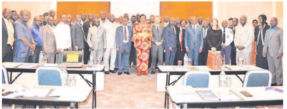
Les parties posant en famille

L'importance qu'accorde la communauté internationale à la survie de l'animal suscite à la fois admi-