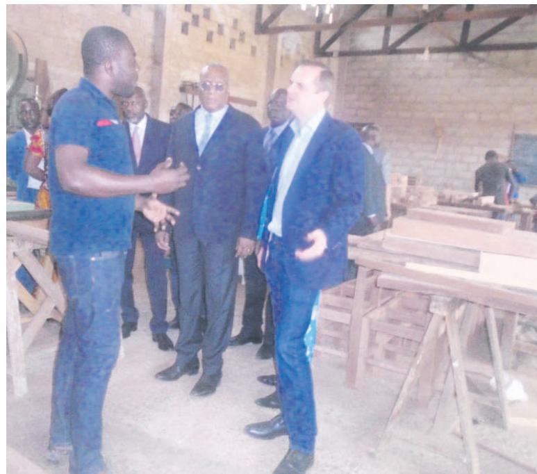
Le ministre Fylla Saint-Eudes et le DG de la CIB visitant l'atelier de menuiserie au centre Don Bosco