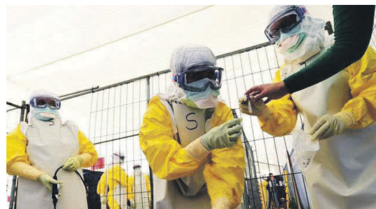
La riposte contre la maladie à virus Ebola au Nord-Kivu se met en place

Depuis l'annonce, le 1er août, de la dixième épidémie de la maladie dans l'aire de santé de Mangina, dans le territoire de Beni, le gouvernement et ses partenaires se mobilisent pour arrêter sa propagation. L'Unicef vient d'envoyer une équipe d'experts dans la province du Nord-Kivu afin d'endiguer la maladie. L'agence onusienne a, en effet, déployé une équipe de cinq collaborateurs à Beni, dont deux spécialistes de la santé, deux spécialistes de la communication et un spécialiste en eau, assainissement et hygiène. Le déploiement supplémentaire du personnel venant de Kinshasa et des bureaux de terrain de Goma, Bunia et d'autres lieux est en cours de finalisation. Page 2