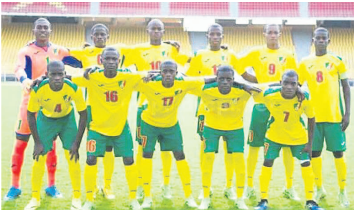
Les Diabiles rouges U-17

En rappel, la Confédération africaine de football (CAF) avait pris une décision importante lors du Symposium africain de football, réformant l'organisation des éliminatoires de la CAN des moins de 17 ans. Désormais,