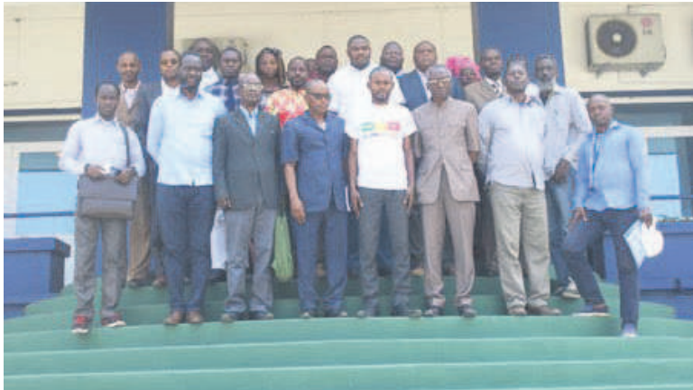
La photo de famille lors de la présentation de Pro-école/Adiac

Pour contribuer à l'amélioration du système éducatif du pays, le Groupe Ruschty Cadol (GRC) a développé «Pro école», une application android permettant aux parents et aux écoles de gérer et de suivre la scolarité des élèves et étudiants.