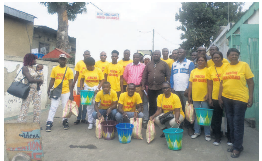
Les membres de la fondation (Adiac)

« C'est une action qui s'inscrit dans la dynamique que nous avons engagée depuis bientôt six ans. Il s'agit d'être au service des autres, de nos compatriotes. Le nombre de fois ne nous intéresse pas, nous savons tout simplement que le peuple congolais est dans la souffrance, il est important surtout pour moi qui suis un homme politique de pouvoir mettre l'homme au centre de mon action. Donc, c'est en réalité le social que nous faisons »