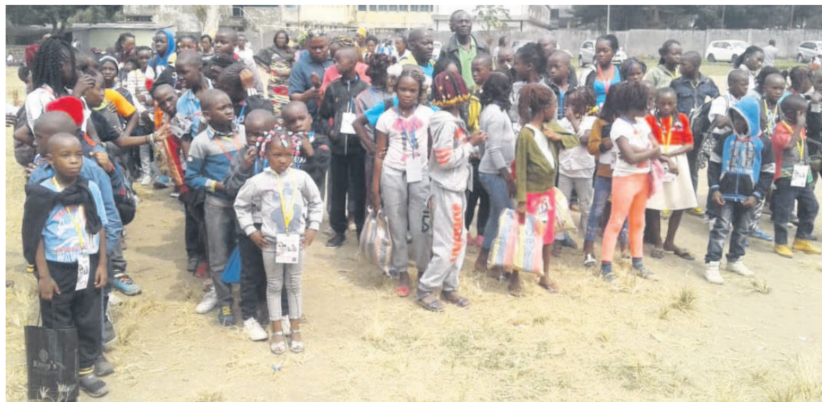
Les jeunes de la 6e édition