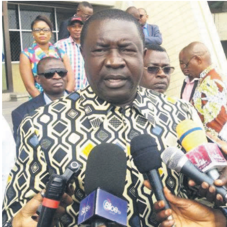
Le ministre des Sports et loisirs, Papy Niango

Le sélectionneur des Léopards est en fin contrat depuis février 2018, après quatre ans passés à la tête du staff technique national. La Fédération congolaise de football association (Fécifa) a pris l'option de prolonger son contrat. Mais l'administration des Sports n'a visiblement pas adhéré au choix de son organe technique. Ainsi, Ibenge travaille depuis pratiquement sept mois sans contrat. Pour Papy Niango, la Fécifa doit évaluer la prestation et dégager le bilan de prestation de Florent Ibenge avant un éventuel renouvellement de son contrat. Papy Niango a, à cet effet, prononcé des phrases assez dures. « Si mes prédécesseurs ont eu pour copains des dirigeants, membres des staffs techniques de nos équipes nationales, moi je n'ai pas de copain. On sert tous la République, on n'a pas besoin d'états d'âme. On ne sert pas l'État avec des individus selon leurs visages. On sert la République avec des énergies qui peuvent faire fonctionner la machine de l'État... », a-t-il déclaré. « Qui peut dire que