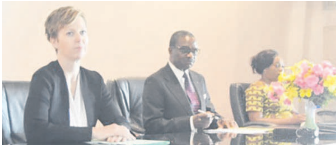
Le présidium à l'ouverture de l'atelier

« Le paludisme est la première cause de consultation 69,8%, d'hospitalisation 64,8% et de mortalité 18,4%. Pour les moins de 5 ans, le paludisme représente 52,8% de cause de consultation externe, 44,1% des causes d'hospitalisation et 28% des causes de décès dans les hôpitaux »