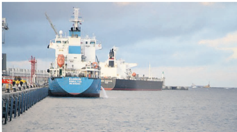
Navires à quai dans un port maritime d'Afrique

A cela s'ajoutent d'autres initiatives régionales, épinglées par le président de l'Acodm, à savoir la décision des pays de la Com-