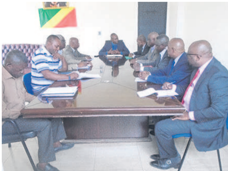
Les membres de la commission électorale reçus par le directeur général des Sports/Adiac

La structure a décidé de multiplier les contacts avec la tutelle en vue de témoigner sa volonté de communiquer, à chaque étape, sur l'évolution des préparatifs de l'élection prévue pour le 25 septembre.