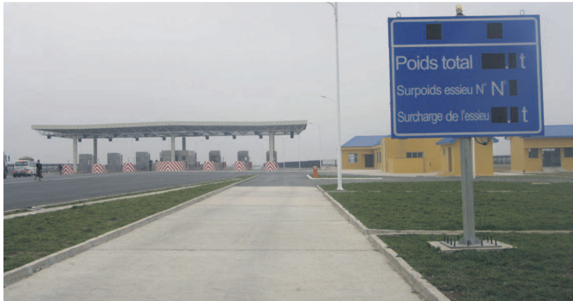
Le poste de péage de Yié

pendant, l'O2CD émet de sérieuses inquiétudes sur les risques d'inflation générés par l'entrée en vigueur de ces tarifs sur les billets de transport et les denrées alimentaires », a averti Mer-