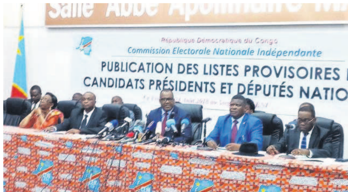
Les responsables de la Céni rendant publics les résultats de leurs délibérations

Ils sont 15 222 candidats à avoir été validés par la Centrale électorale qui a jugé recevables leurs dossiers de candidatures sur un total de 15 505 candidatures reçues. 283 dossiers ont donc