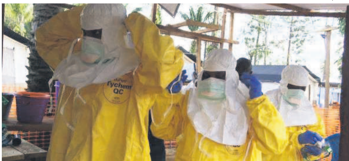
Des soignants s'équipant au centre de traitement Ebola de Mangina dans le Nord-Kivu.

Au total, cent trois cas de fièvre hémorragique ont été signalés dans la région, dont soixante-seize confirmés et vingt-sept probables. Sur les soixante-seize cas confirmés, neuf sont guéris, trente et un sont hospitalisés et trente-six sont décédés. Treize cas suspects sont en cours d'investigation et deux nouveaux décès de cas confirmés ont été rapportés à Mabalako. Depuis le début de la vaccination, le 8 août, deux mille six cent treize personnes ont été vaccinées, dont