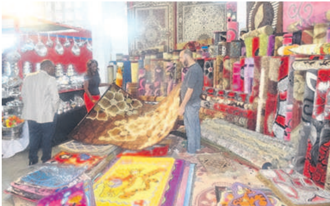
Visite du stand des tapis