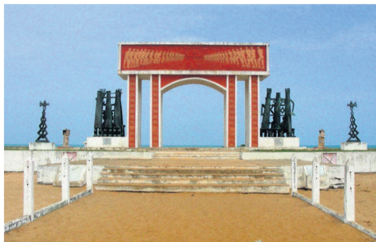
La «Porte du non-retour», plantée au bord de l'océan Atlantique

Plusieurs centaines d'Afro-descendants étaient, le 23 août, à la «Porte du non-retour» de la ville historique de Ouidah, une terre de mémoire douloureuse, pour rendre hommage à leurs aïeux capturés, déportés et mis en esclavage, à l'occasion de la célébration de la Journée internationale du souvenir de la traite négrière et de son abolition.