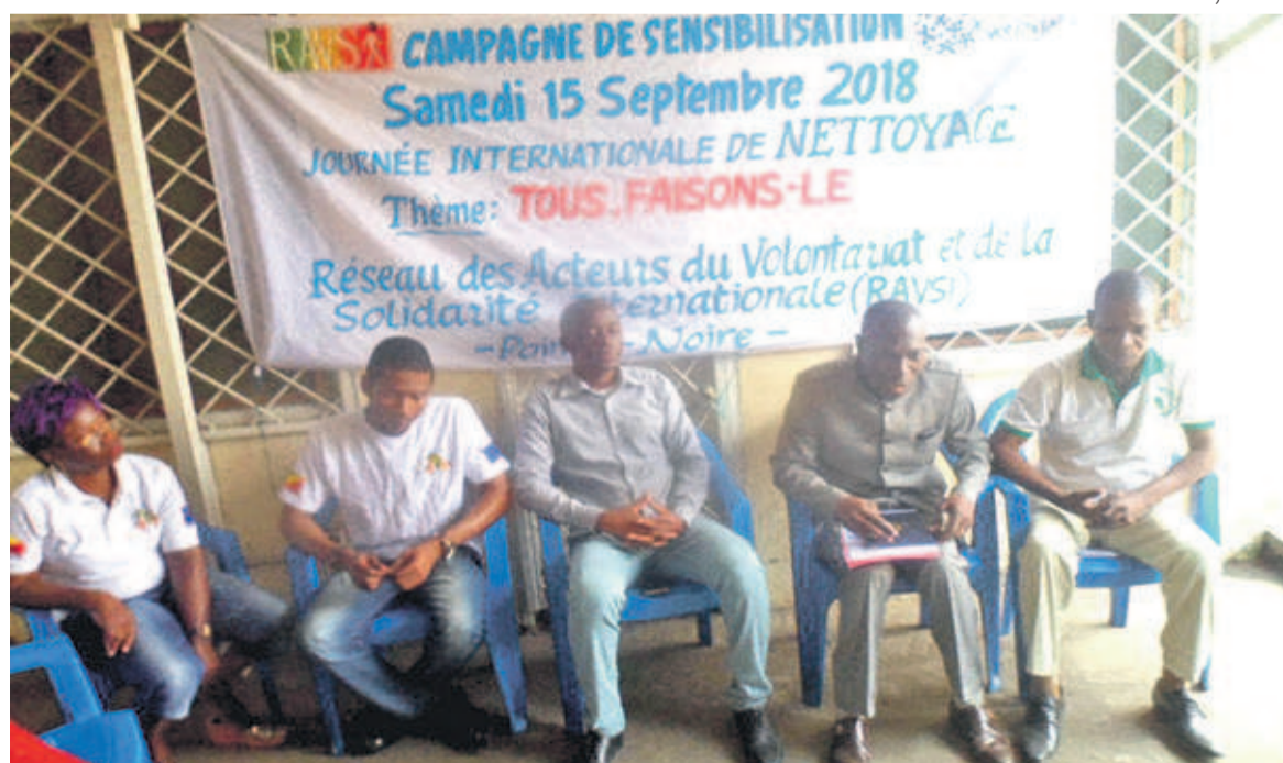
Les membres Ravsi lors du focus