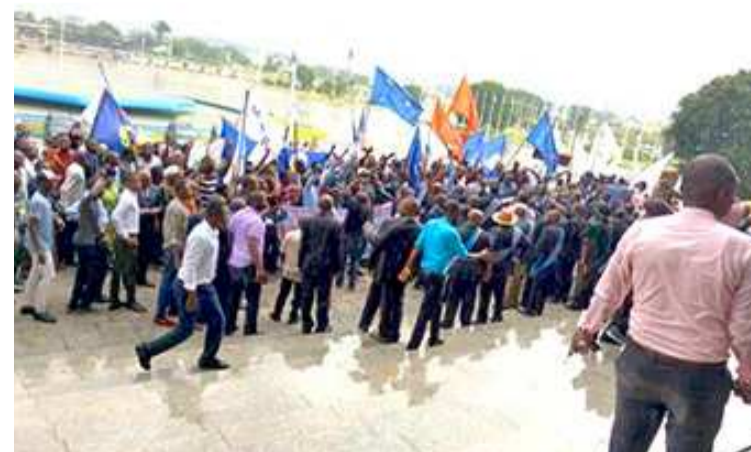
Des manifestants devant l'entrée du Palais du peuple