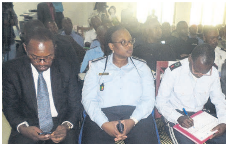
Des membres de la force publique.