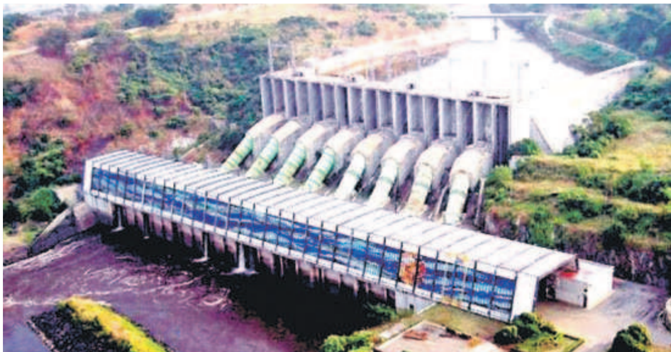
Le barrage d'Inga

Quarante organisations de la société civile se déclarent préoccupées par le manque de transparence et de surveillance démocratique du projet. Elles ont appelé, le 18 septembre, à un moratoire sur la signature de tout accord de col-