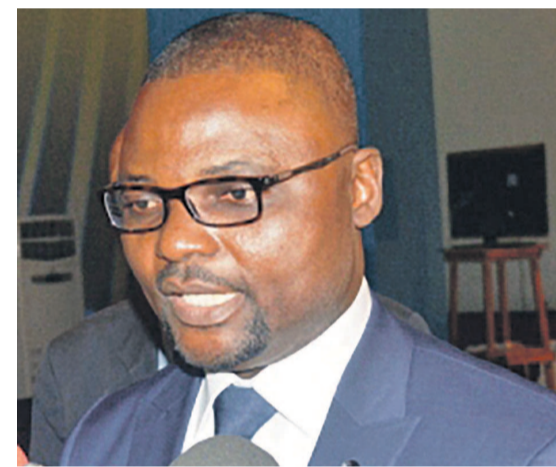
Le ministre des PT-NTIC Emery Okundji

Cette option fait partie des résolutions de la rencontre d'experts qui se tient depuis le 18 septembre, à Kinshasa, avec comme objectif, l'évaluation de la disponibilité de la RDC à constituer une équipe de lutte contre la cybercriminalité. Ces travaux se tiennent dans le cadre de la résolution 58 de l'Assemblée mondiale de la normalisation des télécommunications, tenue en 2012 à Dubaï. Le pays propose la création d'un centre national qui sera constitué d'équipes d'intervention en cas d'incident informatique.