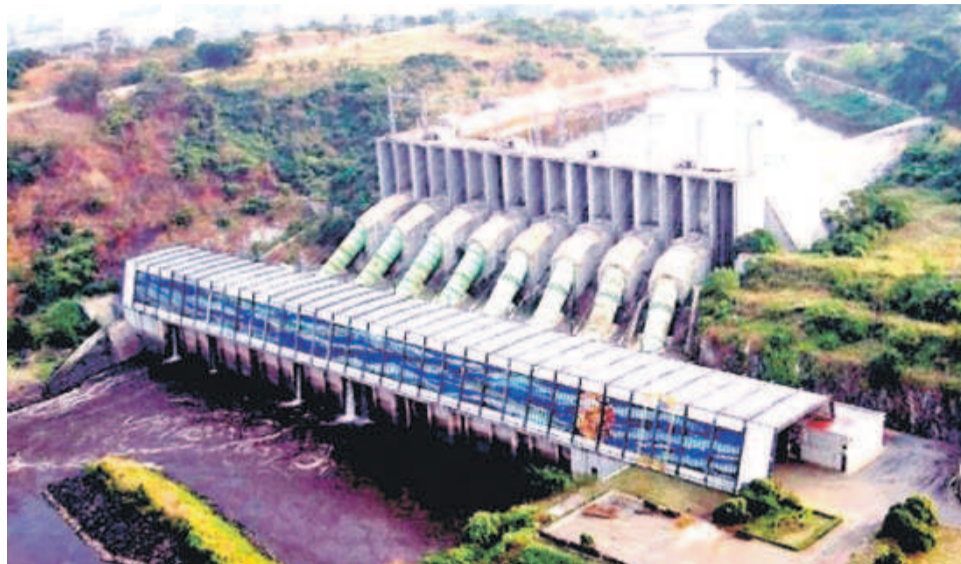
Le barrage d'Inga

Depuis lors, une certaine léthargie s'est installée dans l'exécution du projet. L'opacité qui entoure ce dossier laissé aux bons soins de la présidence de la République alimente les spéculations de tout genre. Rien ne filtre sur les différents contrats obtenus ni sur l'évolution du projet, à en croire les associations membres de la Coalition des organisations de la société civile pour le suivi des réformes et l'action publique qui ont exprimé, le 18 septembre, leur désappointement. Elles sont quarante ONG œuvrant dans le secteur de la gouvernance des ressources naturelles à avoir plaidé, au cours