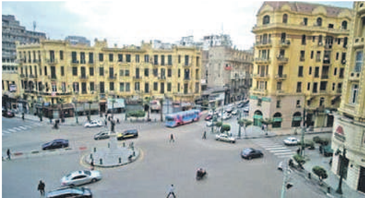
Le Caire, place Tallat Harb est la fameuse en ville, c'est les affaires et shopping de coeur avec trafic rapide et belle ...

Revenant au Maroc, le troisième pays le plus attractif d'Afrique conserve cette place pour la quatrième année consécutive. Il ne s'agit pas d'une éventuelle léthargie de son économie. Au contraire, celle-ci a enregistré une croissance moyenne de 4 % sur le moyen terme. Par ailleurs, son environnement des affaires évolue également dans la bonne direction. Autre pays dans le top quatre, l'Éthiopie qui a enregistré une extraordinaire croissance économique : 10 % par an sur une période de dix ans. Cette crois-