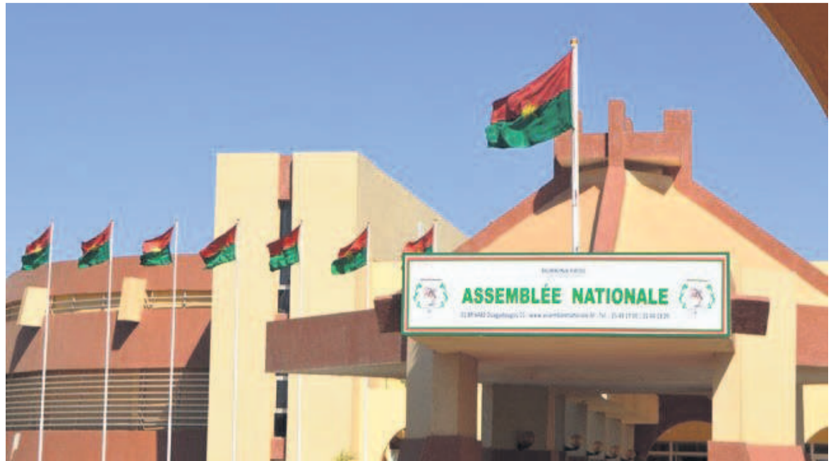
Siège de l'Assemblée-nationale-du-Burkina

Paul Kaba Thiéba a reconnu que la situation sécuritaire du Burkina Faso s'est considérablement dégradée depuis le début de l'année en cours et d'ajouter : « Il s'agit sans doute d'une guerre injuste imposée à notre peuple, engagée