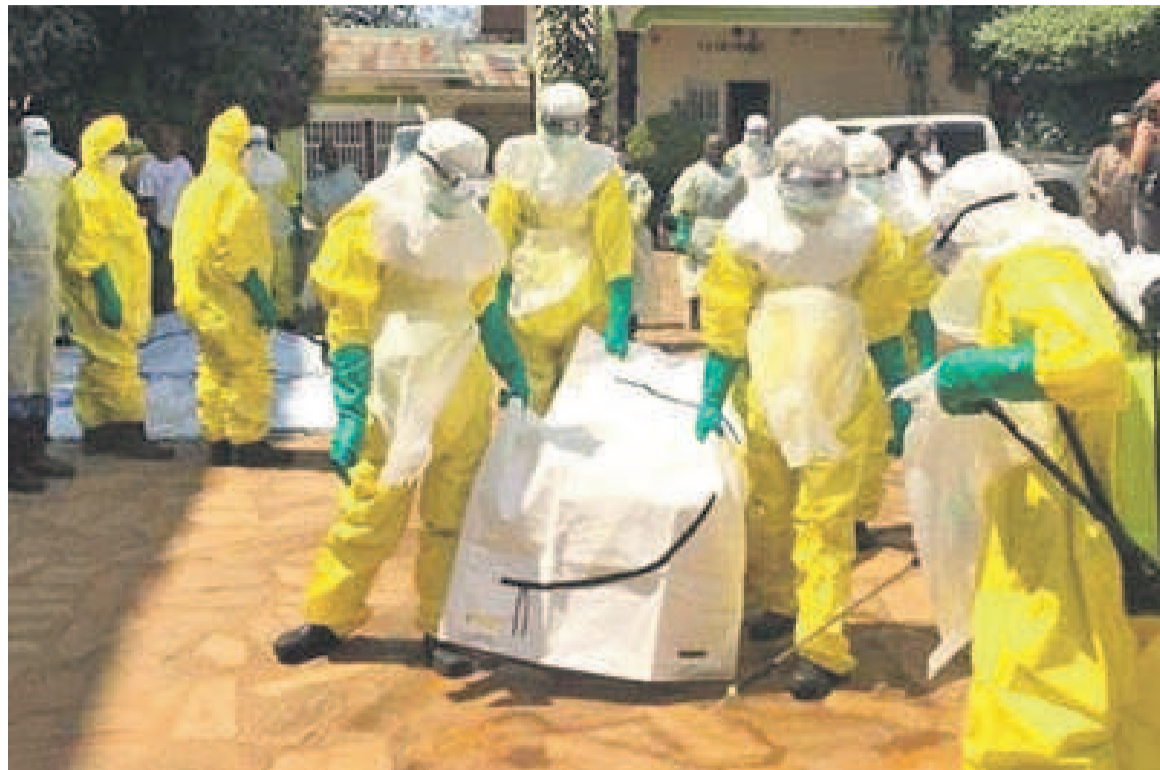
Une équipe des spécialistes

Dans le quartier de Ndindi, des comités locaux travaillent de concert avec l'Unicef pour identifier et mettre en œuvre des activités de sensibilisation. Ils ont contribué à la mise en place