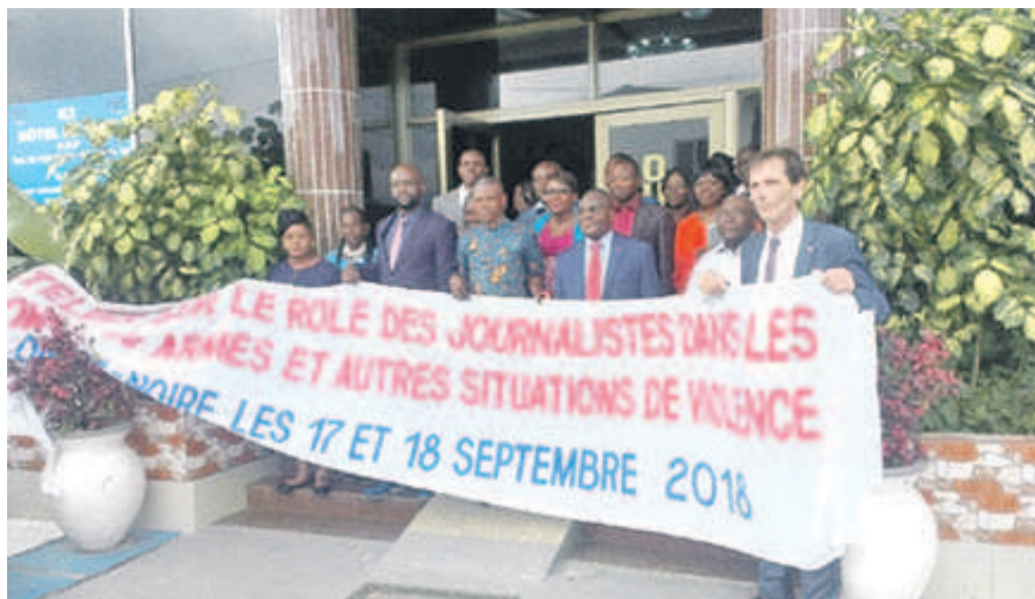
La photo de famille après l'atelier initié par le CICR/Adiac

Les sous-thèmes tels «L'histoire, mandat et activités du CICR et du Mouvement de la Croix rouge et du Croissant rouge», « Les défis actuels du droit international humanitaire», « Médias et protection des personnes affectées par les conflits armés et autres situations de violence», « Conduite des hostilités et usage de la force», « Les journalistes et le droit international huma-