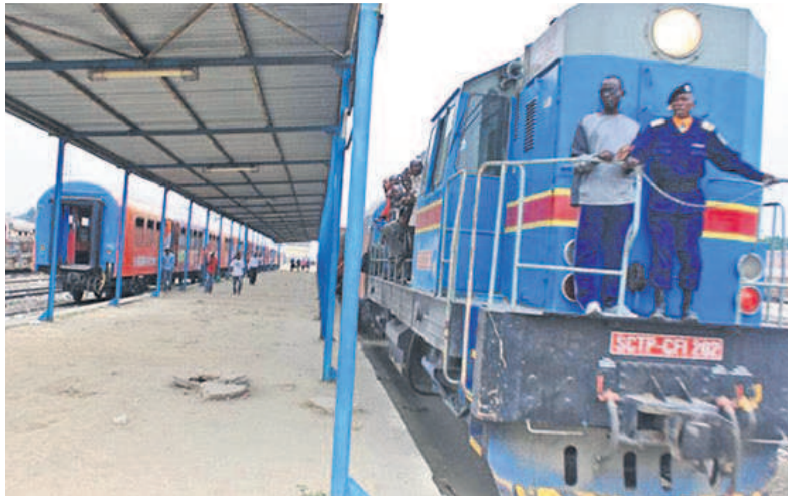
Un train voyageur de la SCTP assurant l'axe Kinshasa-Matadi

Une gestion opaque des recettes L'association de défense des droits de l'homme regrette, par contre, que cette somme, comme celle issue des taxes aéroportuaires (Go-Pass), soit gérée dans une opacité totale. « Les aéroports de Lubumbashi, Mbuji-Mayi et Goma sont dépourvus de