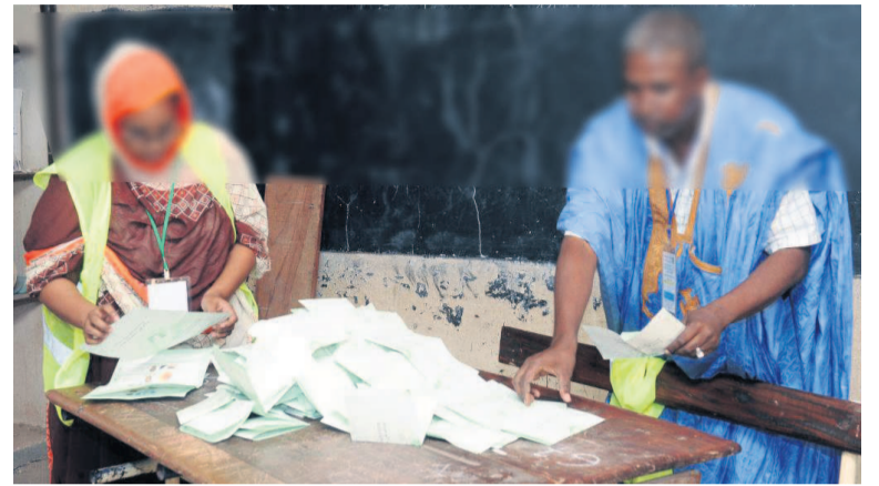
Le recomptage des bulletins de vote.

reçues au niveau de la Centrale électorale, la Cour constitutionnelle et l'Assemblée nationale font état de ce qui suit : le président de la République procédera à la mise en place des assemblées à trois niveaux (local, régional et national) à partir de la date de la proclamation des résultats par la Cour constitutionnelle jusqu'au 15 novembre.