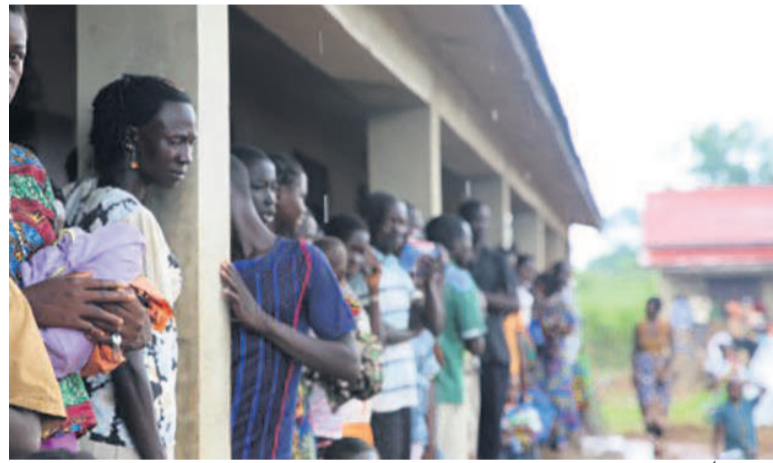
Minuss : des personnes déplacées, chefs de communautés et autorités locales à Tambura, en Équatoria occidentale, avec une délégation de l'ONU et d'agences humanitaires le 12 juillet 2018

abus décrits dans ce rapport dépendent de leurs actes ».