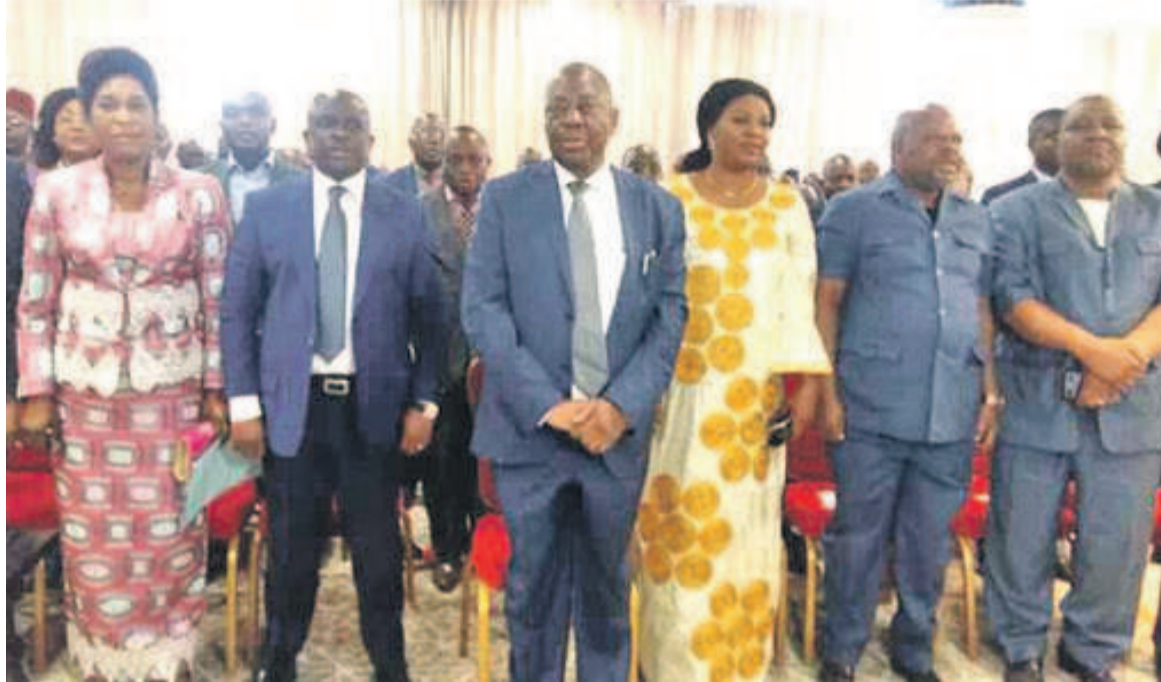
Les membres de la PCB au cours d'une manifestation OKOK

Venus des différentes entités, les participants à ce séminaire