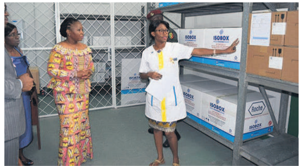
La ministre de la Santé s'assurant des conditions de conservation des anticancéreux à la Cameps/Adiac

Réceptionnés par la ministre de la Santé et de la population, Jacqueline Lydia Mikolo, le 19 octobre à Brazzaville, les anticancéreux permettront de traiter gratuitement les patients congolais souffrant de différents cancers.