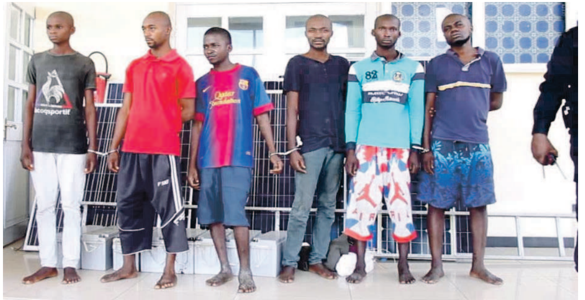
Les six présumés auteurs des actes de vols

Des actes condamnés par le maire d'Oyo qui a indiqué que les intentions de ces ci-