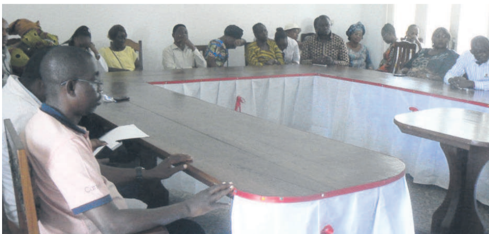
Les participants à l'assemblée générale du CNTS/Adiac

Enfin, la Confédération syndicale des travailleurs du Congo, la Fenasas ainsi que le ministère de la Santé et de la population ont créé un comité paritaire