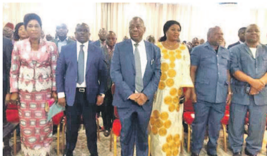
Les membres de la PCB au cours d'une manifestation

Au cours d'un séminaire de formation organisé le 18 octobre, à l'intention de ses délégués, la structure sociale a exhorté les participants à promouvoir les valeurs qui contribuent à la refondation d'une nation et