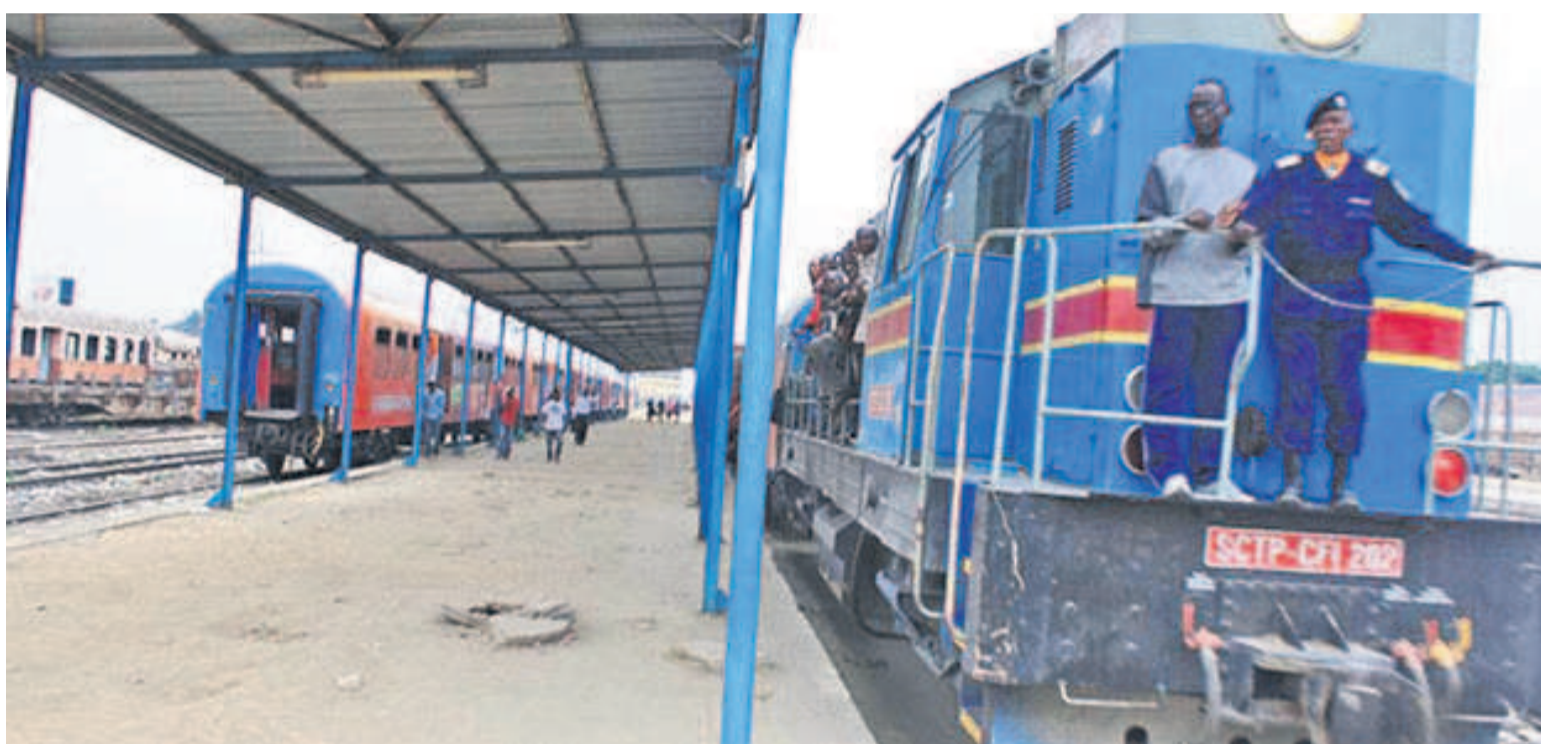
Un train voyageur de la SCTP assurant l'axe Kinshasa-Matadi