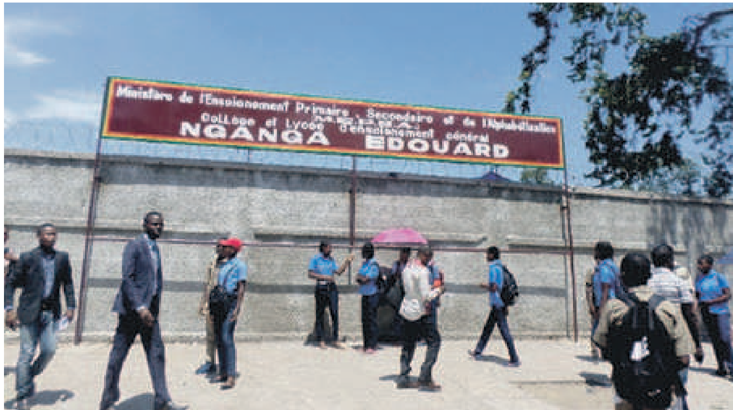
Les élèves à l'entrée principale du CEG et lycée Nganga-Édouard/Adiac

Cette caravane de la jeunesse dont le but était de sensibiliser, éduquer et conscientiser les jeunes, en cette période où l'on parle des violences en milieux scolaires, a laissé un goût amer. L'on parle de plus de quarante élèves évanouis et admis aux services du Centre hospitalier universitaire (CHU) de Brazzaville. « Aux environs de 11 h, le CHU a reçu progressivement les élèves de