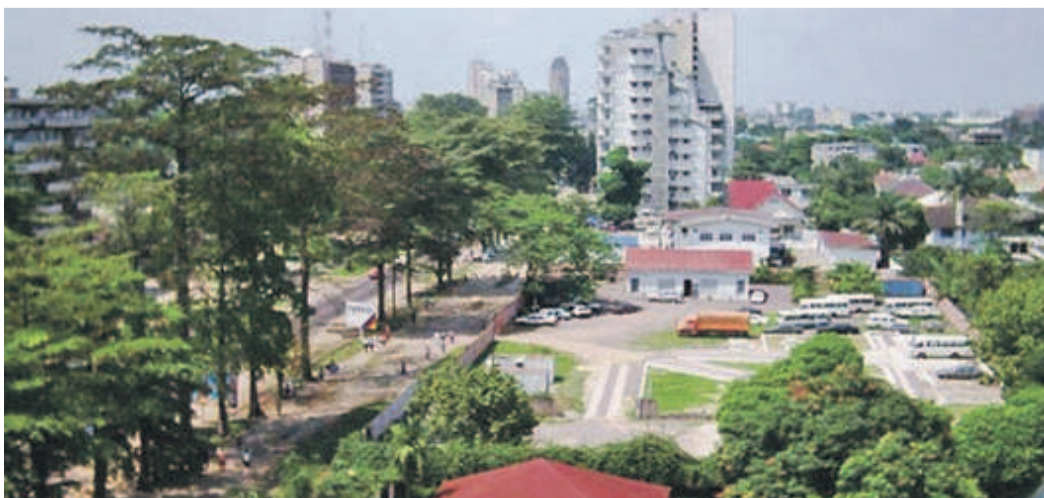
Le centre des affaires à Kinshasa