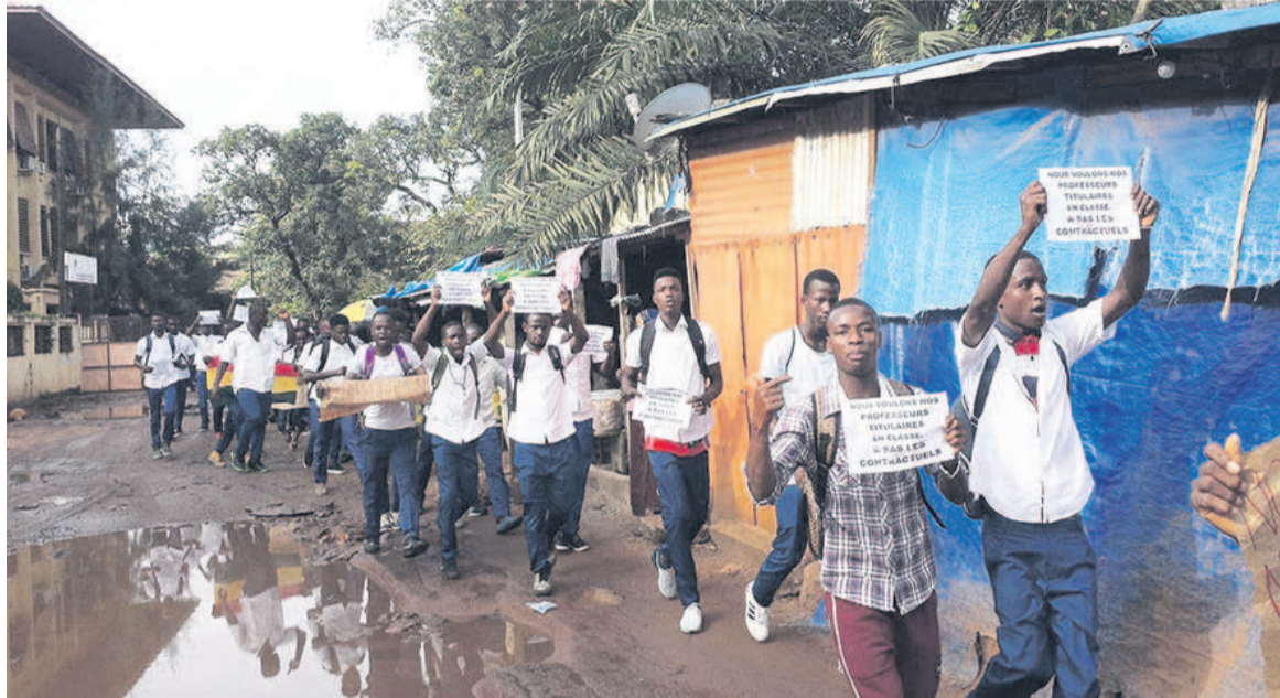
Le débrayage de ces élèves se déroule sans incident et les forces de l'ordre essaient de convaincre les manifestants de rentrer à la maison.

Face à ce bras de fer, le gouvernement a ainsi décidé de recruter et de déployer des enseignants contractuels dans