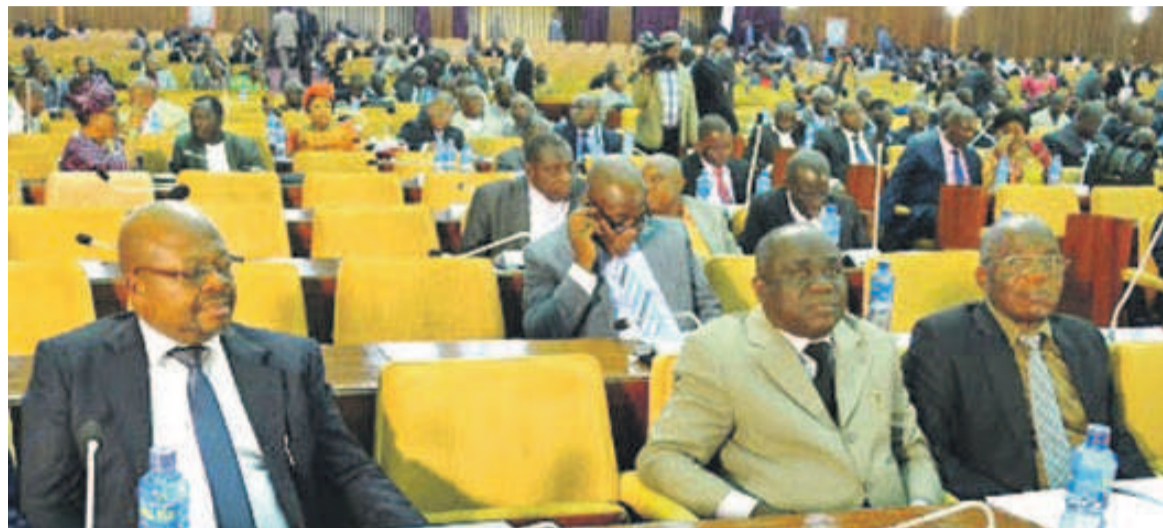
Des députés lors d'une assemblée plénière OK

Evaluées à environ six milliards de dollars, les prévisions budgétaires soumises à l'examen de la chambre basse du parlement pour adoption connaissent une régression de l'ordre de 0,01% par rapport à leur niveau de l'exercice en cours.