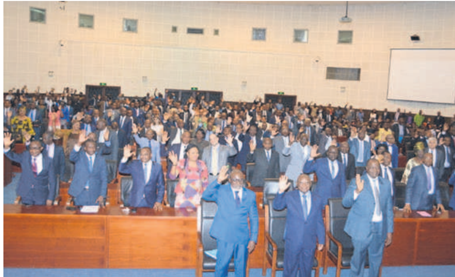
Exécution d'un geste pour la paix