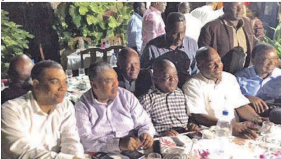
Des opposants congolais à DakarOK