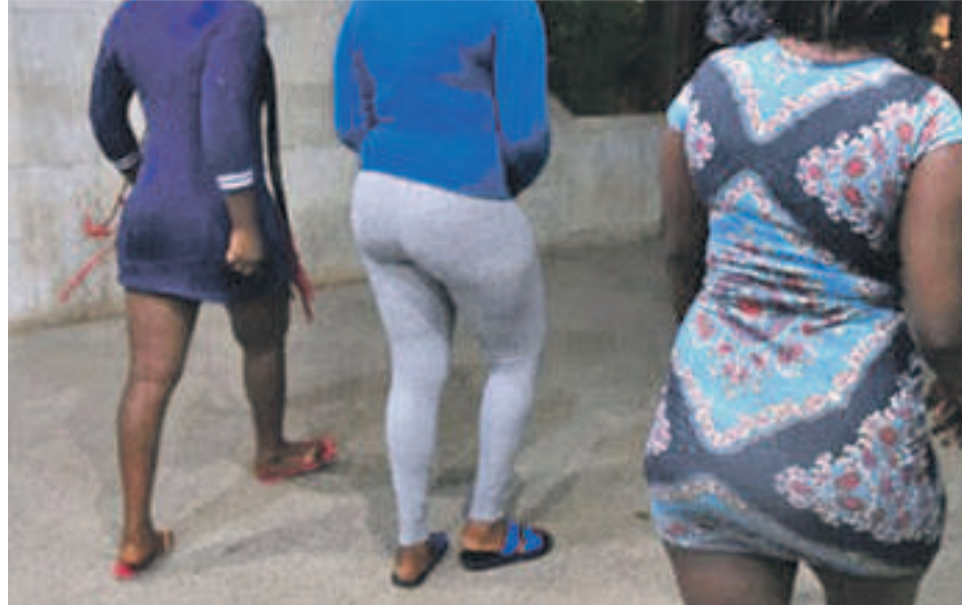
Des femmes au postérieur charnu font sensation à Kinshasa

Les artistes-musiciens en ont fait presque un sujet de dévotion, avec à la clé des danses obscènes mettant en relief la paire de fesses, le fameux « mundelu na katika-