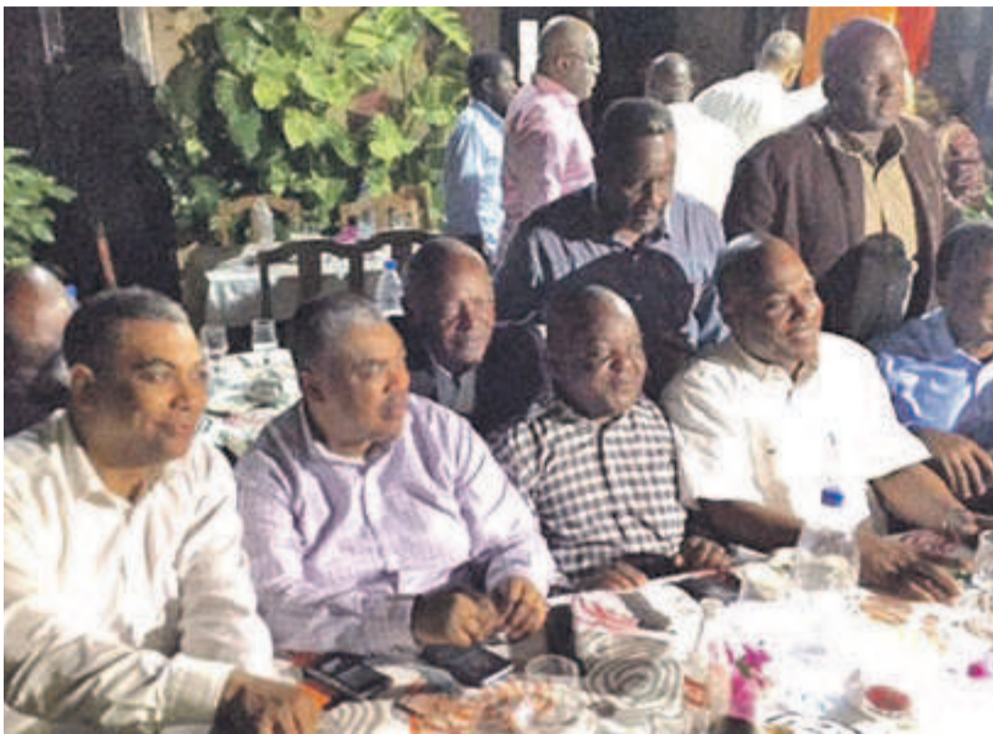
Des opposants congolais à Dakar