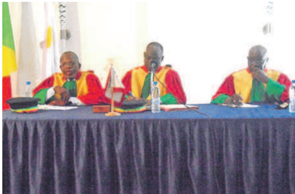
Les membres de la Ccas/Adiac

Après les plaidoiries, la Chambre de conciliation et d'arbitrage du sport (Ccas) a décidé de calmer le jeu en programmant le verdict des deux affaires, le 26 octobre en matinée. Le litige qui oppose la DGSP à la Fécohand est né de la finale des dames avortée de la 49e édition du Championnat national de handball qui devrait l'opposer à Abo sport. L'équipe de la DGSP avait conditionné sa participation à cette finale par le changement de la paire arbitrale. « La contestation de la paire arbitrale est une suspicion légitime dès lors qu'en phase de poules, c'est cette paire arbitrale qui avait pris les décisions qui préjudiciaient aux intérêts de la DGSP. Il est de bon droit que la DGSP, avant de jouer le match de la finale, puisse élever cette contestation », a expliqué Me Éric Yvon Ibouanga, l'avocat de la DGSP. Sans obtenir gain cause, la DGSP avait quitté l'aire de jeu, perdant la rencontre sur tapis vert. Mais là où le bât blesse, ce sont les sanctions prononcées contre elle par la Fécohand. La DGSP a écopé d'une amende puis a perdu sa place de vice-championne du