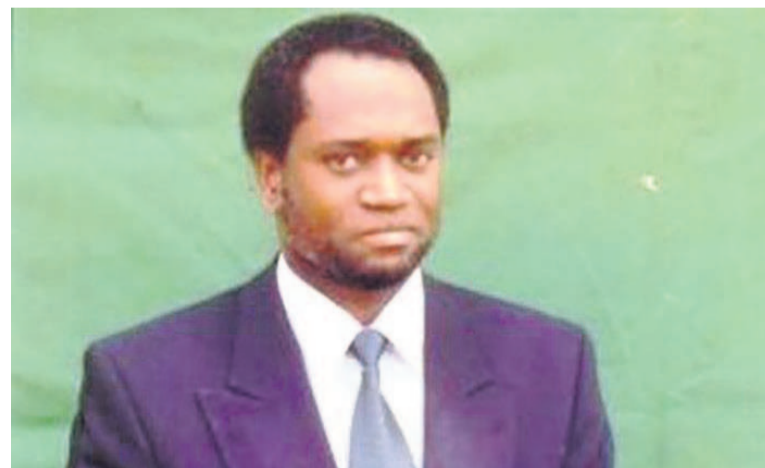
Feu le président Melchior Ndadaye

Les cérémonies de commémoration du 25 e anniversaire de l'assassinat, le 21 octobre 1993, du président Melchior Ndadaye, ont eu lieu le 22 octobre, cette date étant tombée un dimanche cette année.