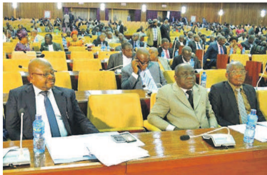
Des députés lors d'une assemblée plénière

Évalué à environ six milliards de dollars, les prévisions budgétaires pour l'exercice 2019, soumises avant-hier à l'examen de l'Assemblée nationale pour adoption, connaissent une régression de l'ordre de 0,01% par rapport à leur niveau de l'exercice en cours. La modicité du budget a révélsé bien des députés car ne cadrant pas, selon eux, avec les espoirs suscités par le nouveau code minier motivé par le besoin de renflouer les caisses de l'État, en surfant sur le relèvement du taux de la redevance minière. Sans un recadrage en termes de volonté politique, le budget de la RDC restera toujours en deçà de son énorme potentiel économique, se convainquent-ils. C'est ce 25 octobre que le Premier ministre, Bruno Tshibala, devra répondre aux préoccupations des élus du peuple.