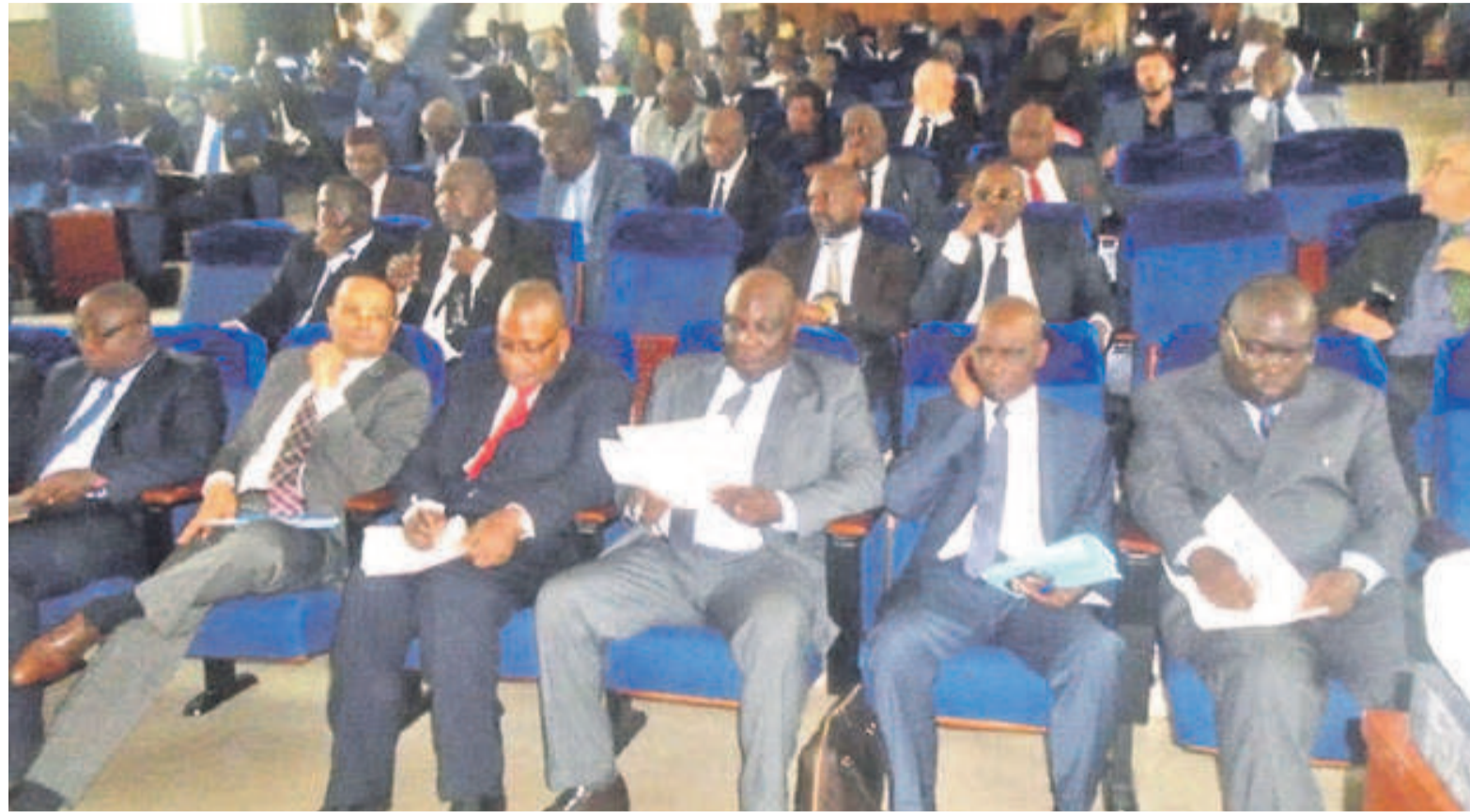
Une vue des participants lors de la cérémonie d'ouverture

Jusqu'au 26 octobre, ces acteurs et gestionnaires des collectivités locales vont, à travers onze exposés qui seront animés par des experts congolais et ceux venus de France, actualiser leurs connaissances en la matière afin de bien assurer la décentralisation et le développement local au Congo. Parmi les sous-thèmes à développer, on note, entre autres, «Développement local et animation du territoire : concepts, principes, enjeux, mécanismes et outils de mise en œuvre. Mobilisation des ressources et financement du dé-