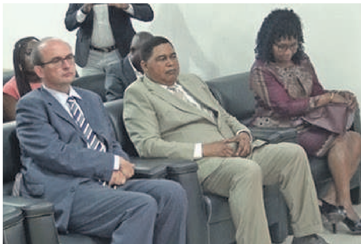
-Une vue partielle des ambassadeurs et hommes d'affaires assistant à la conférence de presse