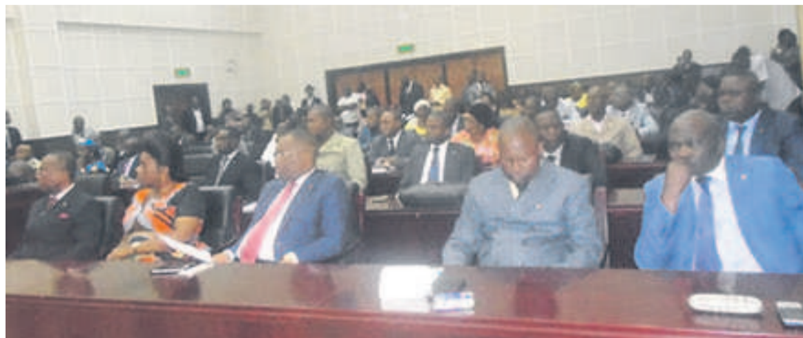
Une vue des parlementaires dans la salle

La réunion de sensibilisation tenue, le 7 novembre à Brazzaville, sous l'égide du ministre de la Recherche scientifique et de l'innovation technologique, Martin Parfait Aimé Coussoud Mavoungou, visait à mieux renseigner les sénateurs et députés sur le régime national de sécurité nucléaire.