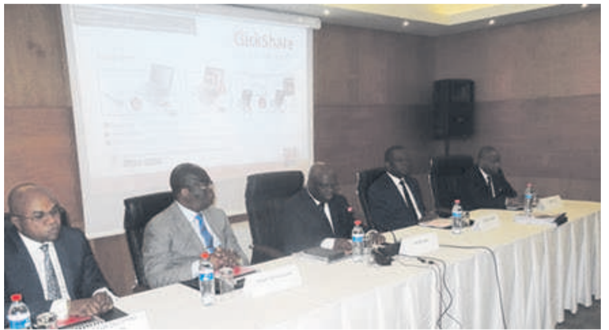
Le présidium du séminaire atelier

La titrisation est l'option choisie par l'exécutif pour tenter d'apurer le passif de l'Etat. Cette opération financière consiste à transformer une créance en titre qui sera proposé aux investisseurs institutionnels qui, à leur tour, vont permettre à ces différentes entreprises d'avoir du numéraire puis laisser les banques porter cette dette à leur place moyennant des intérêts.