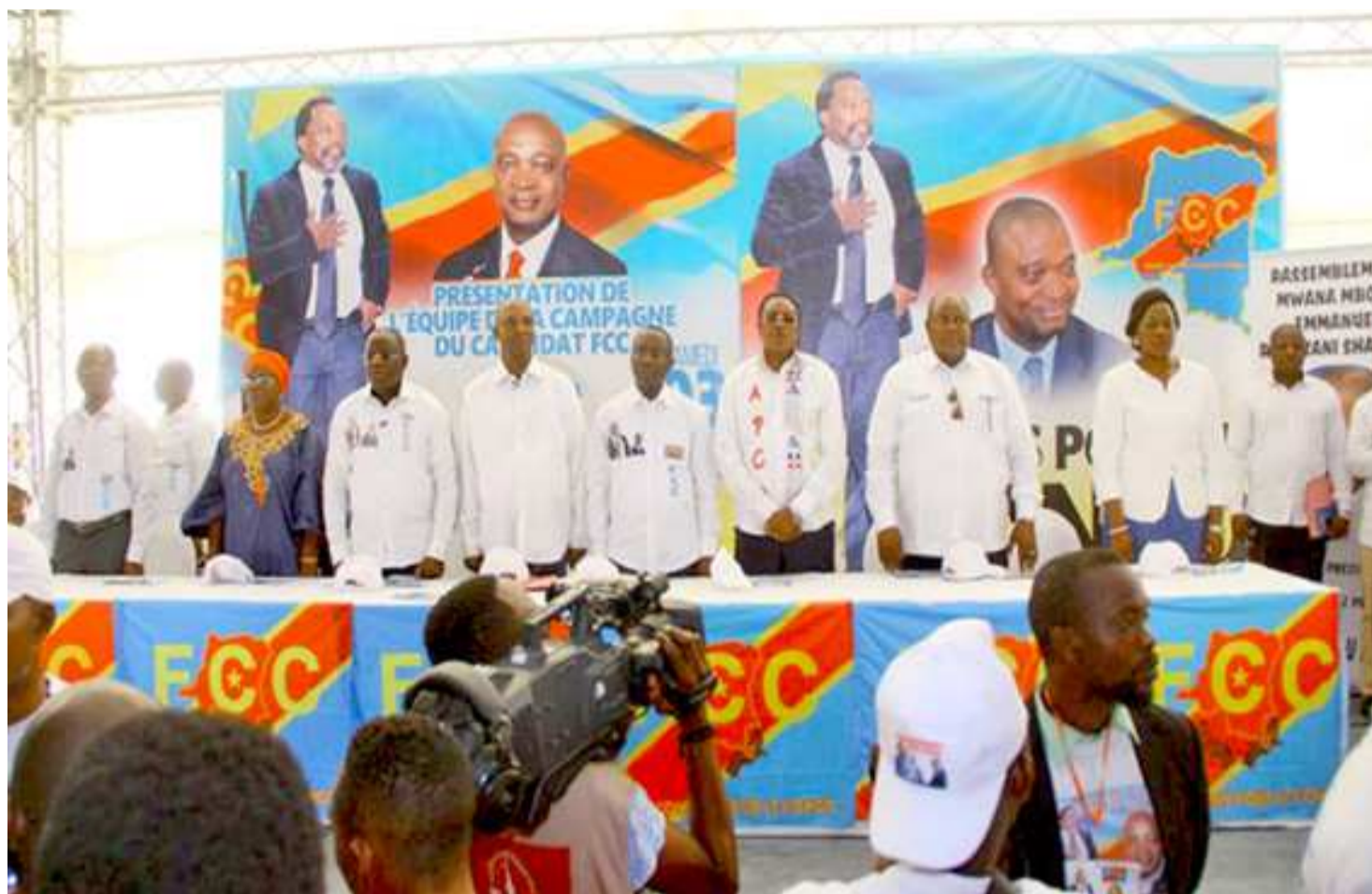
La présentation de l'équipe de campagne d'Emmanuel Shadary

L'article 1er du décret-loi n°017-2002, selon l'Acaj, entend par agents de carrière des services publics de l'État toute personne qui exerce une activité publique de l'État et/ou rémunérée par ce dernier. LONG a ainsi indiqué le président de la République, les membres du parlement et ceux du gouvernement, les autorités chargées de