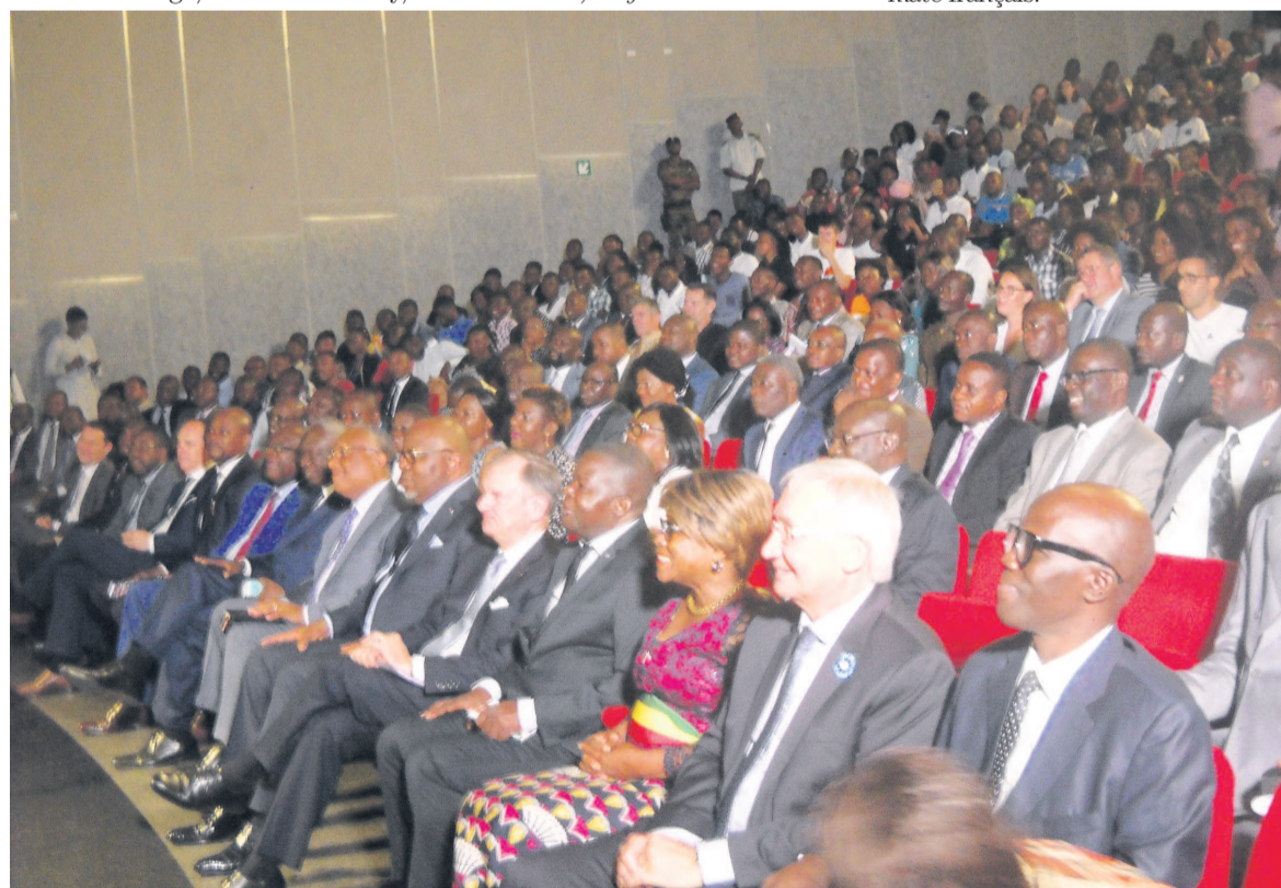
La cérémonie d'ouverture du forum