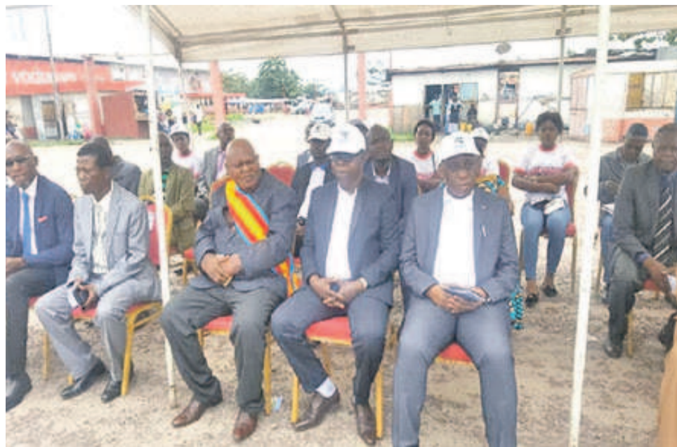
Le bourgmestre adjoint de Limete, le SG et le directeur de cabinet adjoint