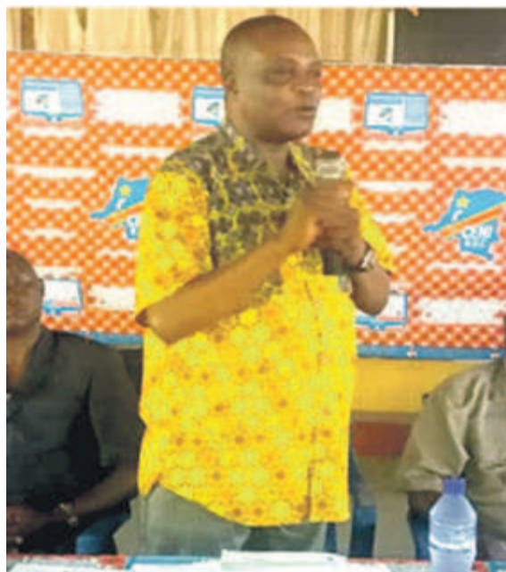
Norbert Basengezi sensibilisant à la machine à voter

En séjour de travail dans la province du Kwilu, Norbert Basengezi Katintima a réaffirmé la détermination de la Centrale électorale d'organiser les élections générales conformément au calendrier établi, avec l'usage de l'outil électronique, selon le bulletin de cette institution du 17 novembre.