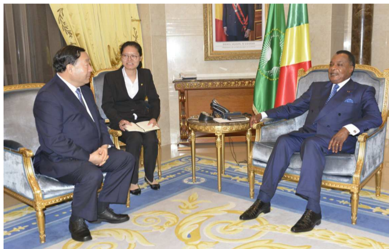
Liu Zhenya lors de l'audience avec le président Denis Sassou N'Guesso, au Palais du peuple

Le président de Global energy interconnection development and corporation organization (Geipco), Liu Zhenya, a annoncé, le 17 novembre à Brazzaville, l'intention de son groupe d'accompagner le pays dans la construction des barrages hydroélectriques en vue de l'exportation de l'électricité.