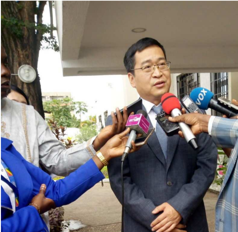
Le vice-président de la société CRBC répondant aux questions de la presse