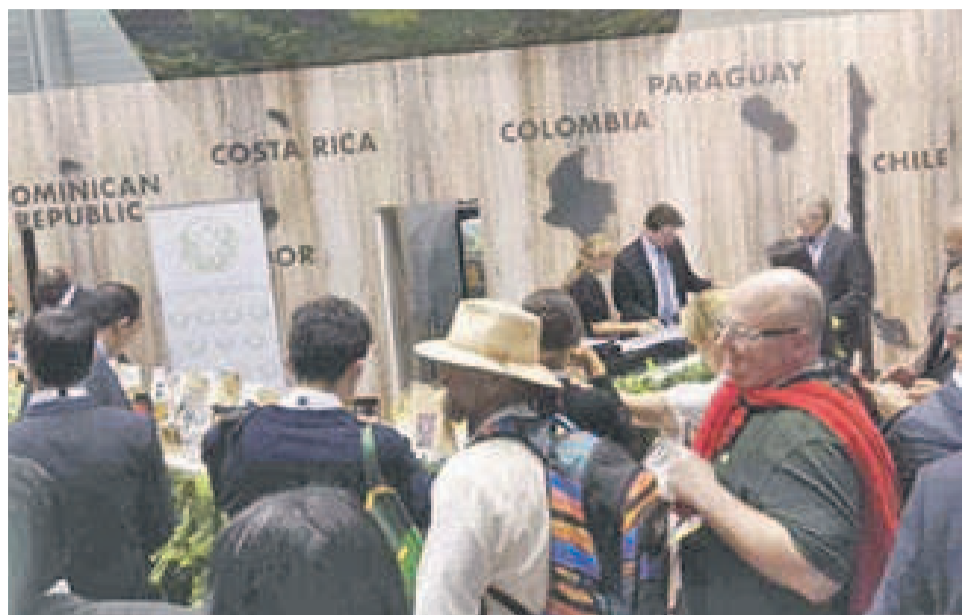
Quelques moments forts de l'événement