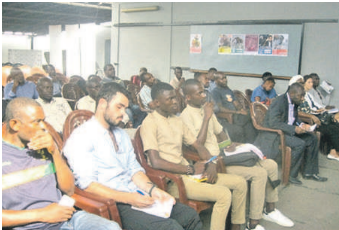
Une vue des participants à la séance de sensibilisation

En organisant cette activité, l'IFC, en partenariat avec le Samu Social, a permis à de nombreux jeunes élèves en âge