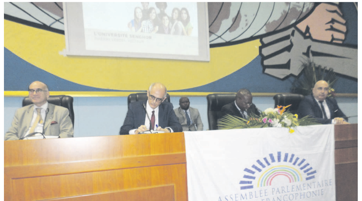
Les membres du présidium