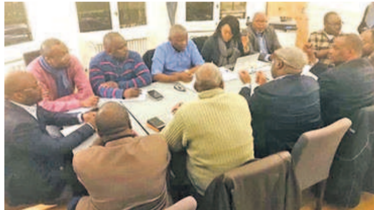
Vital Kamerhe et Félix Tshisekedi lors de leur réunion de Bruxelles

Il ressort du protocole d'accord ayant sanctionné ces échanges le vœu exprimé par les deux parties de constituer une alliance stratégique entre l'UDPS et l'UNC pour gagner ensemble les différentes élections (présidentielle et lé-