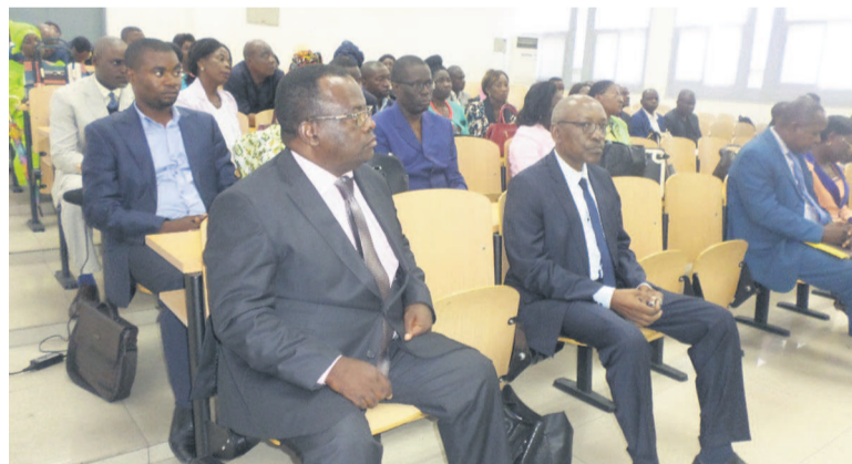
Les membres de la commission des bourses Adiac

La grève que traverse l'Université Marien-Ngouabi, depuis septembre dernier, ne permet pas aux étudiants de déposer les dossiers pour l'obtention de la bourse.