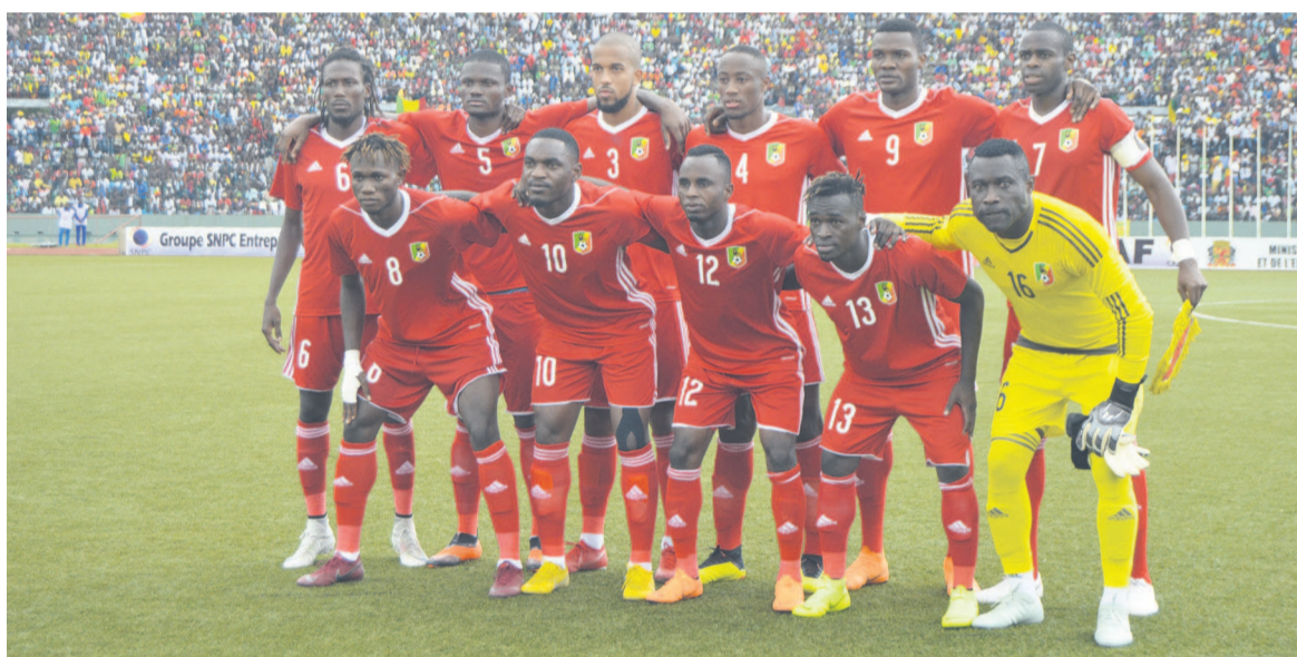
Les Diables rouges obligés de gagner le Zimbabwe en mars 2019 pour se qualifier