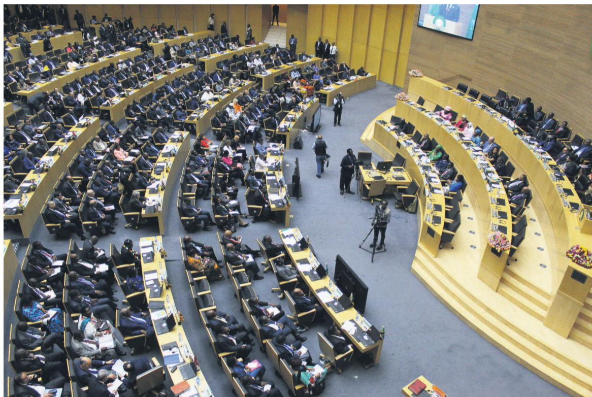
Une vue de la salle de réunion de l'UA

cettes auprès des États membres et en sanctionnant ceux qui ne versent pas leurs contributions. Ce qui était très capital puisque l'organisation dépend actuellement des donateurs étrangers qui, en 2019, devront payer 54% d'un budget total de 681,5 millions de dollars (596 millions d'euros).