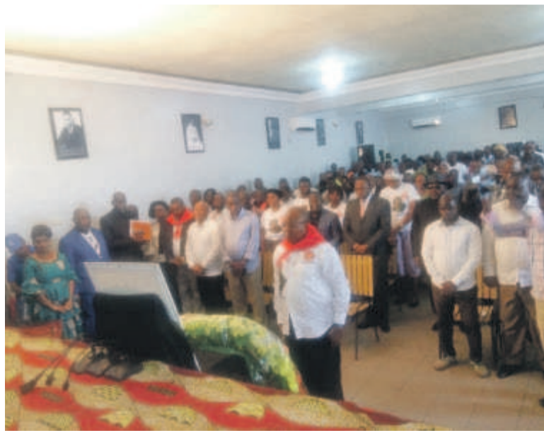
Les membres du PCT Pointe-Noire