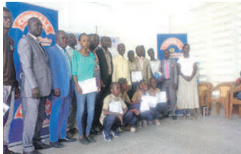
Photo de famille à la remise des prix Ngoujel 1er

La 1re édition du Prix Ngoujel 1er vient de livrer son verdict. Les lauréats des deux premières phases qui ont concouru à Pointe-Noire ont été primés en attendant la publication des résultats du 3e tour national qui aura lieu à Brazzaville le 8 décembre. En effet, près d'une vingtaine d'enfants issus de onze établissements scolaires ayant suivi le spectacle de théâtre « Jean Muvusu » de Ngoujel 1er par l'Arche de Ngoujel ont été récompensés selon les six niveaux d'études en attendant les résultats des secondes et terminales non encore disponibles. Ainsi, outre le diplôme de participation, les heureux récipiendaires ont reçu des smartphones, des kits scolaires, des chaises en plastique, un abonnement à l'IFC et un lot de gadgets et objets cowbell, l'un des sponsors du jeu concours. Une tombola a également été organisée et permis aux participants non primés de recevoir un cadeau des généreux donateurs.