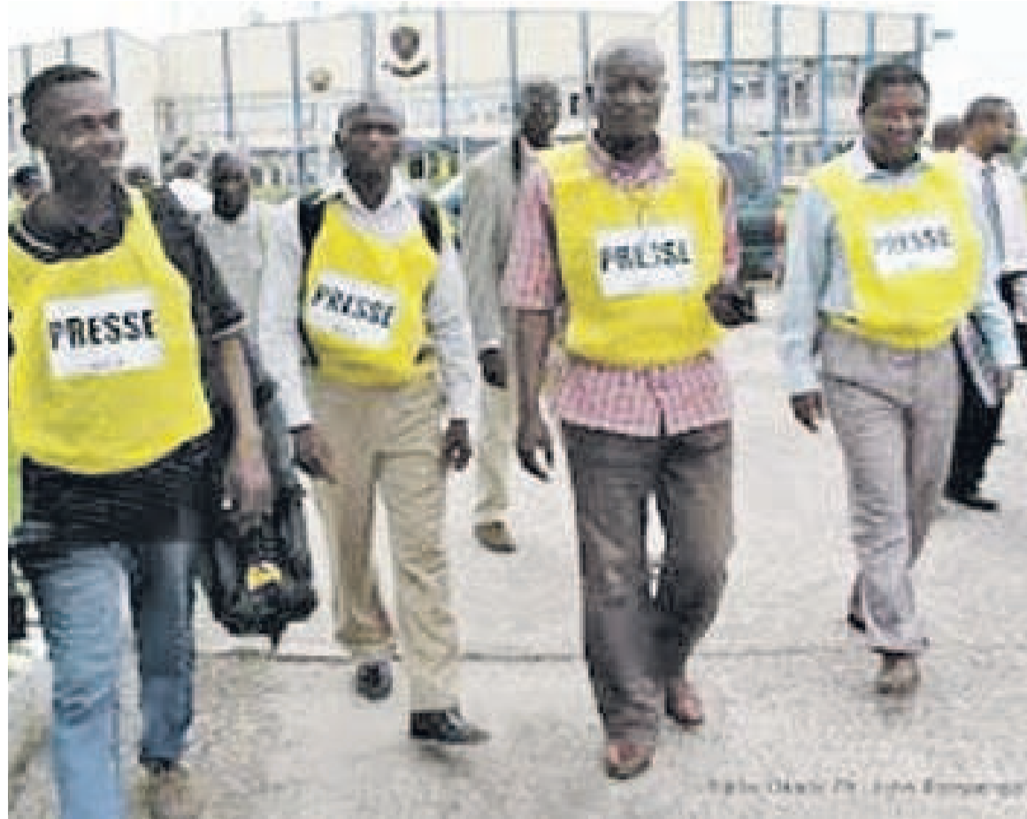
Des professionnels de médias congolais