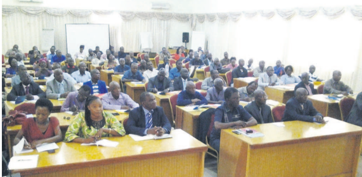
Vue de la salle au lancement de la formation

Il s'agit également pour les participants à cette formation de maîtriser et mieux exploiter les normes techniques des différentes productions végétales, animales et aquacoles ; de réaliser une