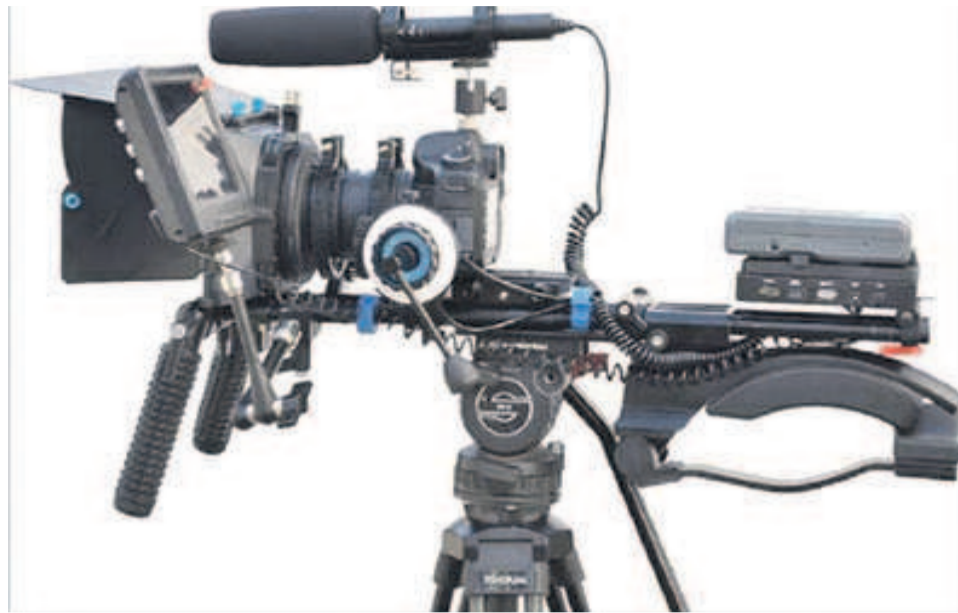
Une caméra pour la réalisation d'un documentaire crédit photo DR»

Dans un sillage qui veut rétablir une jus-