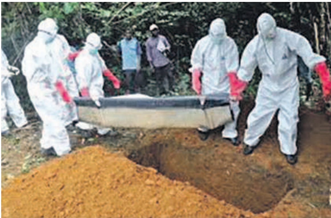
L'insécurité empêche le bon déroulement des activités de riposte contre Ebola à Beni