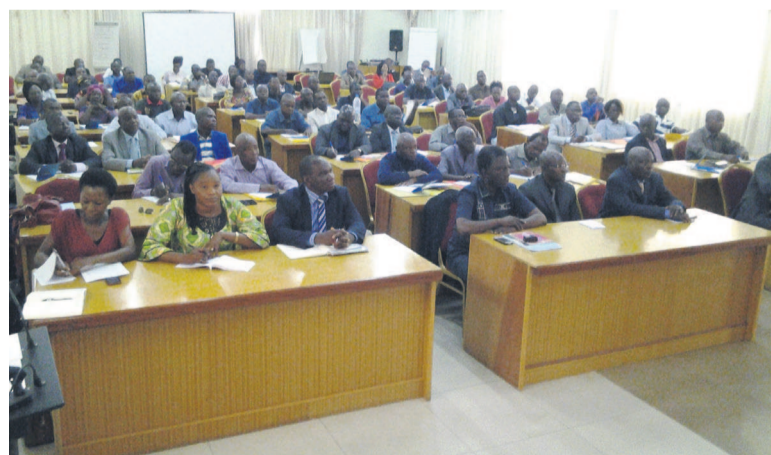
Les participants à la formation

Une session de formation a été ouverte, hier à Brazzaville, au profit des prestataires et des chefs de secteurs agricoles des pôles d'entrée du Projet de développement de l'agriculture commerciale (Pdac).