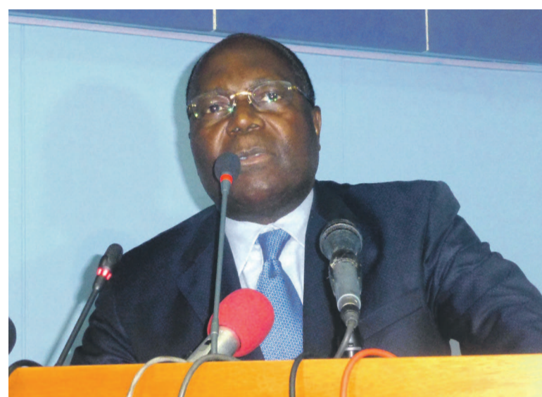
Le Premier ministre Clément Mouamba

Les questions orales au gouvernement avec débat ont tourné, le 22 novembre, autour des sujets d'intérêt socioéconomique. La reprise des activités des sociétés ECAir et STPU, la grève qui se prolonge à l'Université