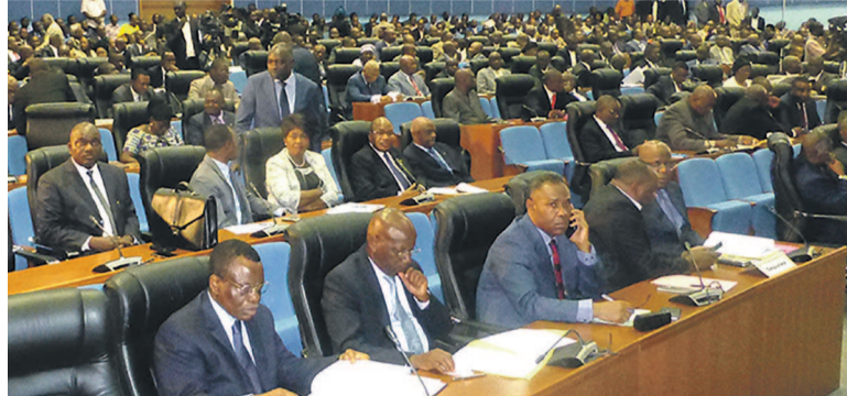
Une vue des députés

La chambre basse du parlement a tenu, le 22 novembre, sa quatrième session des questions orales au gouvernement avec débat. La reprise des cours à l'Université Marien-Ngouabi, la relance de la société ECAir et STPU ont figuré parmi les sujets ayant suscité un débat enthousiaste à l'hémicycle.