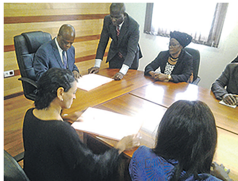
Les deux parties lors de la signature de l'accord