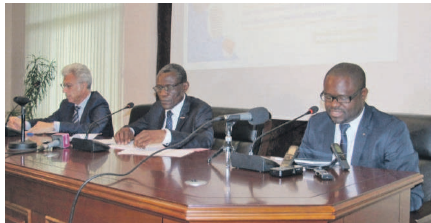
Une vue du podium

L'atelier qui se tient du 21 au 23 novembre vise, entre autres, à renforcer l'identification, la préservation, la promotion et l'accès au riche patrimoine documentaire, y compris le patrimoine numérique des pays de la région d'Afrique centrale pour le développement durable.