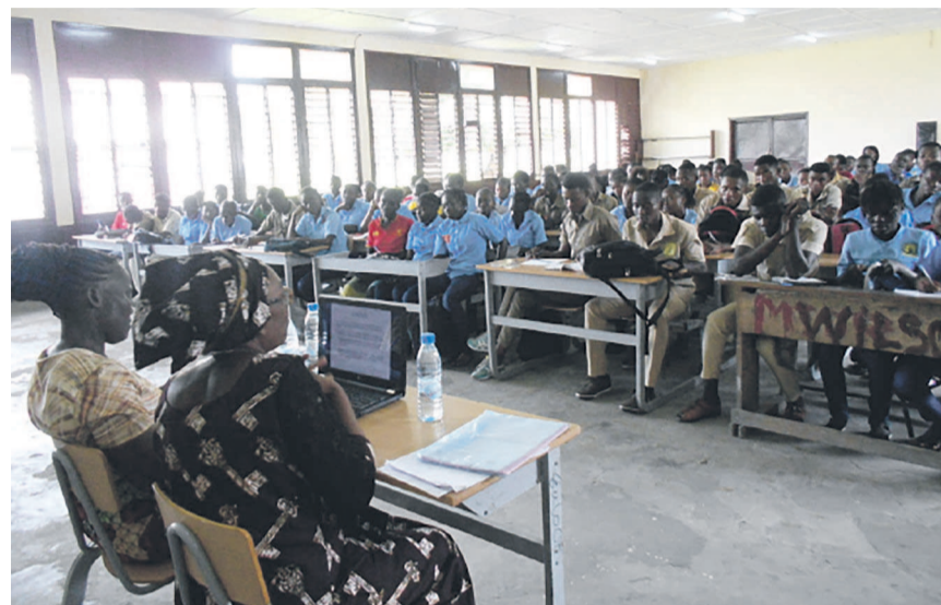
Les oratrices en échange avec les élèves (adiac)

Les élèves des classes de première et terminale du lycée d'enseignement général, Pierre-Savorgnan-de-Brazza, ont été éduqués, le 21 novembre, sur les mesures préventives contre les grossesses indésirées.