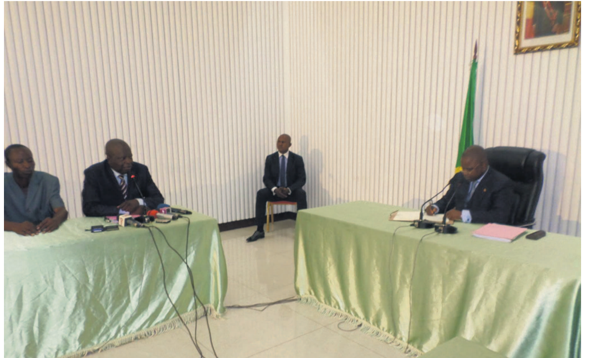
Les deux parties lors de la rencontre

Il est, en outre, revenu sur les propos du gouvernement à cette époque qui laissait entendre que le plan social des ex-travailleurs de l'ONPT avait été apuré alors que de nos jours près de 50% de ce plan traîne encore sur la table du même gouvernement même si ce dernier, a-t-il signifié, avait pris en charge le tiers des salaires des travailleurs pendant 8 ans. Il a expliqué au Sénat qu'en 2011 le gouvernement avait adopté un plan social suivi d'un protocole d'accord avec les travailleurs de