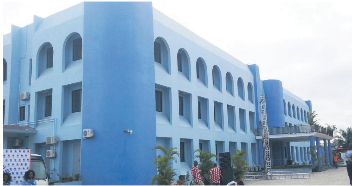
Une vue du nouveau siège de la Coraf

La Coraf est une filiale de la Société nationale des pétroles