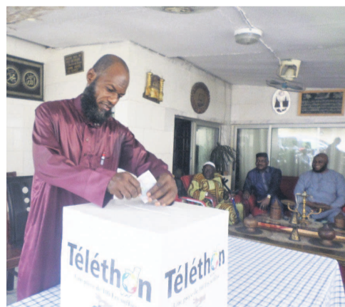
Un musulman apportant sa contribution

Sollicitée par l'association Hope Congo, initiatrice du premier Téléthon consacré au collecte des fonds destinés à la réhabilitation des infrastructures scolaires détruites dans le Pool, la communauté musulmane du Congo a exprimé vendredi, par le biais du conseil islamique, sa disponibilité à contribuer à cette opération salvatrice pour le bien des apprenants de ce département.