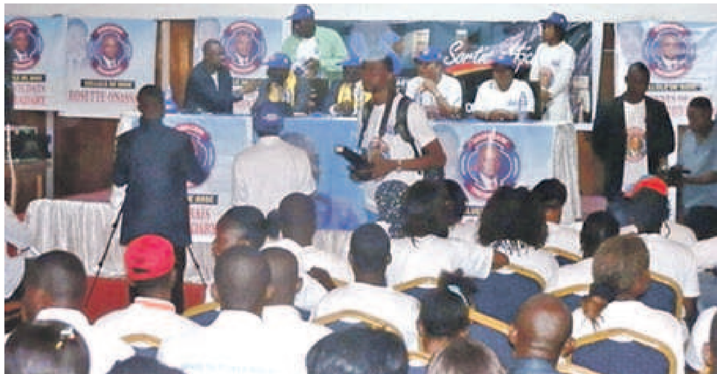
Une partie de la salle lors de la manifestation Adiac