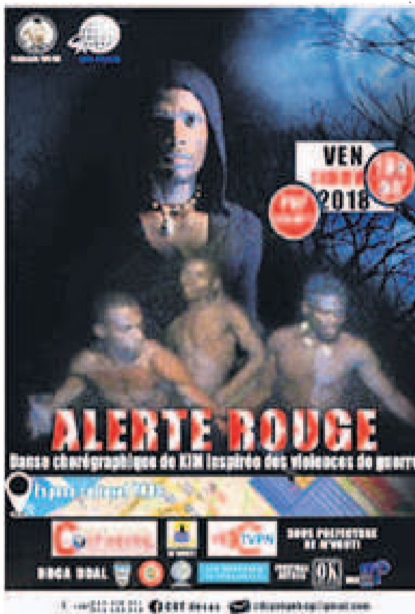
L'affiche du spectacle Alerte rouge

L'artiste jouera le spectacle de danse intitulé « Alerte rouge », le 28 novembre, dans cet espace situé dans le 4 e arrondissement de Pointe-Noire, Loandjili.