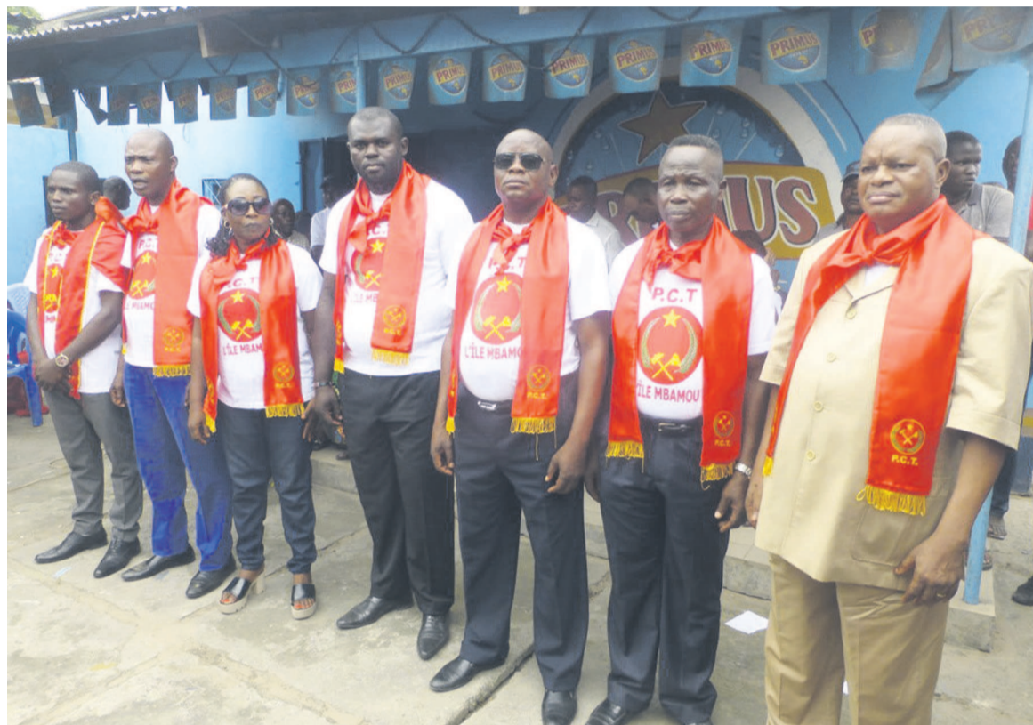
Les sept membres du secrétariat du comité PCT de l'île Mbamou