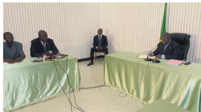
Les deux parties lors de la rencontre