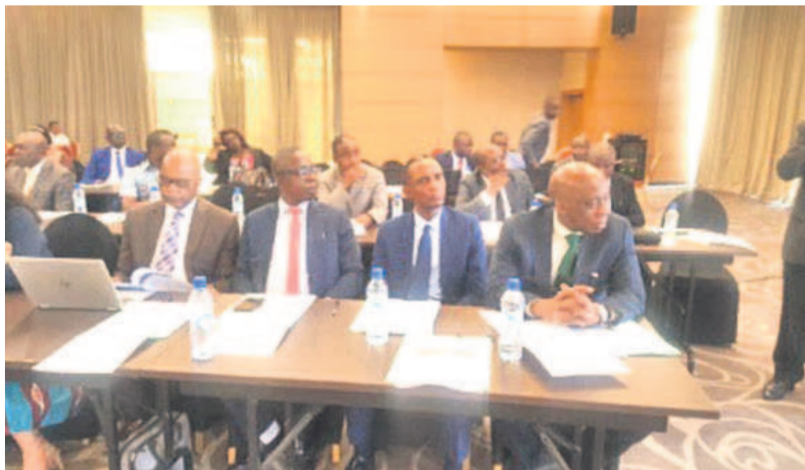
Des participants à l'atelier de recadrage méthodologique