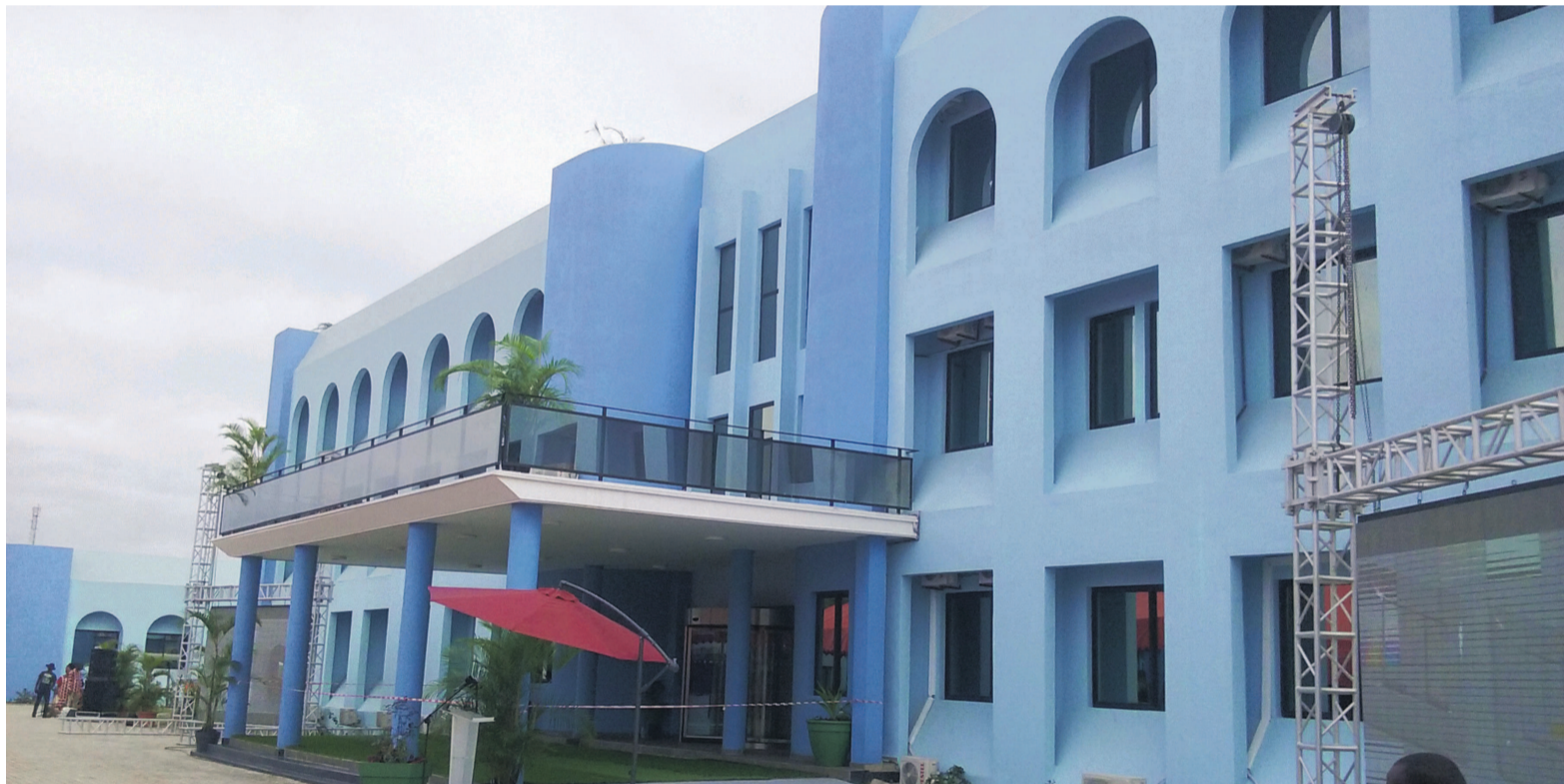
Une vue du nouveau siège de la Coraf