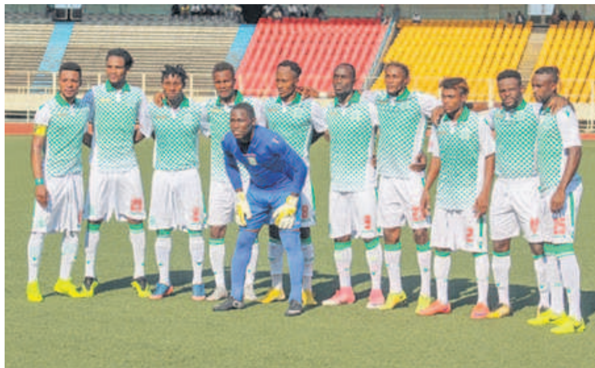
DCMP avant le match contre Anges de Fatima, le 28 novembre 2018, à Kinshasa

Notons que pour cette rencontre, le onze de départ du DCMP s'est composé du