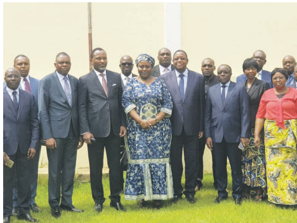
La colonie congolaise posant avec l'ambassadeur Valentin Ollessongo

Venus de différents coins, les Congolais vivant au Cameroun se sont retrouvés, le 28 novembre, au siège de l'ambassade à Yaoundé, pour célébrer le soixantième anniversaire de la proclamation de la République du Congo.