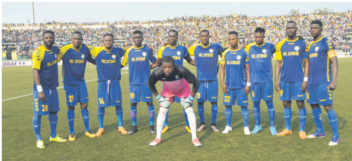
L'AS Otoho et...