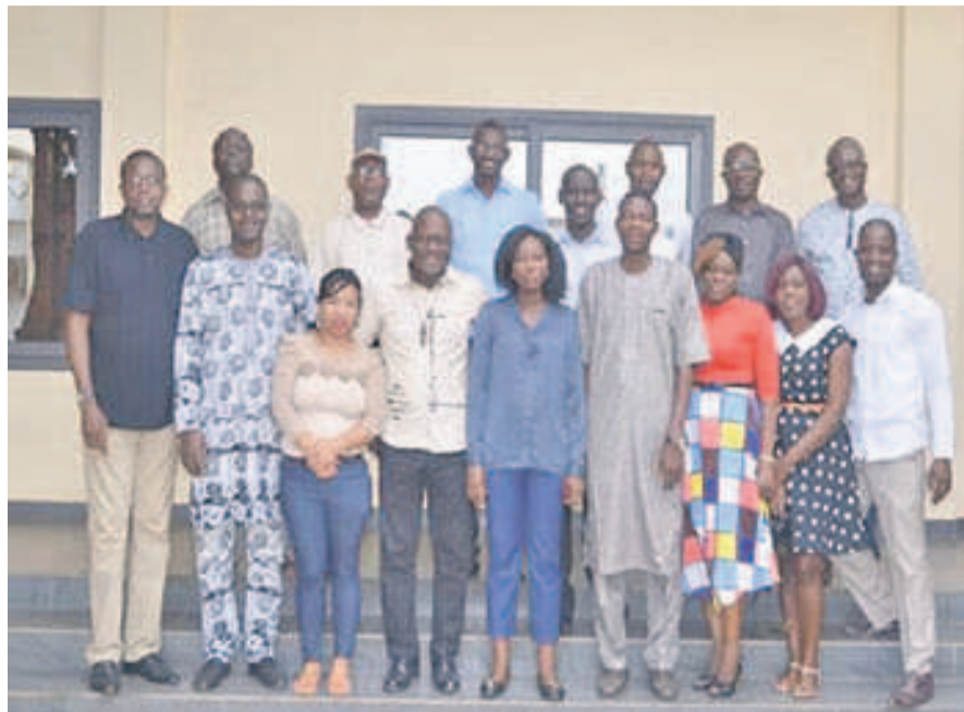
Une vue des participants à l'atelier de Lomé

Cet atelier a aussi développé de manière collaborative le partage de connaissances sur les différents aspects du métier de communication dans les organisations sociocaritatives et échangé sur les différentes fonctions que doit assurer la communication dans une organisation sociocaritative. Les organisateurs espèrent aussi créer une dynamique de collaboration entre les communicateurs et les chargés de