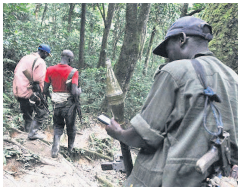
Les FDLR participent aussi au raffle des voyageurs à l'Est

Le gouvernement a procédé, ces derniers jours, au « rapatriement sans condition » des combattants FDLR désarmés et cantonnés depuis quatre ans dans les camps de transit de Kisangani, Kanyabayonga et Walungu en RDC. C'est en exécution de la recommandation des chefs d'État et de gouvernement signataires de l'Accord Cadre du 24 février 2012, signé le 19 septembre 2017 à Brazzaville, dans le cadre de la huitième réunion de Haut niveau du Mécanisme régional de suivi. A la suite de ce dernier développement, le Conseil supérieur de défense a déclaré officiellement la fermeture définitive de tous les camps de transit ayant servi au cantonnement de tous ces combattants venus des pays voisins.