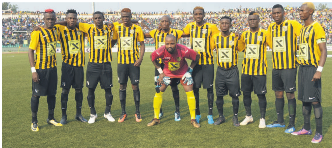
...les Diabes noirs entament mal la campagne continentale/Adia...