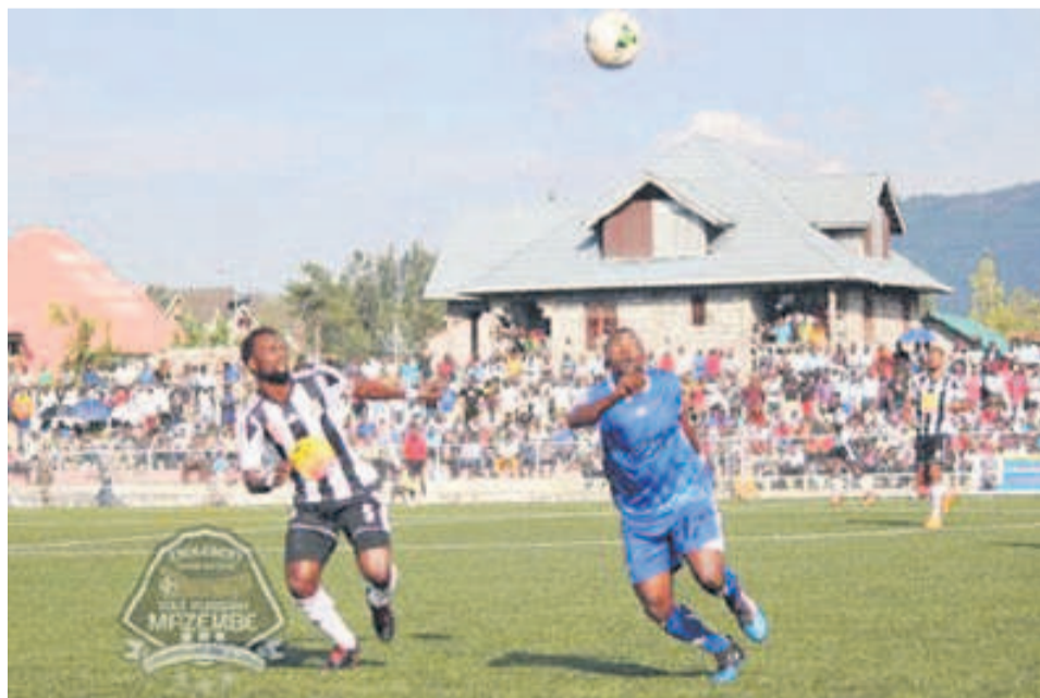
Vue du match entre Dauphin noir et Mazembe

L'AS Dauphin noir de Goma a tenu en échec l'ogre TP Mazembe de Lubumbashi. Zéro but partout, c'est le score de la rencontre disputée le 28 novembre au stade de l'Unité de Goma, comptant pour la treizième journée de la 24 e édition du championnat national de football. Mazembe marque donc un temps d'arrêt après sa victoire, quatre jours auparavant, sur Muungano à Bukavu par deux buts à un.