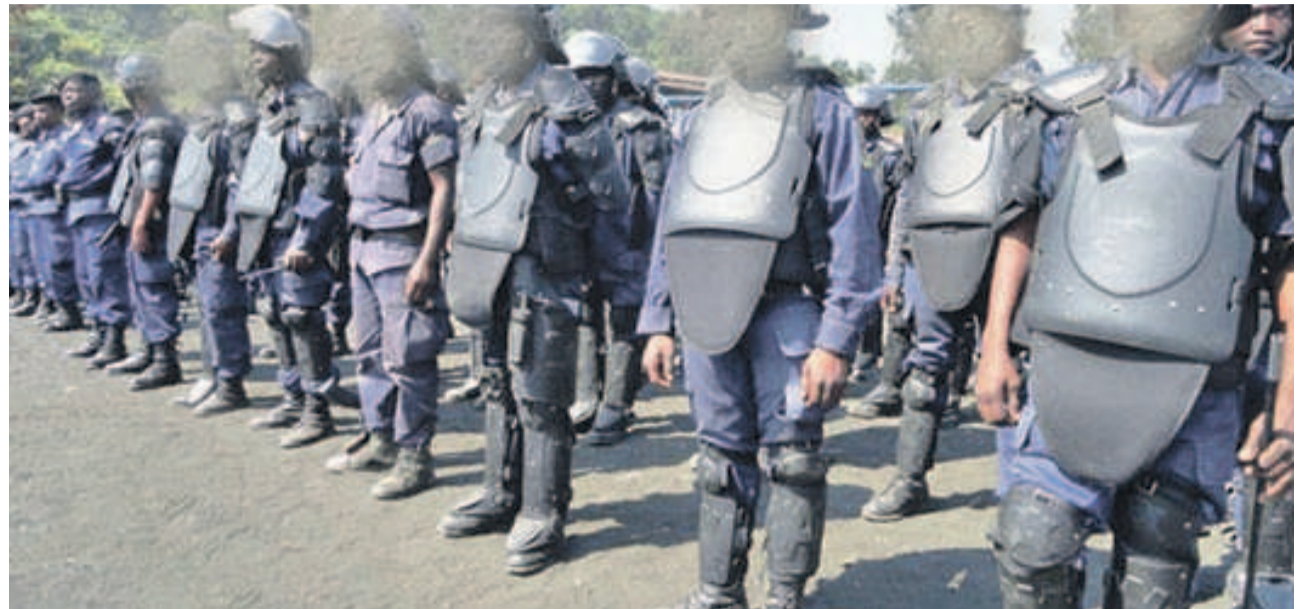
Des éléments de la Police nationale congolaise

L'obligation a été rappelée le 28 novembre, au cours d'une réunion du Conseil supérieur de la défense (CSD) que le chef de l'État, Joseph Kabila Kabange, a présidée à son bureau de travail.