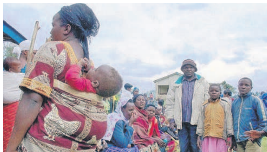
Les auteurs des violences faites aux femmes et aux enfants seront déferés devant la justice