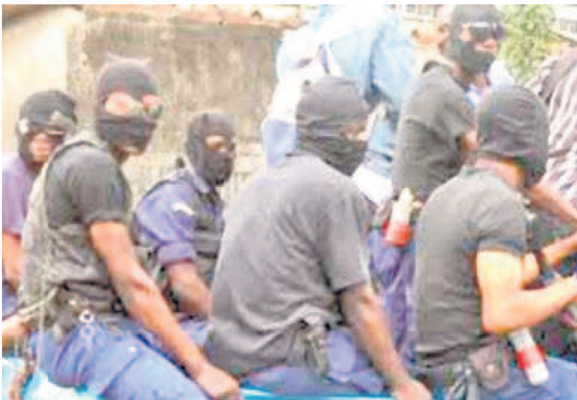
Des éléments de la police commis à l'opération Likofi/archives