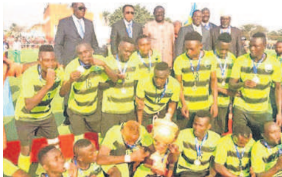
Nyuki de Butembo

Pour sa première en compétition africaine interclubs, le club de Butembo, dans la province du Nord-Kivu, a courbé l'échine, le 28 novembre, au Shendi Stadium (à 190 km de Khartoum) en terre soudanaise, face à la formation d'Al Ahly Shendy, par la marque de zéro but à un, en match aller des préliminaires de la 16 e édition de la Coupe de la Confédération. L'unique but de la partie a été inscrit à la 32 e mn par Mohamed Mogahid. L'AS Nyuki n'a pas du tout été ridicule. L'équipe a timidement débuté la partie mais dans la seconde période, elle a été bien plus fluide avec des occasions que se sont créées mais sans arriver à les concrétiser.