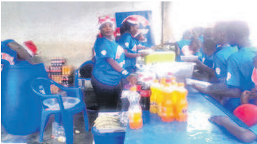
Les enfants alignés pour se servir

Le geste de solidarité en faveur des enfants démunis et pensionnaires des structures d'accueil de la ville océane, membres du réseau des intervenants dans le phénomène des enfants de la rue, a été accompli avec entrain, le 24 décembre, au Centre d'accueil de Mvou-Mvou