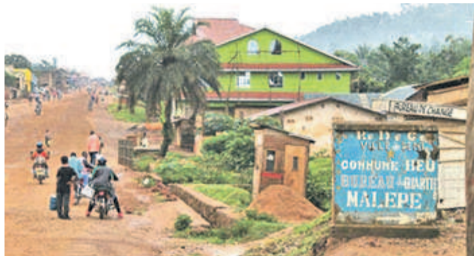
La ville de Beni