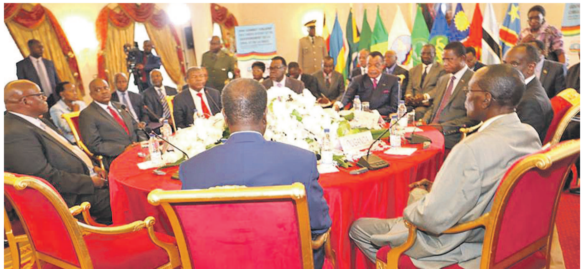
La table ronde des dirigeants de la Cirgl et de la SADC

Des actes de vandalisme perpétrés pendant la campagne électorale, notamment la destruction par un incendie d'une partie du