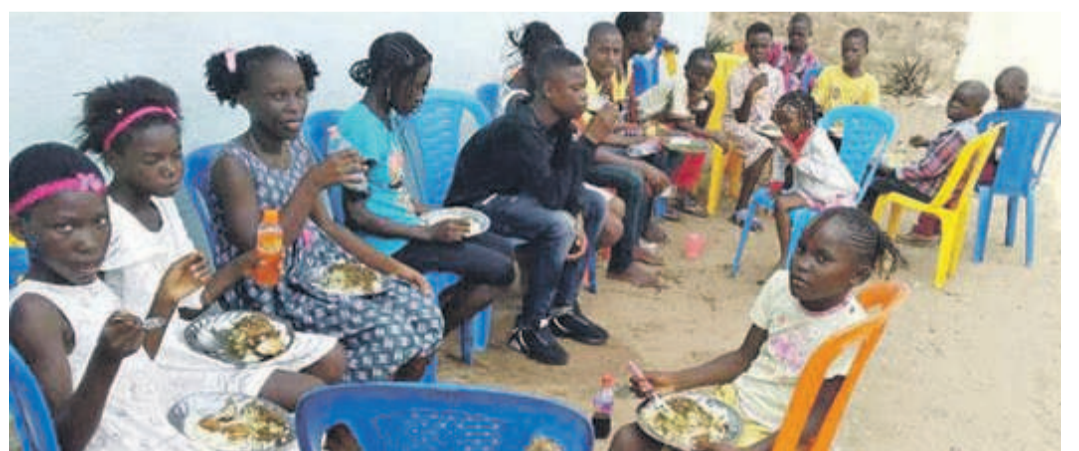
Les enfants d'un des orphelinats en plein repas

La FMA n'a pas dérogé à sa tradition d'intervention sociale en vue d'alléger la tâche des orphelinats de la capitale congolaise dans la prise en charge de leurs pensionnaires. Pour les fêtes de Noël et de la Saint-Sylvestre, cet organisme public sous tutelle du ministère des Affaires sociales, en plus du repas de chœur offert le jour de Noël aux enfants qu'elle prend en charge