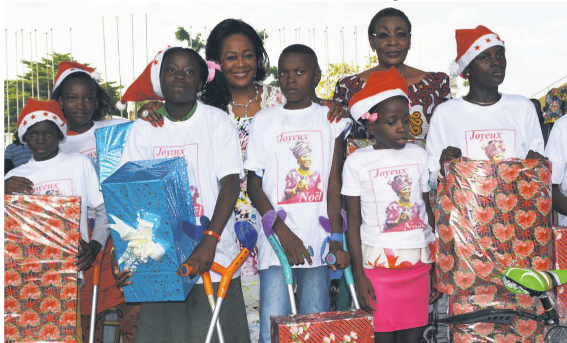
L'épouse du chef de l'Etat posant avec les récipiendaires

les familles unies où les parents témoignent de leur amour envers les enfants », soulignant : « Un moment que nous ne bénéficions pas toujours ».