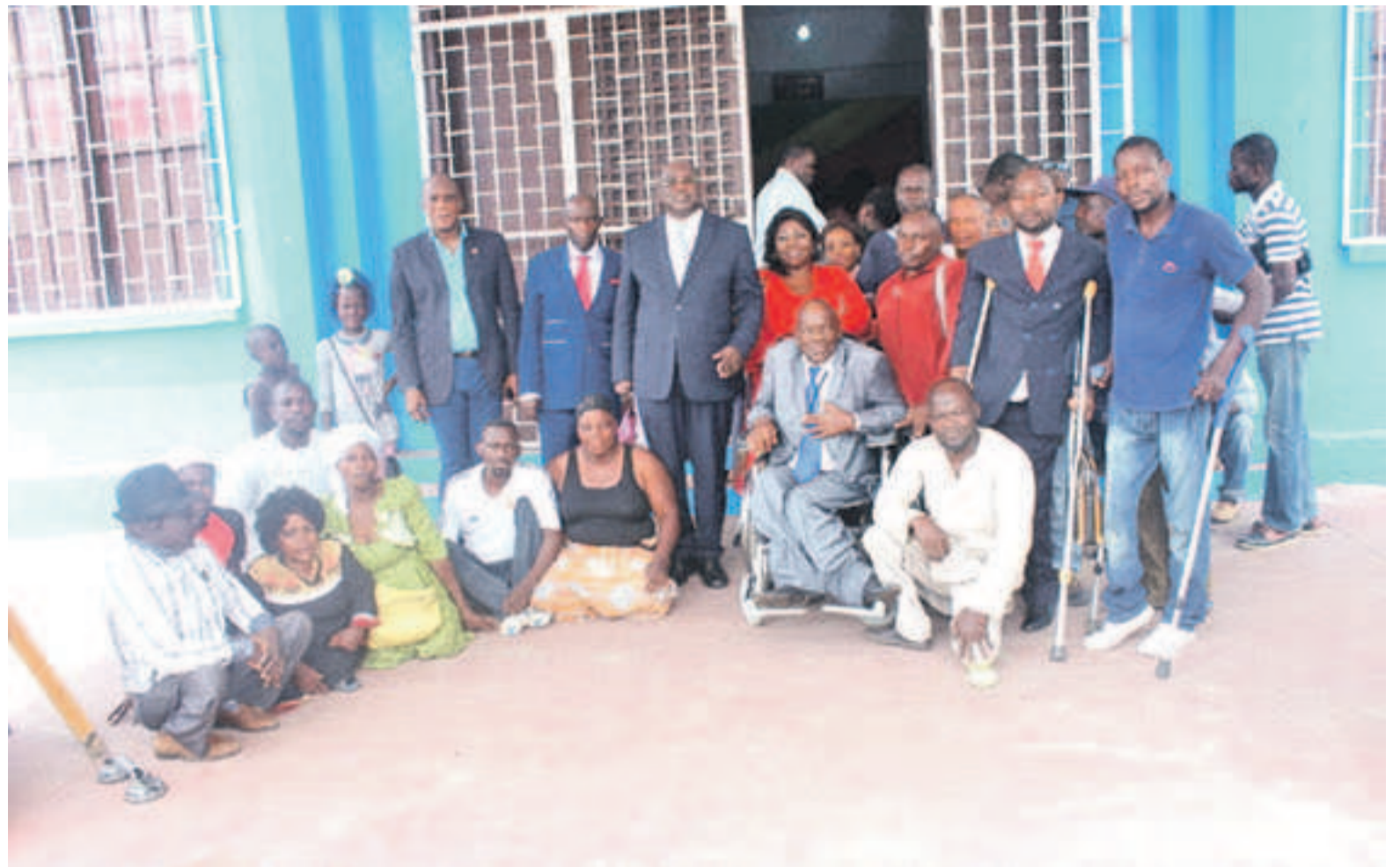
La photo de famille après l'élection

Ému, c'est avec des larmes de joie qu'il a exprimé sa gratitude et sa satisfaction en indiquant : « Je suis ému parce que je prends la responsabilité de défendre les