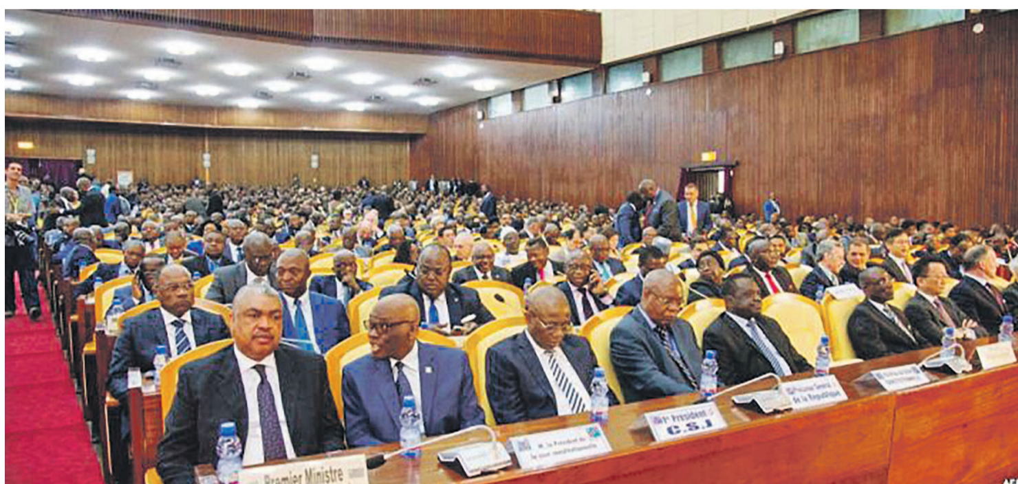
Les députés nationaux en plénière

La Céni a rendu publics, le 11 janvier, les résultats des législatives nationales en tablant sur un corps électoral estimé à 18 329 318 votants. Les résultats ont concerné 485 députés nationaux en attendant les quinze autres qui proviendront des élections de mars prévues à Beni, Butembo et Yumbi. Entre 250 et 300 députés sur les cinq cents que compte l'Assemblée nationale contre une cinquantaine pour Cach, le Front commun pour le Congo (FCC) peut, d'ores et déjà, revendiquer la majorité absolue.