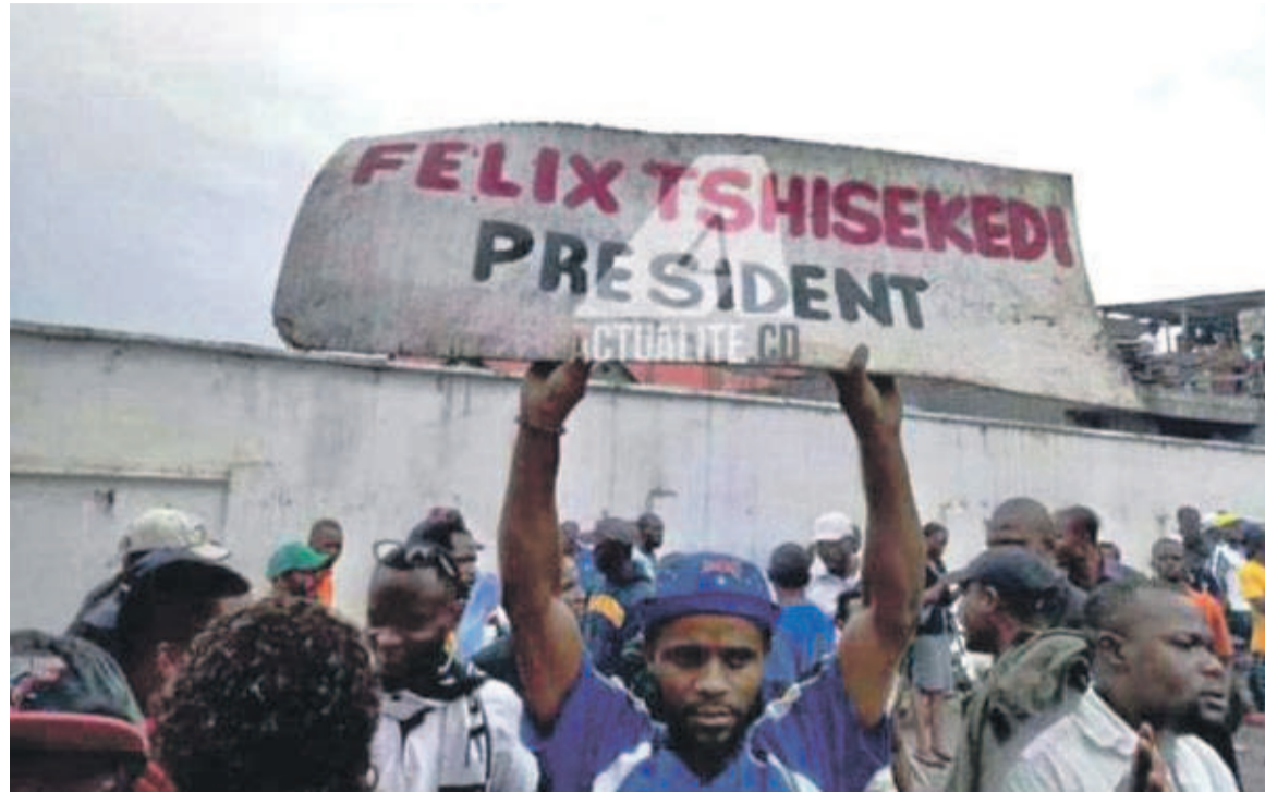
Scène de liesse des militants de l'UDPS

Le peuple kasaien s'est approprié, pour ainsi dire, la victoire de Félix Tshisekedi, exhumant des relents éthiques dans une société congolaise qui apprend à coexister pacifiquement avec ses différences. Des pics lancés à l'endroit des partisans de la coalition Lamuka ont sonné faux jusqu'à susciter, dans le chef de ces derniers, un sentiment de rejet. Face au triomphalisme outré affiché par les partisans de l'UDPS et dans