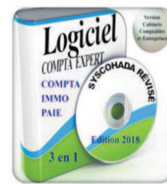
Monopote et réseau

TTN 34 rue Labat 75018 Paris - Fret Maya-Maya