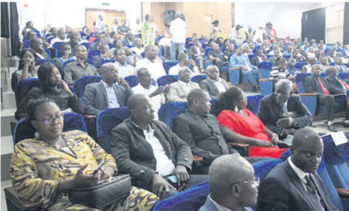
Une vue de l'assistance lors de la cérémonie de la Journée nationale du civisme