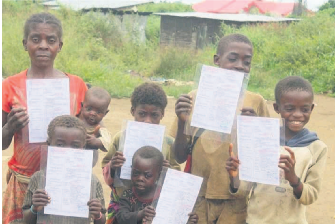
Les autochtones brandissant leurs actes de naissance

Avec l'appui de l'Unicef, plusieurs actions de responsabilisation communautaire ont été menées dans le département de la Lékoumou, de 2016 jusqu'à ce jour. Préfet, sous-préfets, maire, chefs de village, de quartier et de bloc se sont mobilisés pour l'opération « Un au-