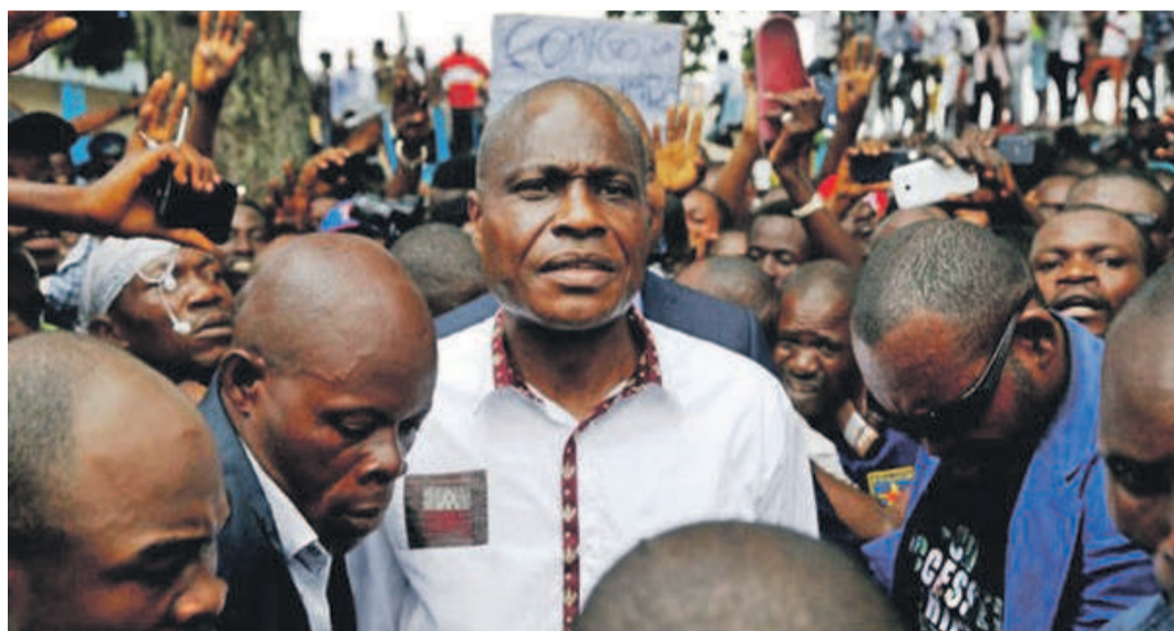
Martin Fayulu devant la Cour constitutionnelle