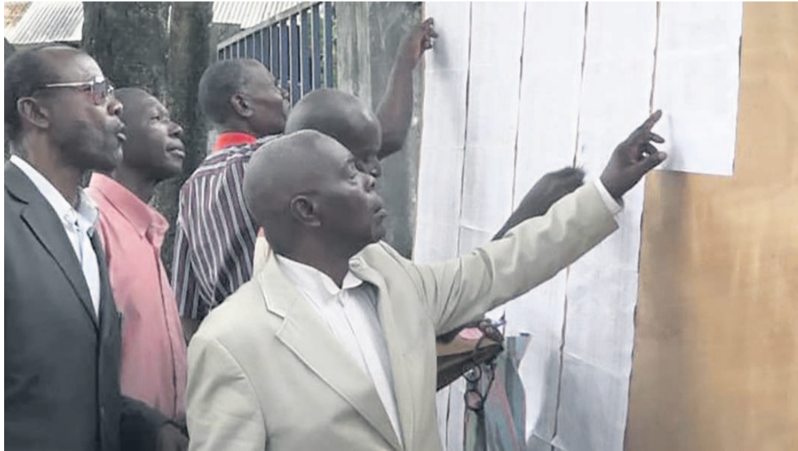
Les agents de l'ex-ONPT vérifiant leurs noms sur les listes

Les listes des agents de l'ex-Office national des postes et télécommunications (ONPT), bénéficiaires pour le compte de la Télé mutuelle, viennent d'être publiées. Les intéressés ou les ayants droit de ceux qui ne sont plus en vie entreront en possession des fonds après le transfert du Trésor public à la Banque postale du Congo, précisent les sources syndicales et administratives. Une partie de la somme disponible est reversée à la sécurité sociale pour la prise en charge de la pension des ex-agents par la Caisse de retraite des fonctionnaires (CRF) ou par la Caisse nationale de sécurité