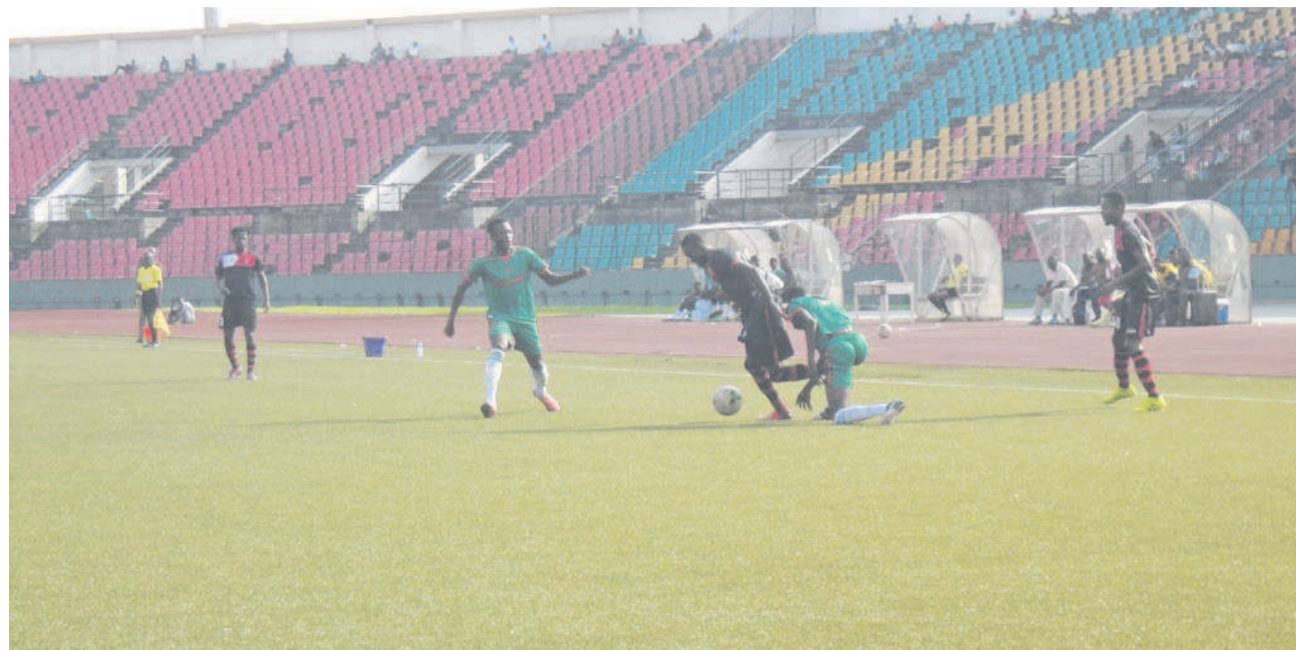
Une séquence du match Cara-As Cheminots

La brillante victoire des Aiglons, 4-0 contre les Cheminots, le 10 février au stade Alphonse-Massamba-Débat, leur permet de se hisser à la tête de la compétition, au terme de la dixième journée.