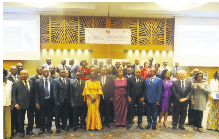
Les délégués du forum de Brazzaville

La Banque africaine de développement (BAD) se propose d'encourager et de soutenir les États africains à imaginer de meilleures politiques agricoles qui mettent un accent sur la formation et la création de la chaîne de valeur, en vue d'accroître l'attractivité du secteur auprès des jeunes.