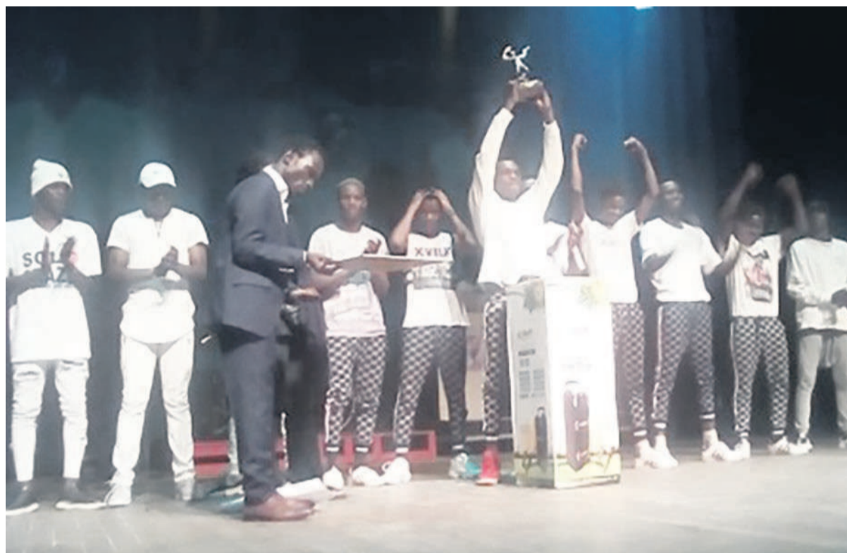
Les artistes du groupe I Dance brandissant le trophée

Après cinq semaines de compétition aux ateliers Sahn, les membres du jury ont éliminé plusieurs groupes pendant son déroulement, pour ne retenir que quatre à la finale. Il s'est agi de I Dance jr, Mini Jaz, Armée street et Black. Au terme de trois passages sur scène, les membres du jury ont ainsi jeté leur dévolu sur les jeunes d'I Dance. Chaque groupe avait trois minutes de démonstration à travers un thème précis. Absent, Armée street a été éliminé dès le premier passage. Mini Jaz a développé, dans sa séquence de danse, le sujet portant sur l'esprit d'équipe ; les Blacks ont dénoncé les mauvaises pratiques en milieu scolaire tandis que les I Dance jr ont invité, à travers