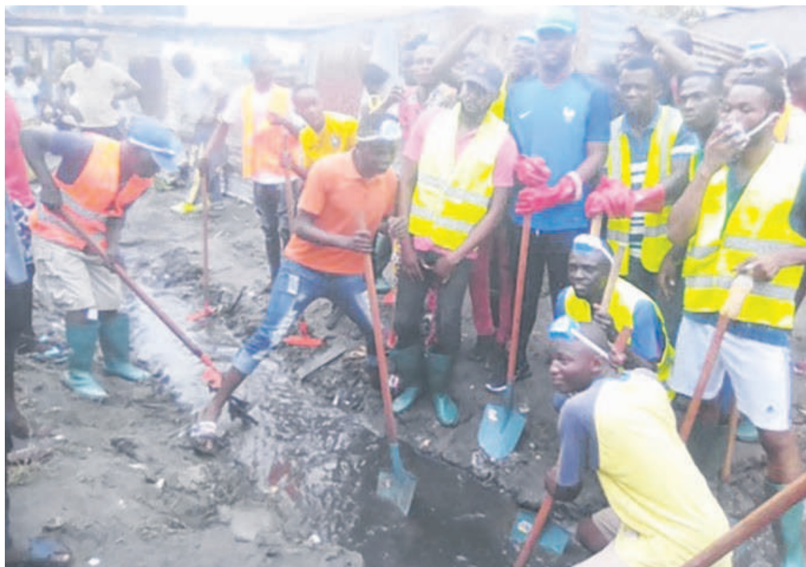
L'opération salubrité au quartier 67, à Ouenzé

« L'assainissement de notre environnement doit être un véritable défi pour tous les citoyens. Au-delà de la circulaire du Premier ministre, nous avons aussi pensé qu'il était normal de travailler pour que notre environnement soit plus propre car, la propreté chasse les maladies. Nous avons aussi décidé qu'il fallait distribuer des moustiquaires imprégnées pour combattre le paludisme