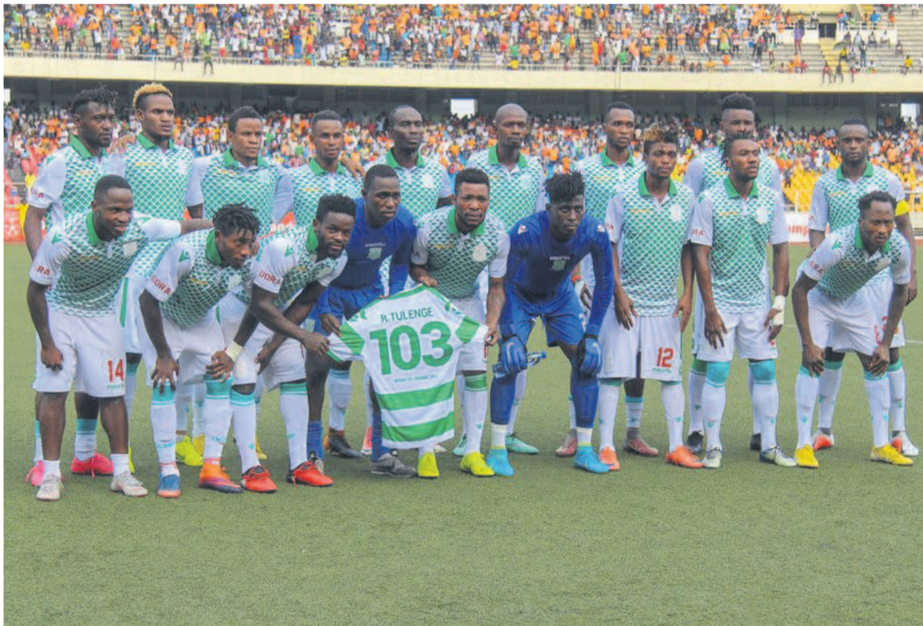
DCMP avant le match contre Sanga Balende, le 10 février, à Kinshasa