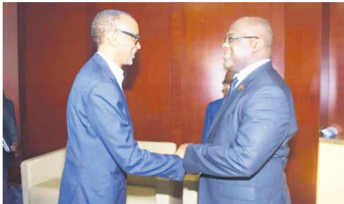
Félix Tshisekedi et Paul Kagame

Mission accomplie donc pour Félix Antoine Tshisekedi Tshilombo qui a réussi, pour sa première sortie sur la scène politique africaine, à rallier à sa cause presque tous les chefs d'Etat présents. Même les plus critiques sur son élection, à l'image du Rwandais Paul Kagame qui convoqua une réunion d'urgence le 17 janvier à Addis-Abeba, demandant la suspension de la publication des résultats de la présidentielle du