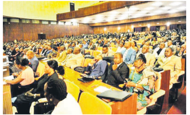
Des députés nationaux au cours d'une plénière

Juste après la validation des mandats des députés nationaux, le bureau va s'atteler sans transition à la mise en place d'une commission spéciale chargée d'élaborer le règlement intérieur de l'Assemblée nationale qui sera adopté lors d'une séance plénière ultérieure. Les