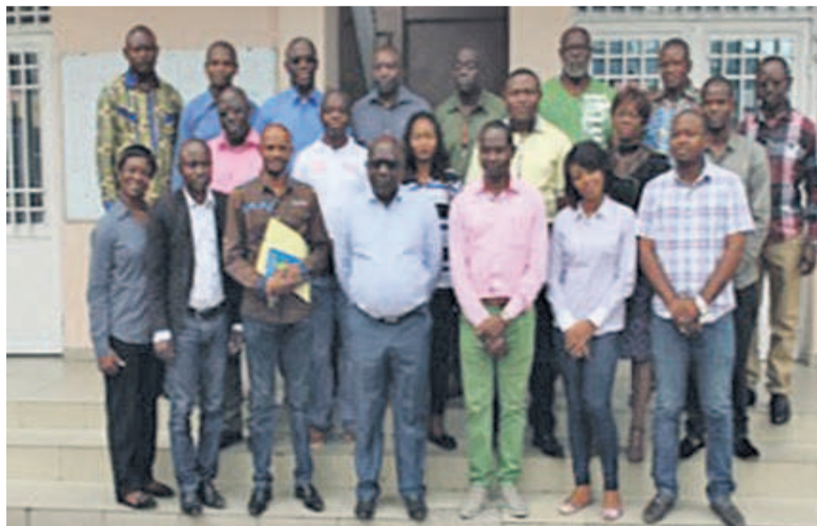
Les participants à l'évaluation du programme Diro

Pour le secrétaire exécutif de Caritas Congo, l'A2P-Diro a été élaboré de manière concertée