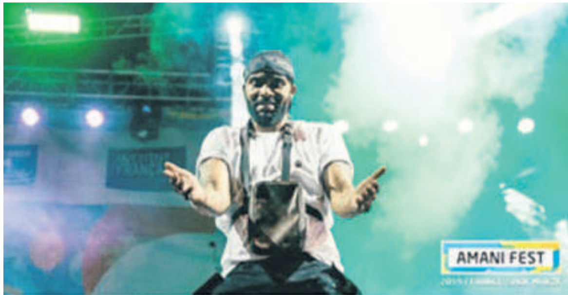
Fally Ipupa à l'ouverture de la sixième édition du Festival Amani Photo 2 : Une vue du public en face de la scène principale

Le collège Mwanga a accueilli trente-six mille festivaliers pendant les trois jours de l'événement, du 15 au 17 février. Un succès de foule prévisible avec le sold out annoncé la veille de l'ouverture pour les premier et dernier jours.