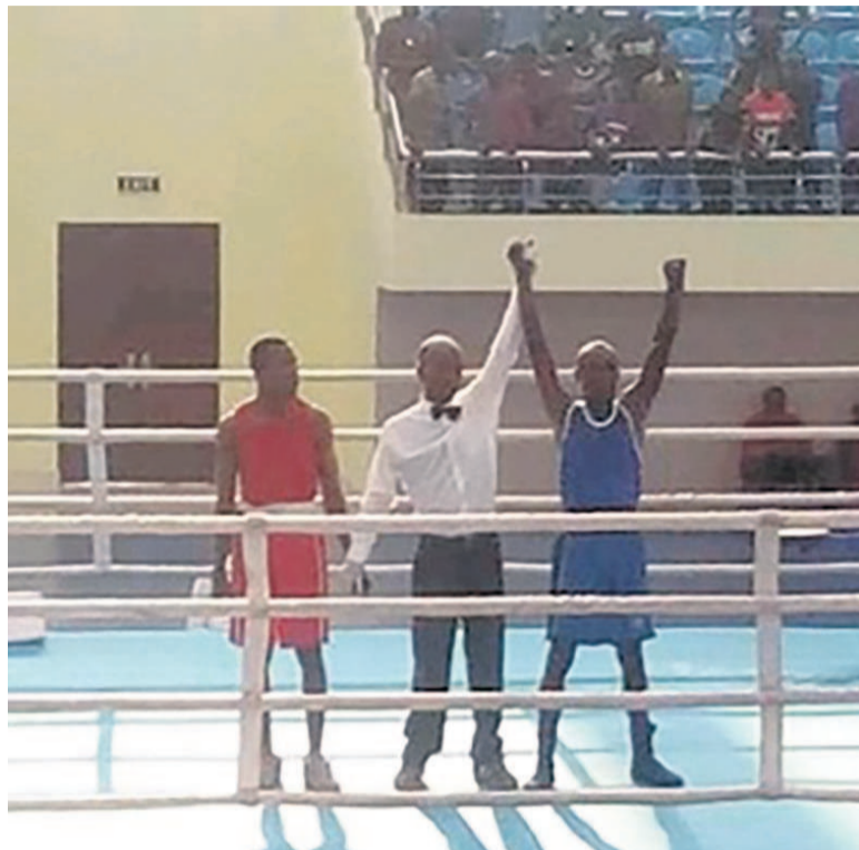
Une séquence d'un match de basket-ball

La première édition du challenge « Les élites de Brazzaville » a été organisée du 15 au 17 février, dans la ville capitale, en vue de repérer les meilleurs boxeurs qui vont composer l'équipe départementale.