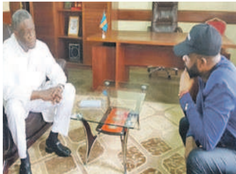
Entrevue entre Fally Ipupa et le Dr Denis Mukwege, samedi à Panzi

Au lendemain de son concert au Festival Amani, le 16 février, le chanteur a eu une entrevue avec le prix Nobel à l'hôpital dont il est médecin directeur.