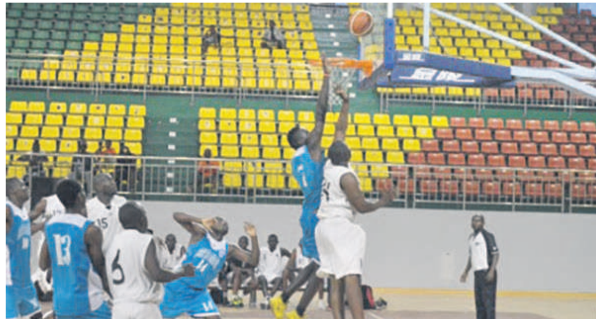
Une séquence d'un match de basket-ball

Initialement prévue le 15 février, la compétition va finalement démarrer deux semaines après pour permettre à tous les clubs engagés d'être dans les normes.