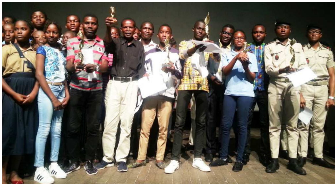
Les lauréats brandissant leurs trophées

La manifestation a décerné deux prix d'excellence, cinq prix de meilleures troupes et huit reconnaissances de meilleurs acteurs au terme d'une compétition qui a réuni, au total, huit établissements de Brazzaville, du 13 au 15 février, à l'Institut français du Congo (IFC).