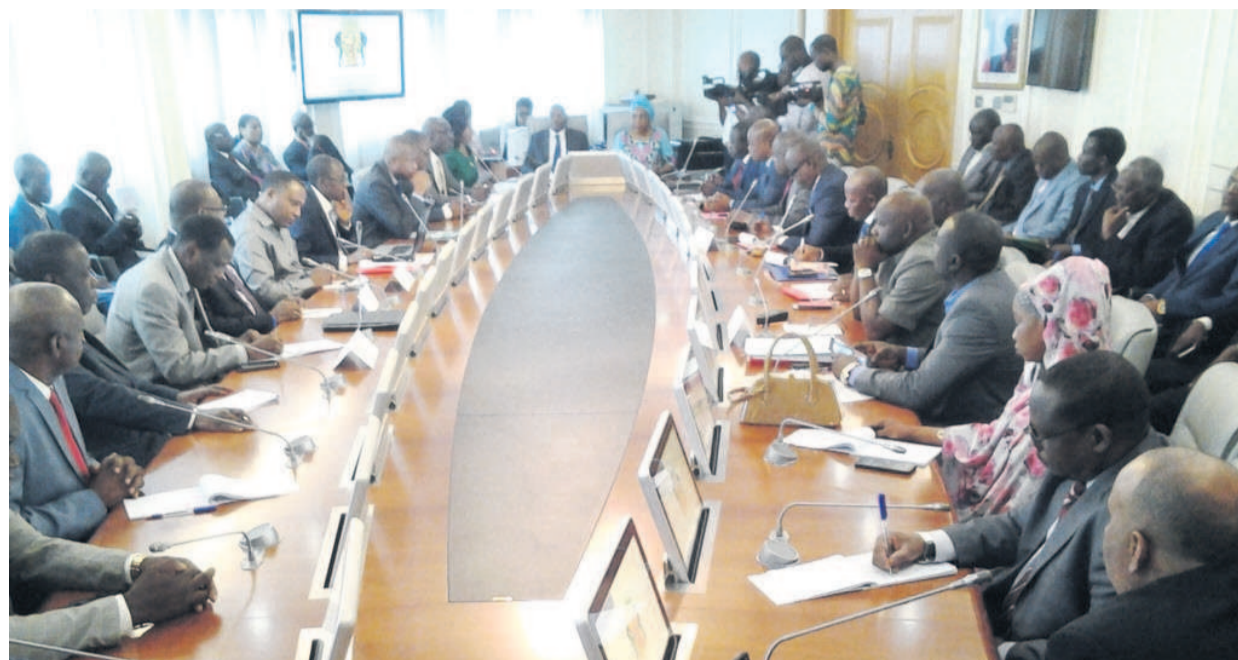
Les membres du comité d'organisation lors des travaux

Afin de mobiliser les financements nécessaires à l'exécution du projet d'intégration sous-régionale, une table ronde des partenaires techniques et financiers est prévue au mois de juin.