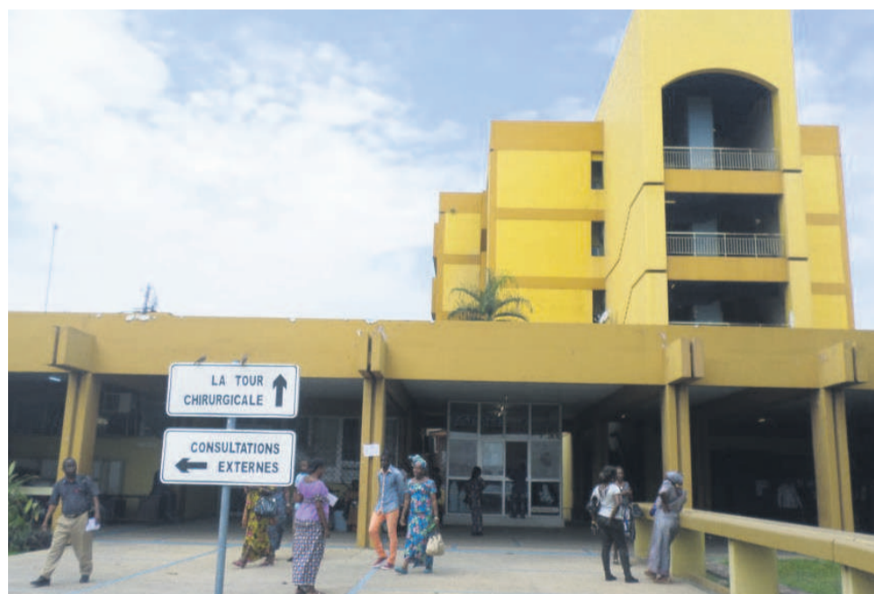
Des patients à l'entrée principale du CHU de Brazzaville