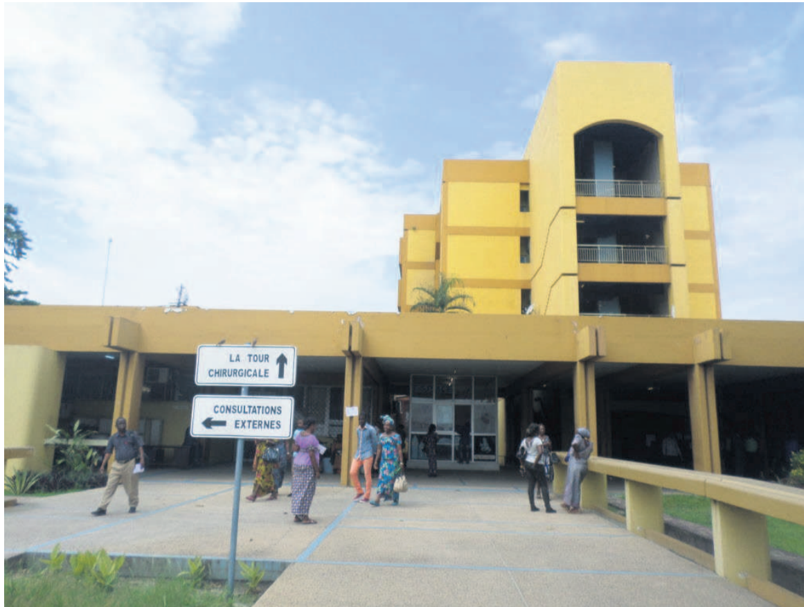
Des patients à l'entrée principale du CHU de Brazzaville d'évasion soit un taux de 1,8%.

Une triste réalité observée dans plusieurs structures sanitaires. Le taux d'évasion des malades varie selon les hôpitaux et selon les services en leur sein. Les informations recueillies à la direction de l'information sanitaire du ministère de la Santé et de la population précisent que la direction départementale de la santé du département de la Bouenza a enregistré trente et un cas d'évasion (premier trimestre 2018), trente cas à la même période dans la Cuvette. Aucune information n'a filtré, à ce propos, concernant les départements de la Cuvette ouest, de la Sangha, du