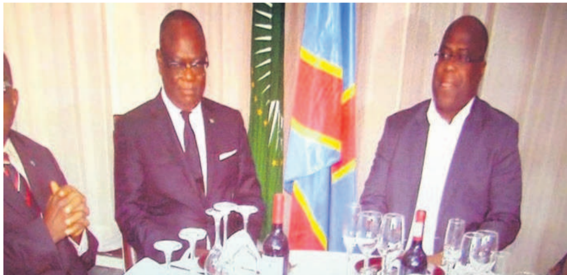
La délégation de Cach/Grand Bandundu reçue par Félix Tshisekedi

L'information a été donnée par Félix Tshisekedi lui-même, recevant les personnalités et notables du Grand Bandundu, le 18 février, à la cité de l'Union africaine.