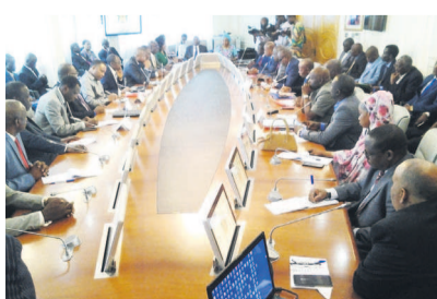
Les membres du comité d'organisation lors des travaux

Chapeautés par la Banque africaine de développement, ces bailleurs de fonds seront également amenés à mobiliser les ressources pour la réalisation du prolongement du chemin de fer Kinshasa-Ilébo. Une réunion du comité d'organisation de cette table ronde s'est tenue hier, à Brazzaville. Page 2