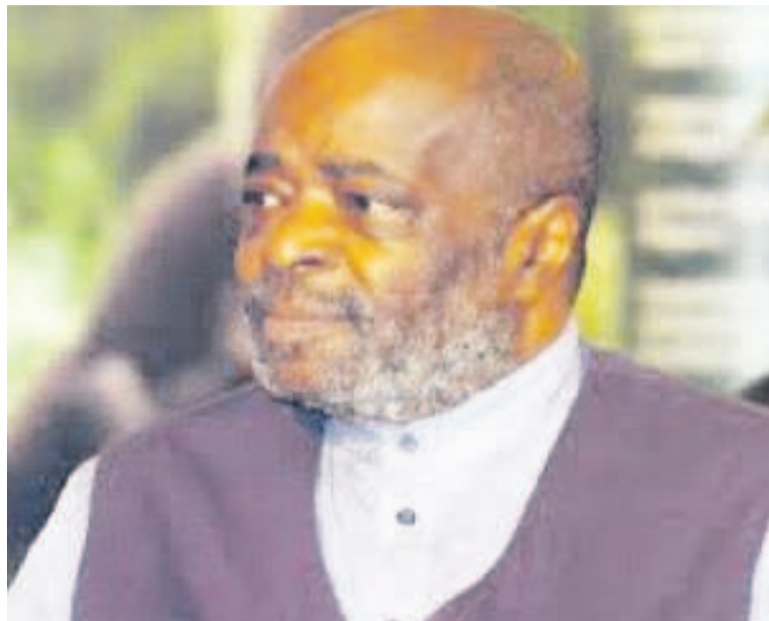
L'ancien vice-président, Yerodia Abdoulaye Ndombasi

Le fidèle compagnon du feu président Laurent-Désiré Kabila a tiré sa révérence à l'âge de 86 ans, hier, à l'hôpital du Cinquantenaire à Kinshasa, des suites d'une longue maladie, apprend-on des sources familiales.