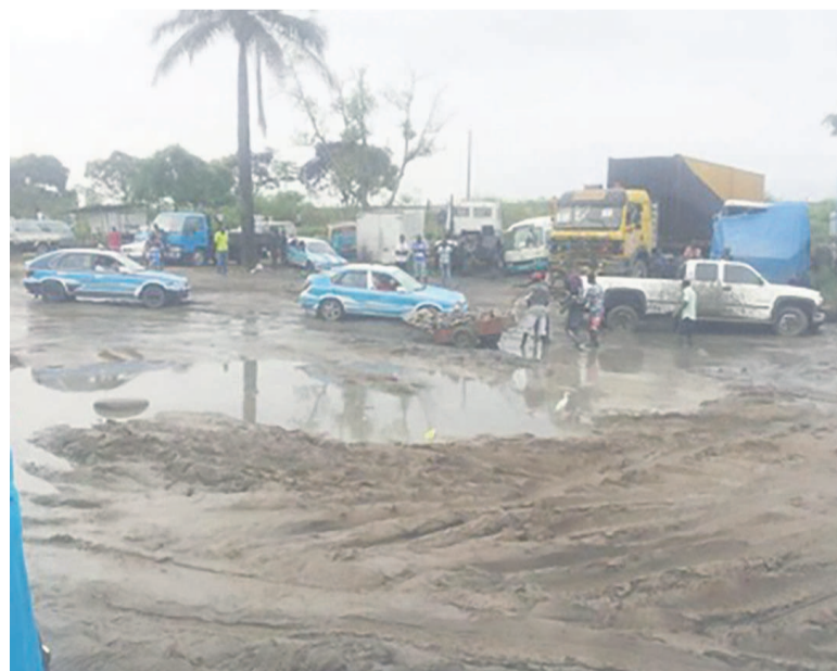
Une partie de l'avenue Marien-Ngouabi en très mauvais état