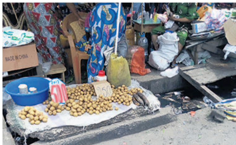
Des pommes de terre posées sur un caniveau rempli d'eau et d'ordures

mate, des congelés, du pain, des beignets, des gâteaux, des jus, etc...sont des produits dont il est question. Exposés aux rayons de soleil, à la poussière et aux mouches à longueur de journée, ces produits s'avèrent dangereux pour la santé des consommateurs. Comme il ne suffisait pas pour détruire la santé, juste à côté de ces commerçants se