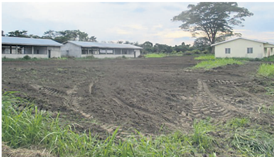
Le centre cummunautaire d'Otsendé

« Nous sommes venus voir dans quel état se trouvent ces centres et comment les redynamiser pour l'intérêt des communautés locales »,