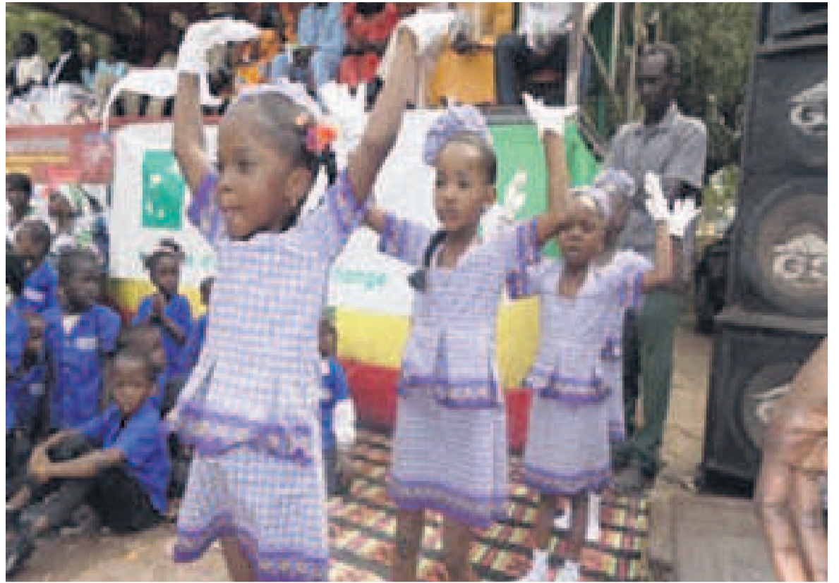
Des enfants égayant le public lors de la cérémonie