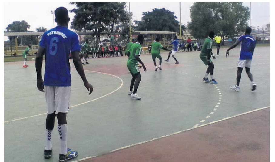
Un match opposant Patronage à l'As Cheminot