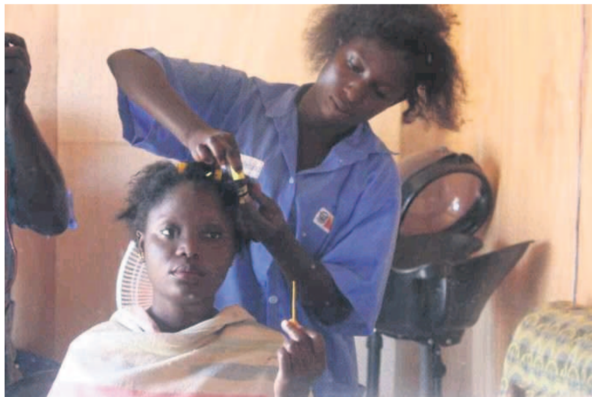
Une des bénéficiaire du projet dans un salon de coiffure.

Il y a, par ailleurs, Doucha Nzitokoulou, une fille-mère vivant à Ouessou (département de la