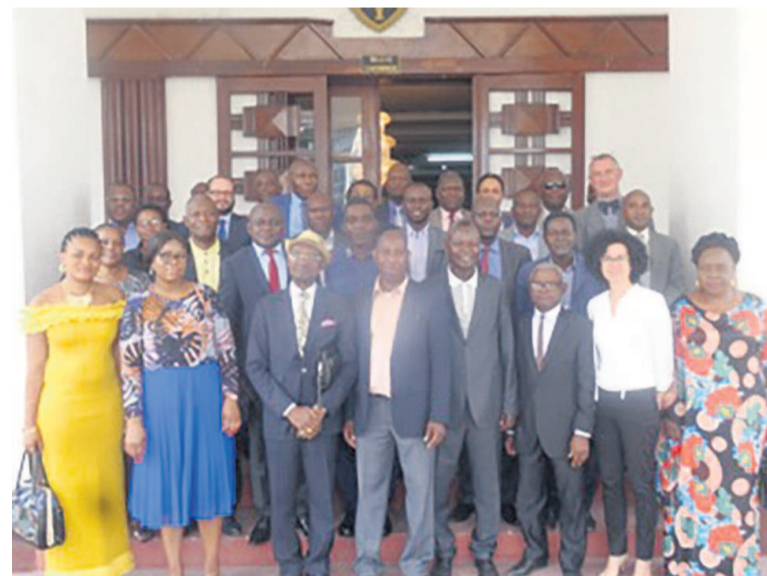
La photo de famille

En effet, les sociétés membres de l'alliance sont surtout at-