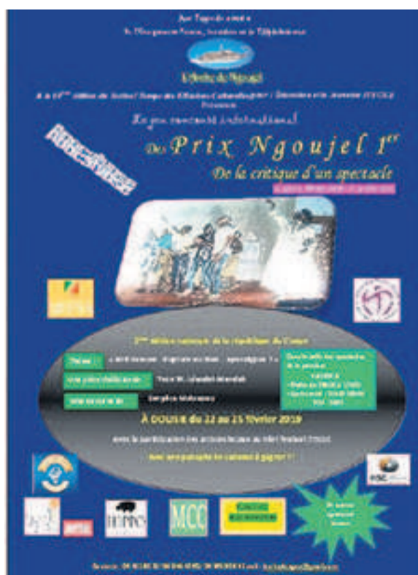
L'affiche de Tecej 2019

Le Prix Ngoujel 1er de la critique d'un spectacle est un jeu concours ouvert aux jeunes âgés de moins de 26 ans. Ils sont conviés à décrypter, en un ou plusieurs tours d'épreuves écrites, la forme et le fond du spectacle choisi sur la base des questionnaires préalablement publiés. Par ces faits, l'activité s'avère intensément transversale, alliant le côté artistique, littéraire et pédagogique. Un parfum de tourisme y est ajouté par la tournée du spectacle critiqué (dans les caravanes culturelles) et la réalisation des mini-festivals à certaines escales. Le jeu concours Prix Ngoujel 1er, adopté en 2017 comme activité internationale par l'assemblée générale du 33e congrès mondial de l'ITI-Unesco à Segovie, en Espagne, offre plusieurs opportunités aux enfants, notamment celles d'aller poursuivre les études supérieures dans les universités