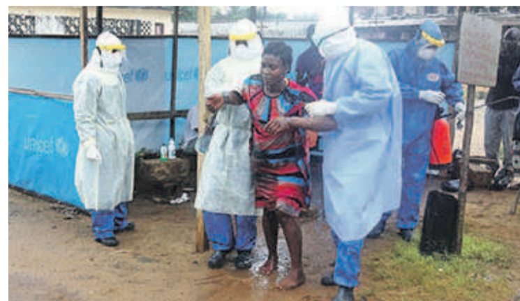
Prise en charge d'un malade atteint d'Ébola nouveaux cas confirmés d'Ébola au cours des vingt et un derniers jours.

La RDC est sur le point d'éradiquer la maladie qui sévit dans les provinces du Nord-Kivu et de l'Ituri depuis le 1er août 2018 car aucun nouveau cas n'a été rapporté dans cette ville. Selon le ministère de la Santé, le 19 février a marqué le 21e jour sans nouveau cas confirmé d'Ébola dans la zone de santé de Beni. Il s'agit donc d'une avancée majeure après la flambée épidémique qui avait atteint des pics importants entre septembre et novembre 2018. Outre la zone de santé de Beni, d'autres comme Kayina, Mandima, Musienene, Nyankunde et Tchomia n'ont pas également notifié de