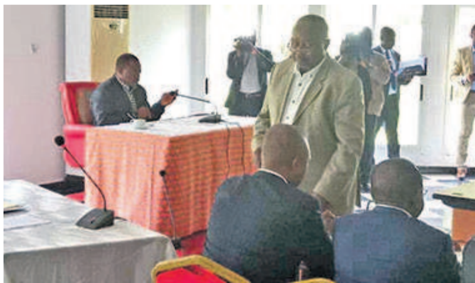
Joseph Kabila face aux membres du FCC le 20 février à Kingakati