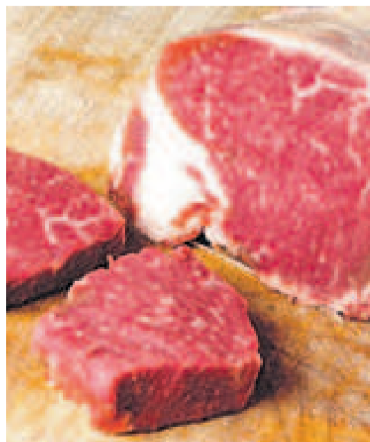
La viande de porc