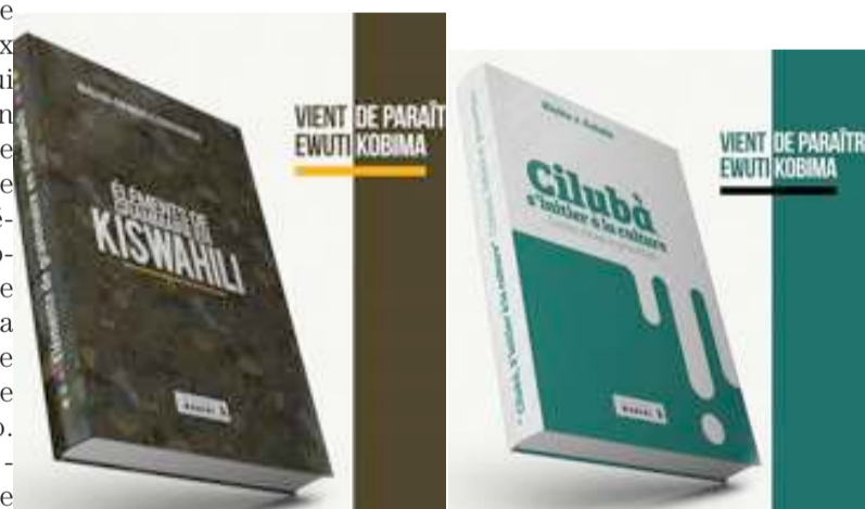
Legendes et credit photos: Photos: Les différents livres publiés