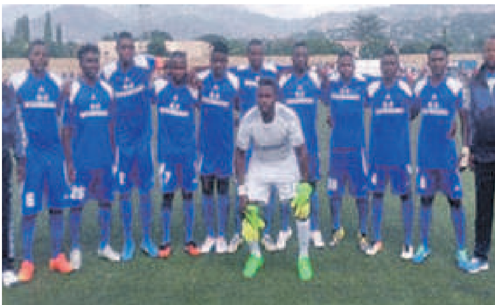
Muungano de Bukavu exclu du championnat 2018 - 2019

La Ligue nationale de Football (Linafoot) a exclu l'Omnisport club Muungano de Bukavu de la 24 e édition du championnat national de football. La principale cause de cette décision est le fait d'avoir écopé trois forfaits. Le club du Sud-Kivu a brillé par son absence à trois rencontres. D'après le communiqué de la Linafoot, la commission de gestion s'est fondée sur différents rapports relatifs à ces trois matches. Il s'agit précisément des matches contre le Daring Club Motema Pembe le 28 septembre 2018 à Kinshasa, celui face à l'AC Rangers le 21 novembre 2018 et contre Mont Bleu de Bunia, le 14 février, à Goma.