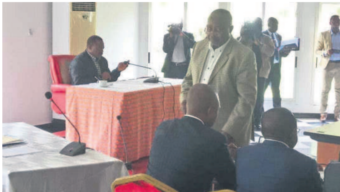
Legendes et credit photos: Joseph Kabila face aux membres du FCC, mercredi à Kingakati

L'ancienne coalition électorale s'est transformée en majorité parlementaire au sein de l'Assemblée nationale et des assemblées provinciales, au cours d'une rencontre tenue le 20 février, à Kingakati, sous la conduite de l'autorité morale, Joseph Kabila.