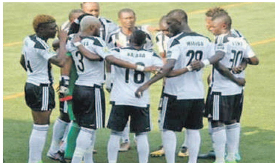
Mazembe de Lubumbashi

Le forfait infligé à Ismaïly place le représentant congolais en tête du groupe C des huitièmes de finale de la Ligue des champions d'Afrique.