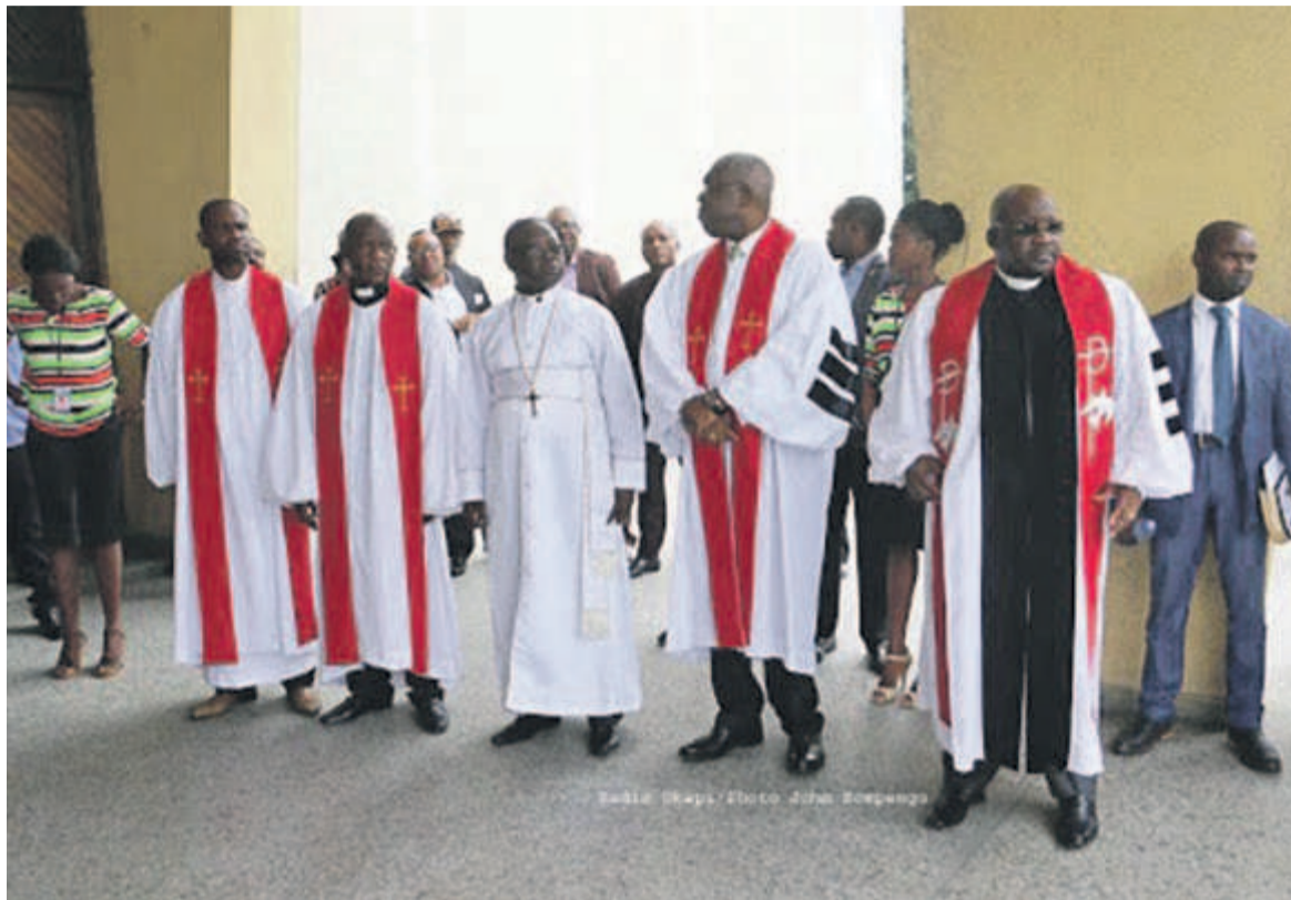
Les responsables de l'Église protestante au Congo (ECC)