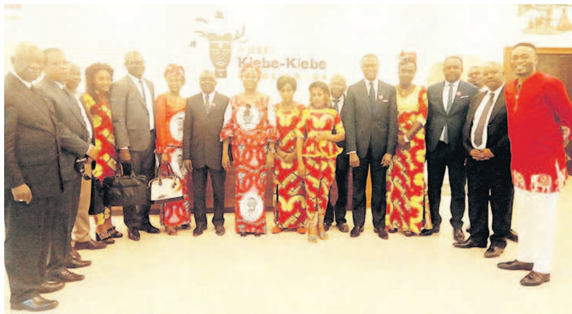
La photo de famille des conseillers du chef de l'État après leur visite au musée kiebe kiebe N'gol'odoua, à Oyo