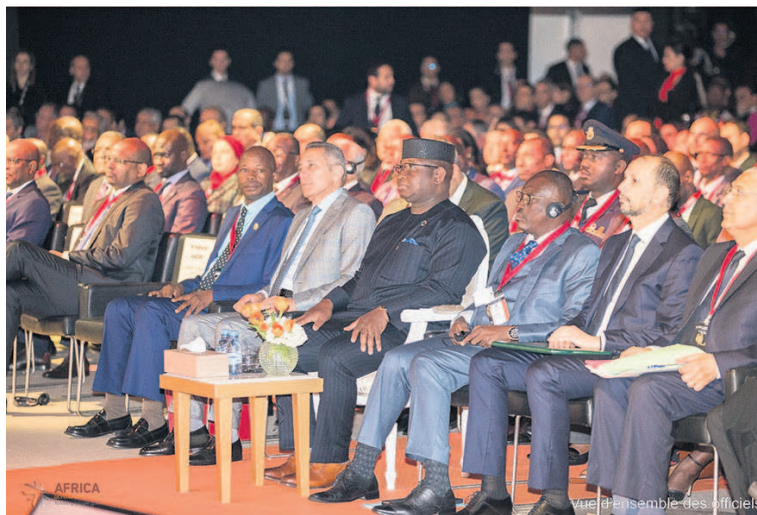
Des officiels à la cérémonie de clôture

C'est dans ce cadre que la première, consacrée sur comment « Accélérer l'intégration économique régionale », a permis aux panelistes de mettre en évidence les besoins, pour le continent, de développer davantage les infrastructures. Il s'agit notamment des infrastructures de connectivité qui constituent un levier essentiel de l'intégration. Quant à la seconde, axée sur le digital en tant que levier de croissance en Afrique et la contribution des jeunes startuppers africains, elle a débouché sur un appel au soutien accru