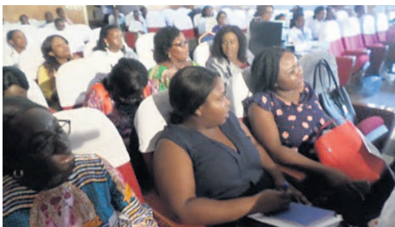
Des femmes médecins membres de l'AFMC

Plusieurs points ont été abordés lors de l'assemblée générale de l'Association des femmes médecins du Congo (AFMC), le 14 mars, à Brazzaville.