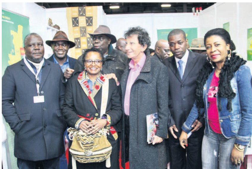
Photo de groupe autour de Jack Lang lors de son passage à l'Espace «Po na Ekolo» à Livre Paris 2019

L'écrivain Emmanuel Dongala, heureux de trouver cet îlot culturel du Congo, s'est attardé longuement, posant pour les photographes et répondant aux questions de journalistes. « Notre littérature africaine a dépassé l'aspect du tropisme... »,