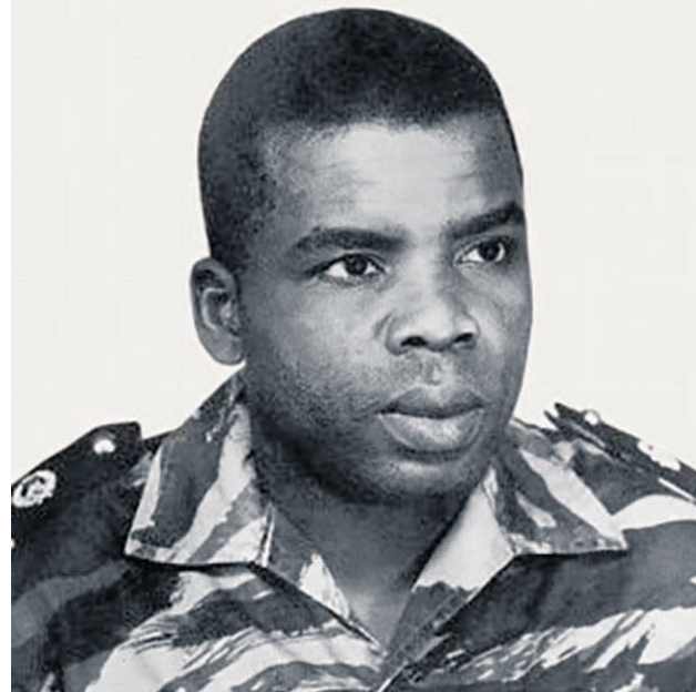
Le président Marien Nguouabi

De plus, le principe de la trilogie déterminante qui associait le parti, le syndicat et la direction dans la gestion, a considérablement nui au rendement des entreprises étatiques. Devant cette évidence, le président Marien Nguouabi, secoué par plusieurs coups d'Etat, lance un programme triennal (1975-1977) de développement économique, social et culturel, d'un coût