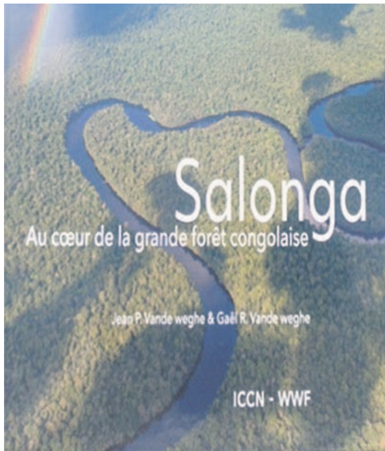
le livre sur le parc national de la Salonga/Adiac

Les rôles écologiques du parc tant à l'échelle nationale que mondiale étant indéniables, ce livre va assurément constituer, pensent les autorités de l'ICCN et du WWF-RDC, une source très riche d'informations. Il dé-