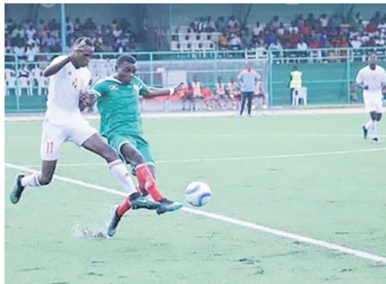
Une séquence du match Burundi-Congo

Les Diables rouges de moins de 23 ans ont contraint les Hirondelles au nul sans but (0-0), le 20 mars au stade de Bujumbura, en match aller du deuxième tour des éliminatoires.