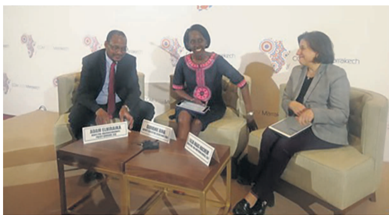
Les experts de la CEA lors de la conférence de presse

Les organisateurs de la session de la CEA se félicitent du fait qu'elle se tient au Maroc; question de renforcer la présence du royaume chérifien en Afrique. Cet Etat est, d'après les experts, le premier investisseur en Afrique au sud du Sahara, alors que les institutions d'Afrique du nord travaillent plus en partenariat