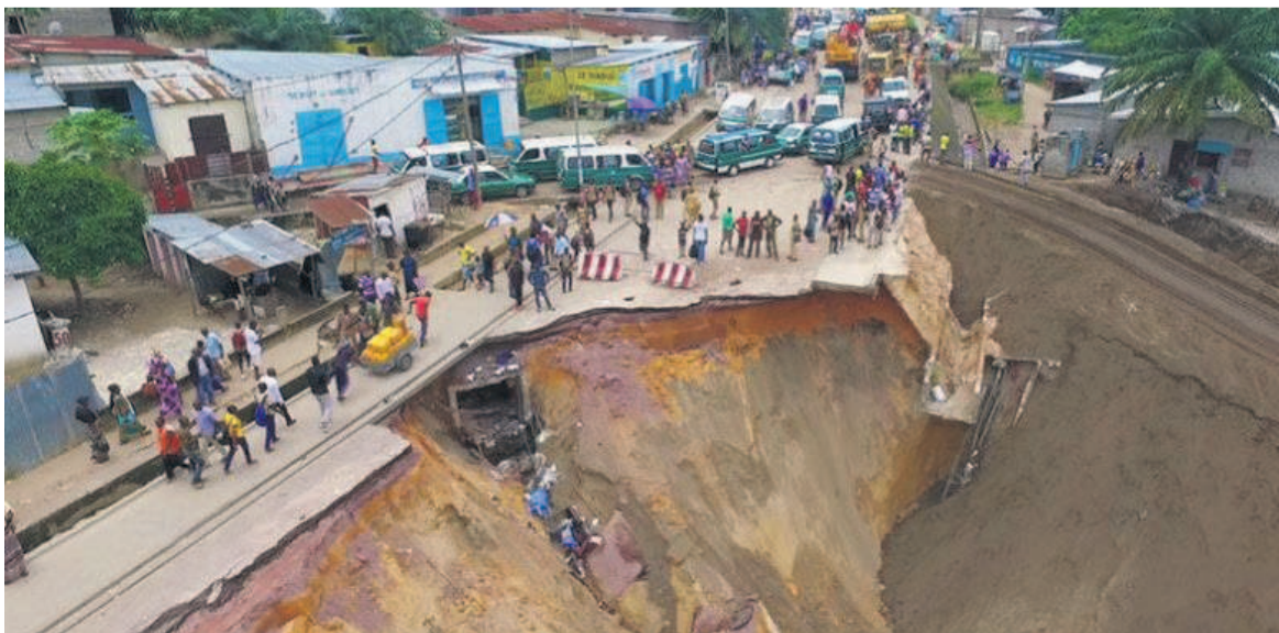
La route de Ngamakosso rongée par l'érosion