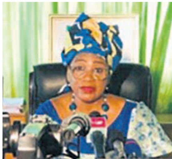
La ministre Rosalie Matondo

« Le thème de cette année exprime sans équivoque la nécessité d'une synergie entre différents secteurs pour la mise en œuvre efficiente de cette initiative, notamment la conception des initiatives pour enrichir le volet pédagogique dans les différents systèmes de formation », a déclaré la ministre de l'Economie forestière avant de relever : « Des actions à entreprendre à cette occasion sont d'informer le plus grand public de la pluralité des biens et services fournis par les forêts ».