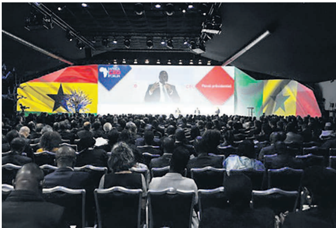
Comme le Sénégalais Macky Sall en 2017, de nombreux chefs d'Etat participeront à l'Africa CEO Forum qui se déroulera à Kigali, les 25 et 26 mars prochains

Participation également confirmée pour Faure Gnassingbé, président de la République du Togo, accompagné d'une délégation ministérielle, qui présentera son Plan national de développement (PND) 2018-2020. Un programme ambitieux qui vise à positionner le pays en hub logistique et financier et, en