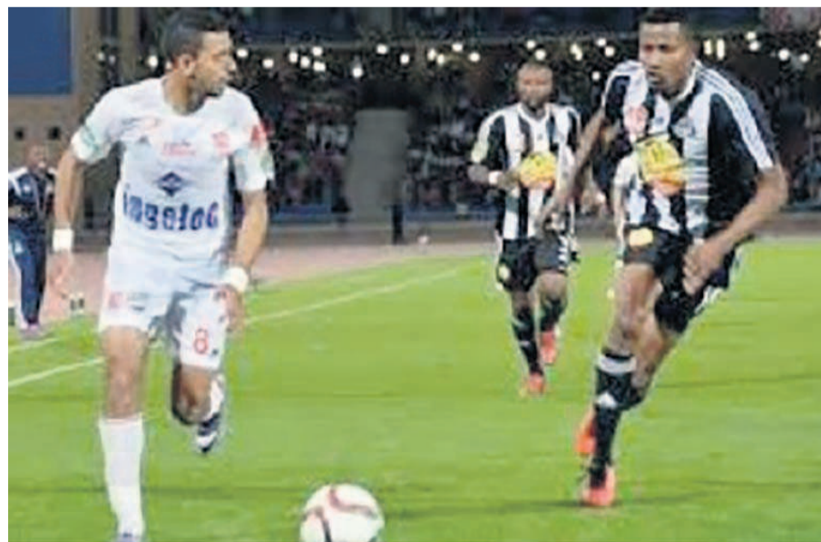
Une séquence du match Tout Puissant Mazembe - CS Constantine