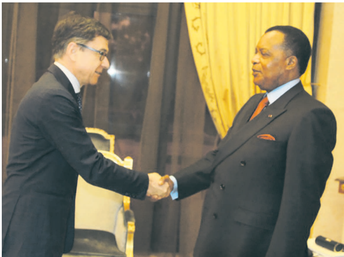
Denis Sassou N'Guesso et Koen Vervaeke

Concernant la République du Congo, il a déclaré : « L'ambassadeur (de l'UE NDLR) a signé un contrat de construction d'un port de pêche à Pointe-Noire. Dans quelques semaines, on va installer des grues au port de Brazzaville. C'est ce genre d'actions que nous allons développer da-