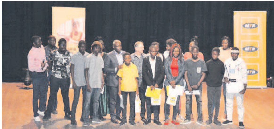
Les lycéens posant avec les autorités au terme du concours