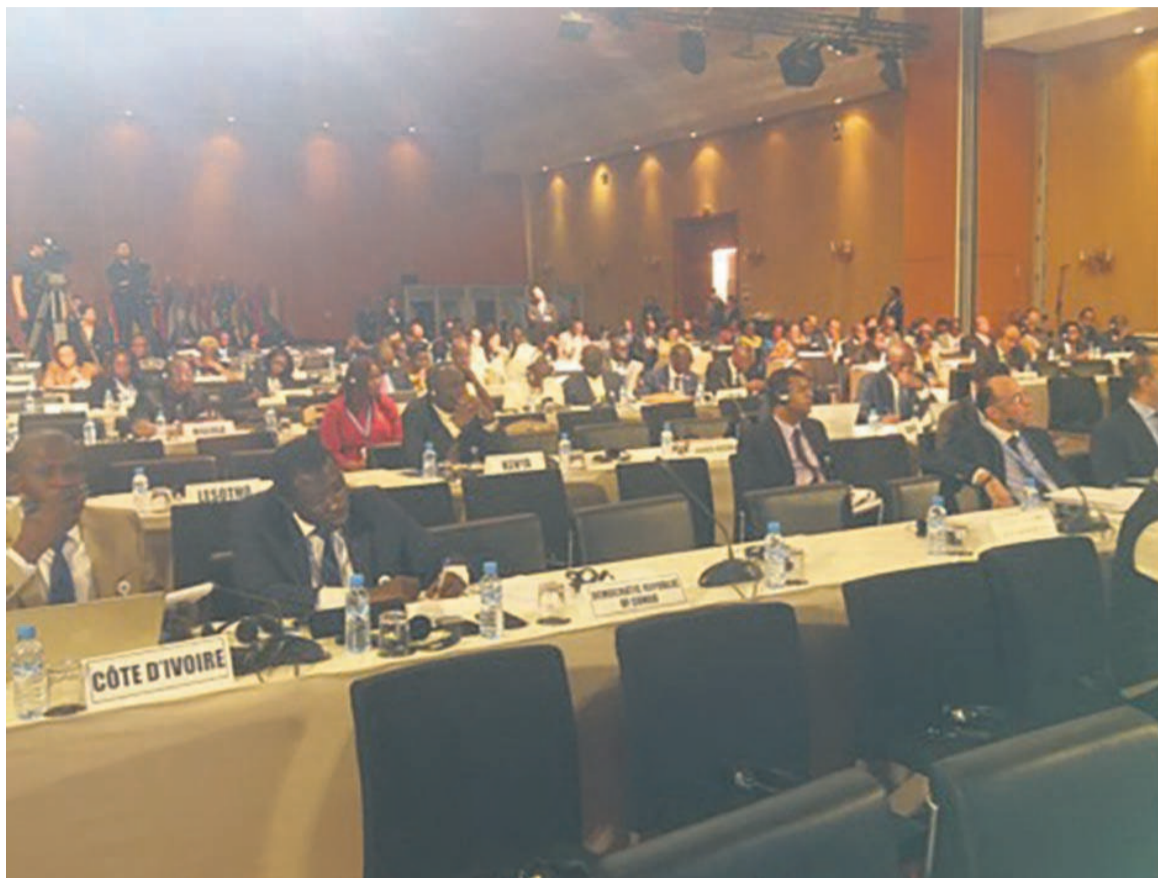
Une vue des participants à la cinquante-deuxième session de la CEA/DR

tripler pour permettre de réaliser les objectifs socio-économiques », ajoutant: « Les conditions macro-économiques de l'Afrique s'améliorent à un lent