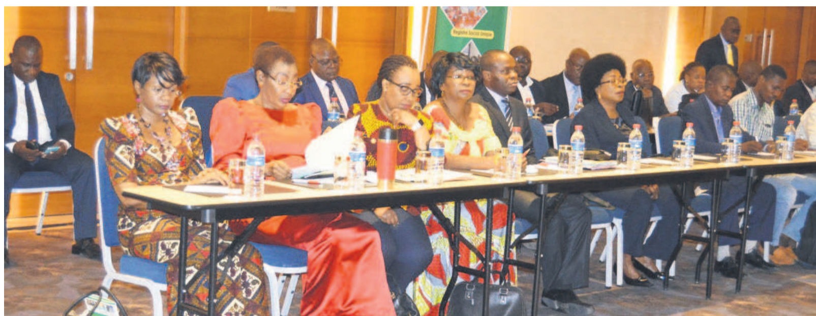
Une vue des participants aux travaux de l'atelier de formation des acteurs impliqués