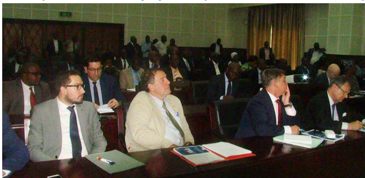
La partie française

Congolais, en tenant compte de l'effectif national.