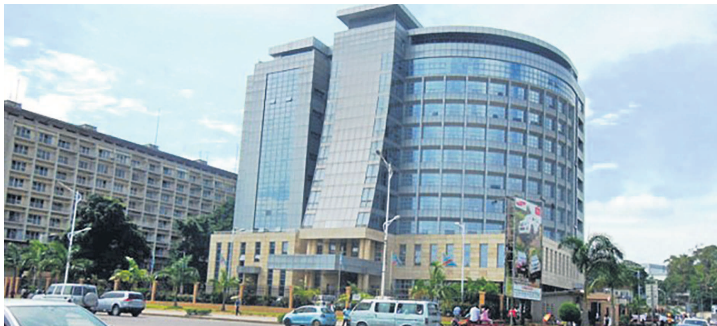
L'Hôtel du gouvernement à Kinshasa

Selon le porte-parole du FCC, c'est au niveau de la présidence de la République qu'il y a blocage, Joseph Kabila ayant déjà fait sa part en désignant parmi les cadres de son regroupement politique, la personne qu'il croit capable d'assumer une telle charge publique. « Aujourd'hui, je peux vous rassurer que du côté de notre autorité morale, Joseph Kabila Kabange, les choses sont déjà accomplies. Le nom a été déjà présenté pour ce candidat qui doit être nommé formateur. Mais comme je l'ai toujours dit, je crois que la question doit être retournée à l'actuel président