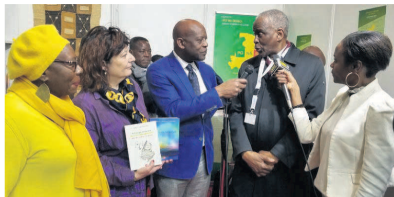
Amara Camara, ambassadeur de Guinée en France vient à la rencontre des écrivains congolais : il en profite pour saluer les écrivains du Bassin du Congo en général, plus particulièrement ceux des deux rives du majestueux fleuve Congo