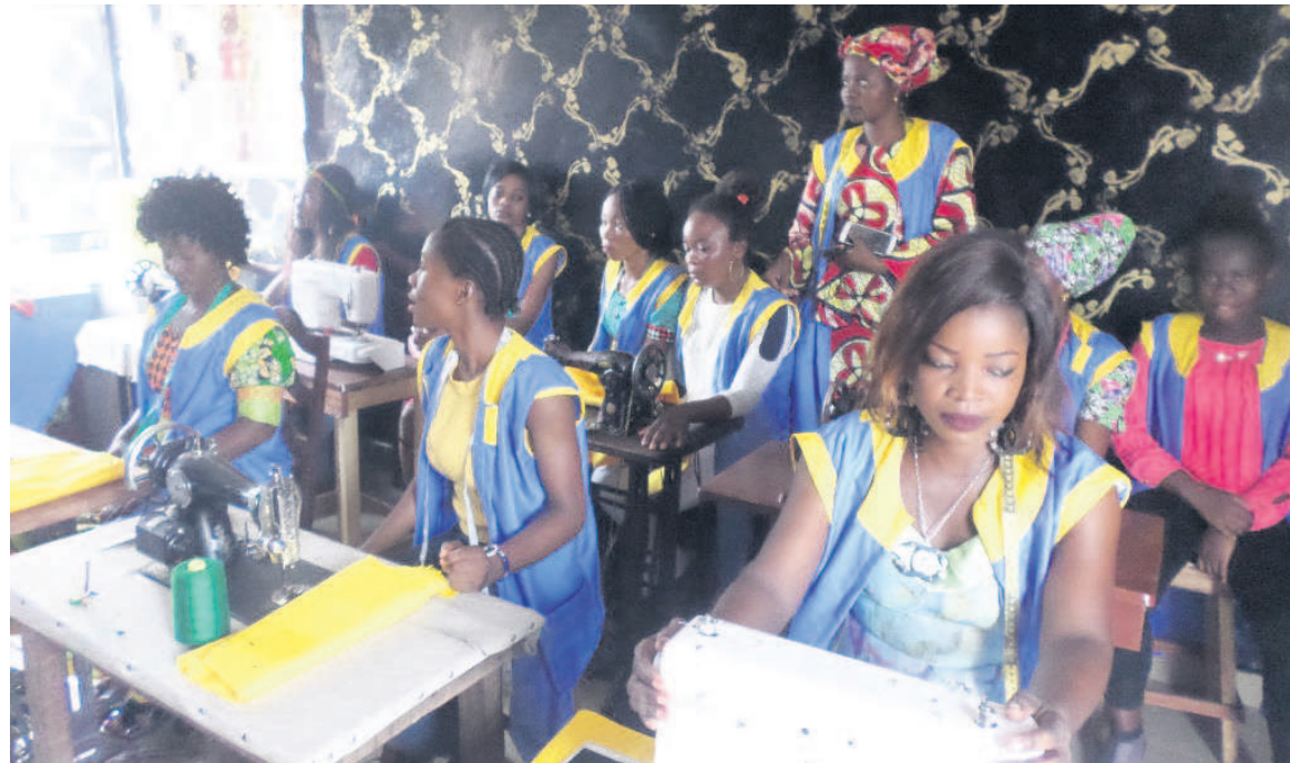
Vue d'un échantillon des stagiaires/Ajac

cette démarche dynamique et pragmatique consistant à créer des activités génératrices de revenus.