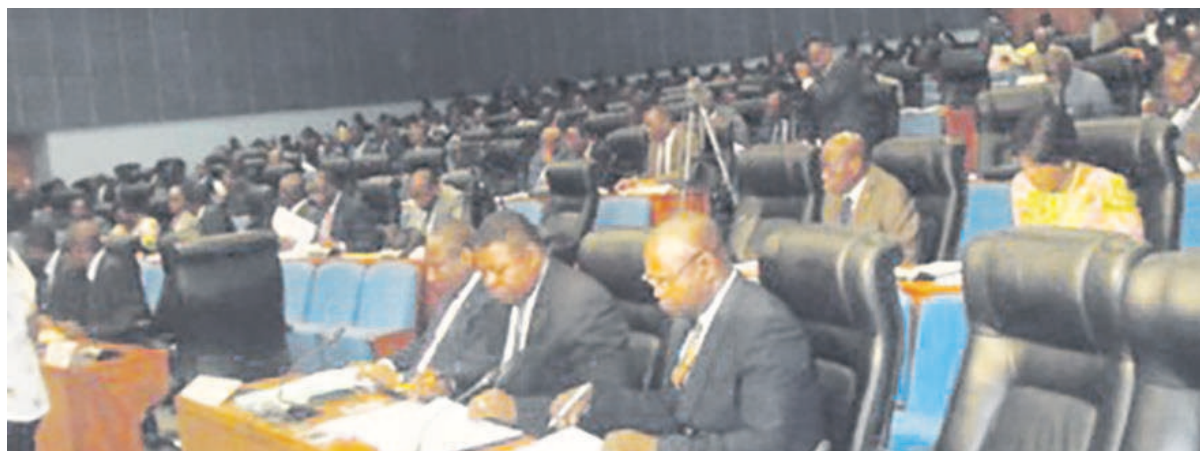
Une vue des députés lors de la plénière du 21 mars

La chambre basse du parlement a adopté, le 21 mars, le projet de loi portant les missions, l'organisation et le fonctionnement de la police nationale. L'adoption de ce texte a suscité un débat passionnant entre l'opposition et la majorité présidentielle, sur les attributions de la direction générale de la surveillance du territoire (DGST).