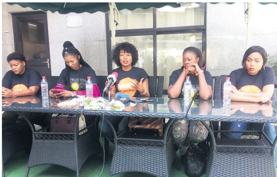
Les leaders de l'association Femme modèle, lors de la conférence de presse

La plate-forme féminine va lancer, le 29 mars, à Brazzaville la cinquième édition de son programme « Women's activity awards », dédiée cette année à l'appui et au suivi des femmes victimes des violences commises par leurs conjoints.