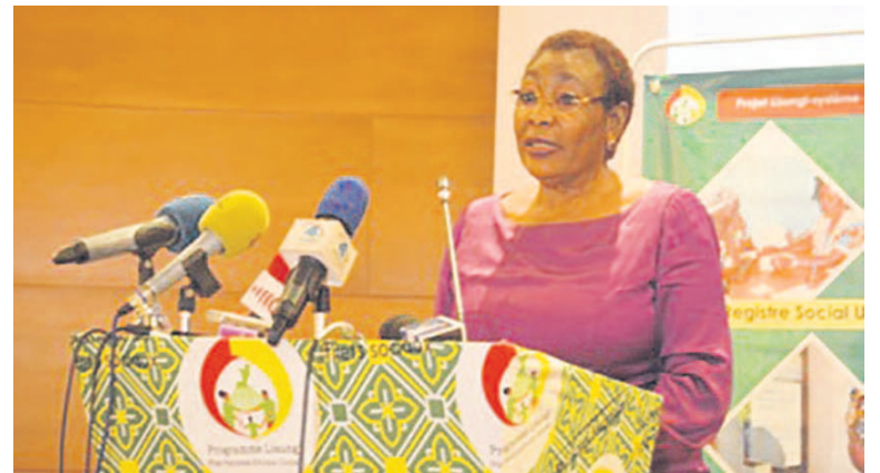
La ministre des Affaires sociales et de l'action humanitaire en conférence de presse