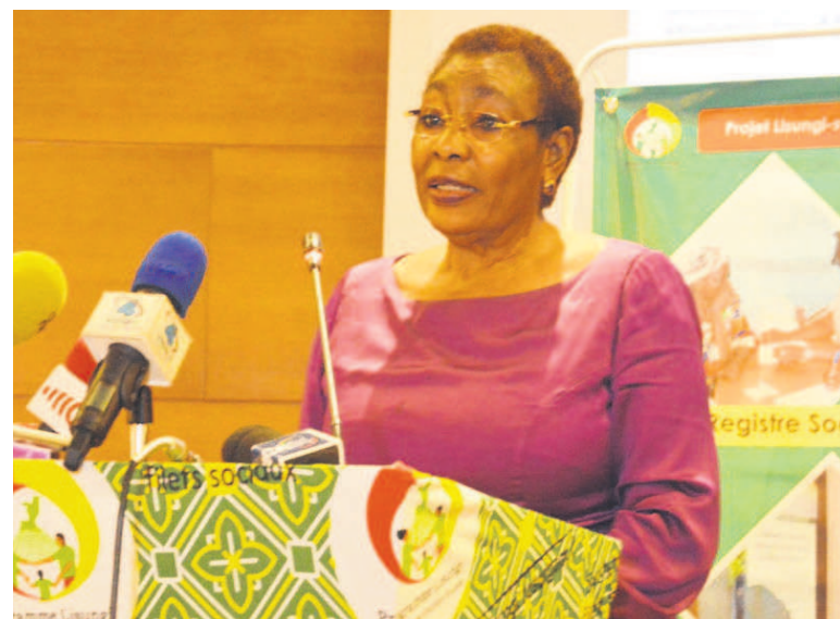
La ministre des Affaires sociales et de l'action humanitaire en conférence de presse