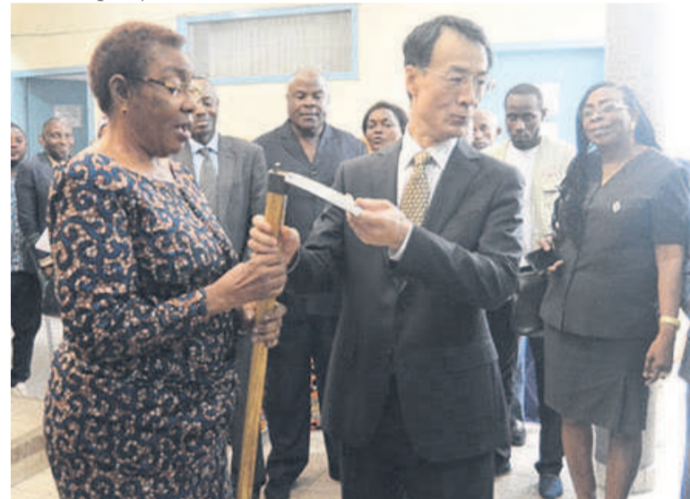
La ministre recevant un échantillon du don des mains de l'ambassadeur de Chine au Congo

Pour sa part, la ministre des Affaires sociales et de l'action huma-