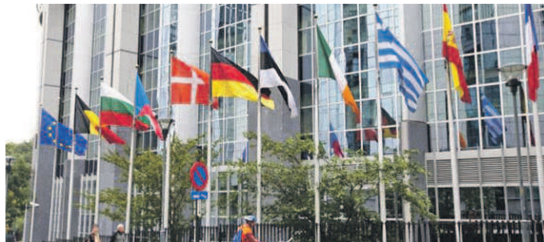
Le siège de l'Union européenne

Le tribunal de l'Union européenne (UE) a rejeté, le 26 mars, le premier recours introduit par huit proches de l'ancien président de la République, Joseph Kabila, sanctionnés en mai 2017 par le Conseil de l'UE pour « entraves à l'organisation des élections » et « graves violations » des droits de l'homme. Le verdict rendu a démonté tout l'argumen-