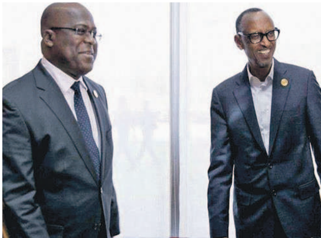
Félix Tshisekedi et Paul Kagame à l'Africa CEO Forum

Après les drames des deux dernières décennies, le propos n'aura pas laissé insensible l'auditoire en quête d'opportunités d'affaires dans cette zone stratégique du continent. Evoquant les crises qui continuent de fragiliser la région, Paul Kagame a insisté sur les solutions à trouver pour amener la stabilité. « Ces tragédies se sont déroulées dans cette région depuis de nombreuses années et font partie de notre histoire. Nous en avons fait le deuil et nous allons trouver des