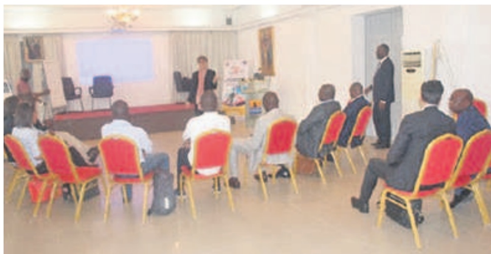
Une vue de la salle pendant la formation