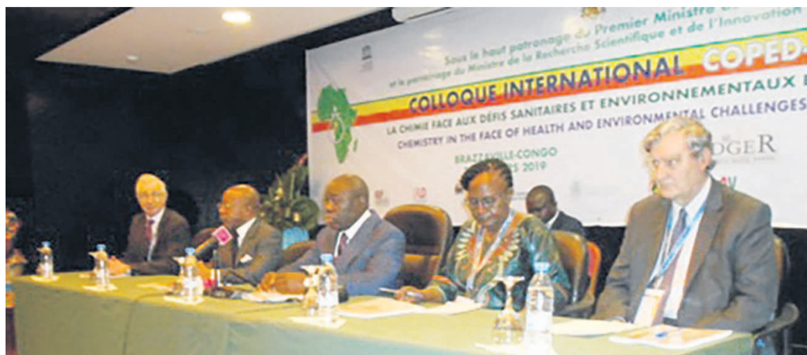
Le présidium lors de l'ouverture du colloque.

Les intoxications non intentionnelles ont occasionné cent six