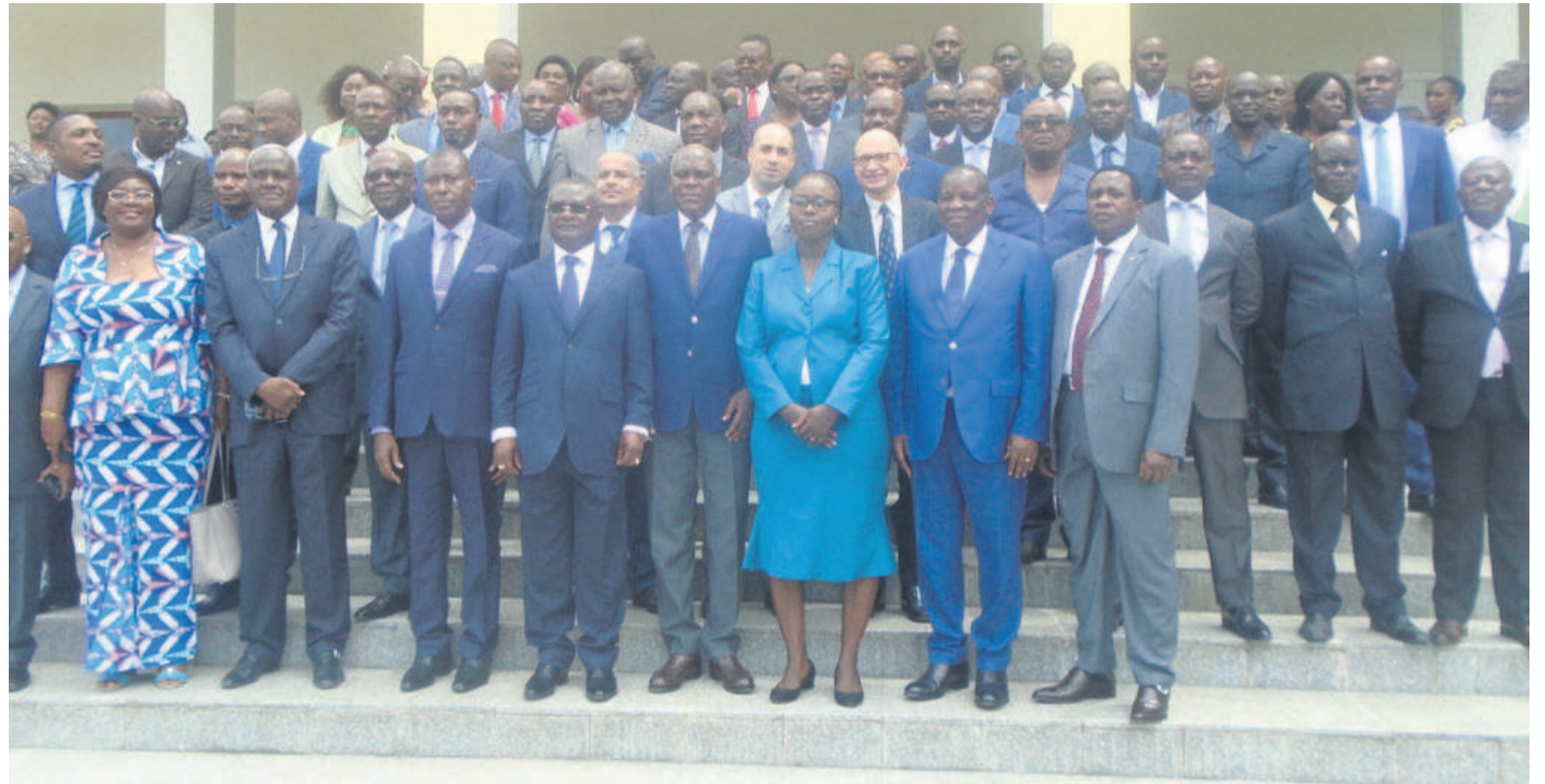
Les membres de la CNDH et les invités en photo de famille, le 27 mars

Ce document prévoit quelques innovations en son préambule, en vue de l'adapter aux dispositions des articles 214, 215 et 216 de la Constitution du 25 octobre 2015, qui confère au CNDH la qualité d'organe de suivi de la promotion et de la protection des droits de l'homme. Ces innovations concernent, entre autres, le nombre des sous-commissions spécialisées qui vont dorénavant passer à cinq, au lieu de quatre comme cela était le cas au cours du mandat passé. Il s'agit en effet, des sous-commissions droits civils et politiques ; droits économiques, sociaux et culturels ; droits des peuples ; équité et genre et la sous-commission