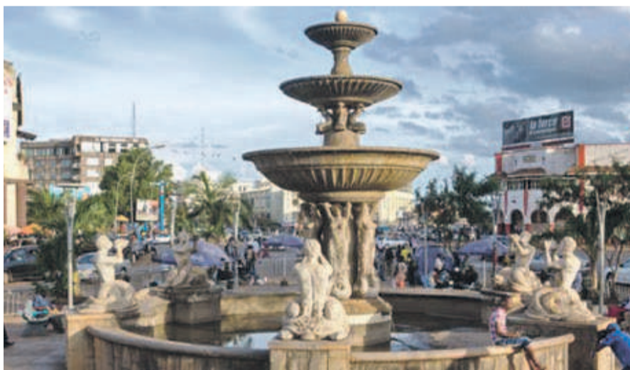
La ville de Lubumbashi

A en croire l'Institut de recherche en droits humains (IRDH), qui avait déploré cette situation dans certains de ses bulletins électroniques et qui a relayé cette décision de l'autorité provinciale, l'Etat usera de son autorité d'arbitre, par l'entremise du gouverneur de la province. Cette association a assuré que les entreprises incriminées seront représentées, lors de l'enquête, par leurs administrateurs directeurs généraux et directeurs