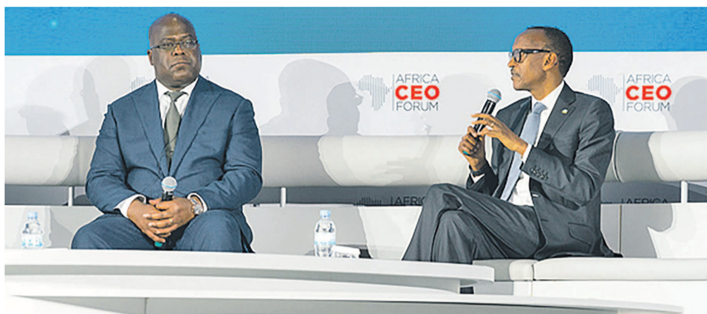
Félix Tshisekedi et Paul Kagame à l'Africa CEO Forum à Kigali