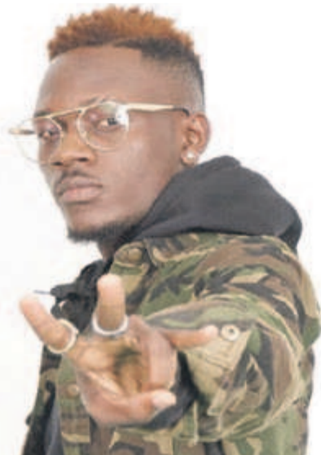
Le rappeur Big Tyger

«Black Viking 2» est une œuvre musicale invitant au voyage. La rencontre avec d'autres cultures, d'autres mœurs et d'autres peuples apporte toujours des retombées bénéfiques. Pour ce faire, le rappeur Big Tyger parcourt actuellement l'Afrique à la découverte d'autres sonorités et d'autres tempos toujours enrichissants dans le métissage culturel. Lors de ce périple transafricain, neuf pays seront visités par Big Tyger qu'accompagnent cinq autres artistes musiciens.