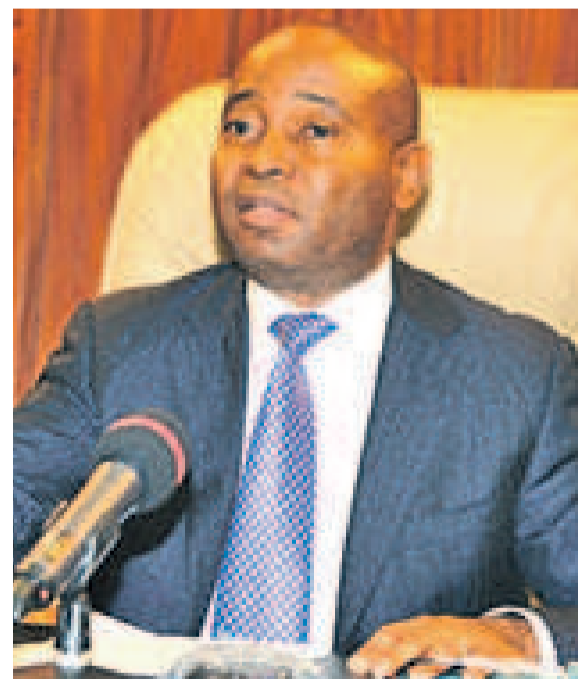
Déogratias Mutombo, gouverneur de la Banque centrale du Congo

La Banque centrale du Congo (BCC) a apporté un éclairage sur l'évolution des principaux paramètres macro-économiques à la date du 28 février. Globalement, l'autorité monétaire a rassuré du maintien de tous les dispositifs actuels de sa politique monétaire, à l'exception du taux de croissance qui affiche une légère baisse dans sa nouvelle projection. Toutefois, par rapport à l'exercice passé, le taux projeté marque une certaine hausse si l'on compare avec les 4,1 % de 2018. Il devrait s'établir, cette année, à 5,2 %