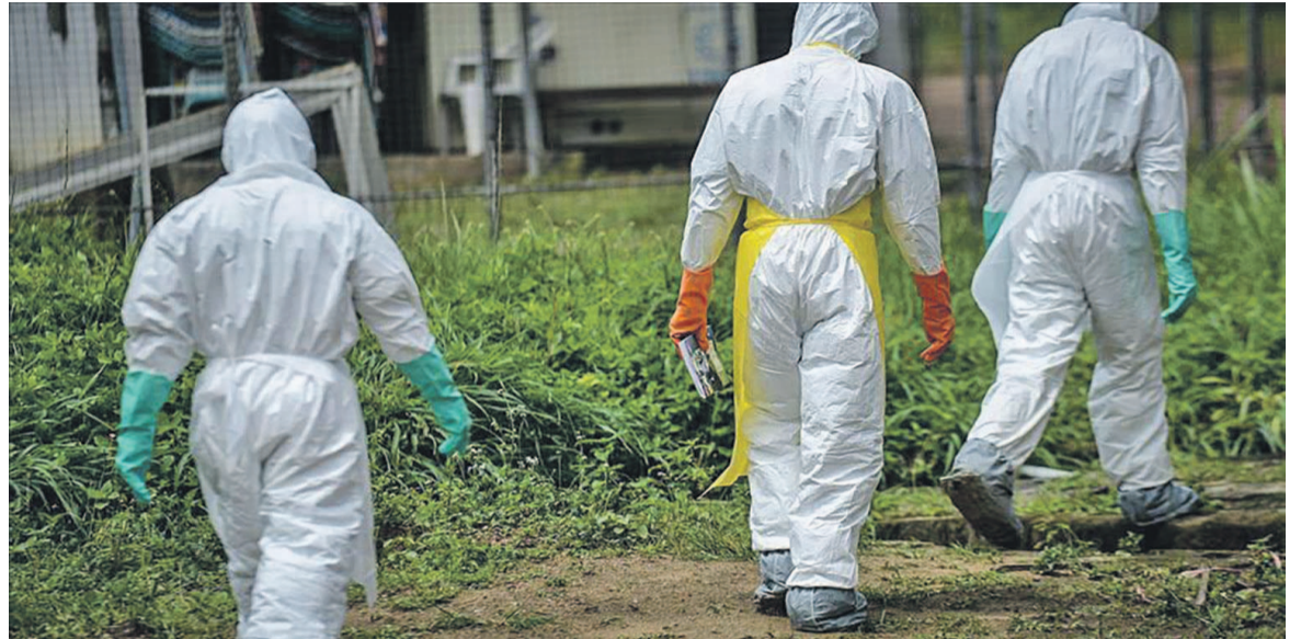
Une équipe des experts sur le terrain

À la suite des attaques contre les centres de traitement de la maladie de Katwa et Butembo, la coordination avait lancé des échanges communautaires dans plusieurs zones de santé, afin d'inviter la communauté à partager ses préoccupations et suggestions par rapport à la conduite de la riposte.