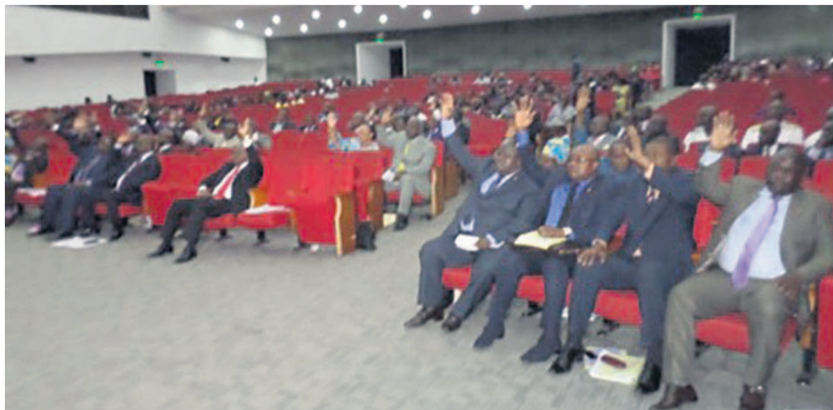
Les sénateurs votant la loi

La chambre haute a approuvé le texte au cours de sa plénière du 30 mars, tenue à Brazzaville.