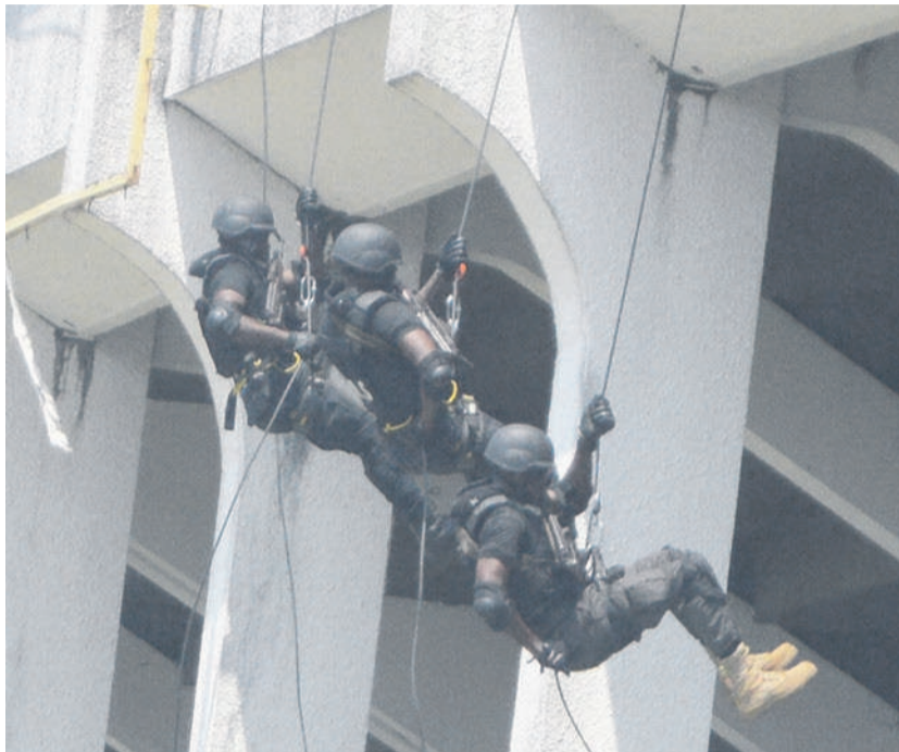
Une démonstration des éléments du GMP au stade Alphonse-Massamba-Débat