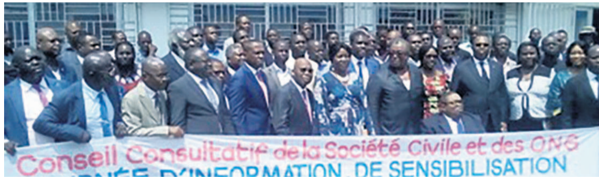
Les participants à la journée d'information sur le phénomène bébés noirs

Le 29 mars à Brazzaville, le Conseil consultatif de la société civile et des organisations non gouvernementales (ONG) a invité à la mobilisation de tous pour mettre fin au banditisme en milieu urbain, notamment le phénomène dit « bébés noirs ».