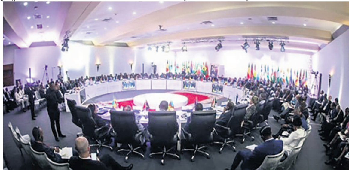
Les participants autour d'une même table