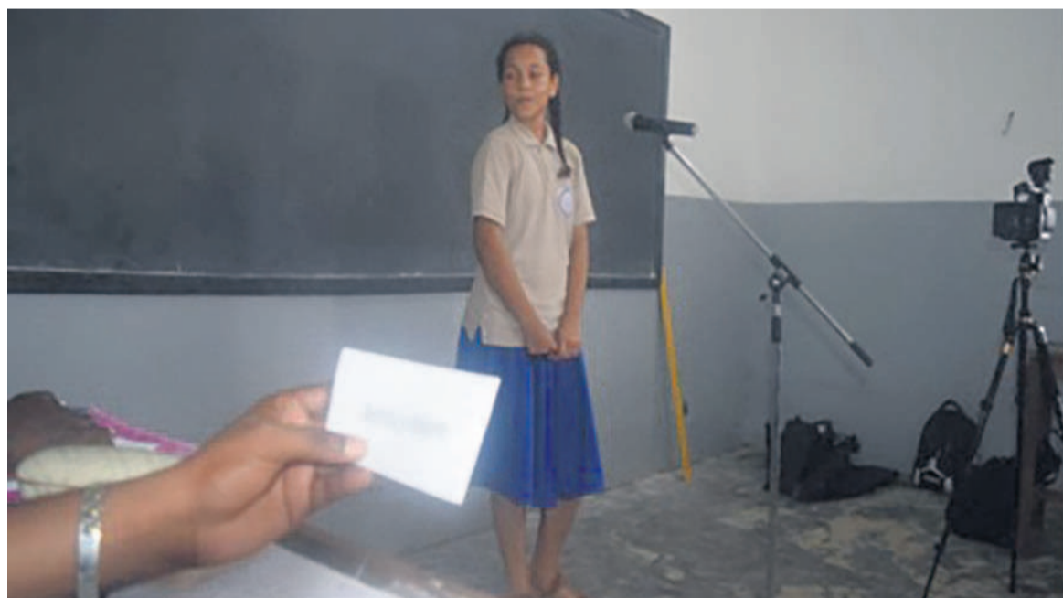
Un élève s'appropriant à épeler un mot

Les présélections ont commencé, en début de semaine, dans certains établissements scolaires de Pointe-Noire.