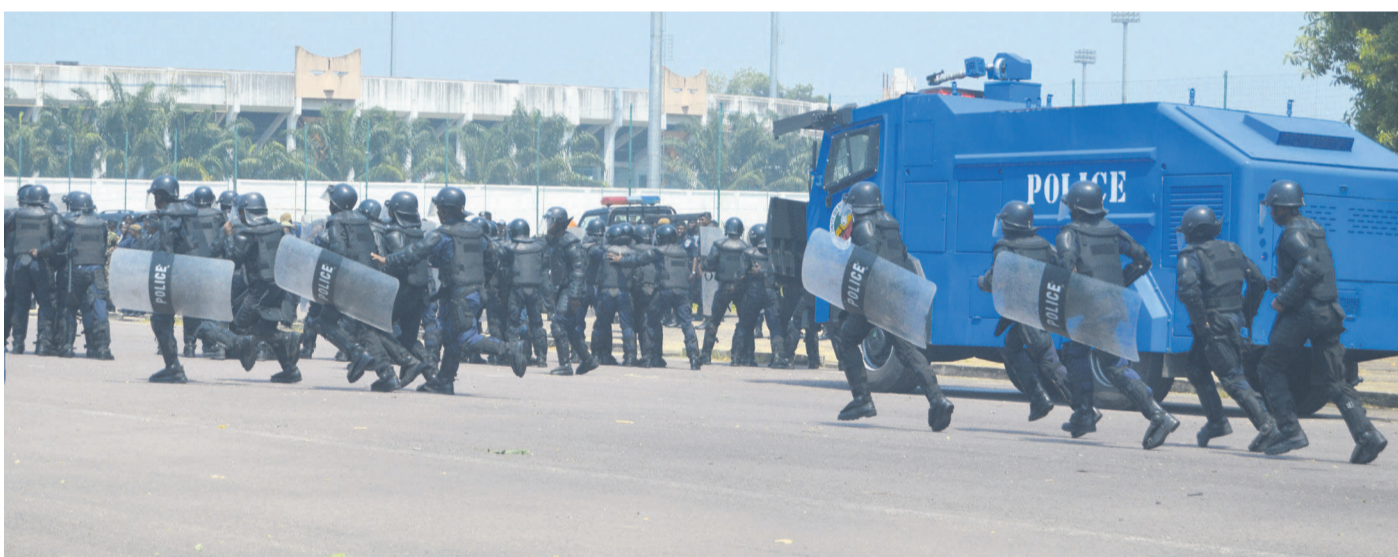
Une démonstration des éléments du GMP au stade Alphonse-Massamba-Débat