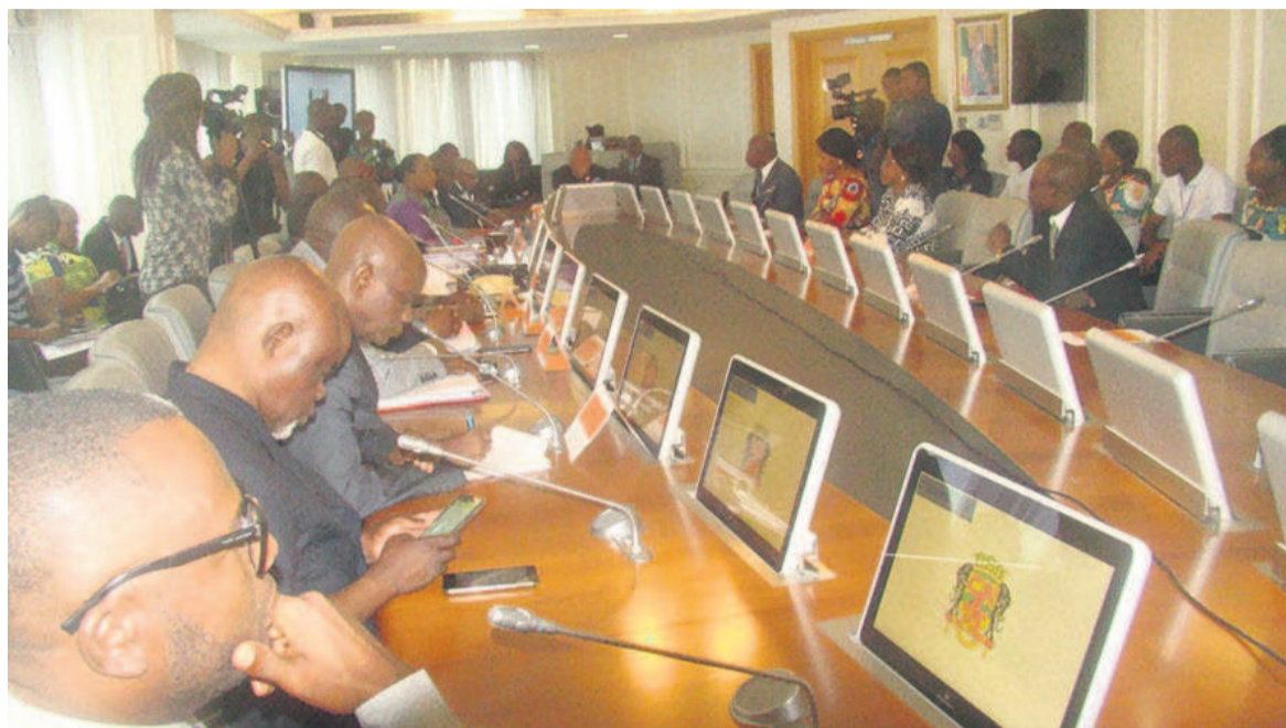
Les membres du comité de direction/Adiac

Les outils juridiques et administratifs ont été adoptés, le 29 mars à Brazzaville, au cours de la session inaugurale du comité de direction de l'établissement public à caractère administratif, doté de la personnalité morale et de l'autonomie financière.