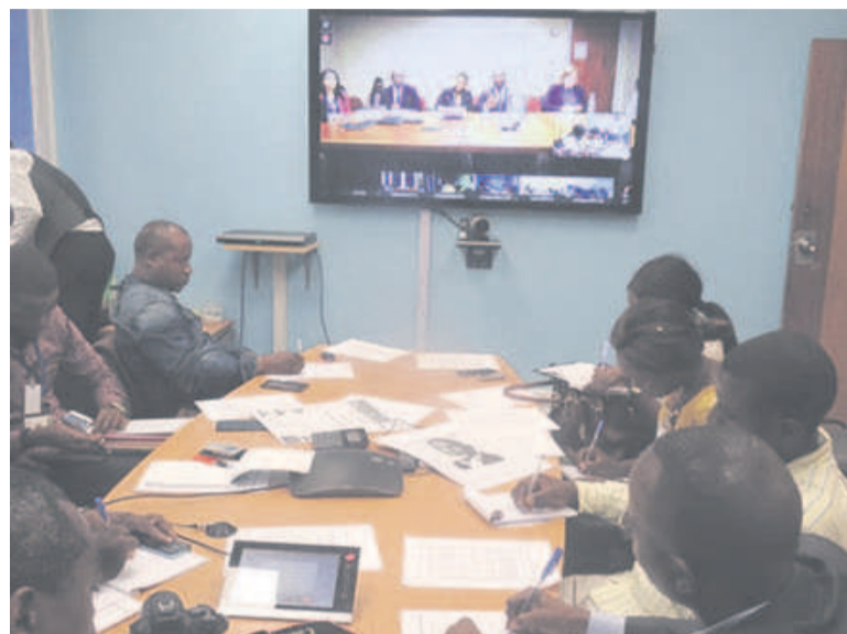
Des journalistes congolais participant à la vidéoconférence

Le document souligne le rôle clé que jouent les trois plus grandes économies du continent, à savoir le Nigeria, l'Afrique du Sud et l'Angola, dans le dynamisme économique de l'Afrique. Au Nige-