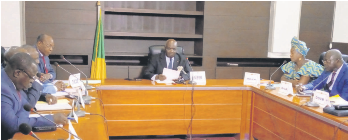
Le ministre Emile Ouosso présidant la cérémonie d'ouverture

La Commission administrative paritaire (CAP) des agents et contractuels de l'Etat en service au département ministériel a ouvert ses travaux, le 5 avril à Brazzaville, au titre des exercices 2015, 2016, 2017, 2018 et 2019.