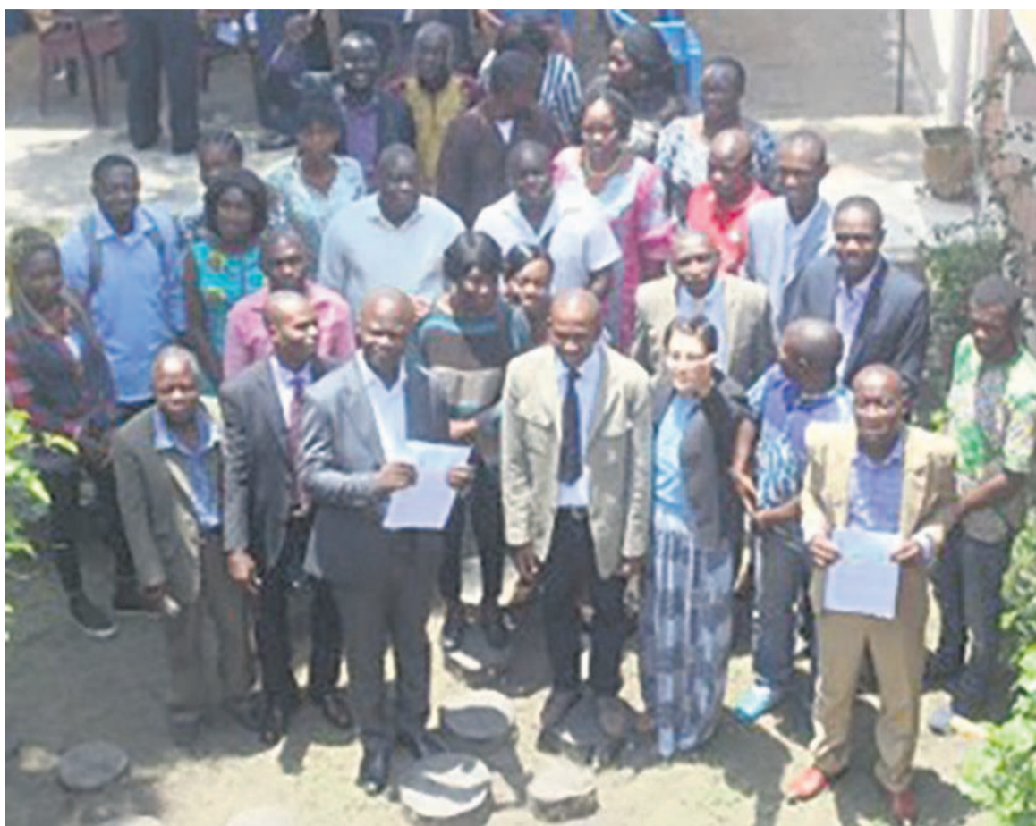
Photo de famille lors de la cérémonie d'attribution de la bourse de Renatura

Le projet du Rénaduc, intitulé « Améliorer les conditions d'hygiène des habitants de l'arrondissement Mongo Mpoukou, Vindoulou », vise l'information, l'éducation, la communication et la sensibilisation des ménages, des commerces, des églises et des écoles à la gestion des déchets ménagers. L'insalubrité dans ce quartier a été révélée par une étude menée par cette association, en octobre 2018, dans les CQ 512, 513 et 514. Douze dépotoirs sauvages avaient été recensés et seront donc prochainement nettoyés. Pour cela, il est prévu la mise en place d'un comité de gestion dans chaque zone ciblée pour organiser des journées de salubrité pendant et après le projet.