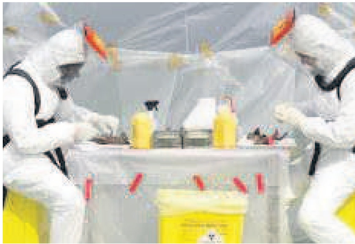
Un laboratoire Ebola

Les laboratoires jouent un rôle central dans la riposte contre l'épidémie d'Ebola. Le résultat positif d'un échantillon prélevé sur un malade va déclencher une série d'interventions autour de lui pour minimiser les risques de contamination de ses proches et de lapropagation de l'épidémie.