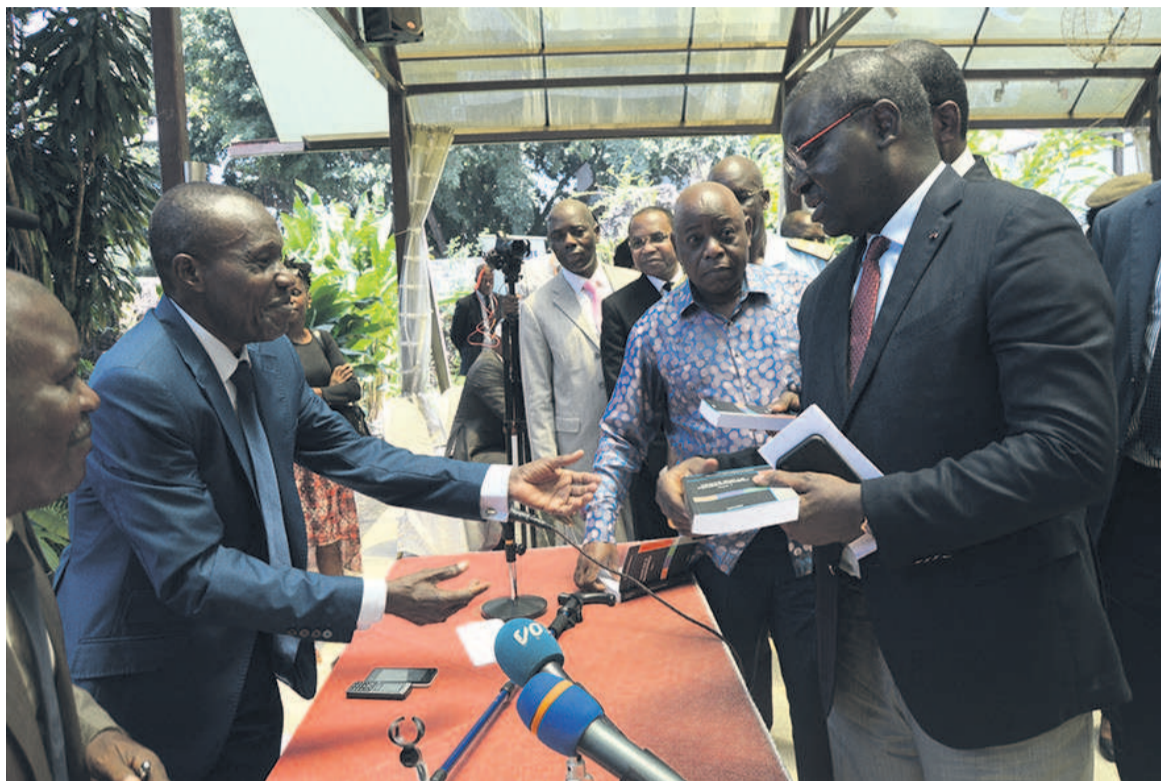
Le ministre de la Défense nationale devant l'auteur pour la dédicace

« L'ignorance alimente la méfiance. Profitant de cette occasion, nous devons apprendre à travailler sous les projecteurs car cela est une exigence dans une société démocratique qui est la nôtre »