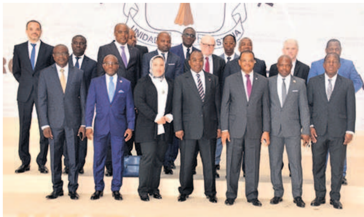
La photo de famille des administrateurs

Ainsi, la BDEAC se veut le principal acteur du développement au sein de l'espace communautaire. « Le projet de renforcement du CHU-Brazzaville apportera une solution sanitaire efficace à la population congolaise qui disposera ainsi d'une struc-