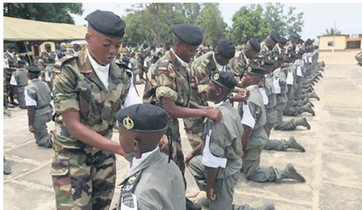
Des élèves sous-officiers d'active

Des élèves sous-officiers d'active de la quinzième promotion ont suivi un stage pour améliorer leurs connaissances. L'une des phases de celle-ci a porté sur la formation élémentaire toutes armes, ponctuée de deux tests chevilles, un bivouac couplé à un exercice de synthèse et un raid de 67 km à pied sur l'axe Etoro-Ongoni-Inkouélé-Ntsou-Gamboma.