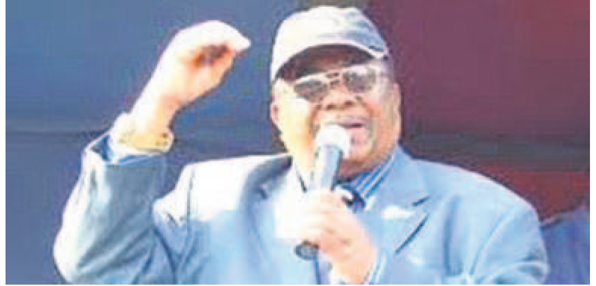
Gabriel Kyungu wa Kumwanza

Par la voix de son président national, Gabriel Kyungu wa Kumwanza, la formation politique, au départ proche de la coalition électorale Lamuka, fait observer que Félix Tshisekedi, le seul président de la République reconnu, mérite un appui afin de «mettre fin à toute velléité dictatoriale qui a existé dans ce pays».