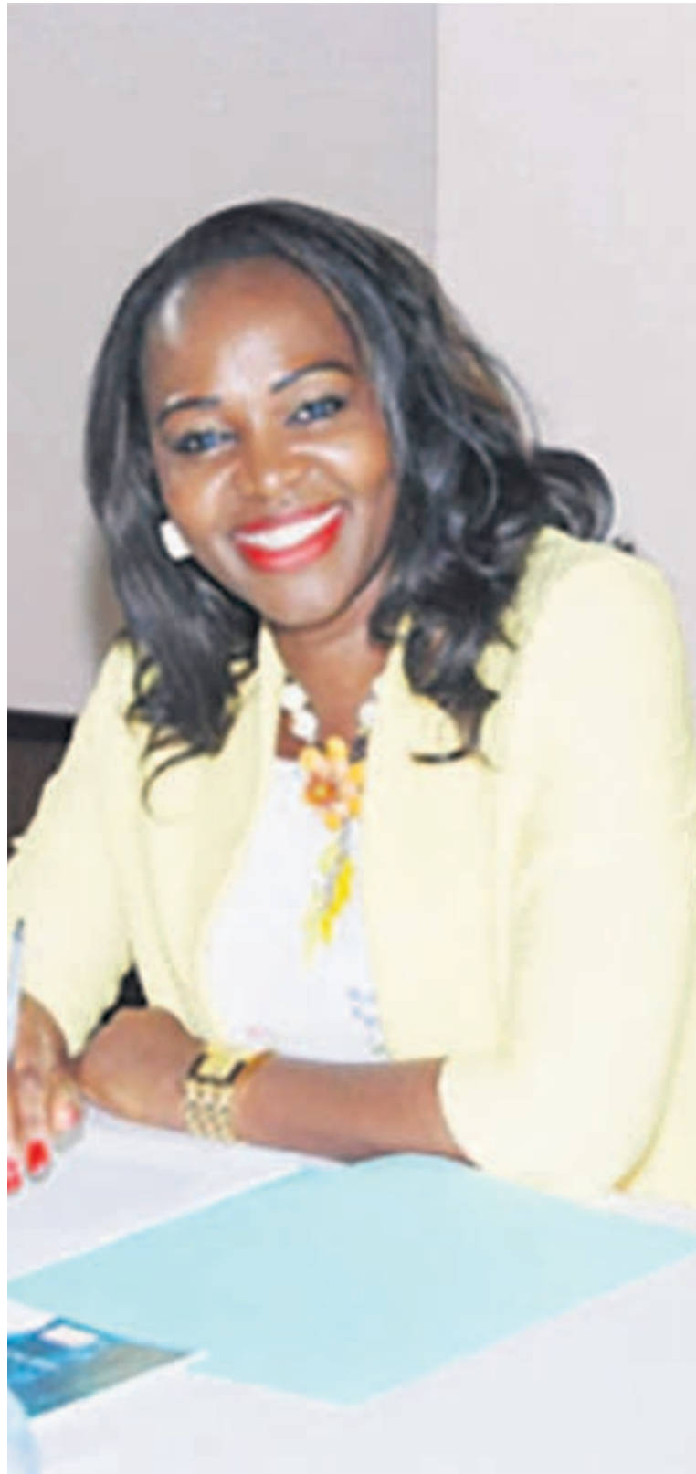
Nicole Ntumba Bwatshia

Mon rôle consiste principalement à veiller à ce que le président de la République puisse respecter la Constitution sur laquelle il a prêté serment et aussi respecter les lois du pays. Il s'agit également de veiller à la paix sociale dans la gestion des conflits juridiques quand les justiciables ne sont plus satisfaits par les cours et tribunaux. Le président de la République est le garant de la nation et je suis sa sentinelle juridique, la gardienne du temple en