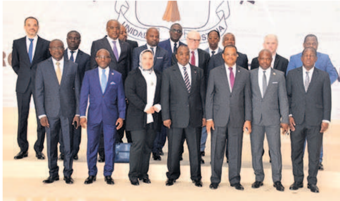
La photo de famille des administrateurs

Ainsi, la BDEAC se veut le principal acteur du développement au sein de l'espace communautaire. « Le projet de renforcement du CHU-Brazzaville apportera une solution sanitaire efficace à la population congolaise qui disposera ainsi d'une struc-