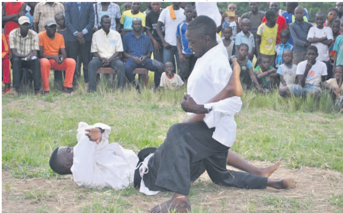
Une démonstration du close-combat

Notons que cette élection vise la poursuite de la dynamique de vulgariser la discipline dans les