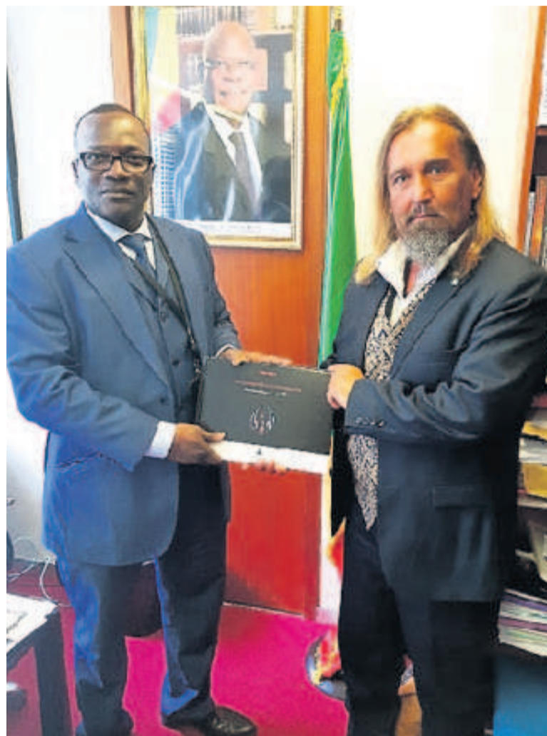
Oumar Keïta, ambassadeur permanent du Mali auprès de l'Unesco, et le Pr Beséat Kiflé Selassié brandissant le diplôme du mérite

République du Congo Ministère de l'Agriculture, de l'Élevage et de la Pêche PROJET D'APPUI AU DEVELOPPEMENT DE L'AGRICULTURE COMMERCIALE