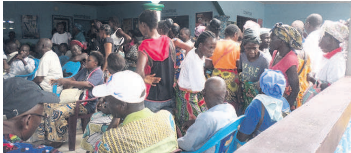
Les bénéficiaires du projet Lisungi

La prévention, la protection, la prise en charge et la promotion des personnes ou ménages vulnérables constituent le fondement de l'action sociale. Celle-ci vise donc à préserver ou rétablir les différentes catégories de couches sociales dans leur dignité, de sorte qu'elles ne soient pas des laissées-pour-compte. La situation de précarité liée parfois à l'âge, à une maladie, à un handicap ou à une catastrophe, dans laquelle celles-ci peuvent se trouver, appelle à un devoir d'assistance, à la nécessité d'intervenir en vue de les protéger. « Le projet constitue un cadre de référence du dispositif institutionnel en faveur des ménages et groupes vulnérables », a fait savoir la ministre des Af-