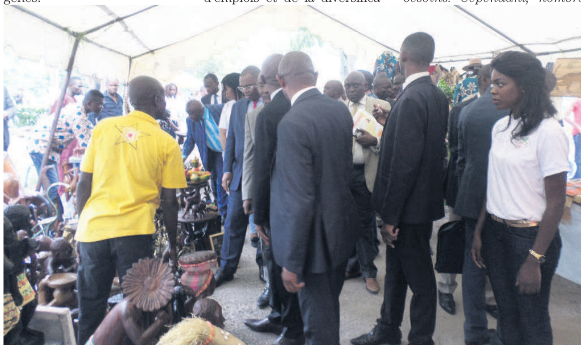
Visite des stands