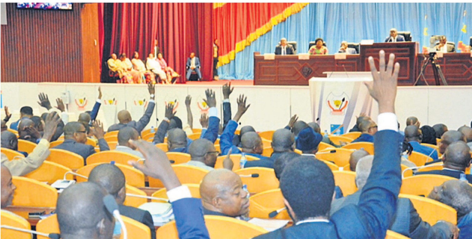
Les députés nationaux en séance plénière

N'ayant pas eu gain de cause dans la répartition des postes au niveau du bureau définitif de l'institution, l'opposition entend entreprendre des démarches auprès des instances interparlementaires africaines et internationales afin que sa re-