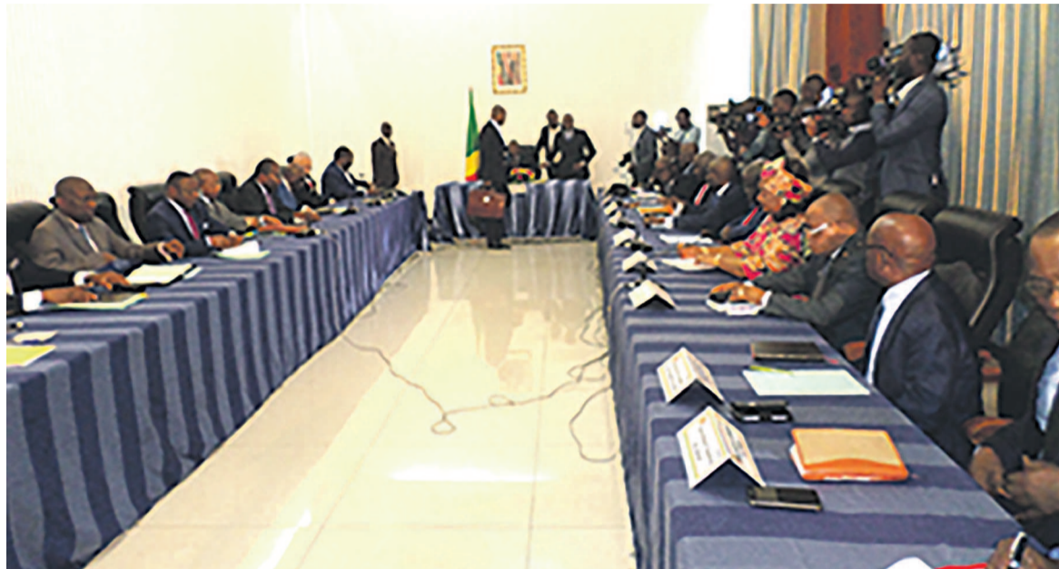
Les deux parties lors de la rencontre

Quatre points ont constitué, le 24 avril à Brazzaville, la toile de fond des échanges entre le bureau de la chambre haute, conduit par son président, Pierre Ngolo, et le gouvernement avec à sa tête, le Premier ministre, Clément Mouamba.