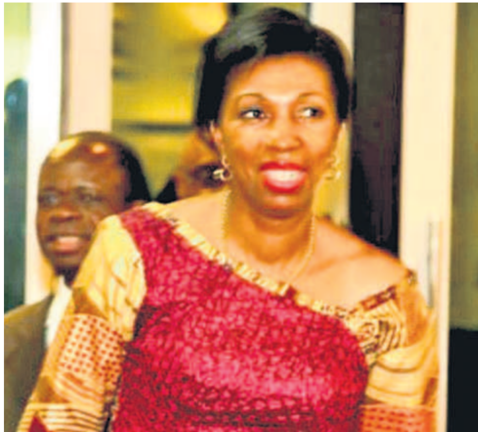
Jeanine Mabunda Lioko

Jeanine Mabunda n'avait aucun obstacle à franchir pour se hisser au perchoir de la chambre basse, la candidature de son principal challenger ayant été invalidée. Elue par une écrasante majorité (375 voix sur 383 votants), en l'absence des députés de l'opposition, l'ancienne ministre du Portefeuille mesure, d'ores et déjà, l'immensité de la tâche qui l'attend. Sans tarder, elle a décliné les priorités de son mandat, juste après le vote, dans une brève allocution de remerciement. Domaine législatif, contrôle parlementaire, diplomatie parlementaire et réexamen du social des députés nationaux, tels sont les grands axes de son action assortie d'une ferme volonté de se départir des sentiers battus, en valorisant la fonction parlementaire. Devant ses pairs totalement acquis