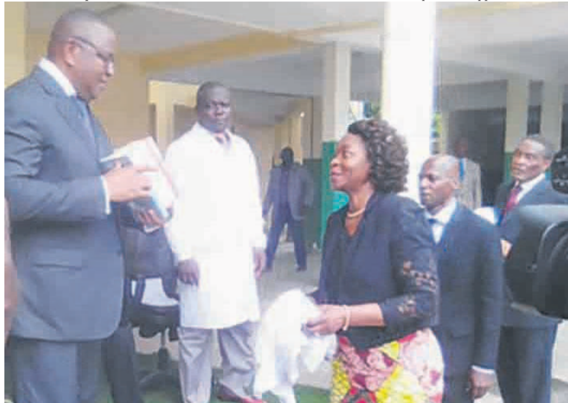
Remise officielle du don de médicaments/Adiac

Enfin, dans le cadre des relations d'échange ainsi que de coopération privilégiées, Brazzaville entretient des liens d'amitié avec plus d'une dizaine de villes, d'organisations communautaires et d'organisations non gouvernementales de développement à travers le monde.