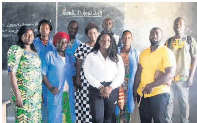
Les coordonnateurs de Tombola et les responsables de l'école

Rassemblant des jeunes de divers horizons, la plate-forme se veut être un espace de transmission des valeurs citoyennes au moment où l'on parle de plus en plus d'antivaleurs au Congo.