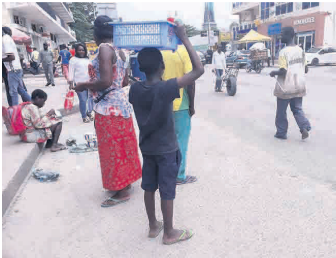
Un mineur vendant de l'eau fraîche

dangereusement même la formation de nos enfants. Ce phénomène est en train d'entrer chez nous parce que la législation n'a pas suffisamment encadré ces