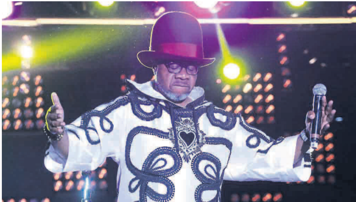
Les derniers instants de Papa Wemba au Femua 9

Alain Deshaké a invité le public à revisiter Papa Wemba des années