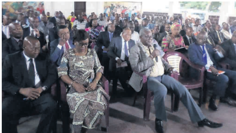
Les parlementaires de la majorité

Face à ce qui s'apparente maintenant à la guerre des clans au sein des partis de la majorité, la coordination a échangé, le 24 avril à Brazzaville, avec les parlementaires de cette plate-forme.