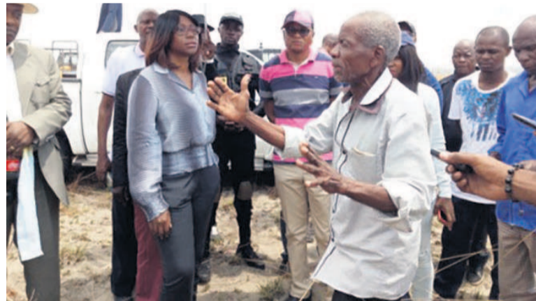
Un habitant faisant un commentaire, devant le maire de Kintélé, sur la zone d'occupation du cimetière municipal

La présidente du conseil municipal, députée-maire de la localité, Stella Mensah Sassou-N'Guesso, est allée constater, la semaine dernière, le niveau d'avancement des travaux.