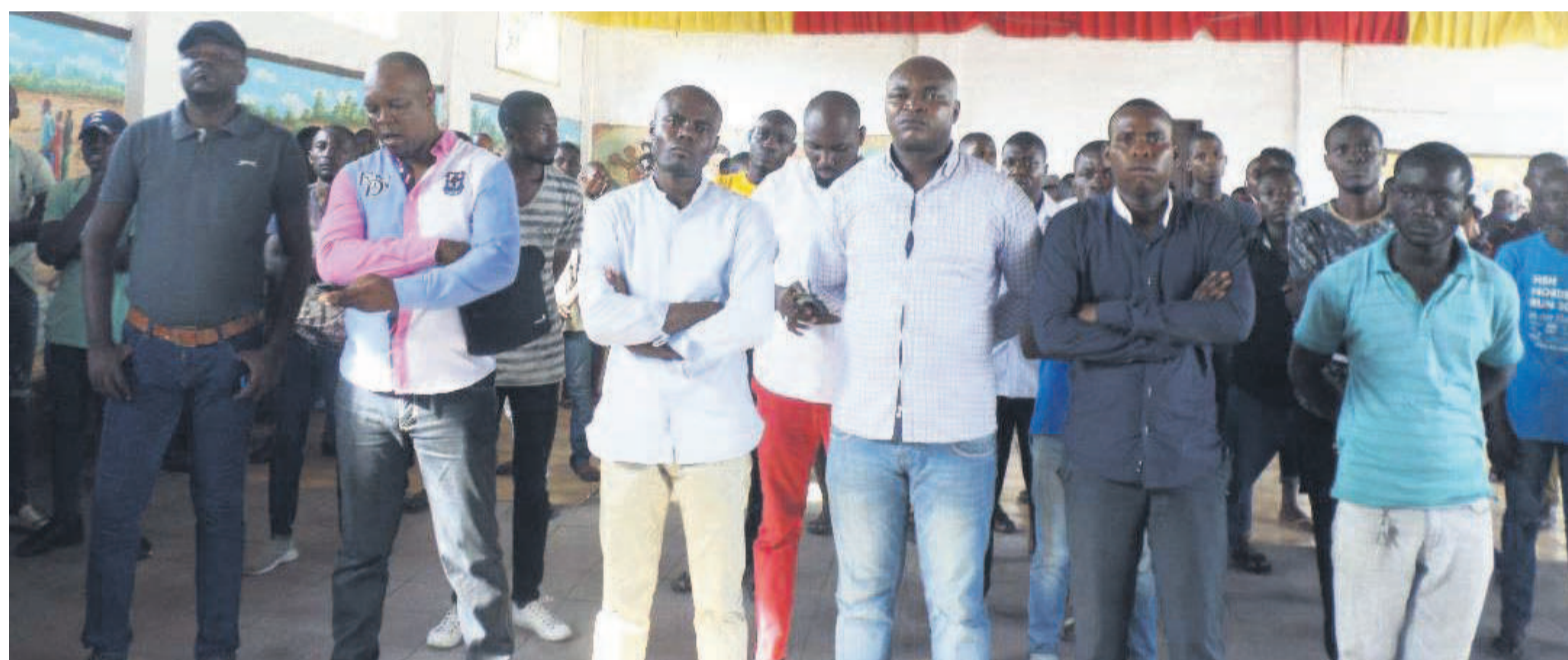
Une vue des membres de la FMCAdiac