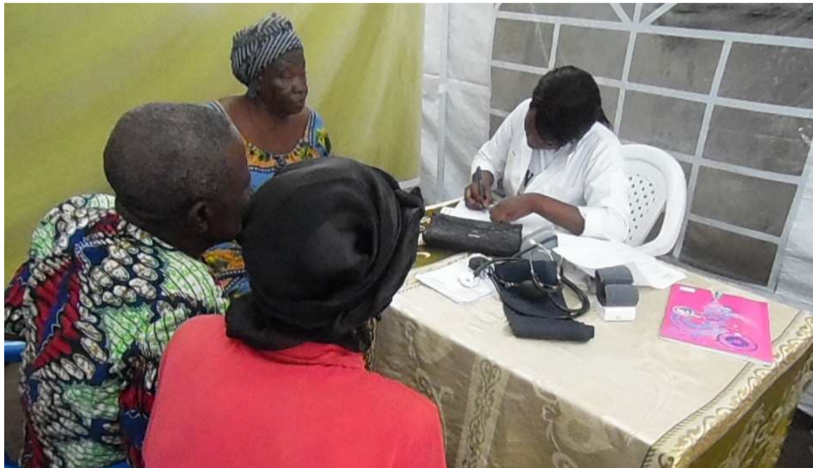
Des patients en consultation par des services intégrés de lutte contre le paludisme », a déclaré la ministre de la Santé et de la population. Cette année, la Journée mondiale de lutte contre le paludisme a été célébrée sur le thème « Zéro palu ! Je m'engage ».

Les initiatives du Congo dans le cadre de la lutte contre cette maladie lui ont valu d'être éligible au Fonds mondial de lutte