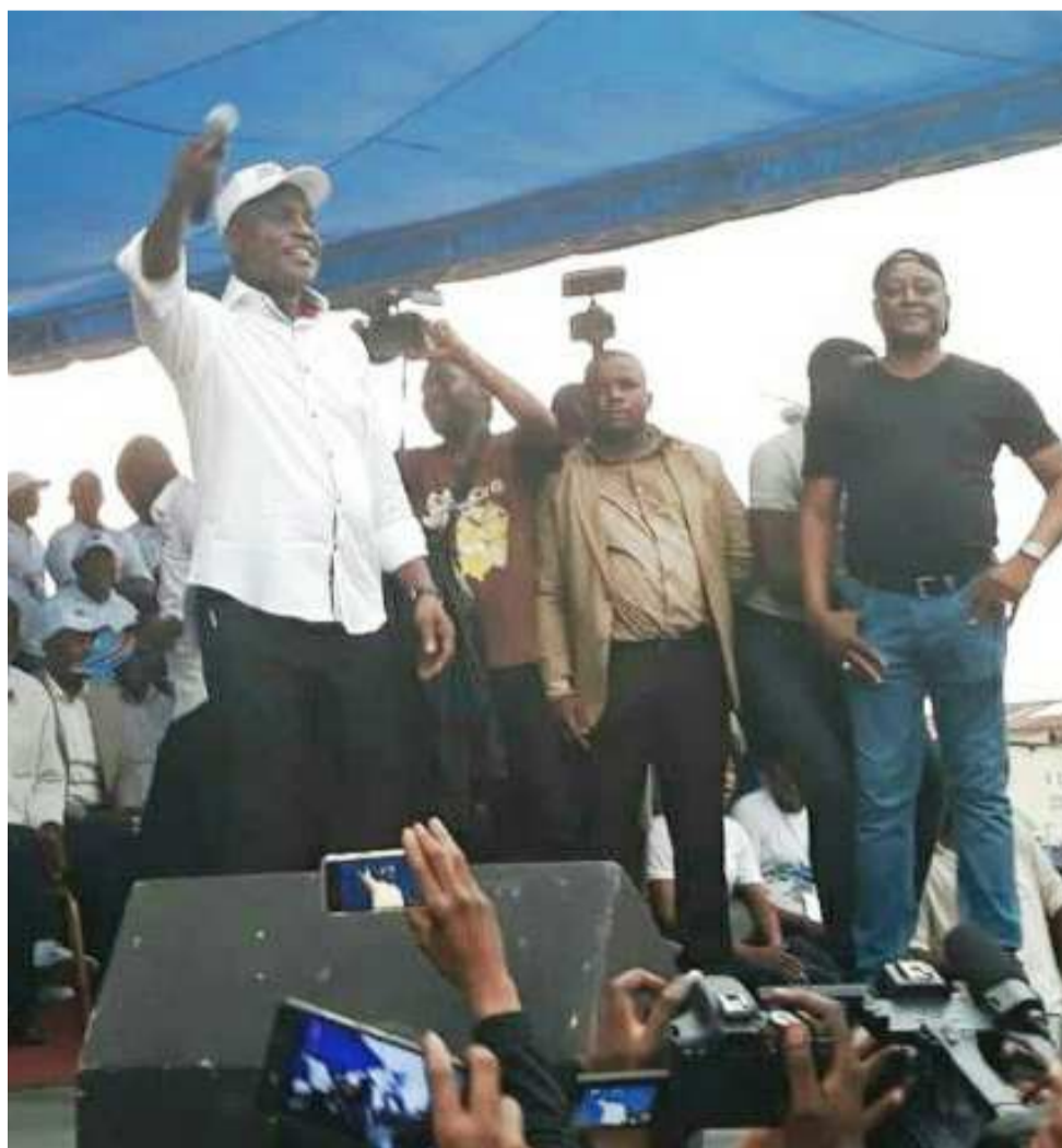
Une attitude de Martin Fayulu pendant le meeting

« Nous nous entendons pour dire à notre frère Félix de démissionner. Qu'il parte, qu'il arrête avec les bêtises », a-t-il lancé, non sans mettre en exergue certaines faiblesses et failles qui, selon lui, caractérisent la gestion du pays de l'actuel chef de l'Etat. A l'en croire, il aurait « dépensé tout le budget annuel de la présidence en trois mois ». Et de poursuivre : « Il n'y a pas de Premier ministre après quatre-vingt-quatorze jours de gouvernance. Il n'y a pas de gouvernement. Cela veut dire, mes frères, que nous n'avons rien dans ce pays, la RDC (...) ».