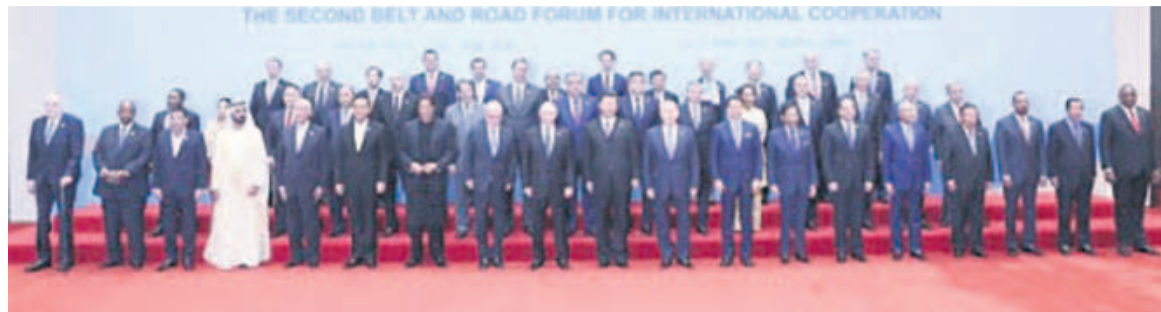
La photo de famille des chefs d'Etat et représentants des pays membres de la ceinture et la route

Cette année, les dirigeants venus de quarante pays d'Afrique et d'ailleurs ont atteint un consensus important sur un large éventail de sujets, dont la promotion de la connectivité, le renforcement de l'alignement des politiques, l'établissement de partenariats plus étroits, la promotion du dé-