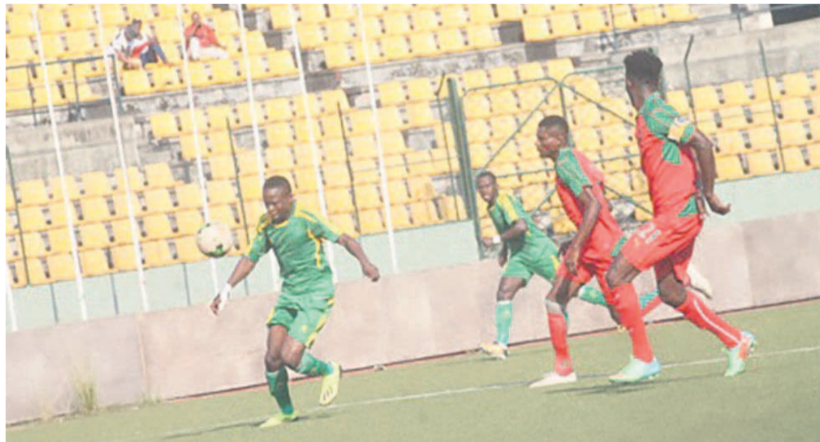
L'Etoile du Congo n'a pas pu faire mieux qu'un nul de 2-2 face à l'AS Cheminots

Les trois équipes vont désormais se donner coup pour coup pour arracher la deuxième place qualificative à la Coupe africaine de la confédération.