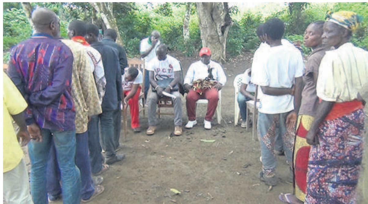
Une vue des nouveaux membres du PCT-Kibangou/DR

Quelque quatre cent soixante-deux nouveaux membres ont adhéré récemment au parti au pouvoir, dans la Fédération du Niari, précisément au comité de la sous-préfecture de Kibangou.