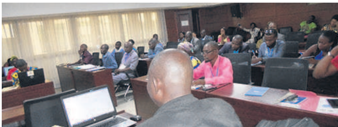
Les participants à l'atelier

En effet, parmi les objectifs spécifiques de l'atelier, figuraient l'adoption du plan de travail et le budget des activités 2019, nécessaires à l'élaboration d'un plan de développement national; la révi-