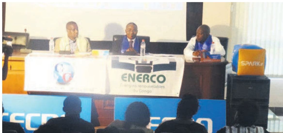
Les conférenciers face au public

Réunis le week end dernier, à Brazzaville, dans le cadre du Forum annuel, les logisticiens locaux et spécialistes du transport de carburant ont émis, auprès des