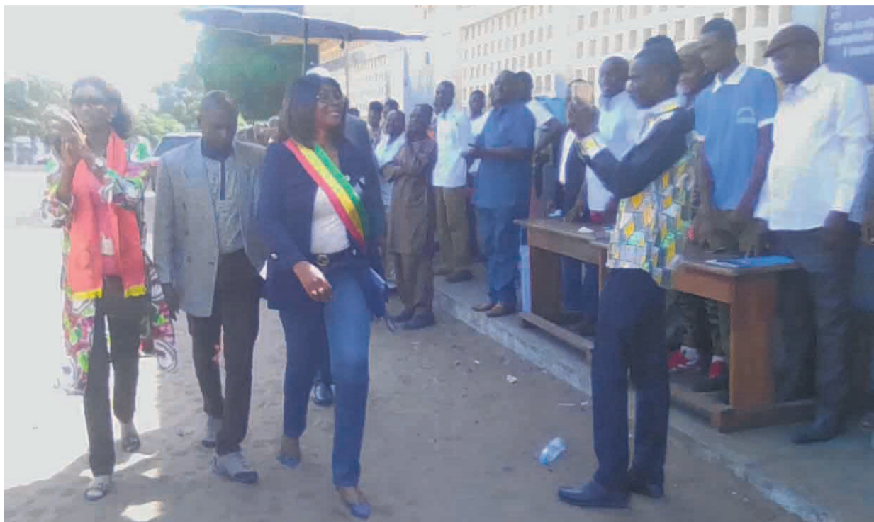
La députée de Kintélé, Stella Mensah Sassou N'Guesso, accueillie par ses mandants

L'élue de la circonscription de Kintélé à l'Assemblée nationale a édifié, le 27 avril, ses électeurs sur les affaires examinées et adoptées par les députés au cours de la 5e session ordinaire administrative, dont la ratification de l'accord de financement entre le Congo et la Banque internationale.