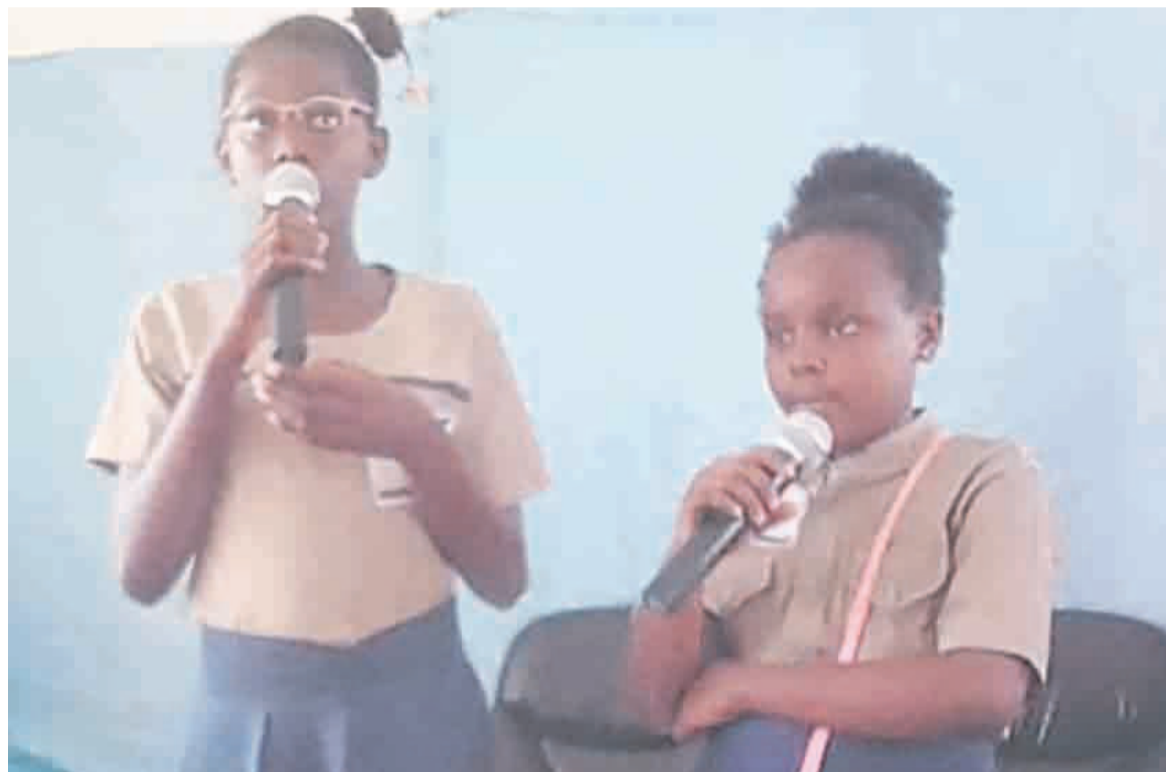
Les élèves de JPE dialoguant en chinois

Des tels propos, a-t-il espéré, doivent les requinquer. Car, pendant que le monde avance, a-t-il soutenu, les jeunes africains en général préfèrent danser et n'affichent aucune attitude responsable qui déterminera leur vie. Non seulement qu'ils dansent, mais aiment également s'ampli-