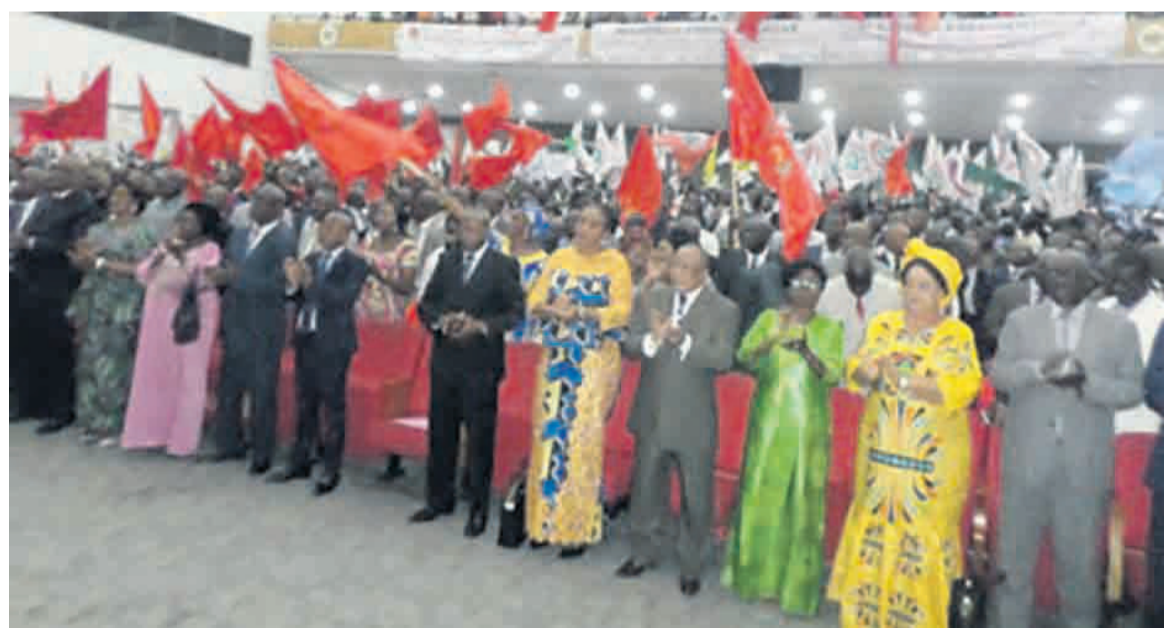
Une vue des membres de la majorité présidentielle

Le domaine des transports n'a pas également échappé aux participants aux premières universités politiques de la majorité présidentielle. Ils ont, en effet, sollicité la suppression des barrages routiers et des contrôles intempestifs. Ces pratiques sont, selon eux, sources du racket perpétré par certains agents indécents sur les véhicules de transport des marchandises et des personnes en circulation sur le territoire national. « Il s'agit d'une des causes principales du mauvais climat des affaires dans notre pays », ont-ils estimé.