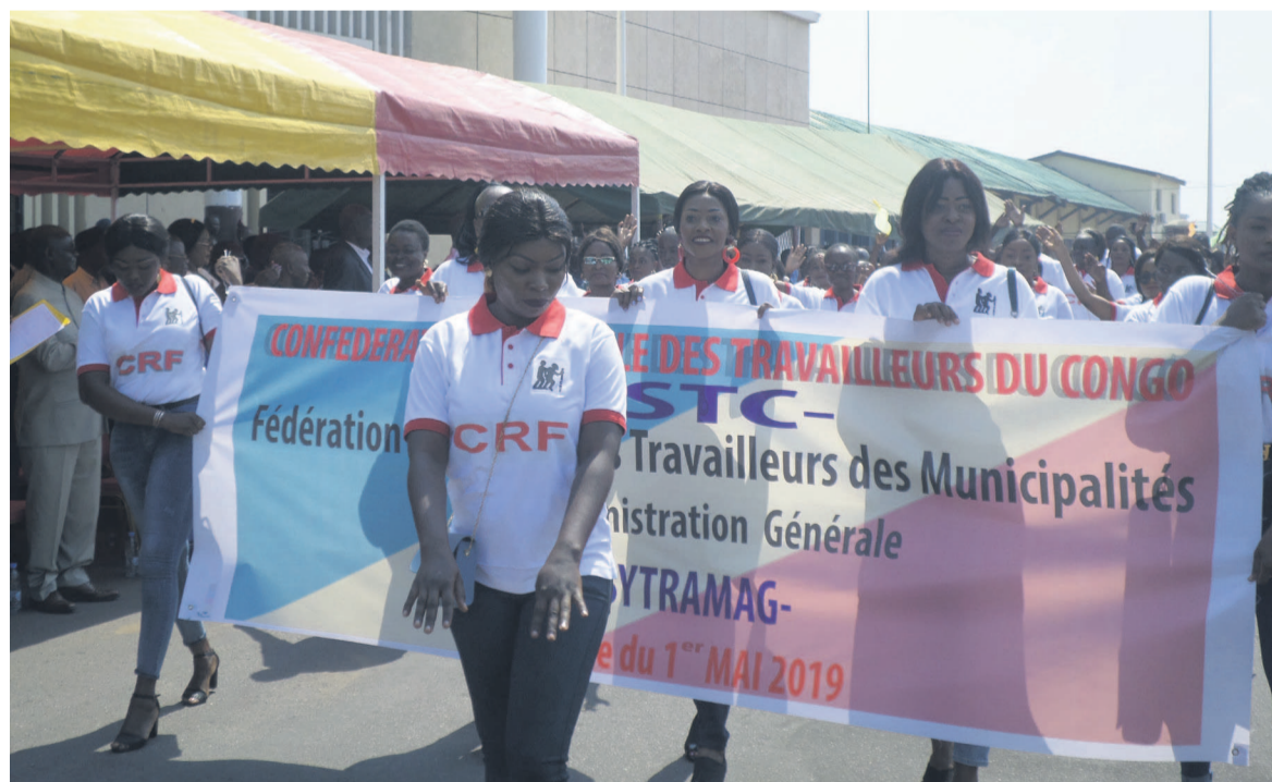
Des agents de la CRF lors du défilé Adiac

À l'occasion de la célébration de la fête internationale du travail, le gouvernement et les syndicats des travailleurs ont convenu de privilégier le dialogue et la