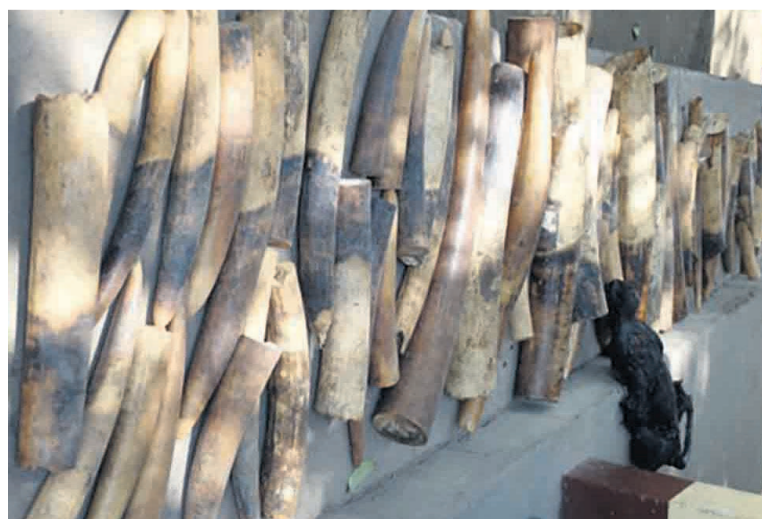
Une impressionnante saisie effectuée en janvier