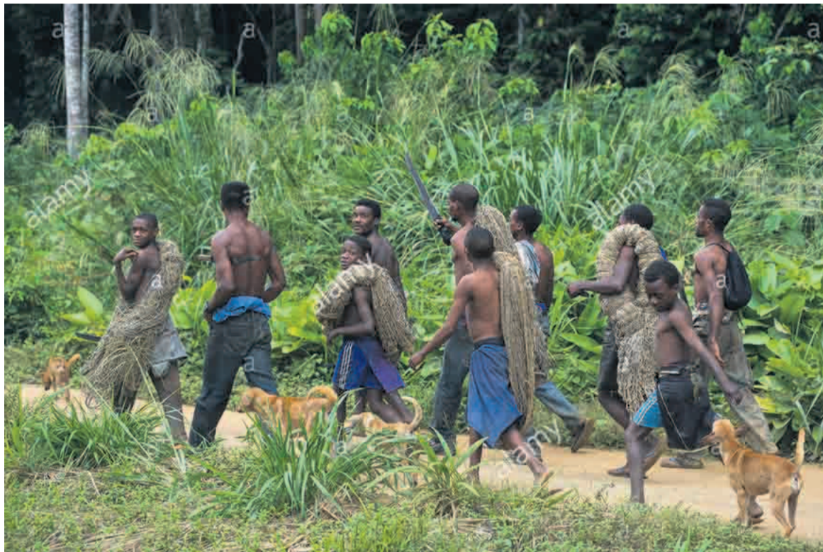
La chasse traditionnelle préserve mieux la faune

majeurs du gouvernement congolais consiste à concilier satisfaction des besoins alimentaires de la population humaine croissante, conservation d'un patrimoine biologique exceptionnel ainsi que des écosystèmes terrestres et aquatiques. « A cet égard, la menace d'extinction qui pèse sur les espèces de faune telles que l'éléphant, le lion, le léopard, le gorille et le chimpanzé, dans les pays du Bassin du Congo, est particulièrement préoccupante pour l'humanité entière », a relevé Dieudonné Sita.