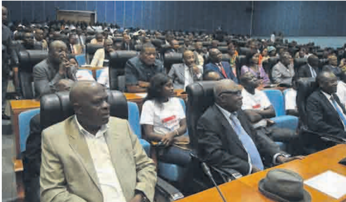
Les syndicats et le patronat à la rencontre tripartite, au Palais des congrès, le 1 er mai

Lors de cette rencontre tripartite, les centrales syndicales ont, par ailleurs, évoqué l'urgence des changements auxquels le monde du travail est ou sera confronté. Il s'agit, entre autres, du renforcement de l'espace démocratique