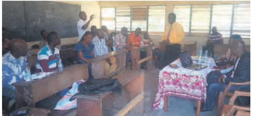
Le personnel suivant l'exposé

Parlant des origines de cette fête, l'oratrice a indiqué qu'en France, dès 1793, une fête du travail avait lieu le 1er pluviôse (en janvier) et fut instituée pendant quelques années par Fabre d'Églantine Aux États-Unis, au cours d'un congrès de 1884. Les syndicats américains s'étaient donné deux ans pour imposer aux patrons une limitation de la journée de travail à huit heures. Ils choisirent de débiter leur action le 1er mai, parce que beaucoup d'entreprises américaines entamaient ce jour-là, leur année comptable. C'est ainsi, a-t-elle poursuivi, que le 1er mai 1886, la pression syndicale permet à environ deux