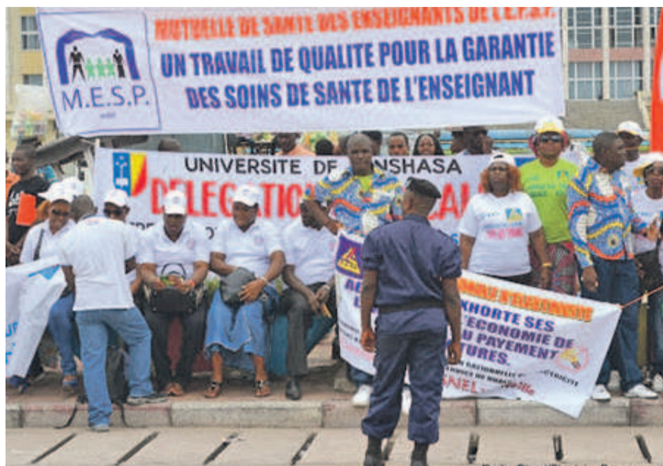
Des travailleurs congolais lors d'une manifestation

Le coordonnateur de l'Intersyndicale nationale du Congo a révélé, à l'occasion, que le taux actuel du Smig, évalué à sept mille soixante-quinze francs congolais par jour pour les manœuvres ordinaires,