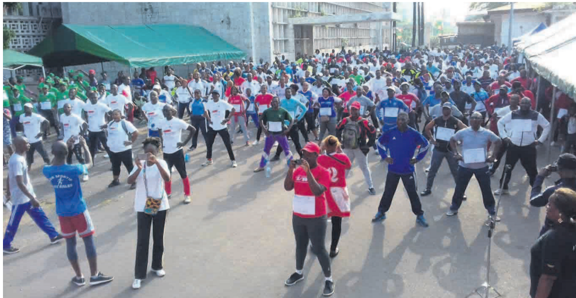
Les participants, quelques minutes avant le départ de la marche