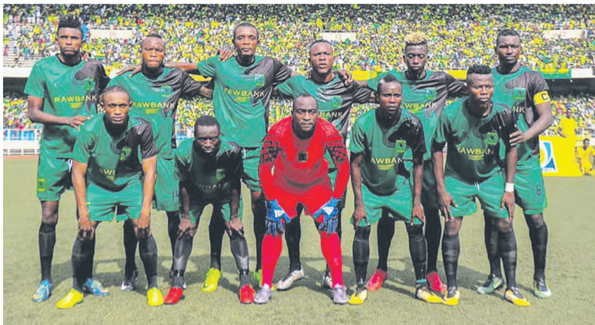
V.Club termine sa saison par une victoire sur son rival DCMP

« On a gagné par 2-1. Déjà, c'est une satisfaction. Ça faisait trois matches qu'on n'avait pas marqué de buts. On en a mis deux. On a globalement maîtrisé le match. Mais en première mi-temps, il nous manquait du rythme. Je crois qu'au niveau de la possession du ballon,