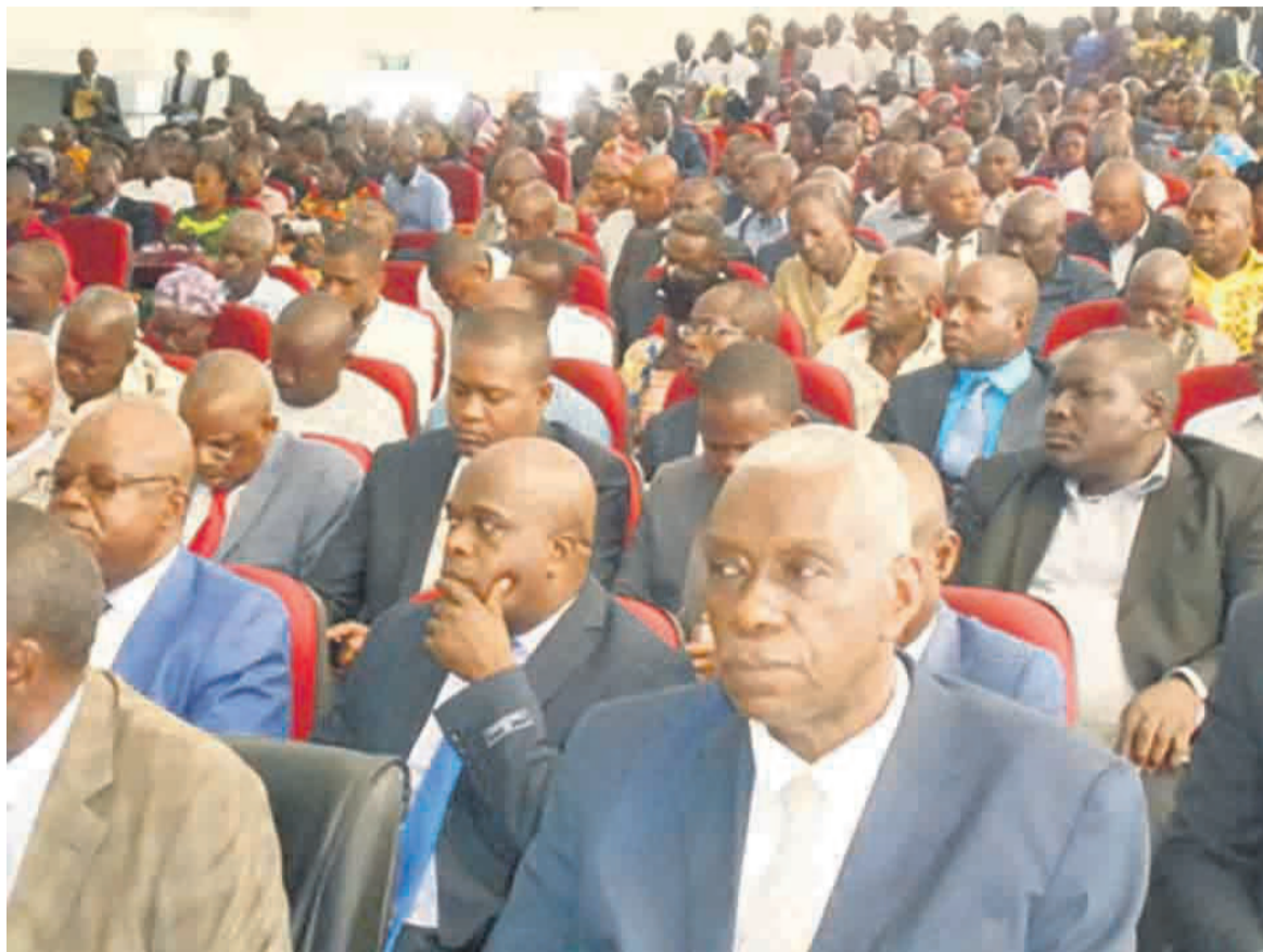
Les enseignants lors de l'ouverture de la session

Il a déploré le non-respect de l'administration scolaire par les promoteurs de ces écoles dont le comportement développe les actes d'anarchisme. Ces der-