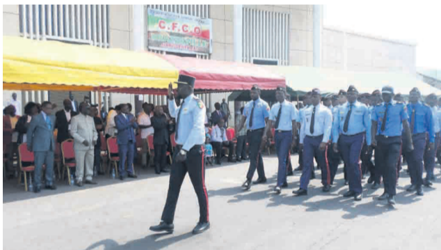
Les douaniers lors du défilé