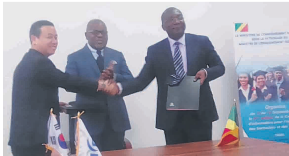
Échange de parapheurs après signature du partenariat/Adiac

Par des illustrations et des anecdotes, l'orateur sud-coréen a expli-