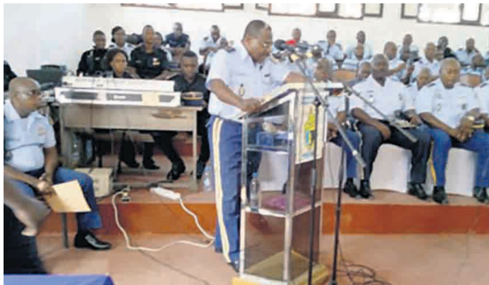
Le général de brigade, Paul Victor Moigny, pendant la clôture du séminaire

Un séminaire des Officiers de police judiciaire (OPJ), axé sur la cohérence de la chaîne judiciaire comme meilleur moyen de rendre la justice crédible, s'est tenu du 23 au 27 avril, à Brazzaville.