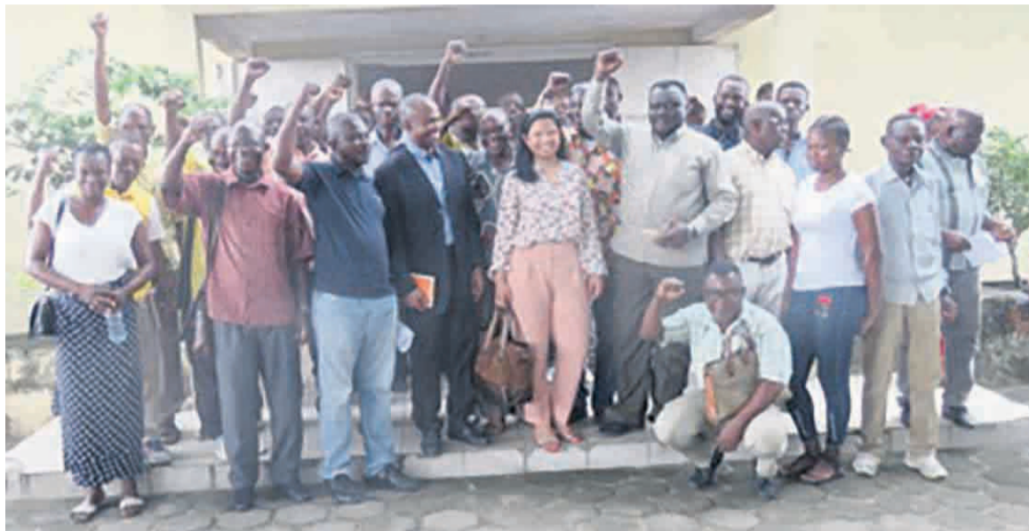
Les responsables du projet avec les habitants du quartier Tchiniambi/Adiac