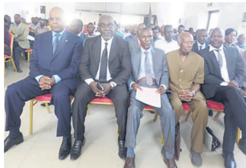
Une des participants