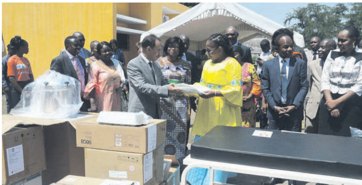
La ministre de la Santé recevant un kit des équipements d'accouchement

Après un travail de terrain réalisé par le Fnuap dans les départements de Brazzaville, du Pool et de la Likouala, une charte d'accouchement a été mise en place. Celle-ci définit des actions participatives entre les futures mamans, leurs accompagnateurs et les sages-femmes. Le même document formule une recommandation en faveur de la création d'un environnement de travail sain et sécurisé avec du matériel adapté et des équipements nécessaires à la prise en charge des mamans et des nouveau-nés. Le geste du Fnuap est donc une concrétisation des lignes directrices de ladite charte.