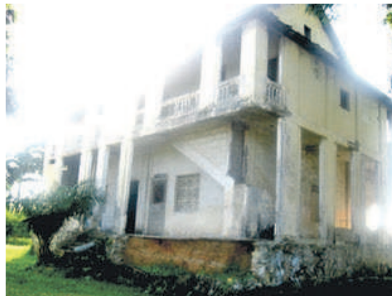
Le premier bâtiment de l'école primaire Jean-Félix-Tchicaya

La vieille bâtisse est devenue non seulement une verrue dans le paysage de l'école primaire Jean-Félix-Tchicaya