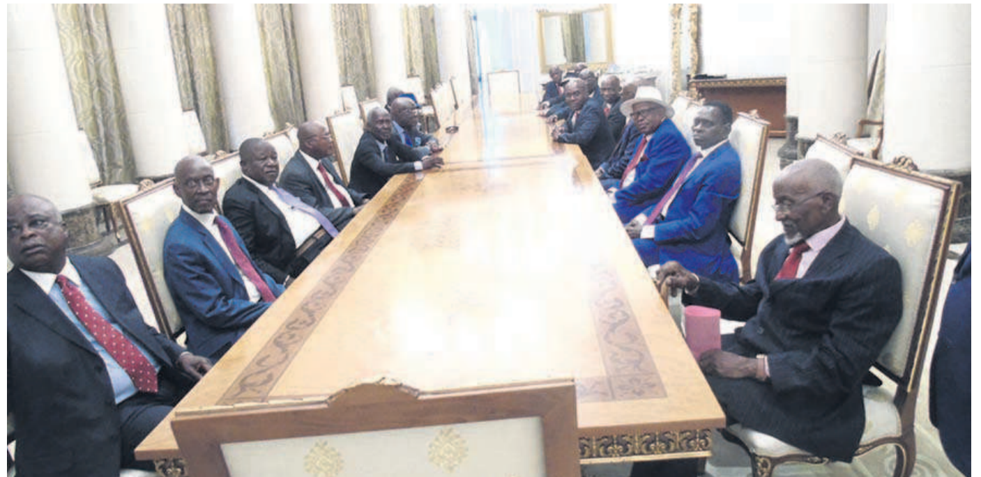
Les Bantous de la capitale avant leur audience avec le chef de l'Etat

« Ça va aller ! », a confié, vendredi, le président Denis Sassou N'Guesso aux musiciens venus lui parler de la célébration, le 15 août prochain, des 60 ans de leur groupe.