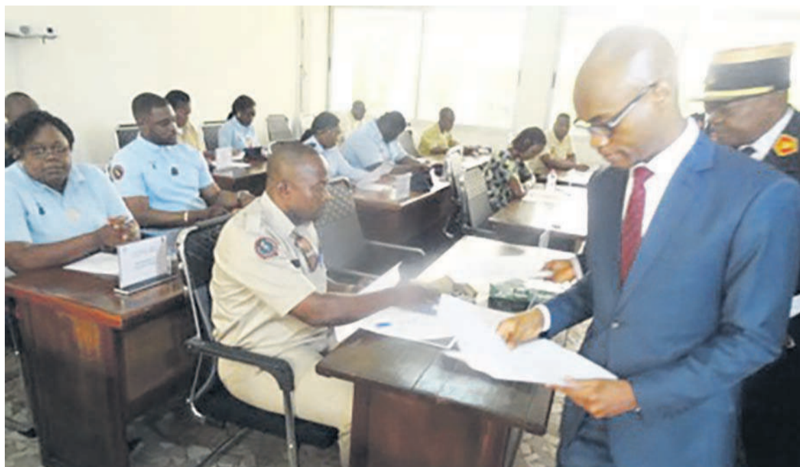
Le directeur général lançant les épreuves

Quarante-quatre agents ont passé, le 3 mai à Brazzaville, un test interne de préparation aux stages à l'étranger.