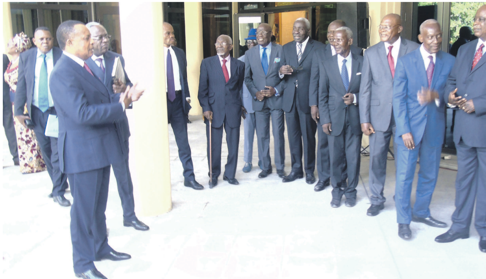
Les Bantous de la capitale lors de leur réception par le président de la République