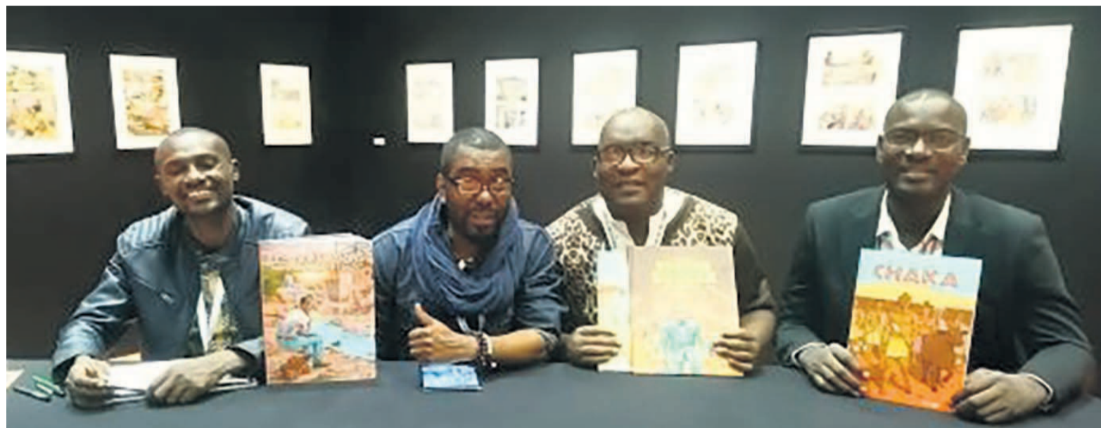
Bédéistes africains à l'honneur au Salon africain 2019

Lui-même résidant en France, il dessine le retour de l'enfant du pays, incapable d'avouer et d'assumer son échec personnel fort rempli de poncifs. Mieux encore, il interprète par ses dessins un personnage qui poursuit ses études sans cesse entamées et ratées, une intégration non