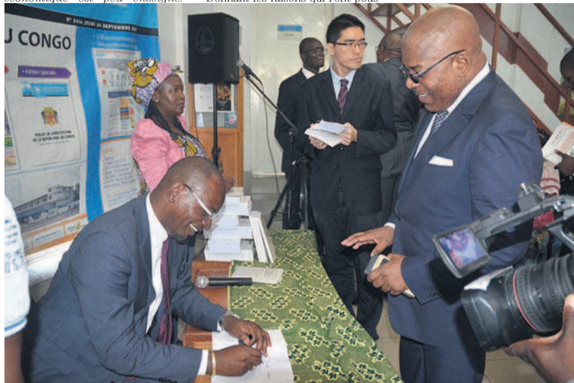
L'auteur dédicant son ouvrage